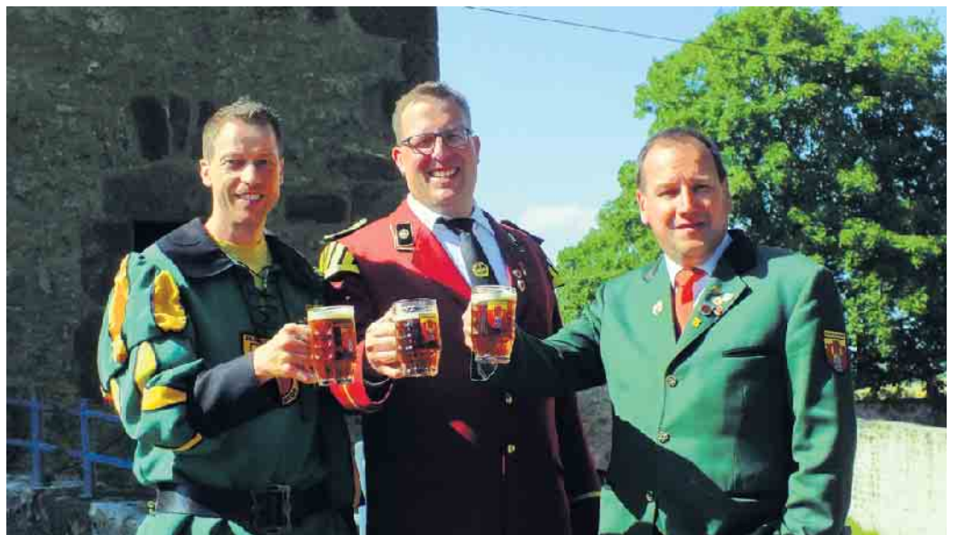
Mit dem Gemeinschaftsspiel eröffneten die Musikerinnen und Musiker aus dem Burgdorf das Festprogramm