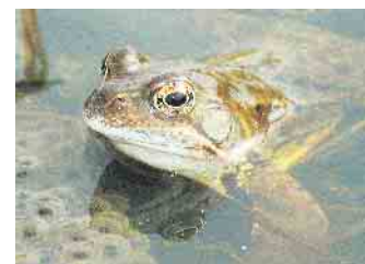
So sieht er aus, der Grasfrosch.

Ganz aktuell ist der Bau einer stationären Anlage zum Schutz von Fröschen und Kröten geplant,