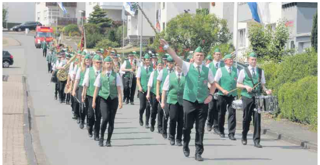
Festumzug mit dem Spielmannszug Neuenheerse auf dem Weg zum Königsschießen