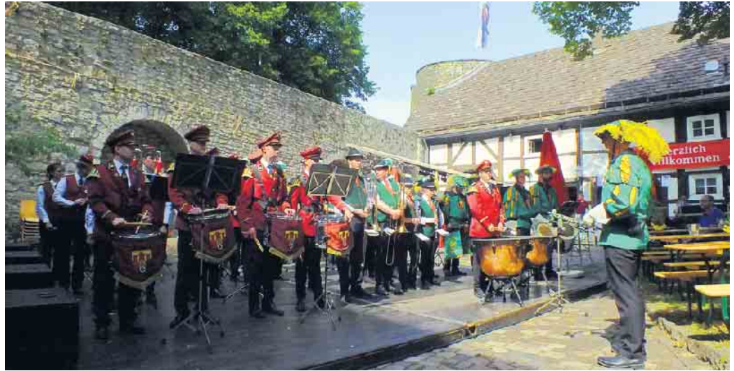
Die drei Vorsitzenden der Dringenberger Musikvereine stießen nach zwei Jahren Corona-Pause wieder auf das Burgfest an.

Einmal im Jahr lädt der Förderverein für Musik und Kultur in Dringenberg zum Feiern in und um die Burgmauern ein. Bei Traumwetter waren nach der Corona-Pause viele Gäste zum traditionellen Burgfest in die ehemalige Titularstadt gekommen, um endlich wieder gemeinsam ein paar gesellige Stunden zu verleben. Sogar aus Gütersloh-Friedrichsdorf war ein ganzer Bus mit fröhlichen Festgästen angereist. Seit fast fünf Jahrzehnten stellen die drei Musikvereine in Dringenberg - Spielmannszug, Fanfarenzug und Burgmusikanten - jeden Sommer ein buntes Programm aus Musik, Unterhaltung und guter Laune auf die Beine. Das 48. Burgfest war es in diesem Jahr. Der Startschuss zum Programm fällt stets mit dem Gemeinschaftsspiel der drei Dringenberger Musikvereine im Innenhof des ehemaligen Bischofsitzes. Die Musikerinnen und Musiker sorgen anschließend den ganzen Nachmittag über für beste musikalische Unterhaltung der Gäste. Aber auch der Duft von frisch gebackenen Waffeln, Kaffee und Kuchen zog viele Besucher in den Burginnenhof. Das Museum des Heimatvereins und der beeindruckende Gewölbekeller waren ebenfalls gut besucht. Vor der Burg hatten die Mitglieder des Altraktoren-Clubs Hohenwepel wieder ihre liebevoll restaurierten mobilen Schätze geparkt, die vor allem bei den kleinsten Burgfestbesuchern zum „Probessitzen“ beliebt waren. Dort standen auch das AWO-Spielmobil mit vielen Mitmachangeboten und die Hüpfburg der Vereinigten Volks-