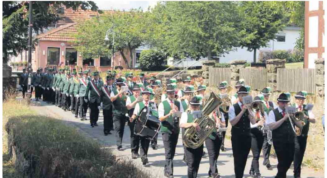
Oberdorfkompanie der Schützenbruderschaft St. Fabian und Sebastian Neuenheerse mit den Dringenberger Burgmusikanten zum Einholen der Fahnen.

Stiftsstr. - re. Johannwarthstr. - li. Taildor - Nethehalle