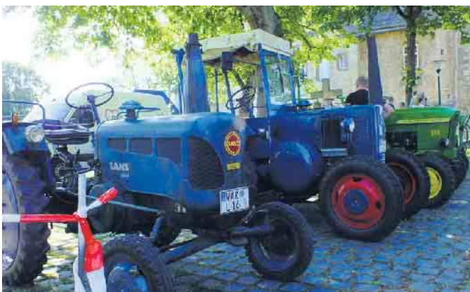
Die restaurierten Traktoren auf der Freiheit sind jedes Jahr ein Anziehungspunkt für große und kleine Burgfestbesucher