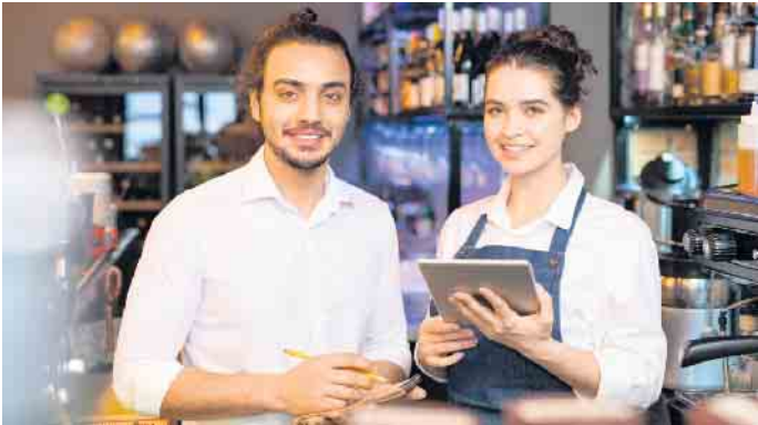
Dauert ein studentischer Job nicht länger als drei Monate beziehungsweise 70 Arbeitstage im Kalenderjahr, führt er in der Regel nicht zur Versicherungspflicht in der Kranken-, Pflege-, Arbeitslosen- und Rentenversicherung.

die maßgebende Gesamteinkommensgrenze für die kostenfreie Familienversicherung zu beachten. Diese liegt in diesem Jahr bei monatlich 535 Euro. Wird diese Grenze überschritten, kommt möglicherweise eine Versicherung in der studentischen Krankenversicherung in Betracht“, so Wehmhörer. Weitere Informationen rund ums Studium und zur Krankenversicherung während der Semesterferien gibt es in jedem AOK-Kundencenter oder online unter aok.de/nw Stichwort ‚Krankenversicherung für Studierende‘.