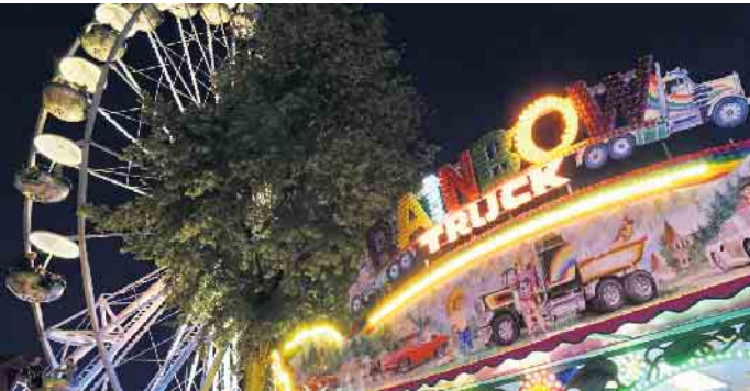
Die Kirmes bekommt in der Dunkelheit durch die Karussellbeleuchtung einen besonderen Charme.