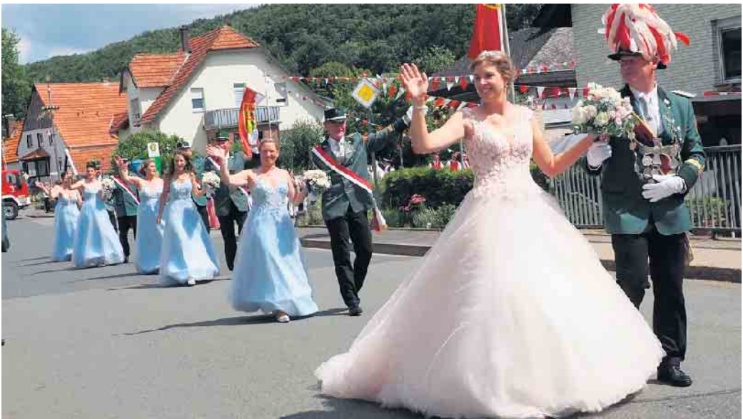
Anerkennende Blicke und positive Zurufe erhielten die Majestäten und der Hofstaat beim Festumzug am Sonntag.