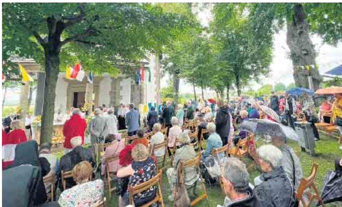
Das Festhochamt an der Annenkapelle.

Der Annentag-Montag beginnt mit dem traditionellen Viehmarkt ab 7 Uhr auf dem Parkplatz in der Ostheimer Straße (Combi). Hier wird das sogenannte „Kleinvieh“, wie beispielsweise Hühner, Enten, Gänse und Kaninchen, verkauft.