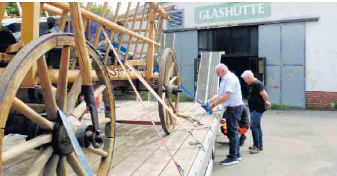
Ankunft in der Manifattura