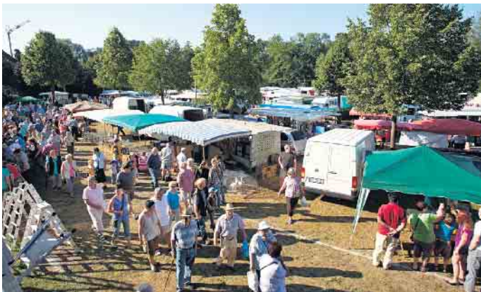
Der traditionelle Vieh- und Krammarkt am Montag auf dem Combi-Parkplatz.