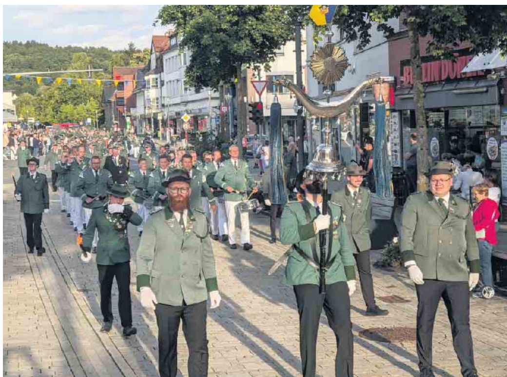
Festumzug durch die Stadt.