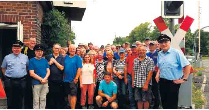
Wandergruppe und Eisenbahn-Freunde am Historischen Stellwerk Bad Driburg Do.

Mit einem bunten Festprogramm wurde am 6. Juli das Doppeljubiläum „100 Jahre Sachsenklause“ und „100 Jahre Sachsenring“ gefeiert. Das Wetter hatte ein Einsehen und der Regen hielt sich weitgehend zurück.