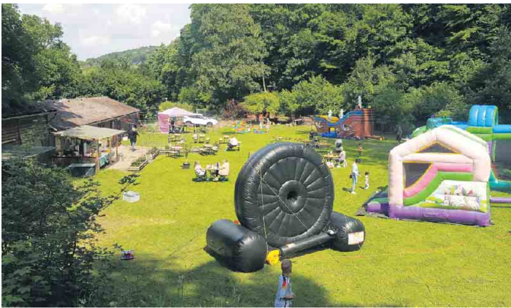
Das Hüpfburgenfest begeisterte die Kinder und ihre Eltern.

noch zahlreiche weitere Bad Driburger Erlebnis-Angebote. In den Schulferien und darüber hinaus bieten diverse Vereine, Höfe und Unternehmen den Kindern der Stadt Aktivitäten aus den Bereichen Sport und Gesundheit, Tiere und Natur, Museen und Kreativität. Am 29. Juli dürfen die Kinder zu Moor-Forschern werden, am 30. Juli gibt es eine Alpaka-Schnupperstunde,