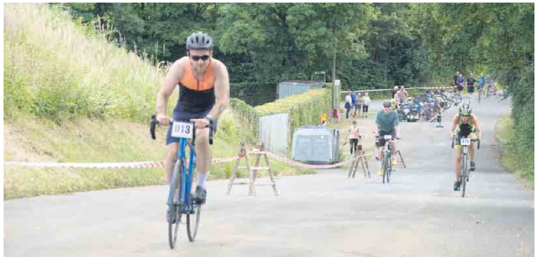
Blick auf die Radstrecke mit Start am Freibad und direktem Anstieg zum Eggstadion, anschl. am Stausee vorbei um den Bollberg/Ruheforst, vorbei am neu aktivierten Campingplatz zurück zum Freibad.

Mit wieder an die 250 Anmeldungen konnten die Veranstalter (SV Neuenheerse, FC Neuenheerse/Herbram und Förderverein Freibad Neuenheerse) die sehr guten Zahlen vom Vorjahr bestätigen. Insbesondere bei der Halbdistanz geht aufgrund der „Enge“ im Freibad keine Steigerung mehr. In diesem Jahr waren dazu erstmals auch deutliche Steigerungen bei den Kindern erkennbar, insbesondere durch vermehrte Teilnehmer von der Grundschule St. Walburga Neuenheerse. Da auch bei den Erwachsenenteams wieder einige Teilnehmer aus Neuenheerse mitgemacht haben wird das Ziel auch möglichst viele Teilnehmer aus Neuenheerse selber zu motivieren, immer mehr erreicht. Die Organisatoren freuen sich aber auch über die vielen externen Teilnehmern, vor allem, wenn