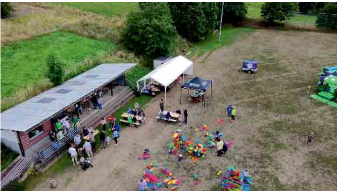
Das Sport- und Spielfest aus der Vogelperspektive

die sich über die besonders günstigen Preise überrascht zeigten. Der Verein hofft, dies mit dem Sport- und Spielfest erreicht zu haben.