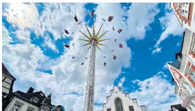
Der Fly Over - das 40 m hohe Kettenkarussell direkt auf dem Brakeler Marktplatz.