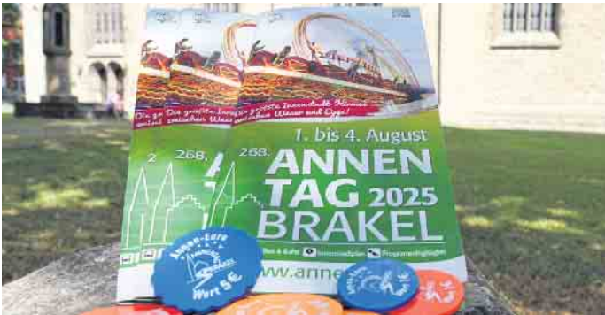
Der Annen-Euro ist seit Montag, 7. Juli, erhältlich. Sichern Sie sich die Annentagswährung und einen Rabatt in Höhe von 10 Prozent.

Der mega Outdoor-Parkour mit Wasserpark sorgt bei heißen Temperaturen für eine angenehme Abkühlung und die XXL-Rutsche für Action pur! Auch das Fahrgeschäft Jetlag ist erstmalig in Brakel dabei und auf dem Parkplatz Feuerteich zu finden. Die Fahrgäste erwartet hier ein atemberaubender Flug. Der Marktmeister freut sich besonders, in diesem Jahr wieder das Riesenrad Roue Parisienne auf dem Feuerteich-Parkplatz ankündigen zu können. Europas größtes Riesenrad bietet mit seinen 48 Metern Höhe einen unvergesslichen Blick über den gesamten Annentag. Auch in den beiden Festzelten wird natürlich wieder jede Menge geboten. Neu auf dem Annentag ist in diesem Jahr „Annekens Tanzgarten“ am Standort auf dem Kirchplatz. Überdacht mit einem 28 Meter großen Schirm finden hier insgesamt 600 Gäste Platz. Das La Casa Zelt ist traditionell auf dem Sparkassenparkplatz zu finden und bietet auch in diesem Jahr wieder ein abwechslungsreiches Musikprogramm im Salitos- und Clubfloor. Der Annentag-Montag beginnt mit dem traditionellen Viehmarkt ab 7:00 Uhr auf dem Parkplatz in der Ostheimer Straße. Um 22:00 Uhr wird dann das Höhenfeuerwerk in den Bredenwiesen stattfinden. „Ob das Feuerwerk traditionell erfolgen kann, ist natürlich immer auch von der Witterung und möglichen Trockenheit abhängig, bitet Marktmeister Benedikt Gönnewicht um Verständnis. Alle Informationen rund um den 268. Annentag in Brakel sind immer aktuell auf der Annentags-Homepage ( www.annentag.de ) zu finden.