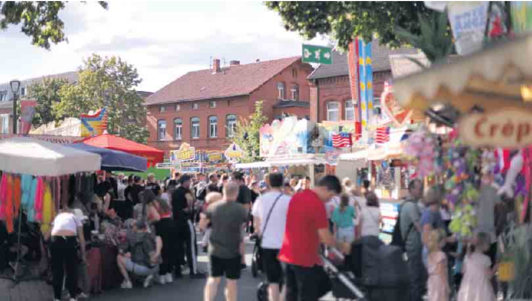
Volle Straßen auf der Annentags-Kirmes.