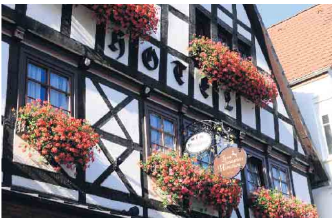
Das Hotel Zum braunen Hirschen ist das älteste Gasthaus in Bad Driburg mit viel Gemütlichkeit und Geschichte.

Die dritte Bad Driburger Sommernacht findet am 28. August als Bayerischer Abend mit den Original Steigerwälder im Hotel am Park statt.