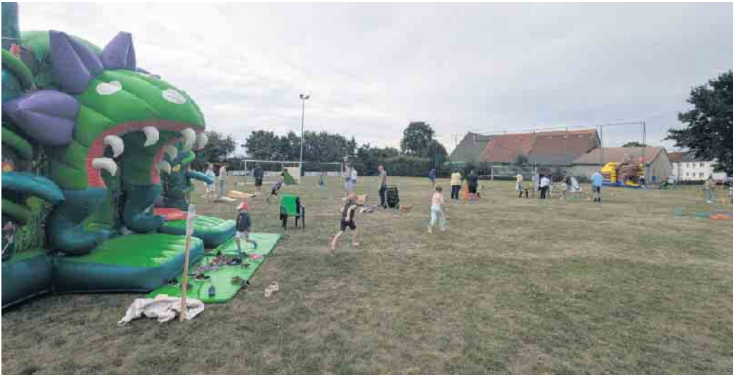
Die zwei Hüpfburgen waren für viele Kinder das Highlight

Im Rahmen des 100-jährigen Vereinsjubiläums veranstaltete der Turn- und Sportverein Pömbsen am 6. Juli ein Sport- und Spielfest für die ganze Familie. Während die Kleinen sich in den zwei Hüpfburgen auspowern konnten oder sich mit den XXL-Bausteinen an ihrem ersten Eigenheim versuchten, zog es die Junggebliebenen zum Nagelklotz oder zu Spielen wie Cornhole und Wikingerschach. Selbst der zwischenzeitlich einsetzende leichte Regen konnte manche nicht davon abhalten, die Spielangebote des zum Spielpark verwandelten Sportplatzes weiter zu erkunden. Anderen gab er die Zeit, sich wettergeschützt eine Portion Pommes oder eine Tüte frisch gemachtes Popcorn zu gönnen. Diverse weitere Spielmöglichkeiten sowie