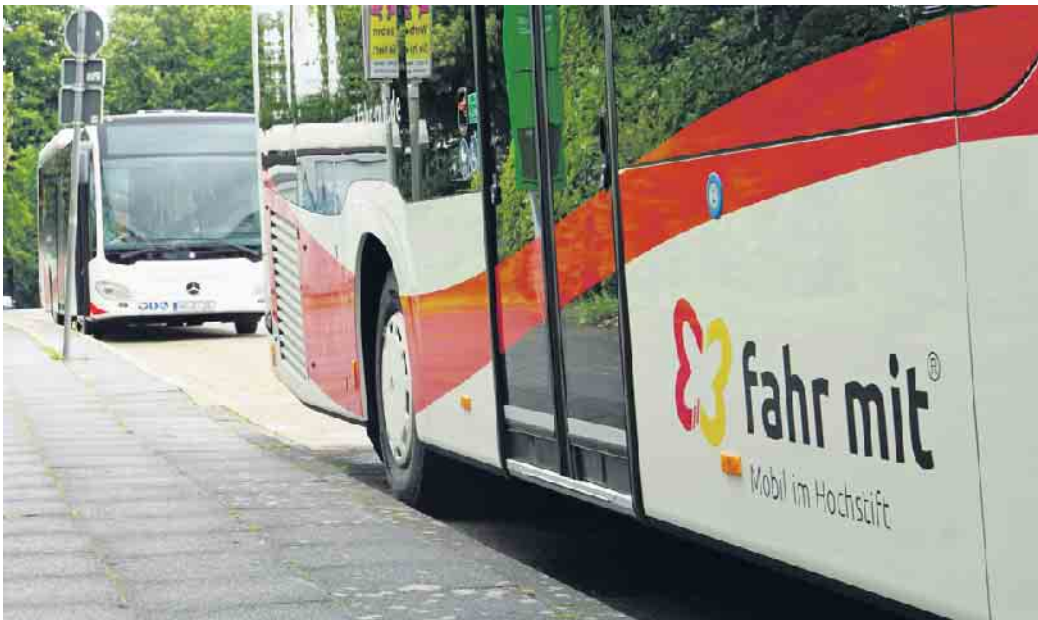
Ansicht Bus www.fahr-mit.de

Anlässlich des Annentages bietet der Nahverkehrsverbund Paderborn/Höxter (nph) wieder zahlreiche Bus-Sonderfahrten auf sechs Linien von „fahr mit“ - Mobil im Hochstift an. Das Fahrplanangebot der NordWestBahn GmbH auf der RB 84 „Egge-Bahn“ wurde durch zusätzliche Nachtfahrten erweitert. Auch in diesem Jahr wird es wieder das Annenticket geben, das Besucherinnen und Besucher des Annentages für Hin- und Rückfahrten auf allen Bus- und SPNV-Linien im Kreis Höxter inkl. Sonderverkehren in Anspruch nehmen können. Es ist zum Preis von 4,50 Euro (pro Fahrt) in allen Sonderbussen erhältlich und am Bahnhof Brakel sowie in den Bussen vor Fahrtantritt zu erwerben. Tickets des WestfalenTarifs sowie das Deutschlandticket werden in allen Sonderverkehren ebenfalls anerkannt. Alle Besucherinnen und Besucher können so unbeschwert und ohne Parkplatzsorge den Annentag genießen. Bitte beachten Sie die Änderungen der Abfahrtspositionen: Bitte beachten Sie, dass sich die Abfahrtspositionen der Busse teilweise geändert haben. Die Busse fahren an der Haltestelle