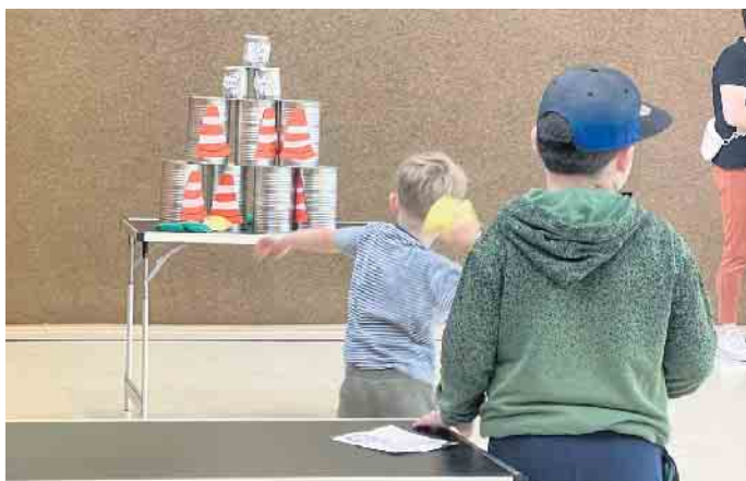
Dosenwerfen bei der Kinderolympiade in Reelsen

Nach der Hitze kam die Abkühlung, doch der Spaß auf dem Reelser Sportfest des SV BW Reelsen kam nicht zu kurz! Viele Reelser haben beim Public