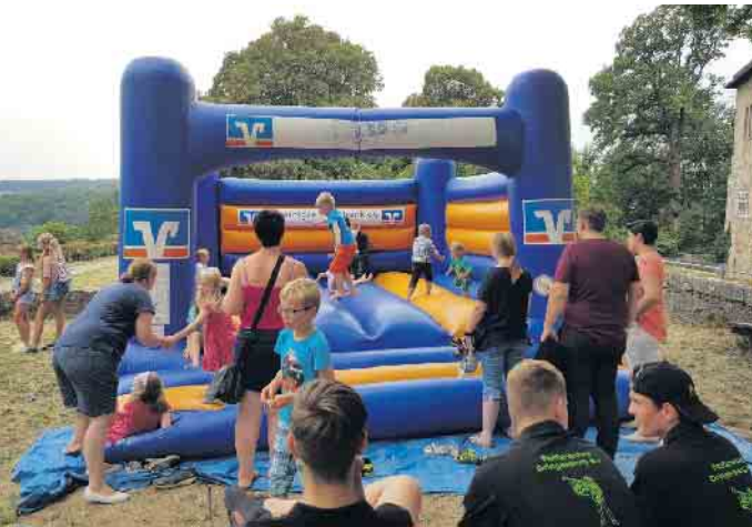
Eine Hüpfburg macht allen Kindern Spaß.