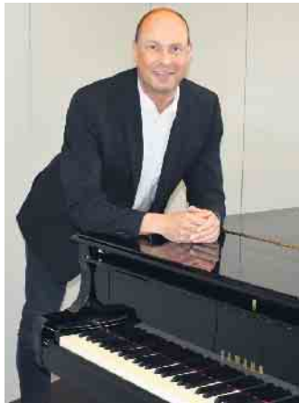
Bildungs- und Kulturdezernent Uwe Damer

Der neue Spielzeitbegleiter ist im Rathaus und in der Tourist Info erhältlich. Bei Rückfragen wenden Sie sich gerne an das Kulturamt der Stadt. Wir wünschen viel Spaß beim Auswählen!