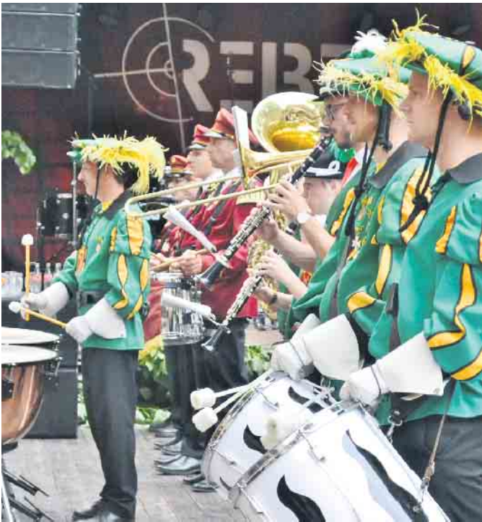
Traditionelle Klänge von den Musikvereinen der Burg