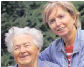
Meine Mutter braucht Pflege