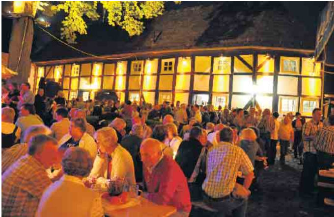
Der Burghof der Burg Dringenberg entfaltet zum Burgfest eine besondere Atmosphäre.

Am Samstag, 20. Juli, laden die drei Dringenberger Musikvereine, Fanfarenzug, Spielmannszug und Burgmusikanten herzlich zum traditionellen Burgfest ein.