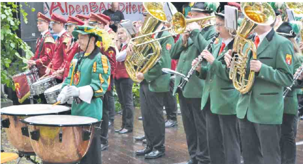
Der Fanfarenzug beim Gemeinschaftsspiel.

Einen runden Geburtstag feiert der Fanfarenzug Dringenberg. Er wurde im Jahr 1964 gegründet und kann somit auf eine spannende Vereinsgeschichte von 60 Jahren Jahren zurückblicken. Zu seiner Gründungszeit beinhaltete der musikalische Bestand die reine Fanfarenmusik. Die Auftrittsbeteiligung beträgt in der Regel 30 bis 35 Spielleute. Dabei ist die stark gestiegene Mitgliederzahl vor allem das Resultat der aktiven und priorisierten Jugend- und Nachwuchsarbeit. Der Fanfarenzug steht für ein harmonisches, teamorientiertes Vereinsleben. Das Miteinander von Jung und Alt fördert das generell starke Gemeinschaftsgefühl und zeichnet den Fanfarenzug Dringenberg aus. Für Spaß ist und wird immer gesorgt. Neben der Mitgliederzahl hat sich auch das Repertoire der Musikstücke sehr stark weiterentwickelt.