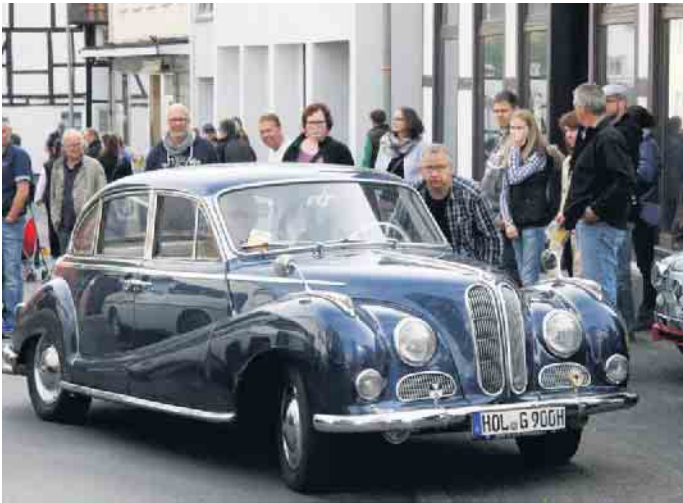
Oldtimerfreunde haben mit ihren Fahrzeugen das Burgfest bereichert.

Dabei können die Grundschulkinder im Instrumentalunterricht erste Erfahrungen mit einem Blasinstrument machen. Generell ist das Erlernen eines Instrumentes bei den Dringenberger Burgmusikanten bei ausgebildeten Instrumentallehrern möglich.