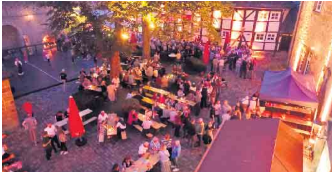
Der stimmungsvolle Burginnenhof aus der Vogelperspektive.

Dringenberg. Es ist wieder soweit. Auf der Burg in Dringenberg wird das traditionelle Burgfest gefeiert. Am Samstag, 20. Juli, lädt der Förderverein für Musik und Kultur wieder zum traditionellen Burgfest in Dringenberg ein. Ab 16 Uhr erklingen die ersten Töne des Gemeinschaftsspiels des Spielmannszugs, der Burgmusikanten und des Fanfarenzugs im Burginnenhof. Nach dieser musikalischen Eröffnung werden den Besuchern aus Nah und Fern frischgebackene Waffeln, leckerer Kuchen und Kaffee zum Verzehr angeboten. Ebenfalls steht für den deftigen Gaumen ein Imbissstand bereit. An diesem Nachmittag sind die Türen des Heimatmuseums und des beeindruckenden Gewölbekellers des historischen Gebäudes ebenfalls geöffnet. Die kleinen Besucher können sich auf ein buntes, kostenloses Angebot aus Kinderschminken, Hüpfburg, Dosenwerfen und vielen weiteren