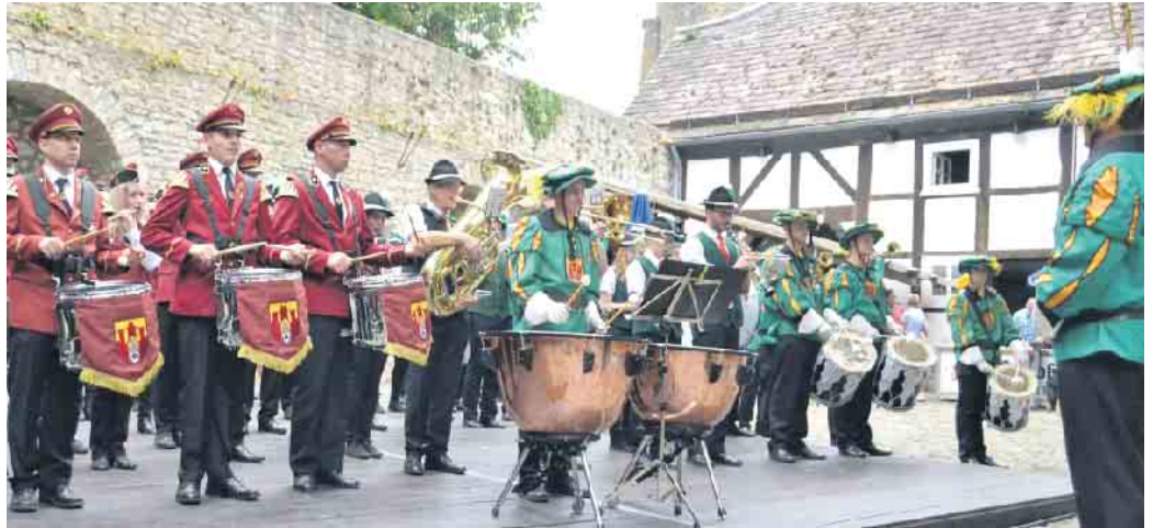
Das Gemeinschaftsspiel der drei musiktreibenden Burgvereine ist ein besonderer Höhepunkt.

Sie fragen sich, warum nicht alle gemeinsam in einem Verein musizieren können? Tatsächlich aber widmen sich die drei Vereine drei unterschiedlichen Musiktraditionen. Das macht Dringenberg zu einer Hochburg der Musik. Das spürt man vor allem bei den großen Festumzügen zum Schützenfest und zur Lobepro-