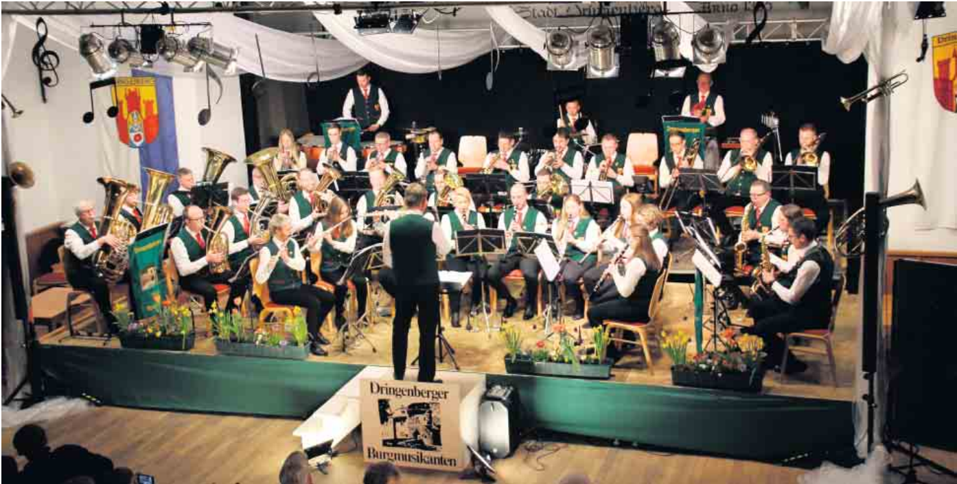
Die Dringenberger Burgmusikanten haben mit ihrem Frühjahrskonzert zahlreiche Besucherinnen und Besucher begeistert.

Übungsraum der Burg, so schallen einem die Klänge von Klarinetten, Flöten, Saxophonen, Posaunen, Trompeten, Flügel-