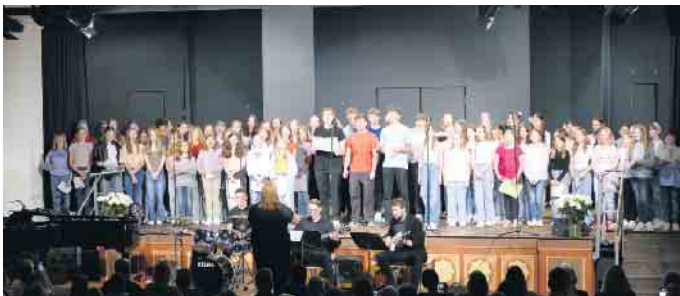
Als Zugabe sangen alle Ensembles und Chöre gemeinsam „Major Tom“ und animierten das begeisterte Publikum zum Mitsingen.

„Völlig losgelöst und schwerelos“, viel besser kann man die Stimmung während und nach dem diesjährigen traditionellen Sommerkonzert am Gymnasium St. Xaver sowohl bei allen Beteiligten als auch den Zuhörenden nicht beschreiben. Es war ein abwechslungsreicher und beeindruckender Konzertabend! Der vokalpraktische Kurs der Jgst. Q1 unter der Leitung von Frank Kieseheuer begeisterte mit „The Sound Of Silence“ und verschiedenen solistischen Einlagen ebenso wie beim zweiten vorgetragenen Klassiker „Music“ von John Miles. Anschlie-