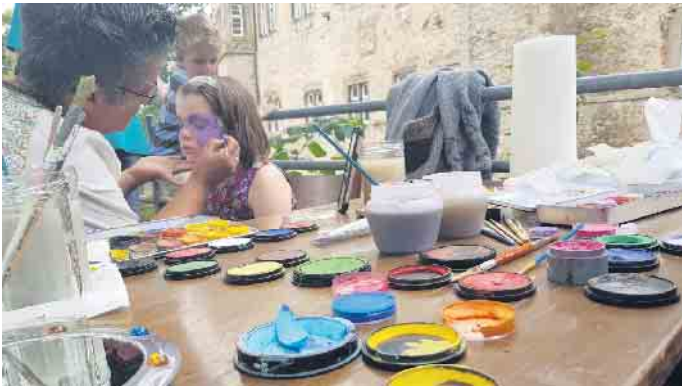
Eine Station zum Kinderschminken darf nicht fehlen.

langen, Nordheim und Iphofen, Konzerte mit der Kelly Family, Michael Wendler oder Olaf Henning usw. sind nur einige Referenzen der Band Rebellen und belegen die Aussage.