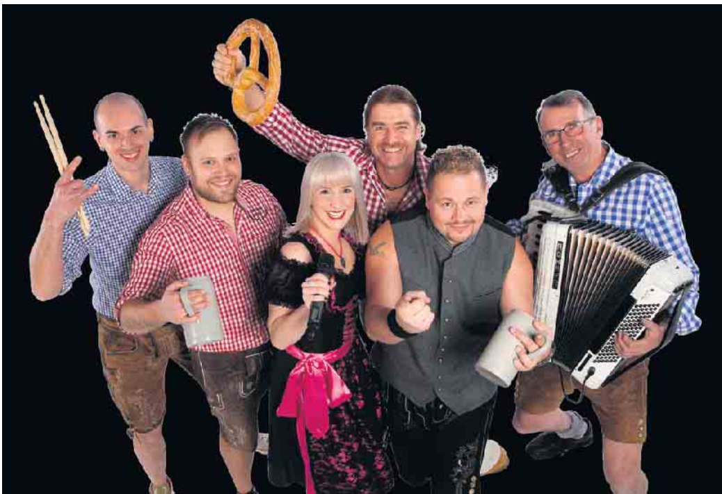
Die Partyband Rebellen sorgt für Stimmung.

Dringenberg. Es ist wieder soweit. Auf der Burg in Dringenberg wird das traditionelle Burgfest gefeiert. Am Samstag, 20. Juli, lädt der Förderverein für Musik und Kultur wieder zum traditionellen Burgfest in Dringenberg ein. Ab 16 Uhr erklingen die ersten Töne des Gemeinschaftsspiels des Spielmannszugs, der Burgmusikanten und des Fanfarenzugs im Burginnenhof. Nach dieser musikalischen Eröffnung werden den Besuchern aus Nah und Fern frischgebackene Waffeln, leckerer Kuchen und Kaffee zum Verzehr angeboten. Ebenfalls steht für den deftigen Gaumen ein Imbissstand bereit. An diesem Nachmittag sind die Türen des Heimatmuseums und des beeindruckenden Gewölbekellers des historischen Gebäudes ebenfalls geöffnet. Die kleinen Besucher können sich auf ein buntes, kostenloses Angebot aus Kinderschminken, Hüpfburg, Dosenwerfen und vielen weiteren