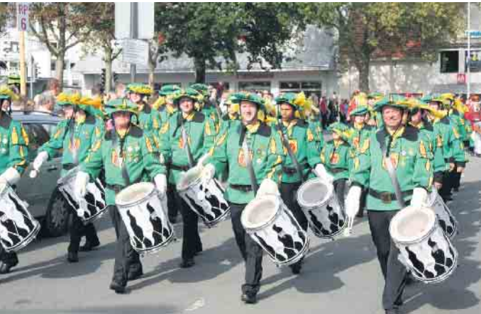
Mit seinen historisierten grünen Uniformen ist der Fanfarenzug immer ein Hingucker.

Der Fanfarenzug feiert sein 60-jähriges Bestehen