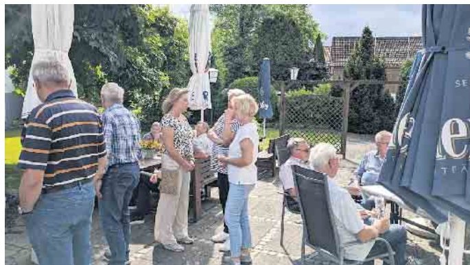
Gute Stimmung beim Sommerfest

tafel gab es reichlich Gelegenheit sich untereinander auszutauschen. Die Organisatoren hatten für alle Beteiligte ein Zahlenglücksrad aufgestellt. Jeder musste mit drei Versuchen die höchste Punktzahl erreichen. Der Hauptpreis war eine Rehkeule und weitere klei-