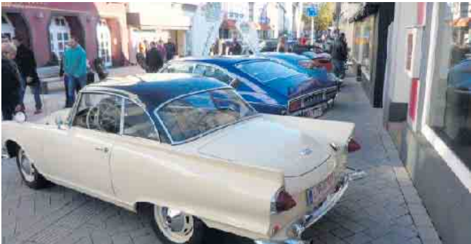
Oldtimerfreunde machen Station an der Burg Dringenberg.

Das Repertoire der Band erstreckt sich von volkstümlicher Musik, kultigen Schlagern, Mallorca-Hits über 90er Evergreens und auch Klassikern des Rocks bis hin zu den aktuell angesagten Charts