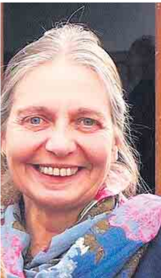
Kitas sind für die Chancengerechtigkeit von Kindern und für die Vereinbarkeit von Familie und Beruf unerlässlich.

Kitas sind für die Chancengerechtigkeit von Kindern und für die Vereinbarkeit von Familie und Beruf unerlässlich. Der Platzausbau ist daher zentral: für die Kinder, für ihre Eltern, für die Wirtschaft im Land, für die GRÜNE Landtagsfraktion. Das Land unterstützt die Träger und Kommunen in NRW durch die Investitionskostenförderung finanziell bei Bau, Ausbau und Erhalt von Kitas. Wir freuen uns über eine erhebliche Erhöhung der Förderhöchstsätze. Das Land hat die Förderrichtlinie zu Beginn des Jahres neu aufgesetzt. Dabei wurden die Inflation und die gestiegenen Baupreisen durch eine durchschnittliche Erhöhung um 14,5 Prozent berücksichtigt. Und zusätzlich wurde die Aufnahme einer Fördermöglichkeit für inklusive Kita-Plätze aufgenommen. Und endlich wird zukünftig auf eine Unterscheidung des Verfahrens zur Schaffung von Plätzen für Kinder unter und über drei Jahren verzichtet. Dies führt zu einer nicht unerheblichen Bürokratieentlastung bei den Trägern und Jugend-