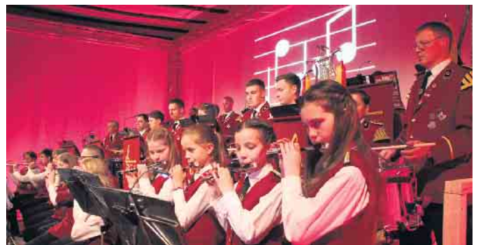
Starke Töne: Der Spielmannszug Dringenberg bei seinem Konzertabend in der Zehntscheune.

Seit jeher investiert der Spielmannszug kontinuierlich in die Jugendarbeit. Darüber hinaus unterstützt der Spielmannszug die musikalische Frü-