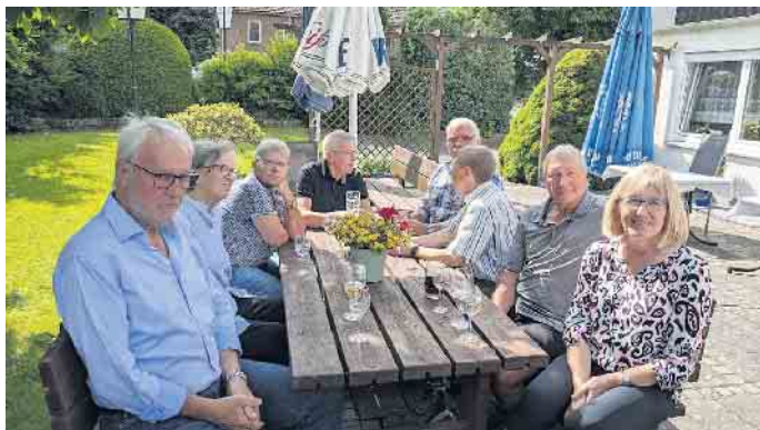
Teilnehmer am Sommerfest

Jeden Monat benutzen ca. 1.300 Fahrgäste den Bus