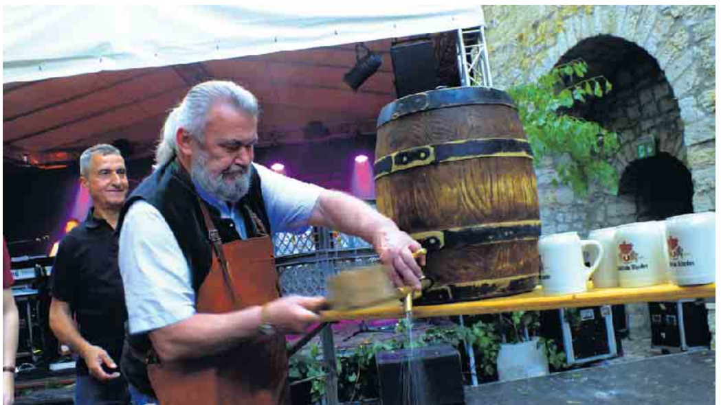
Mit dem traditionellen Fassanstich startet das Fest mit Freibier in den Abend.

Am Nachmittag öffnen das Heimatmuseum und der beeindruckende Gewölbekeller der historischen Burg ihre Türen für interessierte Besucher. Die kleinen Gäste können sich auf ein buntes, kostenloses Programm freuen: Kinderschminken, Hüpfburg, Dosenwerfen und Bogenschießen sorgen für Spaß und Unterhaltung.