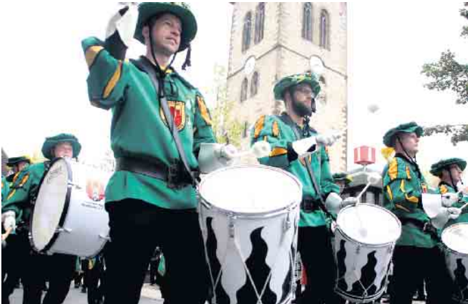
Der Fanfarenzug Dringenberg bereichert jeden Festumzug.

Einen runden Geburtstag feiert der Fanfarenzug Dringenberg. Er wurde im Jahr 1964 gegründet und kann somit auf eine spannende Vereinsgeschichte von 60 Jahren Jahren zurückblicken. Zu seiner Gründungszeit beinhaltete der musikalische Bestand die reine Fanfarenmusik. Die Auftrittsbeteiligung beträgt in der Regel 30 bis 35 Spielleute. Dabei ist die stark gestiegene Mitgliederzahl vor allem das Resultat der aktiven und priorisierten Jugend- und Nachwuchsarbeit. Der Fanfarenzug steht für ein harmonisches, teamorientiertes Vereinsleben. Das Miteinander von Jung und Alt fördert das generell starke Gemeinschaftsgefühl und zeichnet den Fanfarenzug Dringenberg aus. Für Spaß ist und wird immer gesorgt. Neben der Mitgliederzahl hat sich auch das Repertoire der Musikstücke sehr stark weiterentwickelt.