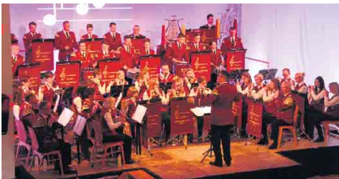
Breitgefächertes Programm: Der Spielmannszug Dringenberg weiß auch konzertant aufzutreten.

zession, wenn drei Musikformationen das Fest begleiten. Darum ist es auch jedes Mal ein besonderer Höhepunkt, wenn um 16 Uhr mit dem Gemeinschaftsspiel der drei Musikformationen das Burgfest eröffnet wird.