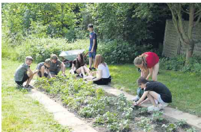
Das Beet im Bienengarten wurde neu bepflanzt und u. a. ein Sandarium für Wildbienen angelegt.

Spürbar war in allen Gruppen, wieviel Spaß die Schülerinnen und Schüler an ihren Projekten hatten und wie aus dieser Freude heraus innerhalb kürzester Zeit Ergebnisse erwachsen, die mitunter weit über das hinausgingen, was ursprünglich geplant worden war.