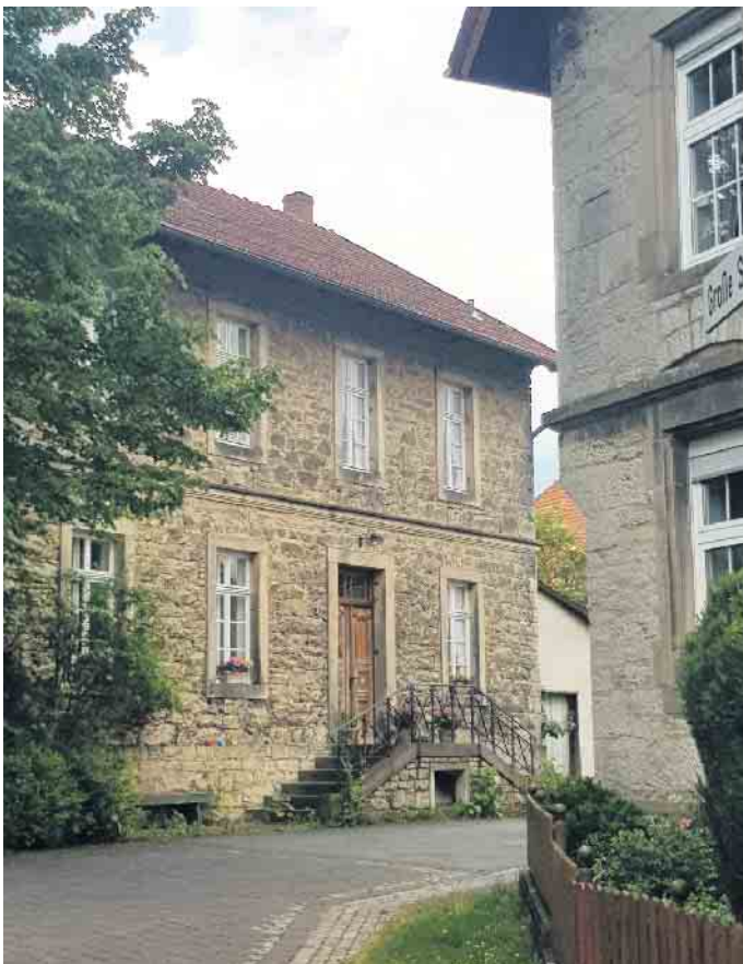
Ortsansicht aus Reelsen.