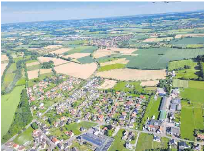
Es entstanden tolle Luftbildaufnahmen, hier: Vinsebeck.