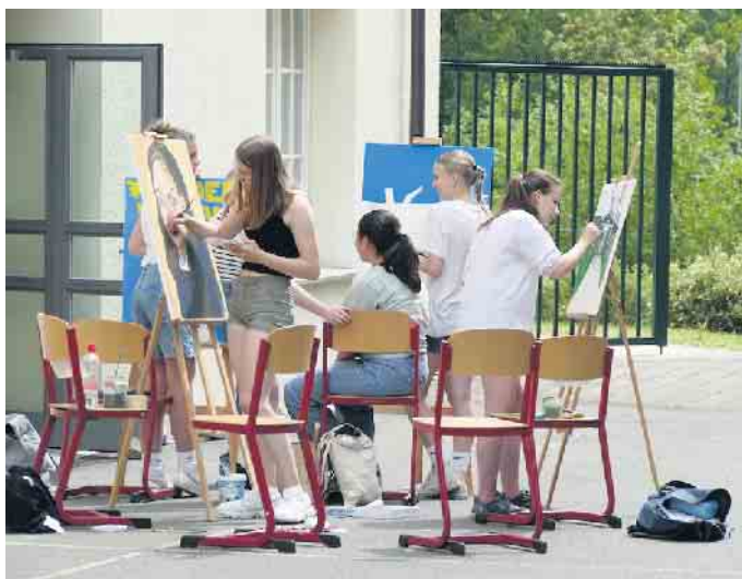
Nach Herzenslust gemalt werden konnte im Projekt „Leinwandbau“.