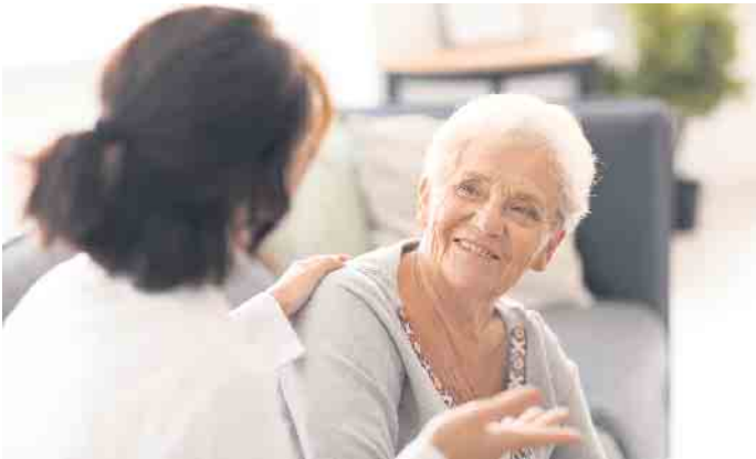
Wer unter Blasenschwäche leidet, sollte frühzeitig einen Arzt aufsuchen, denn es gibt viele Ansatzpunkte, um die Beschwerden zu lindern oder gar zu heilen.

Mehr Informationen zum Thema Inkontinenz finden Sie auf www.inkontinenz.de (akz-o)