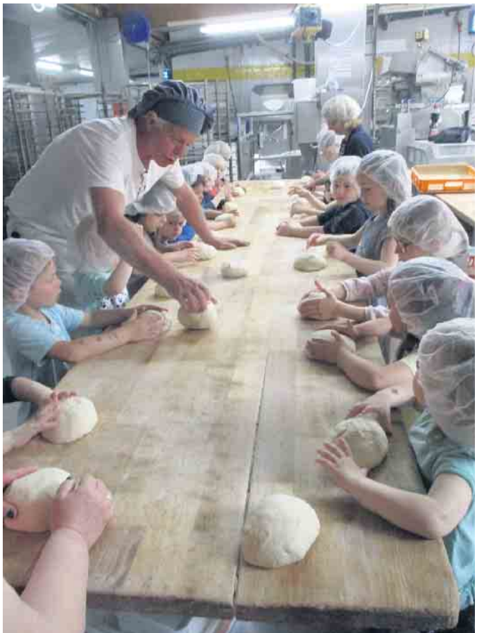
Die Kinder der der Kindertageseinrichtung „Zauberland“ beim Besuch der Bäckerei Goeken