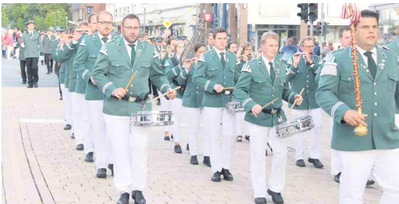
Vier Musikkapellen begleiten das Fest der Bürgerschützengilde.