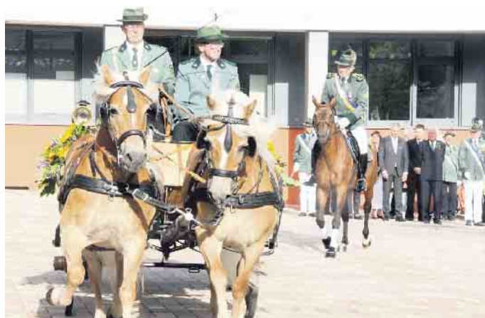
Im Galopp wird die neue Königin mit ihren Hofdamen um den Rathausplatz gefahren.