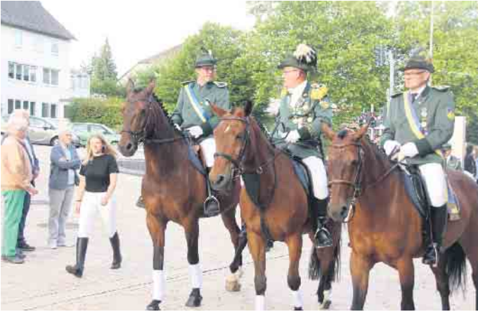
Der Oberst und seine Adjutanten begleiten den Festumzug hoch zu Ross.