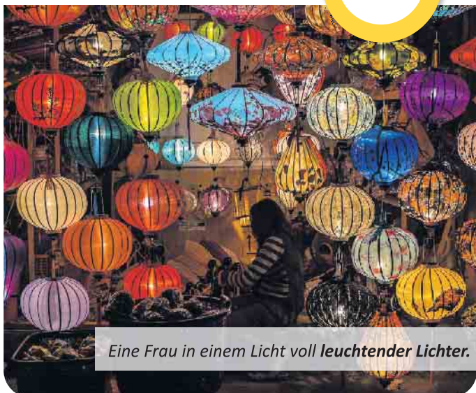
Eine Frau in einem Licht voll leuchtender Lichter.