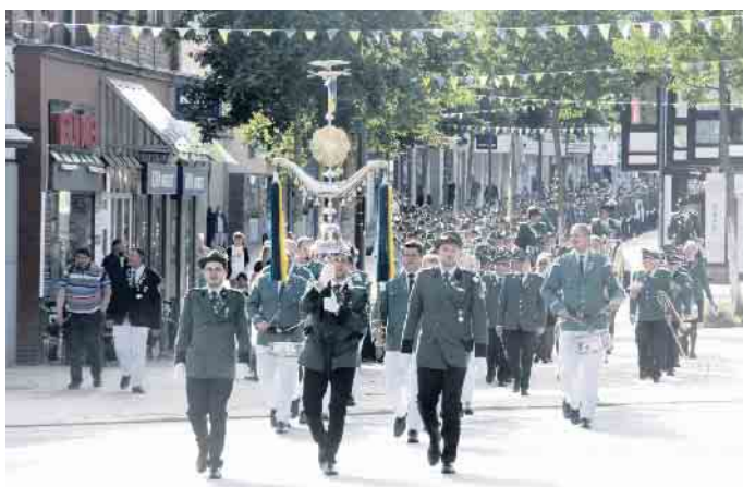
Aufmarsch der Schützen zur großen Parade.