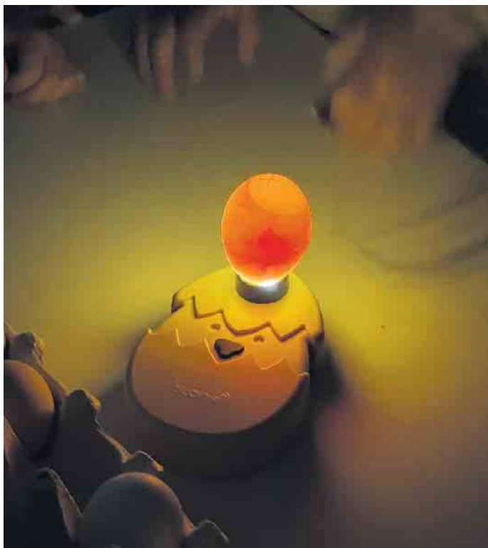
Am achten Tag hatten die Kinder die Möglichkeit zu sehen wie die Bruteier durchleuchtet werden. Hier ist die Entwicklung der Küken zu sehen und ob eventuell unbefruchtete Eier aussortiert werden müssen.

Durch den Vorschlag einer Kindergartenmutter der Kindertageseinrichtung „Kunterbunt“ in Herste, kam ein besonderes Projekt zustande. Die Kinder, Eltern und Erzieher bekamen die nicht alltägliche Gelegenheit die Entwicklung vom Ei zum Küken mit zu erleben. Am 24. Mai wurde die Brutmaschine von Frau Hake vorbereitet. Sie war für alle Kinder im Eingangsbereich gut sichtbar, jederzeit zugänglich und durch einen Käfig geschützt. Das ganze Projekt dauerte ungefähr drei Wochen. Vom zweiten bis siebten Tag wurden täglich die Temperatur, Luftfeuchtigkeit plus Wendung kontrolliert. Nach ungefähr zweieinhalb Wochen werden die Eier auf die Schlupfhorde umgebettet (rausnehmen der Abtrennung ) und die Luftfeuchtigkeit wird auf 65 Prozent erhöht, um die Eihaut für den Schlupf geschmeidig zu halten. Am Dienstag, 13. Juni, um 15.44 Uhr ist das erste Küken geschlüpft. Dieses besondere Ereignis konnten am späten Nachmittag einige Erzieher und Kinder „live“ beobachten. Der restliche „Nachwuchs“ ist am Abend, in der Nacht und am