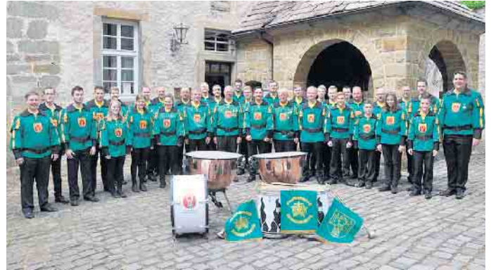
Der Dringenberger Fanfarenzug mit seinen tollen Uniformen.

Dringenberg. Zum 49. Mal wird in diesem Jahr im Innenhof der Burg Dringenberg das traditionelle Burgfest gefeiert. Das Burgfest in Dringenberg ist ein Leuchtturm im Vereinsleben der Titularstadt Dringenberg. Im nächsten Jahr feiert das Traditionsfest sein 50-jähriges Bestehen.