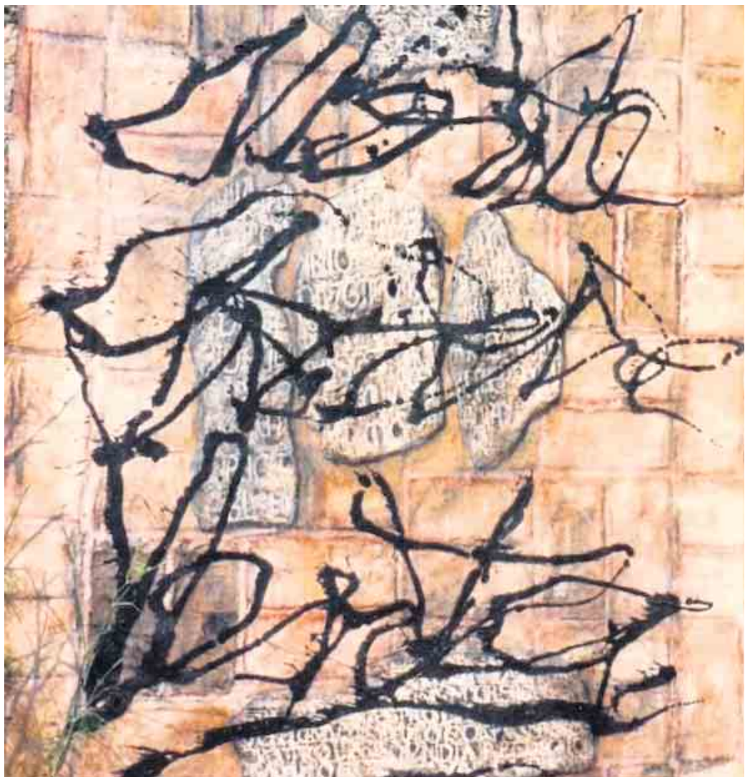
Ulrike Siebenhaar-Hage zeichnet mit Kohle, Graphit und Fotochemie.