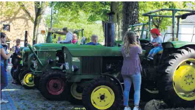
Die Altraktoren-Ausstellung muss in diesem Jahr aus organisatorischen Gründen ausfallen.

min im Kalender der umliegenden Ortschaften im Dreistädte-Eck der Kommunen Bad Driburg, Brakel und Willebadessen. Das Burgfest ist neben den Schützenfesten eine schöne Gelegenheit, sich in Dringenberg zu treffen und sich über die Ortsgrenzen hinweg auszutauschen. Ein abwechslungsreiches über den ganzen Tag verteiltes Programm trägt zum Erfolg des Fests bei. So findet bereits am Nachmittag um 16 Uhr ein gemütliches Beisammensein bei Kaffee und Kuchen und