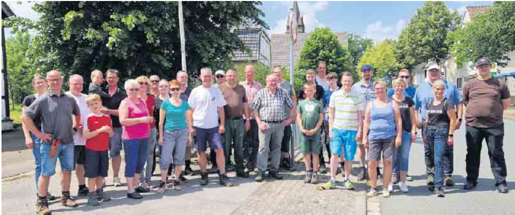
Teilnehmer beim Dorfaktionstag in Herste

Am 24. Juni haben sich zahlreiche Herster zum Dorfaktionstag getroffen. Im Vorfeld waren einzelne kleinere und größere Projekte geplant worden, die nun auf tatkräftige Umsetzung warteten. Unter anderem wurde das Gelände am Rommenhöller Ehrenmal gepflegt und Wege gereinigt, die Koerfer-Quelle und der Weg dorthin freigeschnitten und gemäht, ein Rastplatz mit Sitzgruppe am Schützenhaus aus Mitteln des Dorfbudgets erstellt, an alten Obstbäumen entlang des Obstbaumlehrpfades die Wassertriebe entfernt, zahlreiche Wege um Herste von Müll und Unrat befreit, die Beete und Anlagen in der Ortseinfahrt an der Kirche von Unkraut und Wildkräutern befreit und die vorhandenen Bäume geschnitten und in Form gebracht. Alle geplanten Arbeiten sind erfolgreich abgeschlossen worden. Ein großer Dank geht an Alle, die bei „Traumwetter“ nicht an den