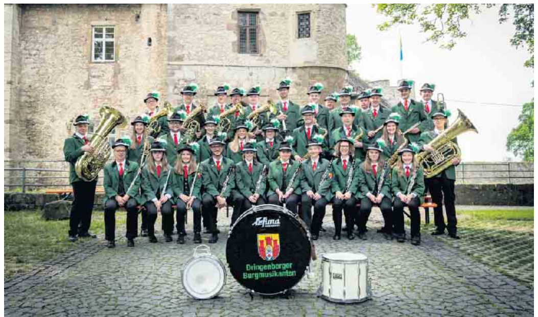
Die Burghauskapelle sind das Blasorchester der Burg Dringenberg.

So ein Fest gelingt nur, wenn viele ehrenamtliche Helfer gemeinsam in die Speichen fassen. Schon Tage vorher beginnt der Aufbau. Der Abbau wird routiniert und