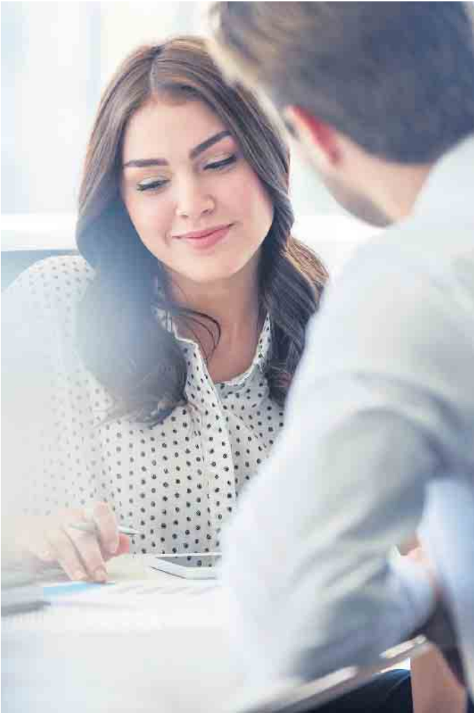
Bankkauffrau beziehungsweise Bankkaufmann zählen zu den wichtigsten Ausbildungsberufen in Deutschland.

Nachwuchskräfte im Bankwesen müssen flexibel auf Veränderungen reagieren können