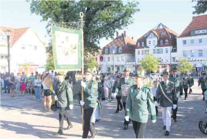
Die Fahne der Jungschützen wird hereingetragen.