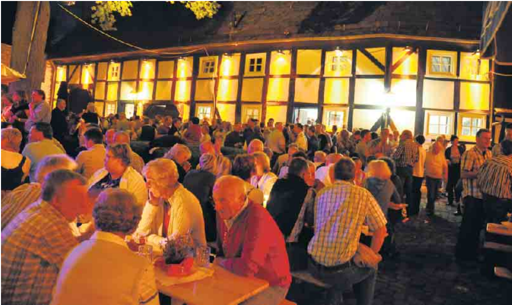
Je später der Abend umso mehr füllt sich der Burginnenhof.

Durch Vereinsfahrten, Ausflüge oder gesellige Abende wird das Verhältnis der Musiker untereinander gestärkt. Außerdem gibt es eine Bläserklasse in Form einer Kooperation mit der Grundschule in Dringenberg. Dabei können die Grundschulkinder im Instrumentalunterricht erste Erfahrungen mit einem Blasinstrument machen. Generell ist das Erlernen eines Instrumentes bei den Dringenberger Burgmusikanten bei ausgebildeten Instrumentallehrern möglich.