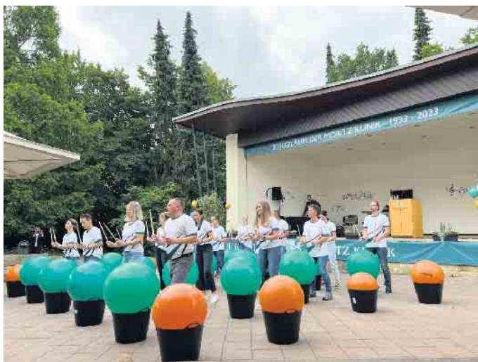
Sowohl beim Festakt als auch beim anschließenden Mitarbeiterfest sorgte die Trommel-Choreografie mit Gymnastikbällen von Mitarbeitenden der Moritz Klinik für Hochstimmung.

Mit der Eröffnung eines Long-COVID Therapie Centrum (LTC) bietet die Moritz Klinik seit November 2022 auch eine ambulante Therapie mit neuropsychologischen Schwerpunkt. Diese soll im