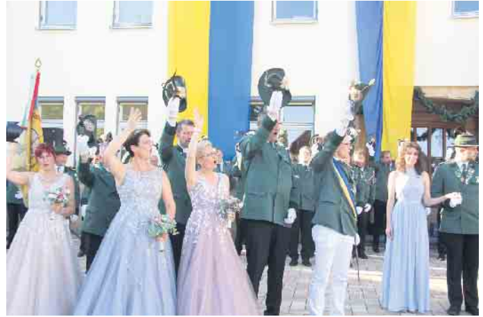
Die scheidenden Majestäten lassen das neue Königspaar hochleben.