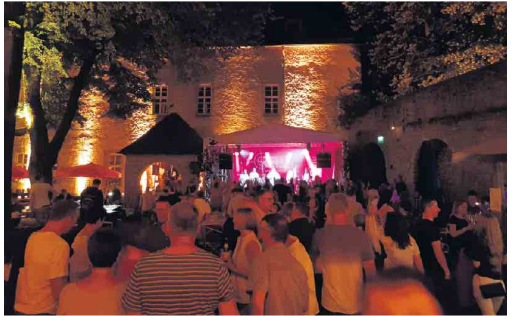
Beim Burgfest wird zu Live-Musik ausgelassen gefeiert.

Darüber hinaus unterstützt der Spielmannszug die musikalische Früherziehung mit einer eigenen Blockflöten-Gruppe und ermöglicht durch individuelle Förderung auch Spät- oder Wiedereinsteigern den schnel-