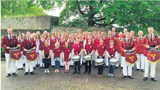
Der Spielmannszug Dringenberg feiert im nächsten Jahr sein 100-jähriges Bestehen.

Burgfest besteht seit fast einem halben Jahrhundert