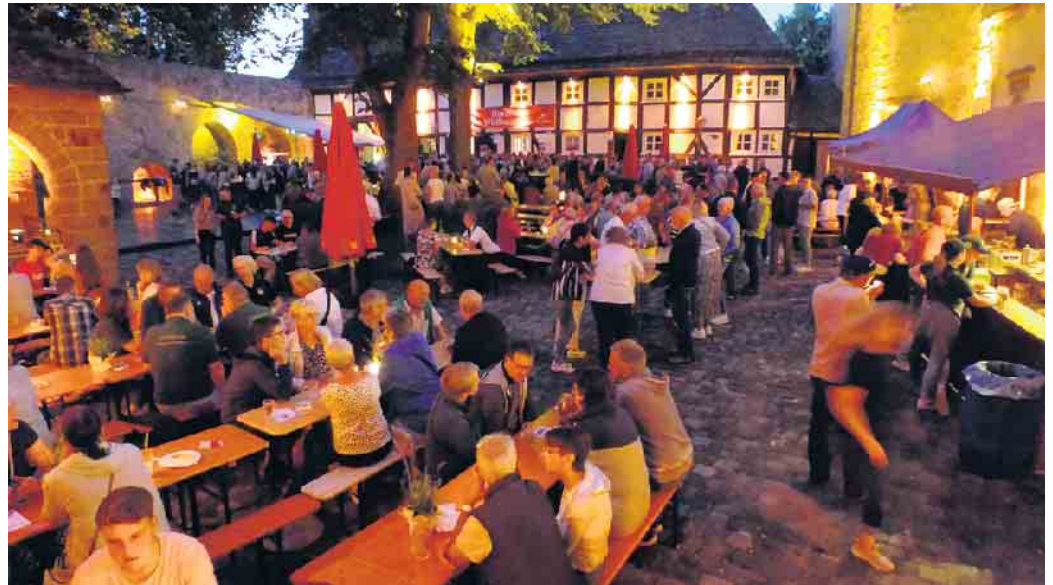
Ein schönerer Biergarten als der Burginnenhof lässt sich kaum finden.

Einmal im Jahr feiert die ehemalige Landesburg der Paderborner Fürstbischöfe sich selbst mit einem großen Burgfest. Am Samstag, 22. Juli, verwandelt sich der