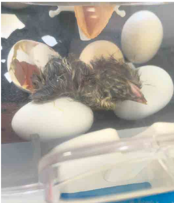
Der Schlupf des ersten Kükens war ein besonderes Ereignis für die Kinder.

nächsten Vormittag geschlüpft. Aus 10 befruchteten Eiern sind neun Küken geschlüpft. Auch an diesem spannenden Vorgang konnten viele staunende Beobachter teilnehmen. Die Küken sind noch 24. Stunden im Inkubator geblieben. Dort konnten sie trocknen und durch den Dotter, den die Küken noch am Bauch halten, versorgt werden.