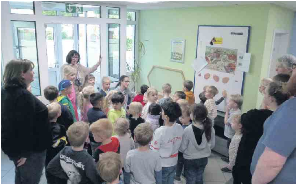
Beim Einlegen der Bruteier waren alle Kinder der zweigruppigen Einrichtung dabei.

viel Freude und Spaß mit den Küken, die noch einige Zeit im Kindergarten gewohnt haben. Abschließend konnten alle anhand von Fotocollagen die Zeit reflektieren lassen und die Kinder, Eltern und Erzieher wissen, wo die Küken jetzt ihr neues zu Hause haben. Nochmals vielen Lieben Dank, Frau Hake.