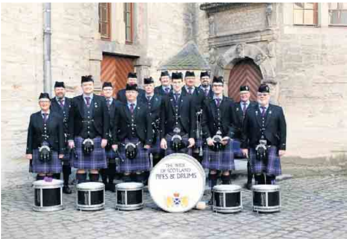
Schottische Highland-Klänge präsentiert die Altenbekener Formation Pride of Scotland Pipes & Drums.

Blas- und Spielmannsmusik und Fanfarenzugklängen statt. Zum Abend wird es deftig, wenn gegen 18 Uhr der Spießbraten angeschnitten wird. Richtig zünftig geht es ab 19.30 Uhr zu. Auftakt ist der traditionelle Fassanstich. Das erste Fass ist Freibier. Zum Fassanstich werden mit der Altenbekener Dudelsackformation The Pride of Scotland Pipes & Drums besondere musikalische Gäste erwartet. Das 2005 gegründete Backpipe-Ensemble steht für traditionelle schottische Dudelsack-Musik.