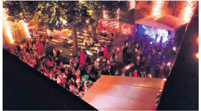
Rechts hinten ist die Rebellens-Bühne mit der Tanzfläche davor.

Dringenberg (bb). Die Burg Dringenberg ist ein einzigartiges Kleinod in der Eggegebirgs-Region. Als einzige, öffentlich zugängliche und vollständig erhaltene Burganlage atmet die Burg Dringenberg noch immer lebendiges Mittelalter. 1323 wurde die Burg Dringenberg erbaut. Sie feiert in diesem Jahr ihr 700-jähriges Jubiläum. Mit der Fertigstellung der Burg erhielt Dringenberg auch offizielles Stadtrecht, weshalb sich Dringenberg bis heute stolz als Titularstadt bezeichnen darf.