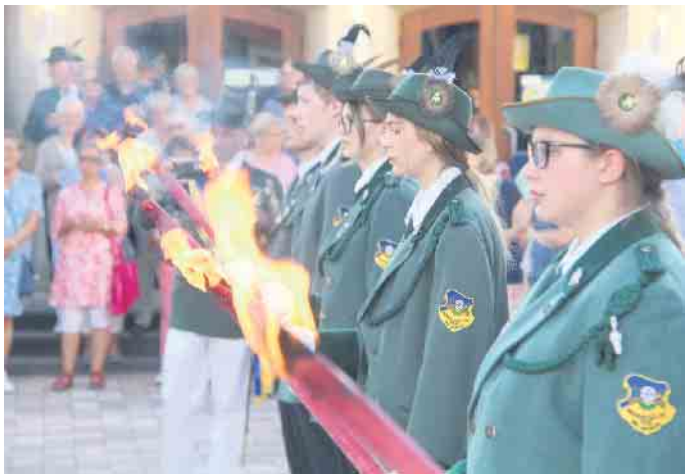
Fackelträger runden die feierliche Zeremonie ab.