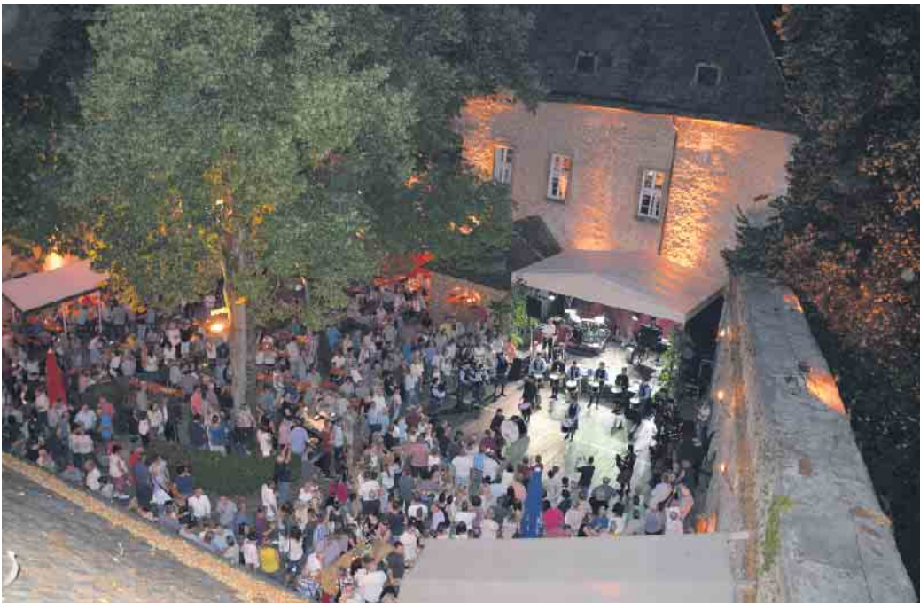
So präsentiert sich das Burgfest aus der Vogelperspektive mit der großen Linde im Innenhof.