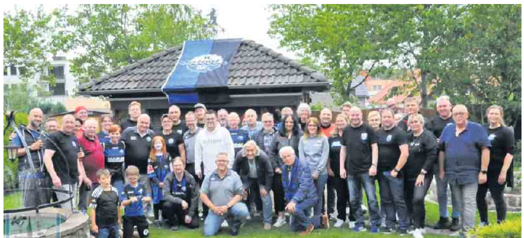
Die anwesenden Mitglieder des Fanclubs Driburger Räuber mit den Ehrengästen.