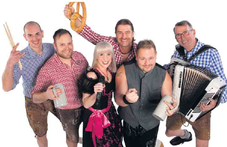
Die Partyband Rebellen sorgt garantiert für Stimmung.

perfekt. Verschiedene Lichteffekte lassen die Burg in besonderem Glanz erstrahlen. Genießen Sie das einmalige Ambiente und freuen sich auf einen großartigen Tag in der Titularstadt Dringenberg. Der Eintrittspreis beträgt bis 18 Uhr vier Euro und anschließend 8 Euro.