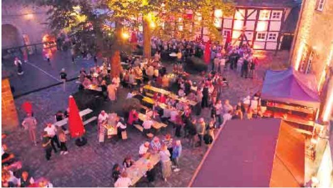
Der stimmungsvoll illuminierte Burginnenhof ist ein tolles Festambiente.

In diesem Jahr bestehen Stadtrechte und Burg in Dringenberg seit 700 Jahren