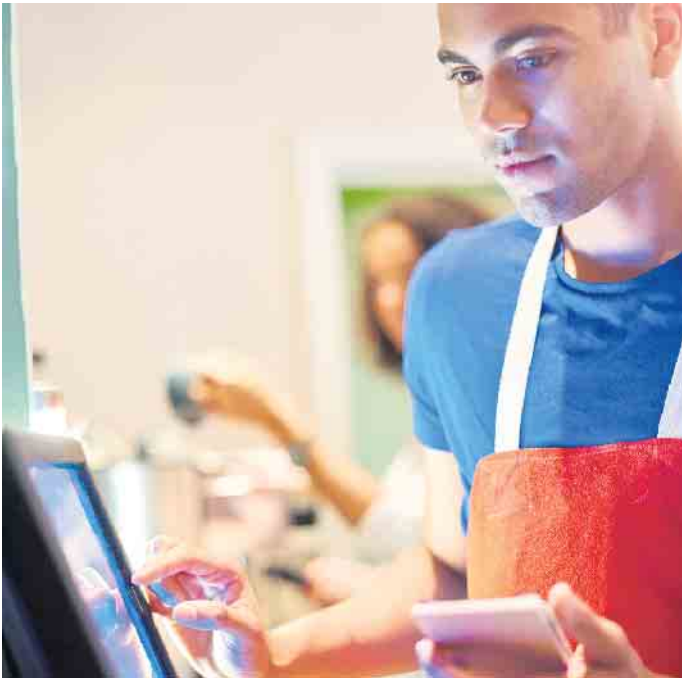
Damit alle Auszubildenden vergleichbare Chancen haben und sich auch einbringen möchten, ist eine interkulturelle Kompetenz in der Ausbildung entscheidend.

che für starke und erfolgreiche Mitarbeiterinnen und Mitarbeiter und tritt dem Mangel an qualifiziertem Nachwuchs tatkräftig und gezielt entgegen. (djd)