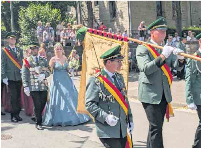
Der Festumzug mit seinen Regenten kommt am Ehrenmahl an.