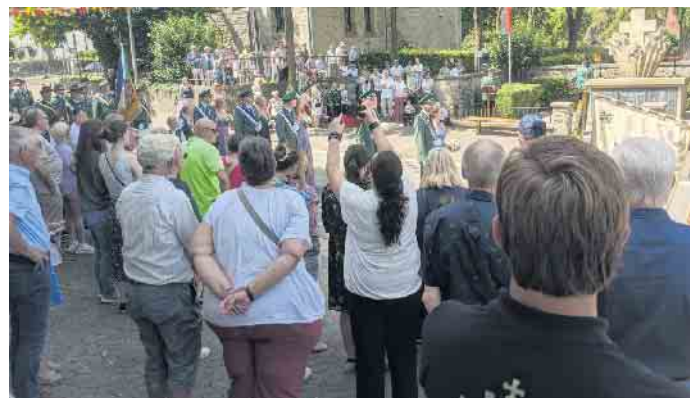
Viele Schaulustige haben sich versammelt.

schiert waren, wie der Kronprinz mit Gefolge abgeholt werden musste.