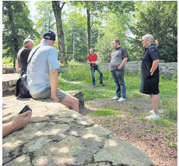
Die Teilnehmenden in den Ruinen der Kirche.