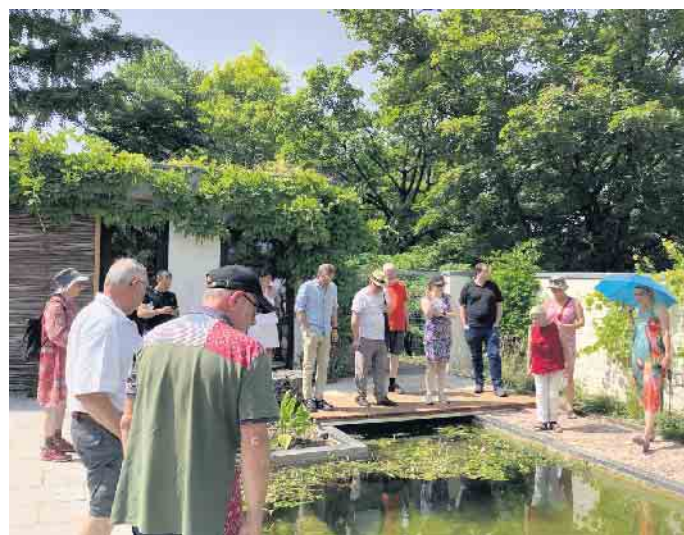
GRÜNE aus Bad Driburg, Nieheim und Höxter im Botanischen Garten der TH OWL in Höxter

Ende: Aus der Arbeit der Parteien Bündnis90 / Die Grünen