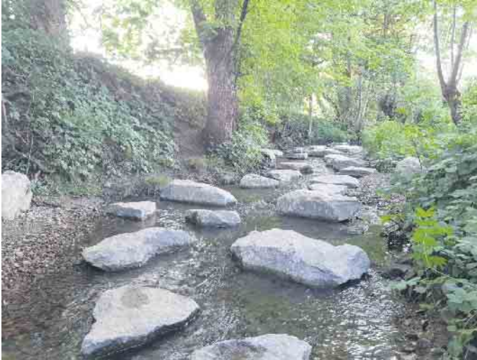
Auf einem Steinpfad trockenen Fußes durch die Öse. Aber auch für Kinder ein absolutes Spielereignis