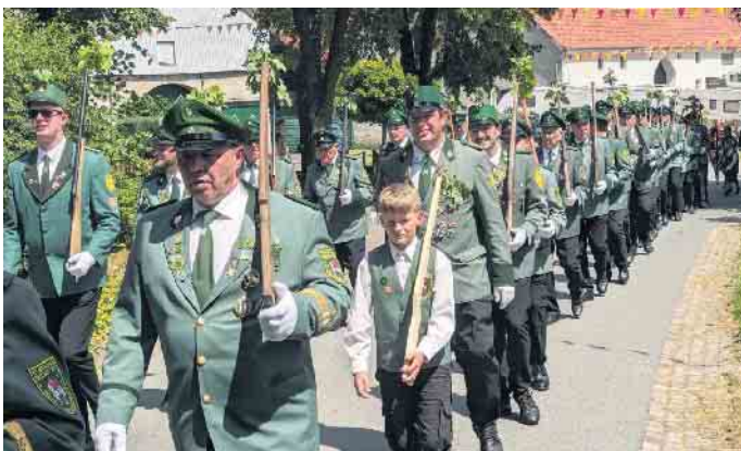
Die Schützenbruderschaft St. Martinus Reelsen feiert seine jungen und charmanten Regenten.