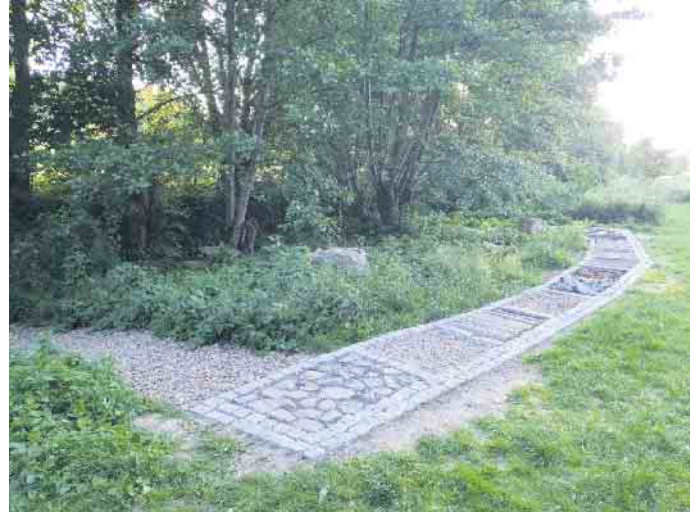
Ein Barfußpfad wurde angelegt, der nun alle Sinne im Fuß spüren lässt.

Der Verein zur Erhaltung der Schöpfmühle Dringenberg lädt herzlich zum Sommerfest ein. Am Sonntag, 6. Juli, ab 14 Uhr sind alle Bürgerinnen und Bürger sowie Gäste aus nah und fern eingeladen, gemeinsam ein paar gesellige Stunden auf dem Gelände der Schöpfmühle zu verbringen. Anlass für das Fest ist die Einweihung neuer Attraktionen, die im Rahmen des diesjährigen Dorfak-