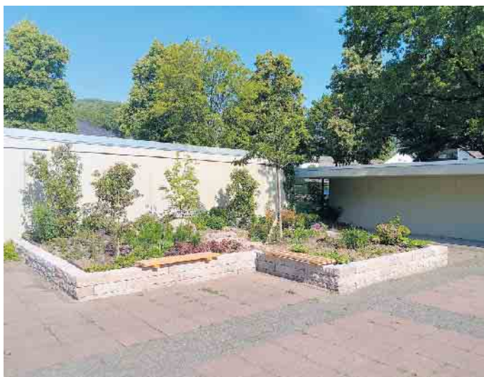
Die neue Hochbeete befinden sich im Eingangsbereich der Trauerhalle des Westfriedhofes.

Sitzgelegenheiten bieten naturnahe Orte zum Innehalten und zum Gedenken. „Ein herzlicher Dank gilt den Friedhofsgärtnern, die die Idee zur Gestaltung des genannten Friedhofsareals eingebracht und auch selbst hervorragend umgesetzt haben“, ist Baudezernent Florian Greger begeistert.