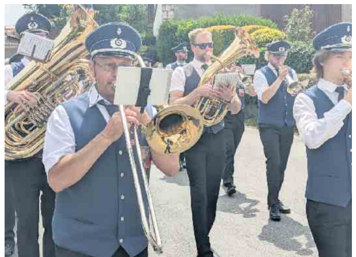
Die Blaskapelle Reelsen und der Spielmannszug Pömbesen müssen weite Wege marschieren.