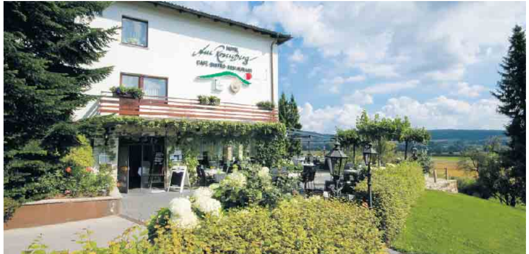
Das Hotel Am Rosenberg bietet den perfekten Rahmen für eine laue Sommernacht mit bester Unterhaltung.

Vom Restaurant aus hat man zudem einen fantastischen