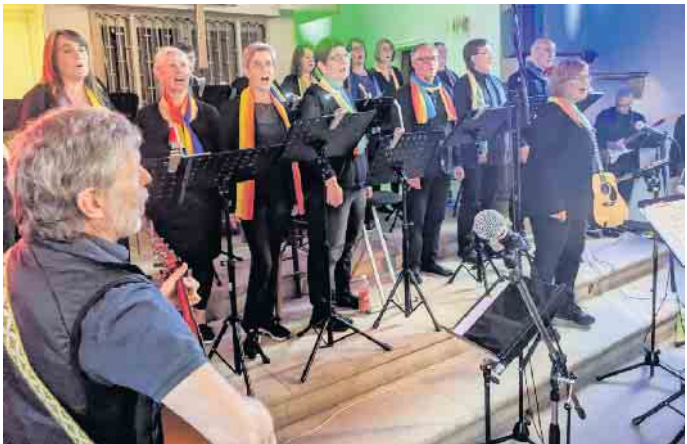
Der Funke springt schnell auch auf das Publikum über und alle singen mit.