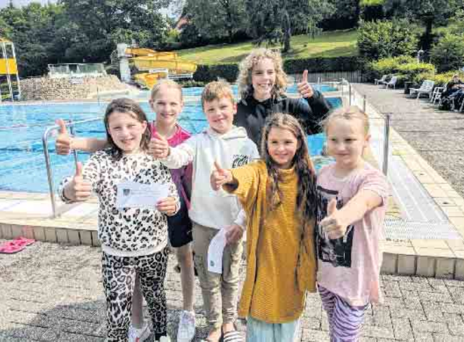
Die Sieger des ersten Ninja-Wettlaufs auf dem neuen Wasserparcours.

Förderverein spendet dem Freizeitbad Bad Driburg einen Wasser-Spielparcours für 12.400 Euro