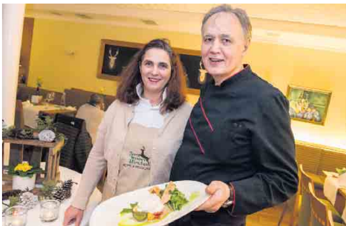
Ehepaar Tominaj freut sich auf ihre romantische Sommernacht am 14. August.

Echt bayerisch wird es am 28. August im Hotel am Park. Die Original Steigerwälder sind an diesem Abend mit zwei Musikern und einer Sängerin im Hotel am Park. Die erfolgreiche bayerische Band spielt volkstümliche Musik, deutsche Schlager, Oldies, Rock, Pop und aktuelle Hits und verspricht Party pur. Dazu serviert das Team vom Hotel am Park bayerische Spezialitäten. Zahlreiche Rundfunk- und Fernsehsendungen prägen den Bekanntheitsgrad dieser Musikgruppe aus Franken, die