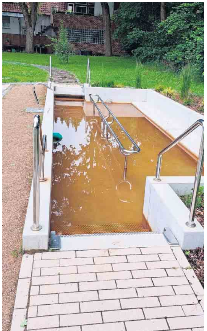
Tretbecken im Eggelandpark immer noch nicht nutzbar