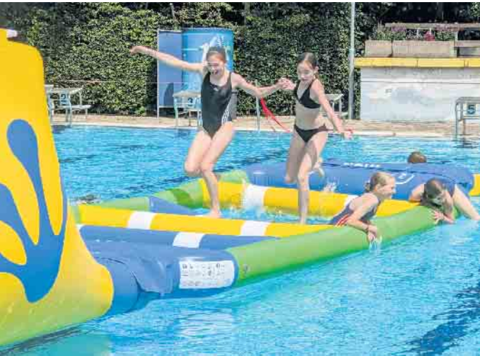
Der neue Wasserspiel-Parcours im Bad Driburger Freizeitbad kommt gut an.