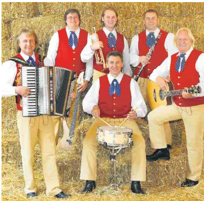
Die Original Steigerwälder aus Franken bringen in kleiner Besetzung einen Hauch Bayern nach Westfalen bei der Bayrischen Sommernacht im Hotel am Park am 28. August.

bereits fünf Goldene Schallplatten sowie eine Platin-Schallplatte erhalten haben. Es wird ein Abend mit viel guter Laune, leckeren Schmankerln, Lederhosen und vielleicht auch manch schönem Dirndl.