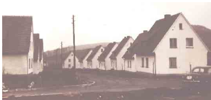
Siedlungshäuser in der Johannisstraße

Bad Driburger zu einem fröhlichen Sommerfest am Samstag, 30. August, ein. Start ist um 16 Uhr mit Kaffee und Waffeln. Es folgt ein Wettschießen traditionell mit der Armbrust. Auch für die Unterhaltung der Kinder wird gesorgt. Es ist zwar noch einige Wochen bis dahin, alle Interessierten sollten sich diesen Termin aber schon mal vormerken. HK