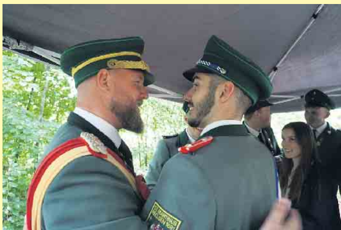
Auch beim Kronprinzen gehörte der noch amtierende König Pascal Focke zu den ersten Gratulanten