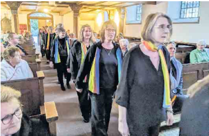
Singend zieht der Chor in die Kirche ein.

Gospelchor Spirit Voices und Kirchenband Gegenwind gestalten mitreißendes Konzert in der evangelischen Kirche am Kurpark