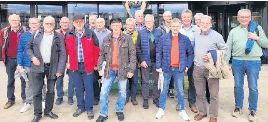
Besuchergroupe aus Neuenherse vor dem Landtag in Düsseldorf

Auf Einladung des Landtagsabgeordneten Mathias Goeken besuchten einige interessierte Neuenheerser Mitbürger den Landtag in Düsseldorf.