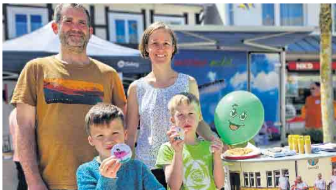
Glückliche Gesichter bei Besuchern

ziellem Kundenwunsch vor Ort hergestellt, fand an allen drei Tagen großen Absatz, sowohl bei Einheimischen als auch bei Besuchern und Kurgästen. Ebenso waren die selbst gestalteten „Sorgenwürmer“ und Kerzen gut nachgefragt. Die belgischen Waffeln fanden auch wieder zahlreiche hungrige Abnehmer. Die „Buttons“ erfreuten neben den Malbüchern und Stiften am Samstag und Sonntag ebenfalls junge sowie alte Gäste des Infostandes der Selbsthilfegruppe. Dazu erleichterten die Rampen, die pro barrierefrei - bad driburg e. V. der Stadt zur Verfügung gestellt hat und an den drei Tagen um eigene Rampen noch ergänzt wurden, das Überqueren von Kabelbrücken. Ein behindertengerechtes WC war auf dem Winzerfest jedoch leider nicht aufgestellt worden. Weitere Informationen unter www.probarrierefrei.de oder telefonisch unter 015112483764.