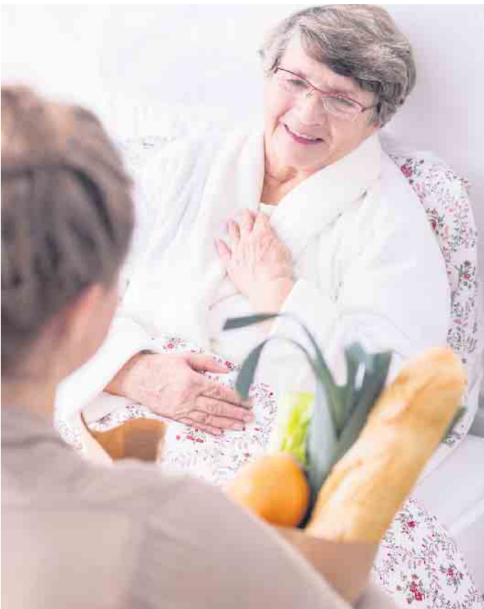
Hospizbegleiterinnen und -begleiter kümmern sich um sterbenskranken Menschen und entlasten die Angehörigen.