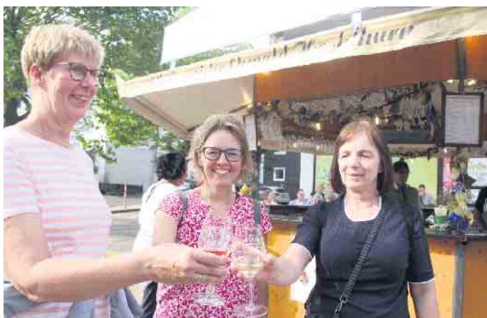
Tolle Stimmung beim ersten Bad Driburger Winzerfest.

die Assler Deele mit Zwiebelrostbraten und vegetarischen Wraps, Das Bad Driburger Restaurant Brand's hatte extra für das Winzerfest köstliche Winzerflammkuchen kreiert. Kunkels Eck servierte deftige Winzersteaks im Brötchen. Der Braune Hirsch sorgte mit Rieslingsuppe und einem Winzersteak mit Röstzwiebeln für Gaumenfreunden. Bei der Fleischerei Lutz Zimmermann drehte sich ein Spanferkel. Der Werbering war mit herzhaften Waffelvariationen dabei. Das Restaurant La Estancia grillte leckere Gambaspieße und der Rewe war ebenfalls mit Flammkuchen dabei. Die Weinhandlung Weinglas hatte sich gegen den Trend für das Grillen von Bratwürstchen entschieden. Es gab auch einen Bierstand. So kamen aber auch wirklich alle Besucher auf ihre Kosten.