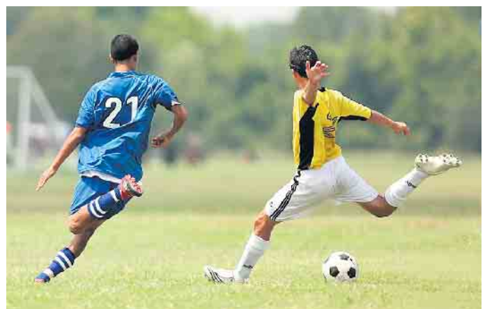
Die Stadt Bad Driburg fördert die Jugendarbeit ihrer Vereine.

Ein Rechtsanspruch auf Gewährung von Zuschüssen besteht nicht. Die Zuschussgewährung erfolgt gemäß den am 01.01.1986 in Kraft getretenen Richtlinien zur Förderung der Jugendarbeit durch die Stadt Bad Driburg.