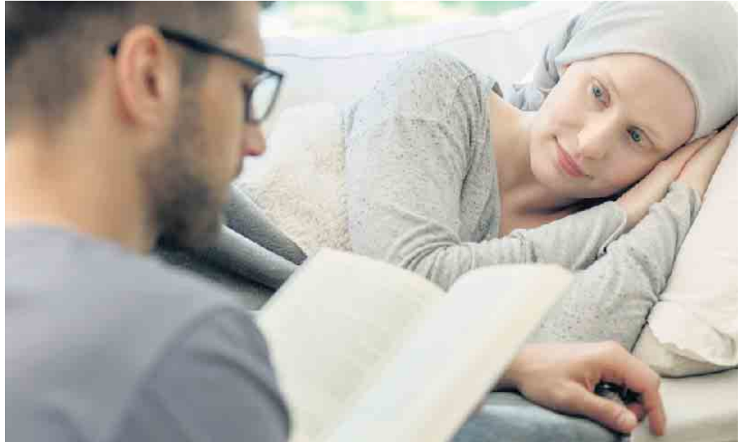
Bei der Hospizarbeit geht es darum, sterbenskranken Menschen Zuwendung zu schenken - beispielsweise, indem man ihnen vorliest.

Diese Aufgabe übernehmen deutschlandweit mehr als 50.000 ehrenamtliche Hospiz-