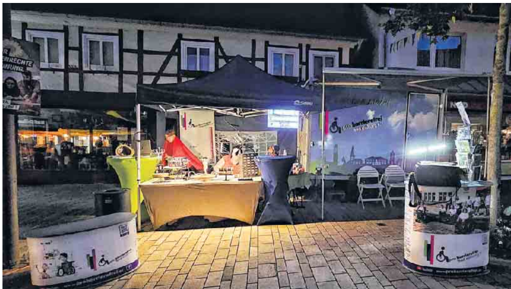
Der Stand von pro barrierefrei bei abendlicher Stimmung

(ag) Die Selbsthilfegruppe pro barrierefrei - bad driburg e. V. präsentierte sich vom 7. bis zum 9. Juni