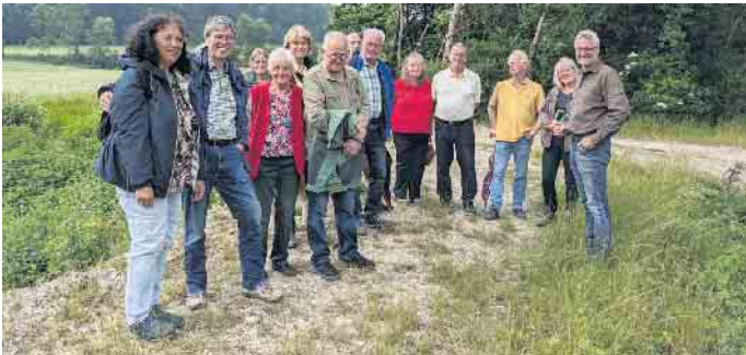
ÖDP Bad Driburg