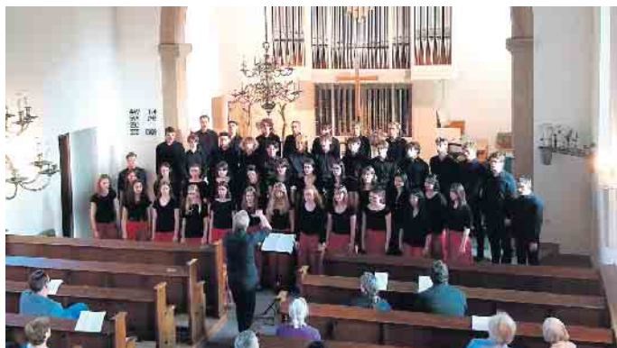
Der Kammerchor des Helmholtz-Gymnasiums aus Karlsruhe begeisterte das Publikum.

Die 44 Sängerinnen und Sänger des Kammerchores boten eine breite Auswahl an Liedern dar. Sowohl geistliche Lieder wie „Trös-