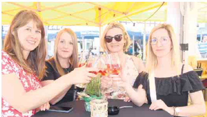
Hier wird mit einem spritzigen Sommercocktail angestoßen.