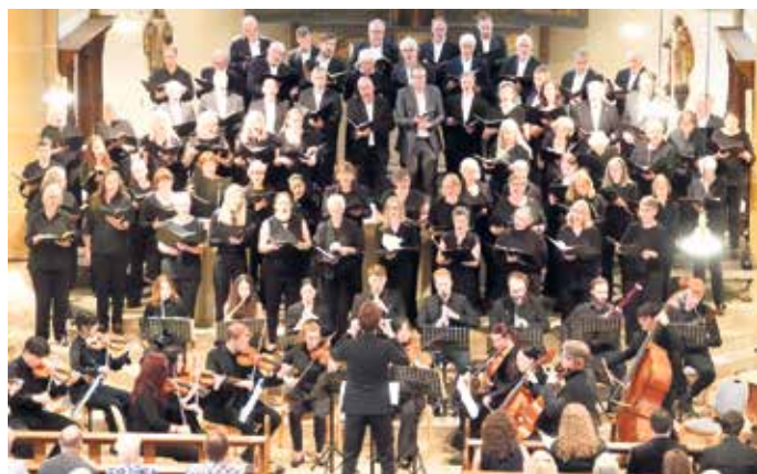
Der Projektchor während des Konzertes