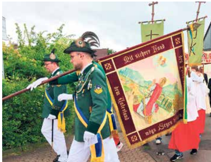
Vertreter der Bürgerschützengilde.