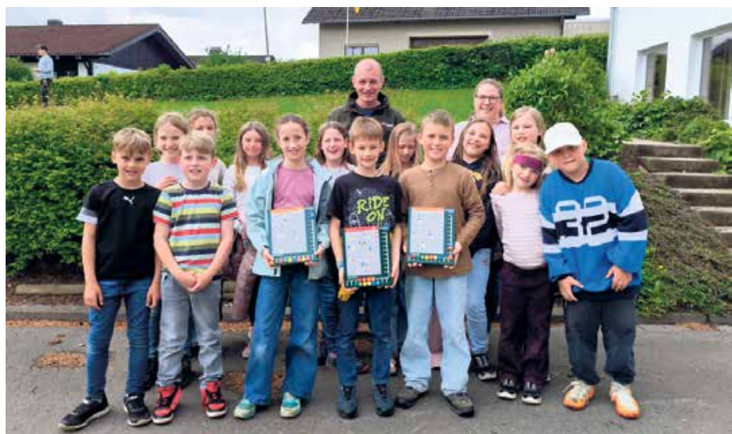
Übergabe der neuen LOGICO-Lernmaterialien: Der erste Vorsitzende des Fördervereins überreicht im Beisein der Klassenlehrerin die durch eine Spende der VerbundVolksbank OWL eG finanzierten Materialien an die Schülerinnen und Schüler der 3. Klasse

„Solche Anschaffungen sind für uns als Förderverein nur dank externer Unterstützung möglich“, betonte der Vorstand. „Wir freuen