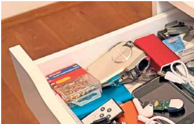
Oft sammeln sich in unseren Schubladen kleine „Technik-Friedhöfe“ an. Sie enthalten wertvolle Rohstoffe, die sich zurückgewinnen und wiederverwerten lassen.

Alte Elektronikgeräte beim Hausputz aussortieren und zum Recycling geben