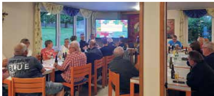
Während der Jahreshauptversammlung informierte der Vorstand die Mitglieder anhand einer Präsentation über Kassenbericht, Veranstaltungen und die Planungen für die kommenden Termine.

Mitgliedern. Neben dem Rückblick wurden zahlreiche Ideen für die zukünftige Vereinsarbeit besprochen. Der Austausch zeigte das große Engagement und die gute Gemeinschaft im Verein. Die nächsten Termine stehen fest: Am 18. Juli findet das Sommerfest statt, am 19. Dezember der Adventsnachmittag. Der Kinderkarneval folgt am 10. Januar 2027, bevor am 30. Januar 2027 der Galaabend gefeiert wird. Dreimal Pümissen Wui Wui