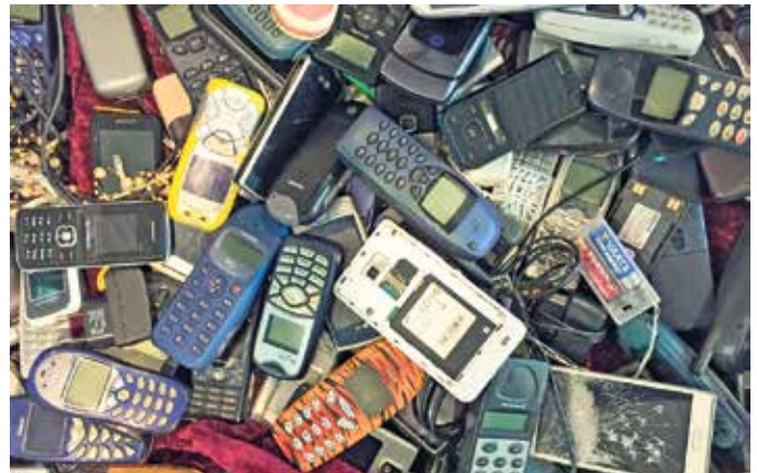
Wertstoffhöfe und Elektronikhändler nehmen alte elektronische Geräte an und führen sie der Wiederverwertung zu.

Gestern noch technisches Highlight und Objekt der Begierde, heute verstaubt im Schrank: Wer erinnert sich nicht an klobige Mobiltelefone, tragbare CD-Player oder den legendären Game Boy? Auch Geräte wie der Walkman oder der Discman galten einst als Inbegriff moderner Unterhaltung. Doch schnelle Innovationszyklen lassen elektronische Geräte oft schon nach wenigen Jahren alt aussehen. Besonders bei Smartphones schreitet die Entwicklung rasant voran - leistungsfähigere Prozessoren, bessere Kameras und neue Funktionen schicken Vorgängermodelle in den Ruhestand. Die Folge: In Abstellkammern, auf Dachböden und in Schubladen sammeln sich kleine „Technik-Friedhöfe“ an.