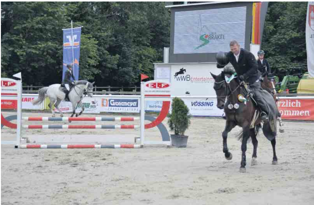
Ehrenrunde beim letztjährigen Sommerturnier 2024.

Sowohl in der Reithalle (Dressur) als auch auf dem Springplatz wird an den drei Turniertagen interessanter Sport geboten. Geritten wird im Springen bis zur Klasse M** und in der Dressur bis zur Klasse S. Es finden Qualifikationsprüfungen für die Sparkassen-Trophy, Volksbank Junioren-Springförder-Cup 2025/2026 der VerbundVolksbank OWL eG und der Pony-Führzügel-Trophy OWL sowie Bewertung der Kreismeisterschaft des Kreisreiterverbandes Höxter-Warburg statt. Begonnen wird am Freitag auf dem Springplatz mit den Prüfungen für junge Pferde (Springpferdeprüfung) sowie parallel finden in der Reithalle die Dressurprüfungen für junge Pferde statt. Höhepunkte des sportlichen Wochenendes im Bereich Springen sind die M-Springen am Samstagabend und Sonntagnachmittag. Die Dressurprüfungen Klasse S beginnen am Sonntagnachmittag. Der Eintritt zum Turniergelände ist an allen Tagen frei. Am Sams-