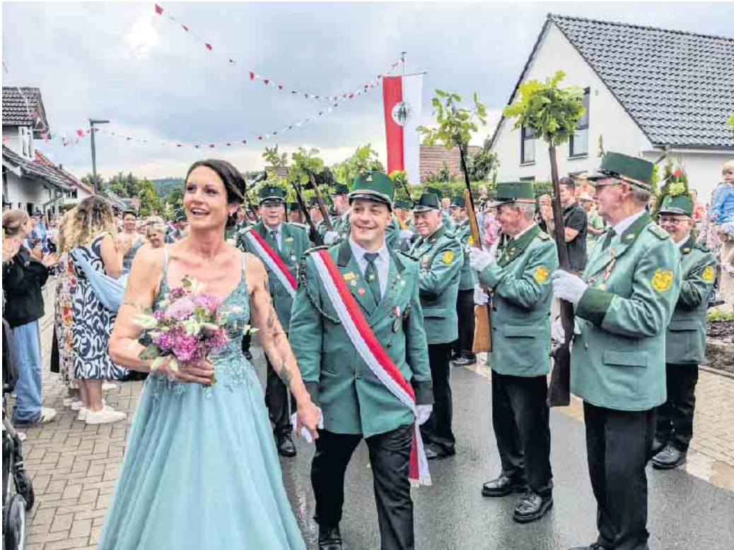
Ein galanter Hofstaat aus fünf Paaren begleitet die Schützenmajestäten.