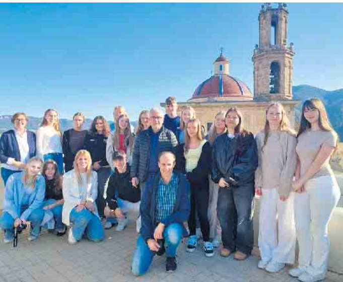
Die Schülerinnen und Schüler wurden nach einer weiten Anreise mit bestem spanischem Wetter belohnt.

Am Freitag nahmen einige von uns am Schultriathlon teil - ein sportlicher Abschluss einer unvergesslichen Woche. Am Abend hieß es Abschied nehmen, mit vielen neuen Eindrücken und Freundschaften im Gepäck.