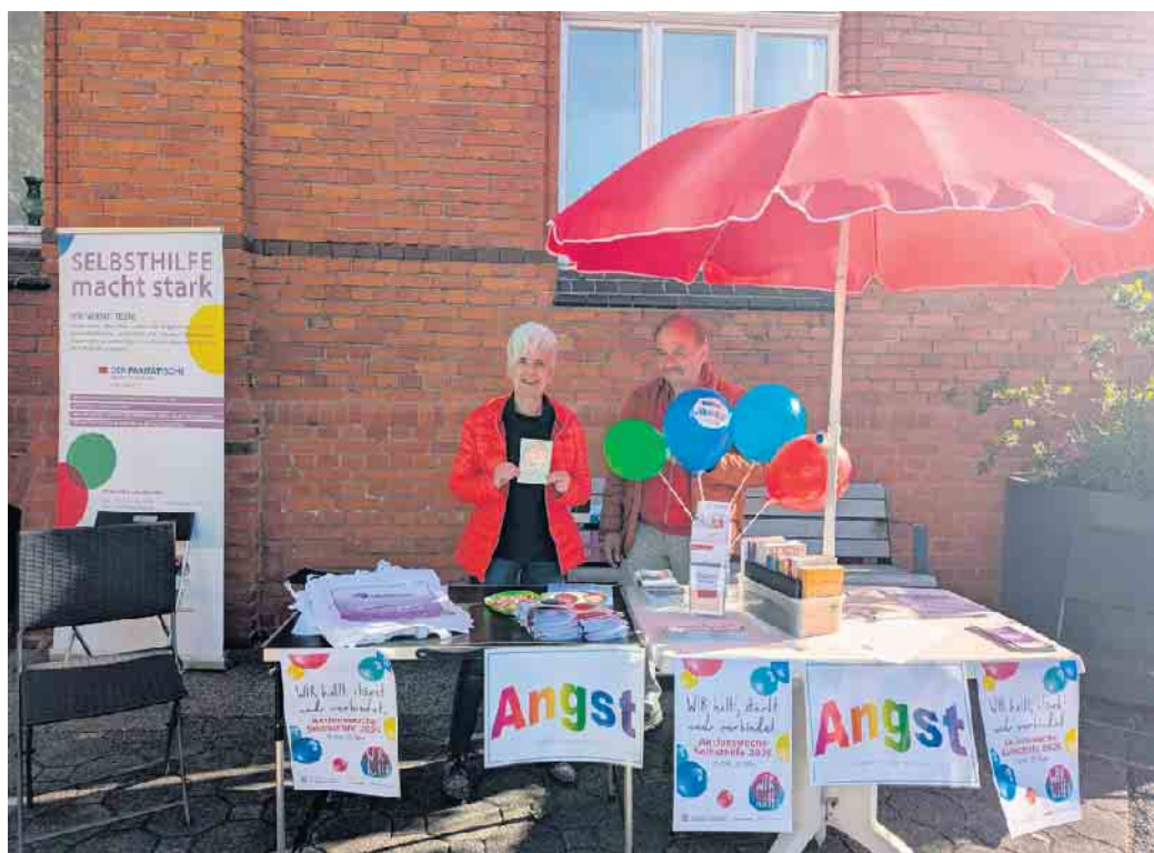
Infostand auf den Wochenmarkt in Bad Driburg