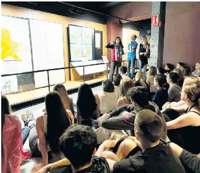
Auch historische Orte standen auf dem Programm in Capellades.