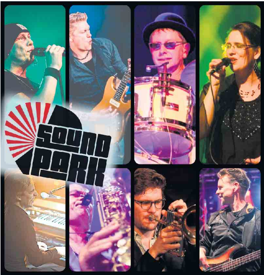
Die achtköpfige Band Soundpark spielt am 8. August im Eggeland-Park.