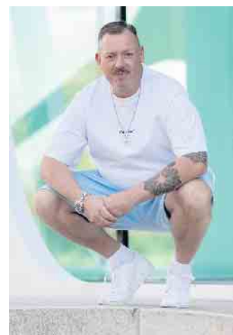
Am 22. August sorgt DJ Sventastic mit seiner Mallorca-Party für das richtige Sommerfeeling.

Den Auftakt macht in diesem Jahr eine der bekanntesten und beliebtesten Bands der Region: MANIAC. Seit über 30 Jahren tourt die Paderborner Band um