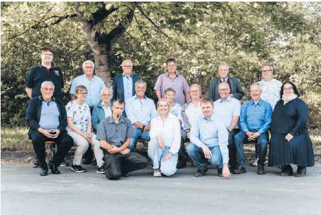
Die unabhängige Wählergemeinschaft Bad Driburg ist für die Kommunalwahl gut aufgestellt.