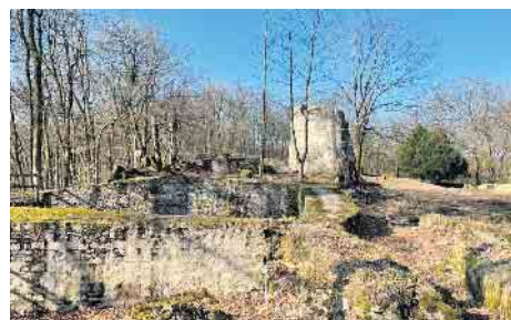
Blick über die Ruine, Iburg, Bad Driburg, 03/2025