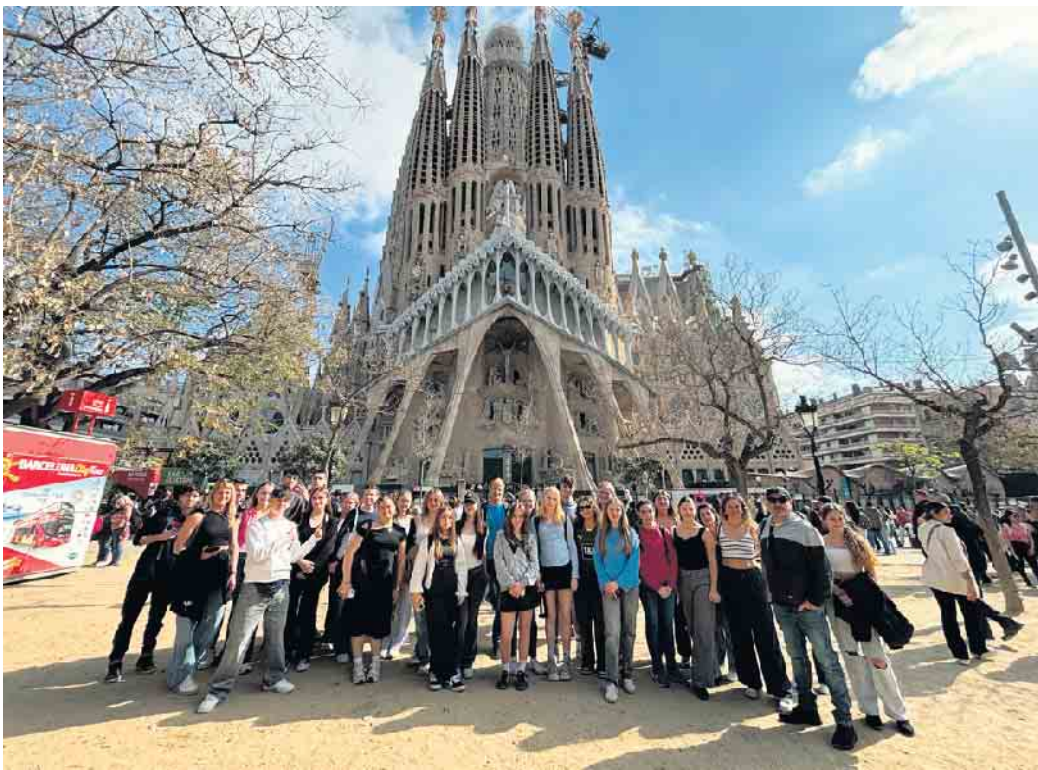
Am Mittwoch besuchte die Gruppe dann Barcelona und nahm viele neue Eindrücke der Großstadt mit zurück.

Mittwoch stand ganz im Zeichen Barcelonas: Wir bestaunten die