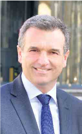
Ihr Burkhard Deppe Bürgermeister

Straße 64, schräg gegenüber der Kirche Peter und Paul. Zielgruppe ist neben den Erwachsenen besonders die Gruppe der Kinder und Jugendlichen. Auf sie wartet am 10. Juli eine spannende Entdecker-Rallye durch die neue Bücherei mit versteckten Stempelstationen. Außerdem können BlütENZAUBER-Lesezeichen gebastelt werden - ein farbenfrohes, naturinspiriertes Kreativangebot für kleine Leser. Großspielzeug, ein Glücksrad und Kinderschminken wird es ebenfalls geben! Wir freuen uns auf zahlreiche interessierte Gäste!