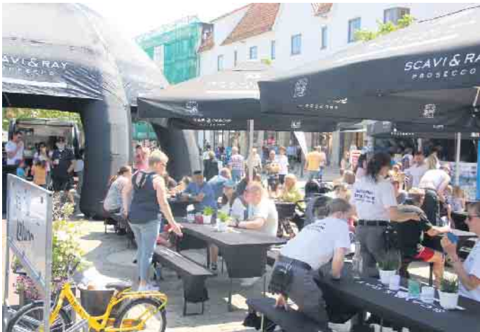
Im Biergarten kann man genüsslich den Battles zusehen.

Kletterberge und vieles mehr vereint. Körperliche Bewegung und vor allem viel Spaß hatten die Kids zu meistern.