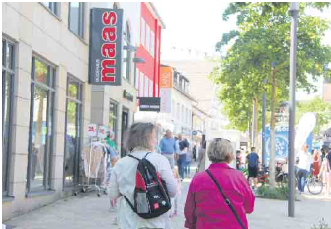
Viele Besucher nutzten den verkaufsoffenen Sonntag zum Shoppen.