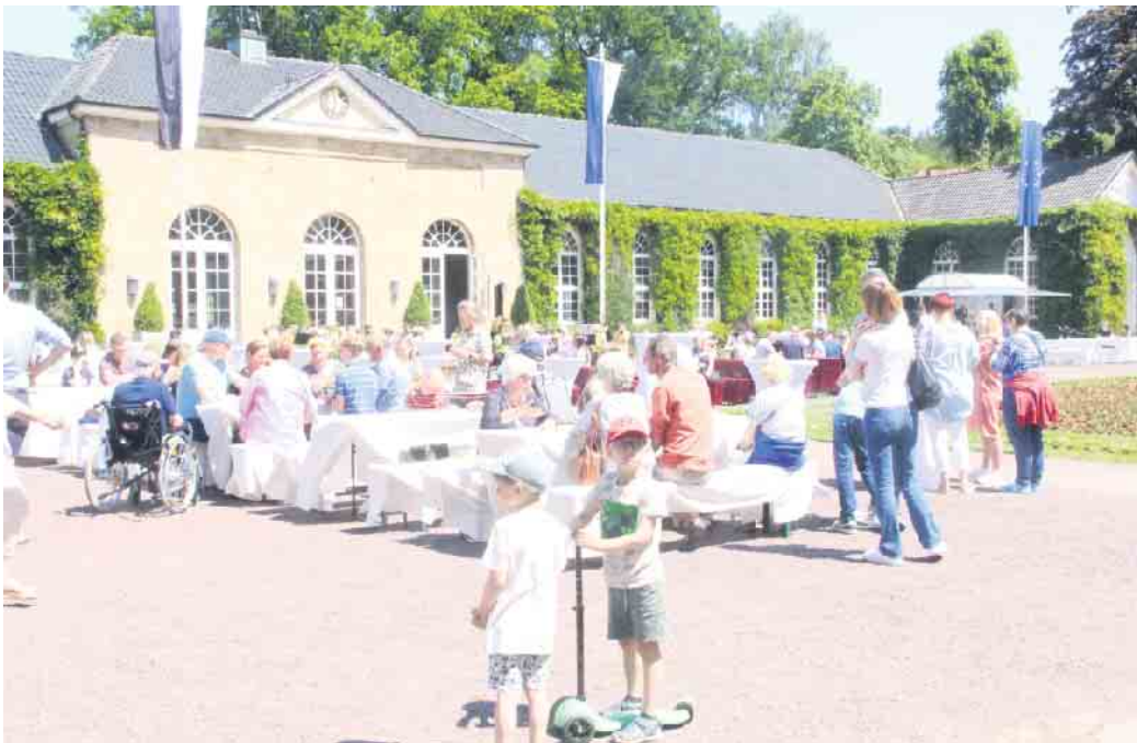
Auch beim Parkfest im Gräflichen Park konnte man sich eine schöne Zeit machen.

Bereits im Vorjahr konnte der Schule unter der Iburg in Bad Driburg ein Betrag von 1.670