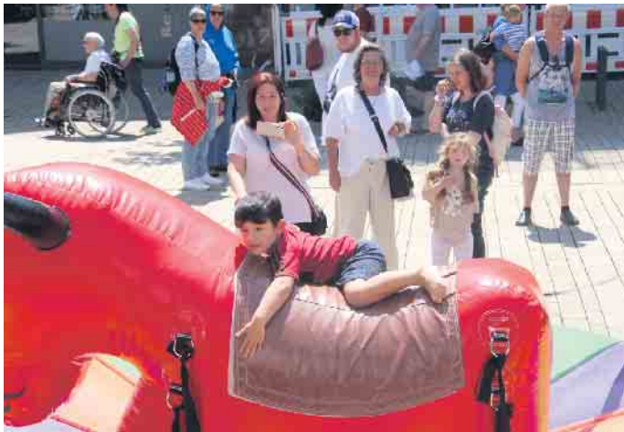
Beim Sommerfest in Bad Driburg gab es viel Spaß für Groß und Klein.