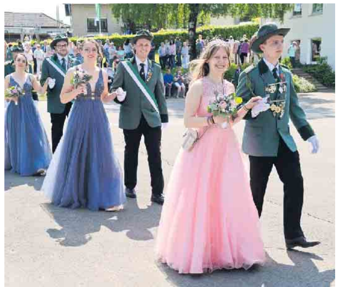
Der Junghofstaat bei der Parade