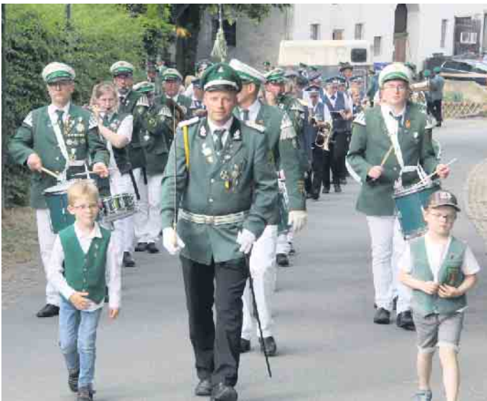
Die St. Martinus Schützenbruderschaft Reelsen feiert ein mitreißendes Schützenfest.