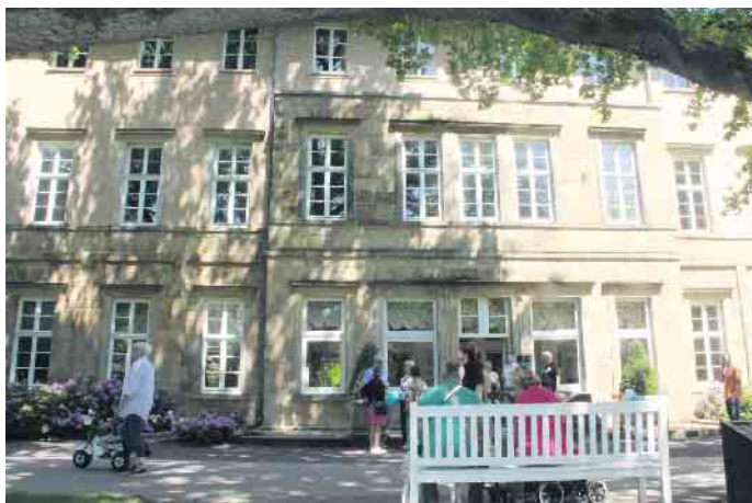
Das neue MVZ ist im historischen Stahlbadehaus des Gräflichen Parks angesiedelt.