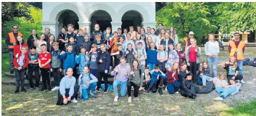
Die Teilnehmerinnen und Teilnehmer der Schulwallfahrt vor der Kluskapelle.