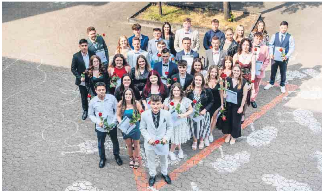
Die Abiturient:innen 2023 der Gesamtschule Bad Driburg