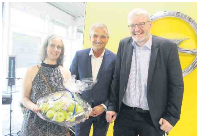
Bad Driburgs Bürgermeister Burkhard Deppe gratuliert zum Firmenjubiläum.