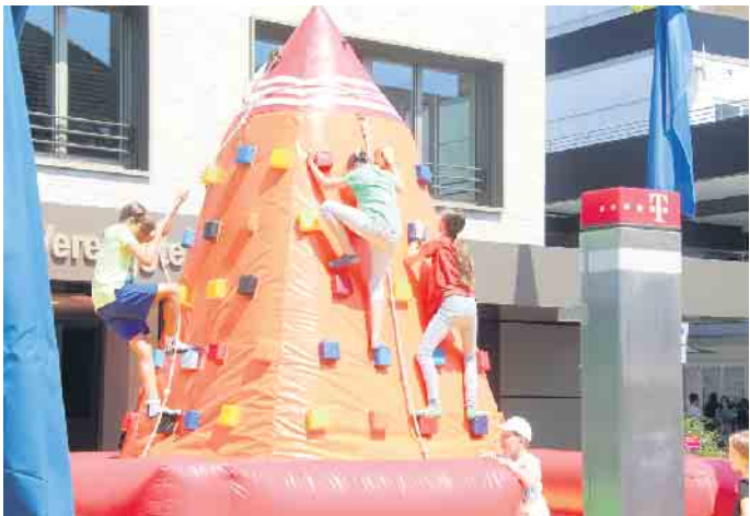
Der Kletterberg am Reiffeisenbrunnen zog Kinder magisch an.