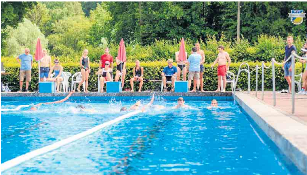
Start des Triathlon im Neuenheerse Freibad

Das Triathlon-Team, das aus Mitgliedern der ausrichtenden Vereine SV Neuenheerse, FC Neuenheerse/Herbram und Förderverein Freibad Neuenheerse besteht, hofft auf eine gute Teilnehmerzahl. Während die Königsdisziplin „Halb-Distanz“ (750m Schwimmen, 20 km Radfahren und 5 km Laufen; ab 11 Uhr) bereits gut gebucht ist, gibt es bei den weiteren Disziplinen „Jedermann“ bzw. „Team/Familien“ (150m / 9km / 2,5km; ab 14.30 Uhr) und „Kinder“ (bis 14 Jahre; 50m / 3km / 1km; ab 16 Uhr; auch als Team möglich) noch ausreichende Kapazitäten. Bei den Team/Familien Wettbewerben können die einzelnen Disziplinen auf mehrere Teilnehmer aufgeteilt werden. Hier hoffen die Organisatoren vor allem auf noch mehr Teilnehmer aus dem Dorf bzw. den Nachbarorten. Gestartet wird jeweils mit dem