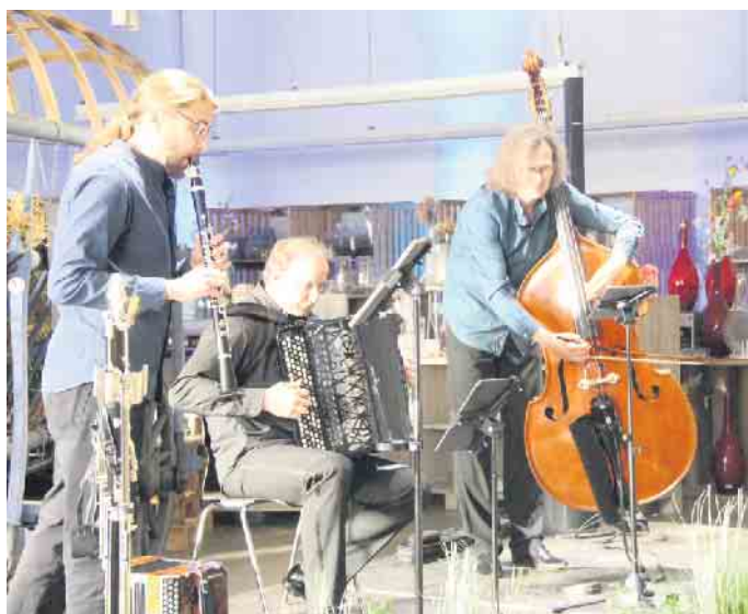
Das Trio Firasso auf der Konzertbühne in der Bad Driburger Manifattura.

zertreihe. Klarinettenfreunde können sich schon mal Sonntag, 2. Juni, 2024 vormerken. Das ist dann der nächste Saisonabschluss in der Manifattura, bei der das Klarinetten trio Schmuck zu Gast sein wird. Das vollständige Programm der neuen Saison findet sich auf der Homepage (musikgesellschaft-bad-driburg.de).