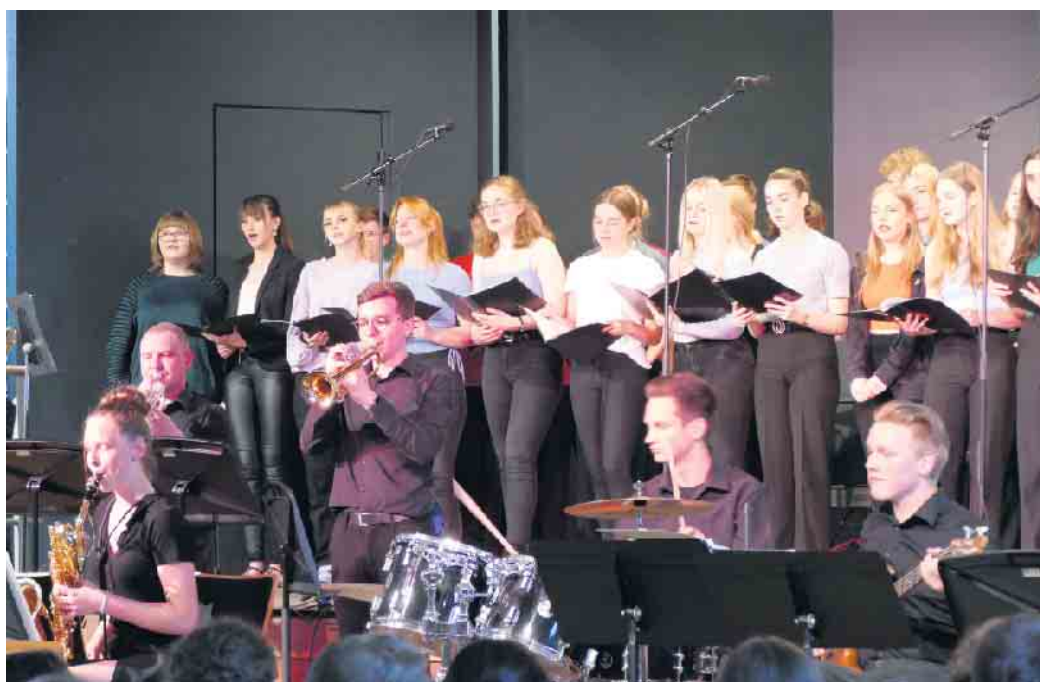
Der Oberstufenchor beeindruckte zusammen mit der hervorragenden Begleitband.

Welche Klangvielfalt eine Musikgruppe entfalten kann, wurde beim anschließenden Auftritt des Schulorchesters offenbar: Es trug neben „Das große Tor von Kiew“ aus Mussorgskis „Bilder einer Ausstellung“ ein Medley von Hits von Michael Jackson vor. Mit dem anschließenden Song „Music“ von