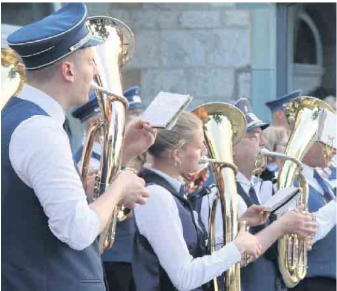
Die Blaskapelle Reelsen begleitet das Schützenfest musikalisch.