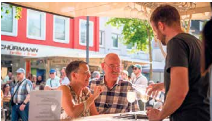
Tipps direkt vom Winzer bekommen die Besucher beim 3. Winzerfest in Bad Driburg.

Bei Versicherungen wollen Sie klare Verhältnisse / Mit einem zuverlässigen Partner an Ihrer Seite.