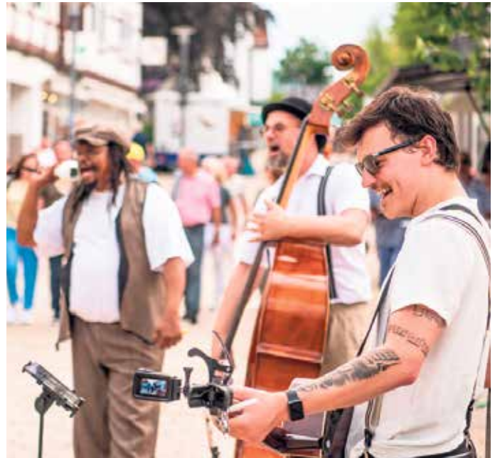
Las Polkas spielen die Hits der letzten 63,5 Jahre auf ihre ganz besondere Art und Weise.

Parallel zum Weingenuss lädt der Werbering Bad Driburg am gesamten Wochenende - inklusive eines verkaufsoffenen Sonntags von 13 bis 18 Uhr - zum entspannten Bummeln durch seine individuellen