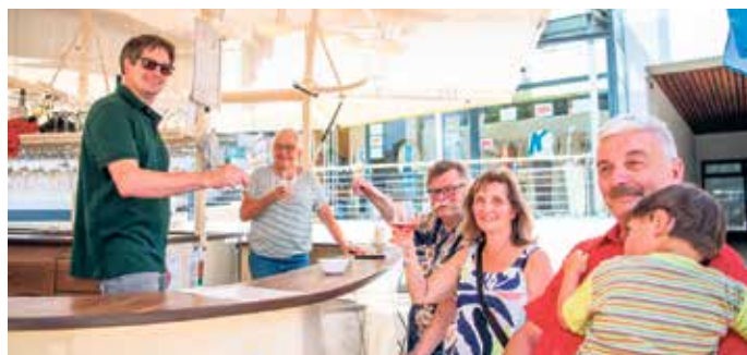
Das Weingut Höhn aus Rheinhessen freut sich auf viele nette Gäste und gute Stimmung.