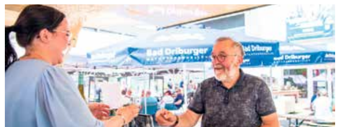
Das Weingut Schweppenheiser aus der Pfalz ist auch in diesem Jahr sowohl auf dem Winzerfest als auch beim Winzerdinner mit dabei.