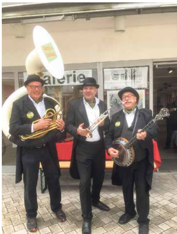
An allen drei Tagen des Bad Driburger Weinfestes spielt das Trio Hardy's Jazz Band eine bunte Mischung aus traditionellem Jazz und Dixieland - live und unplugged ziehen sie durch die Straßen.

Einrichtungshaus Maas GmbH & Co KG Lange Strasse 104a · 33014 Bad Driburg Tel.: 05253-2522