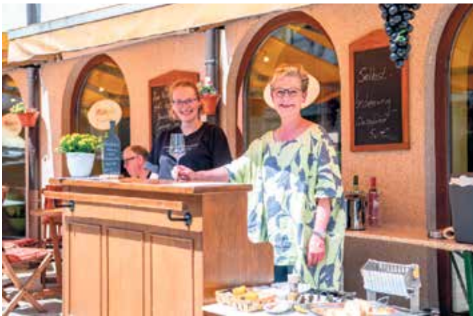
Viele Geschäfte wie das „Weinglas Bad Driburg“ öffnen auch am Sonntag ihre Türen.

mit den Erzeugern mehr über die Besonderheiten ihrer Reben und Weingüter zu erfahren und sich die köstlichen Weine schmecken zu lassen.