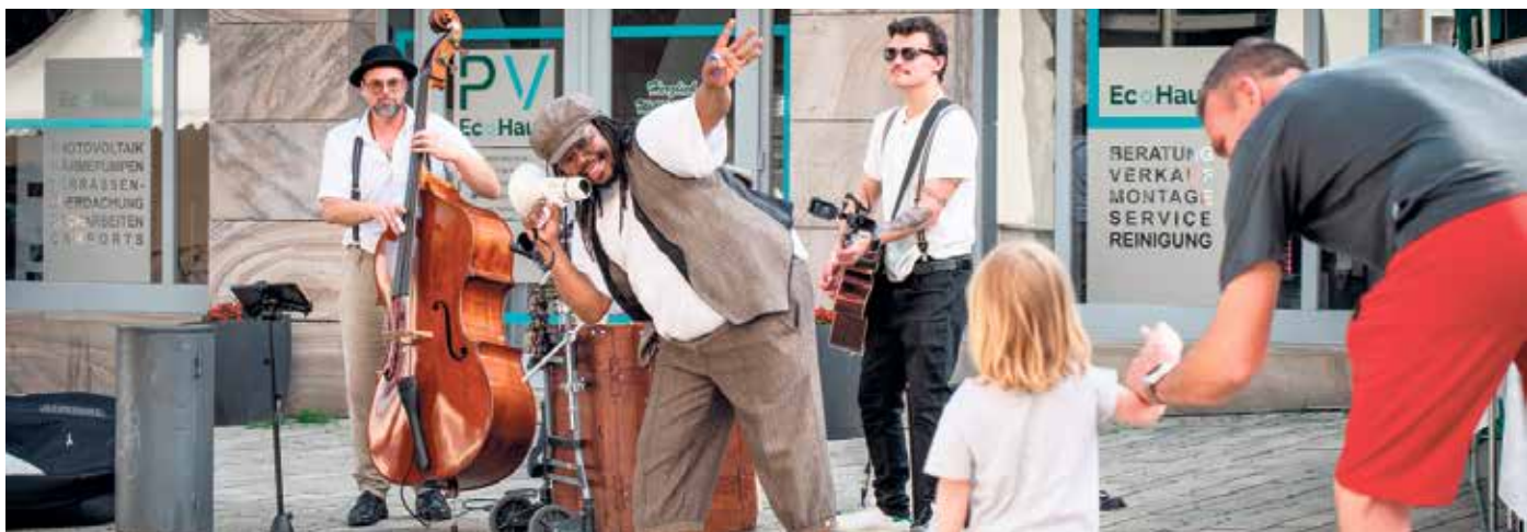
Am Sonntag sorgt das Quartett LAS POLKAS mit Kontrabass, Akkordeon und Kofferschlagzeug für schwungvolle musikalische Unterhaltung.