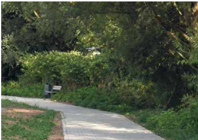
Die Wegeführung entlang des Katzohlbaches (Foto) soll fortgesetzt werden.

Attraktive Wegeverbindung entlang des Katzohlbaches zwischen Konrad-Adenauer-Ring und Mühlenstraße