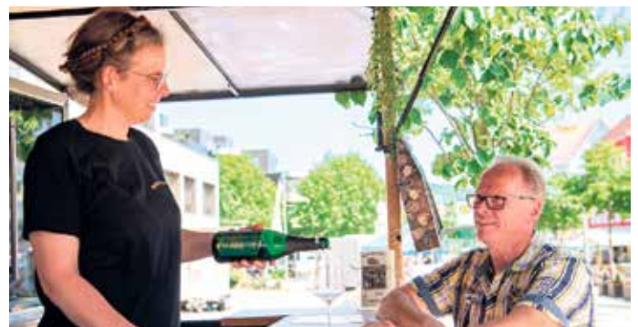
Das Weingut Ernst Steffens von der Mittelmosel freut sich auf ein Wiedersehen 2026 in Bad Driburgs Fußgängerzone.