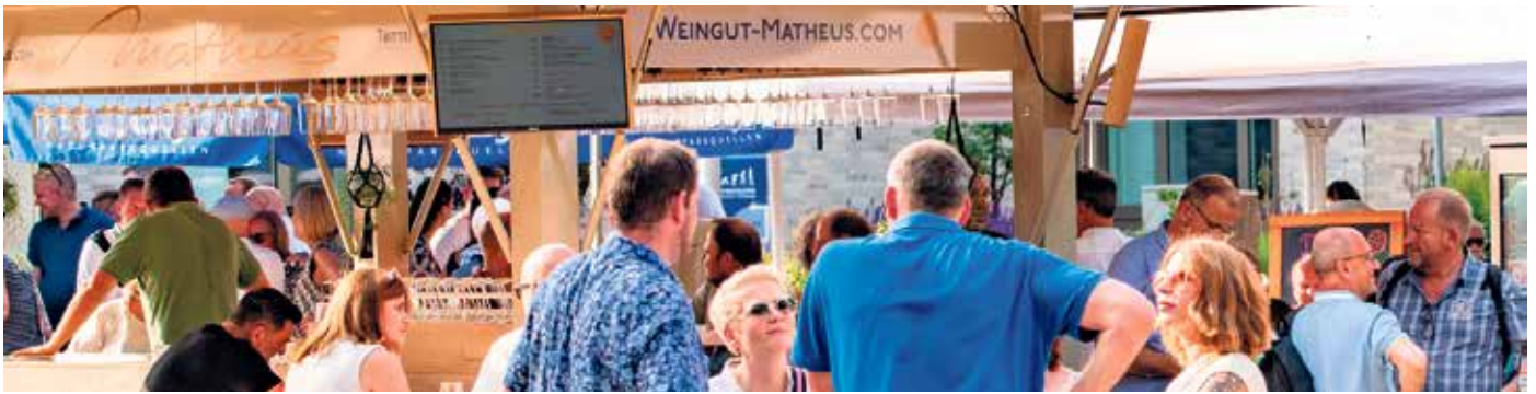
Urbanes Flair am Weinstand von Familie Matheus aus Trittenheim an der Mosel.

Ort und freuen sich auf die besondere Atmosphäre in Bad Driburg. Aber auch neue Aussteller wie das Wein-