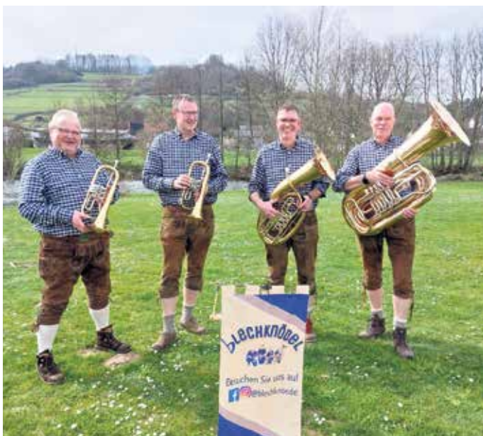
Die „Blechknödel“ sind mittlerweile fester Bestandteil bei Bad Driburger Stadtfesten und spielen am Samstag.