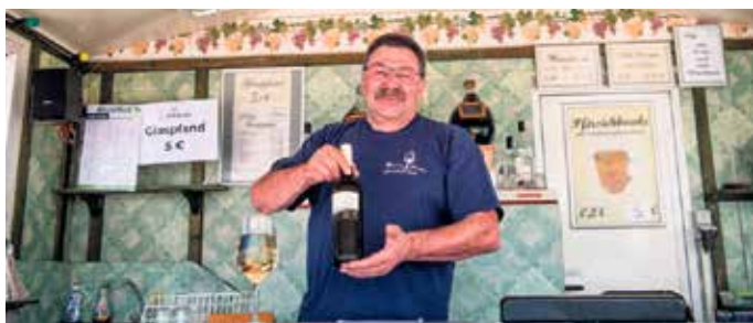
Das Ferienweingut Herres aus Klüsserath (Mosel) ist auch in diesem Jahr wieder mit seinen Weinen vertreten.