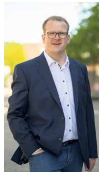
Bürgermeister Tobias Tölle