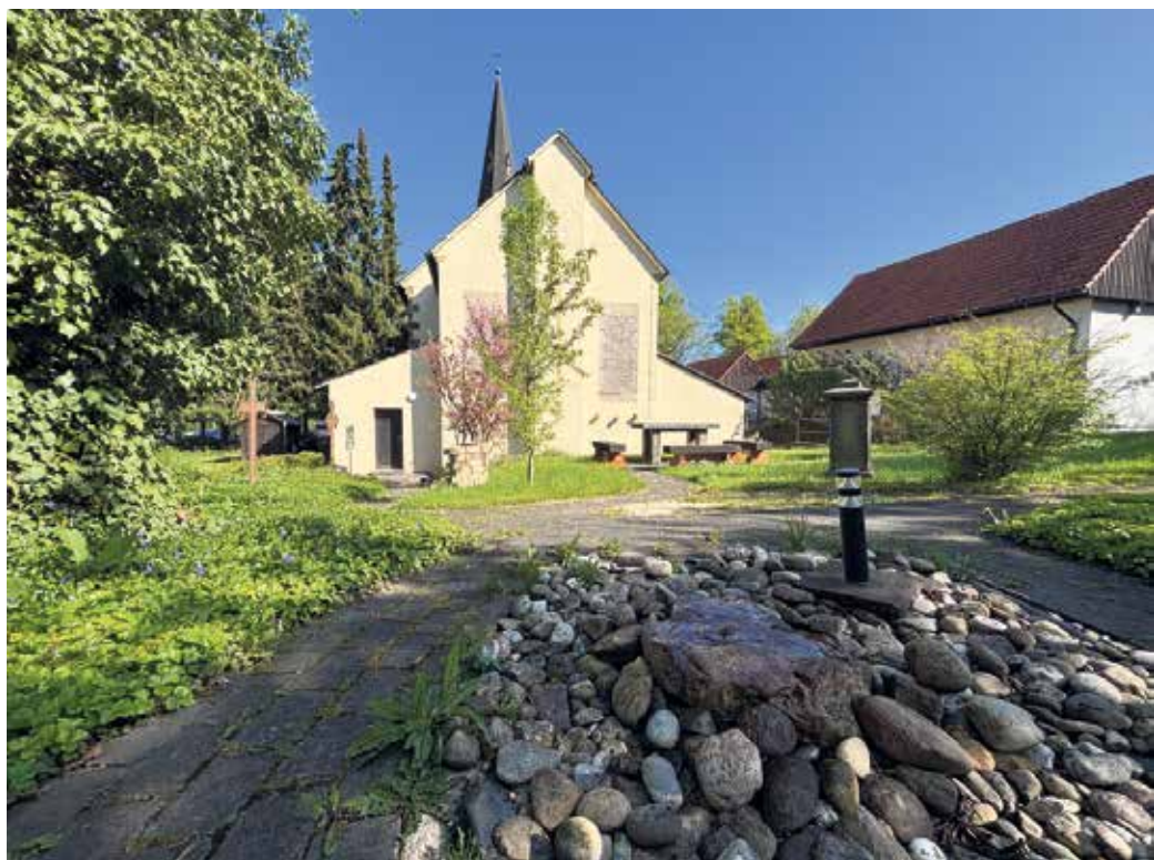
Der Bibelgarten hinter der evangelischen Kirche nimmt auch in diesem Jahr am Tag der Gärten und Parks teil und bietet am Sonntag von 14 bis 15:30 Uhr eine spezielle Führung an.

Inhaltlich werden dabei der Kneipp-Erlebnispfad und die 5 Säulen nach Kneipp vorgestellt. Treffpunkt ist am Parkplatz am Bahnübergang in der Langen Str. 140. Alle genannten Parkanlagen sind das gesamte Jahr frei zugänglich. „Wir laden alle Bürger und Gäste mit ihren Lieblingsmenschen herzlich zum dritten Winzerfest nach Bad Driburg ein“ freut sich Andrea Gründer von der Bad Driburger Touristik GmbH, die zusammen mit dem Werbering Bad Driburg die Stadtfeste in dem traditionellen Heilbad organisiert, auf ein paar unvergessliche Stunden. „Für auswärtige Gäste bieten wir ein spezielles Wochenend-Arrangement „Natur & Genuss“ an, denn vom 12. bis 14. Juni verbinden sich Lebensfreude, Gastlichkeit und landschaftliche Schönheit auf einzigartige Weise in unserer Stadt“ ergänzt die Tourismusefingin gut gelaunt. Weitere Infos: Bad Driburger Touristik GmbH, Lange Str. 87, 33014 Bad Driburg, Telefon 05253 98940, www.bad-driburg.com