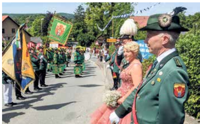
Der Festumzug nimmt Aufstellung zum Abholen der Majestäten.