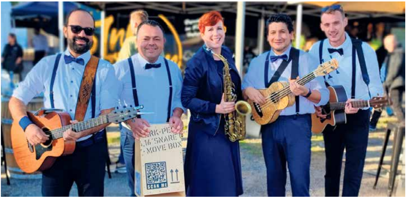
Die interaktive Band RUMBACOUSTIC ist eine Band zum Anfassen, die am Samstag das Publikum mit Kazoos und humorvollen Showeinlagen in die Performance mit einbindet.