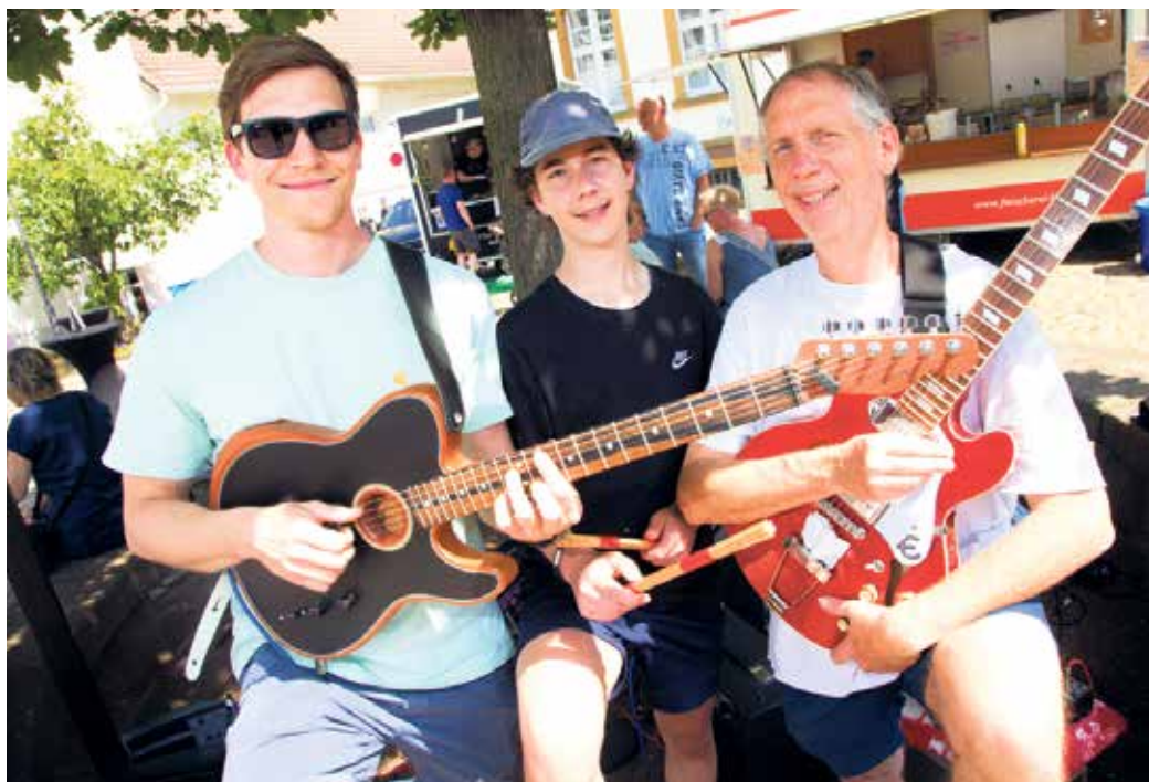
Musikalisch wird das Winzerfest am Freitag um 17 Uhr mit den drei Musikern des Scheel Akustik Trios eröffnet, das Soul- und Blues-Klassiker der 80er- und 90er-Jahre mit viel Spielwitz, Virtuosität und Humor performt.

Fachgeschäfte ein, die ihre Kunden nicht nur mit guter Beratung und herzlichen Gesprächen empfangen, sondern auch besondere Aktionen anbieten. Der Werbering ist zudem mit einer eigenen Verkaufshütte auf dem Fest vertreten, wo kleine Köstlichkeiten passend zum genussvollen Wein der zahlreichen Winzer als vorwiegend deftige Stärkung angeboten werden. Käse, Wurst, Schinken, Brot - gerne etwas fruchtig umrandet und mit regionalem Bezug - lädt das Snackangebot der lokalen Interessengemeinschaft zum Verweilen und Genießen ein! Die Winzermeile wird am Freitag um 17 Uhr in der Fußgängerzone eröffnet, am Samstag startet das Programm um 11 Uhr und an beiden Tagen kann man bis 23 Uhr die schöne Atmosphäre genießen. Am Sonntag können die Besucher von 11 bis 18 Uhr mit den Winzern plaudern und es sich bei unverfälschter Livemusik einfach gut gehen lassen.