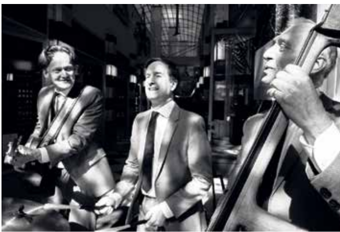
Beim exklusiven Winzerdinner im Restaurant „Pferdestall“ am Freitag, 12. Juni, sorgen die Musiker der Boom Drives Crazy aus Hamburg mit ihrer mitreißenden Energie für ausgelassene Stimmung.