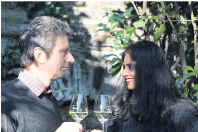
Das Weingut Emil Franz präsentiert besten Riesling von der Mosel.

Zum ersten Bad Driburger Winzerfest präsentieren rund zehn sympathische Winzerfamilien aus den verschiedensten deutschen Anbaugebieten ihre erlesenen Weine. Dazu wird es lang durch die Innenstadt eine imposante Weintheke vom Leonardo-Brunnen bis zum Raiffeisenbrunnen geben. Über zehn Winzer von der Mosel und anderen renommierten Weinanbauregionen Deutschlands präsentieren von Freitag, 7., bis Sonntag, 9. Juni, ihre erlesenen Weine auf dem ersten Winzerfest in der Bad Driburger Fußgängerzone.