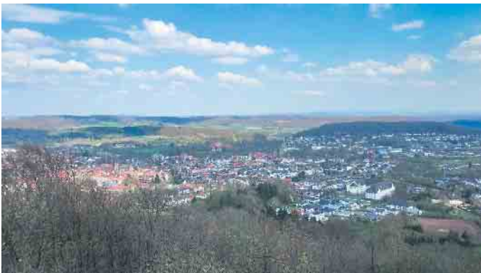
Besucher genießen den atemberaubenden Blick über Bad Driburg und weit ins Land.