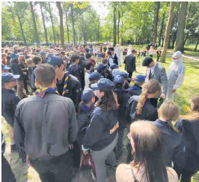
Ein Mordfall muss aufgeklärt werden

natürlich nicht fehlen. Am Pfingstmontag hieß es dann aber leider schon wieder alles abbauen und dann mit dem Zug nach Hause. Aber alle Kinder haben versprochen: „Wir kommen nächstes Jahr wieder mit!“