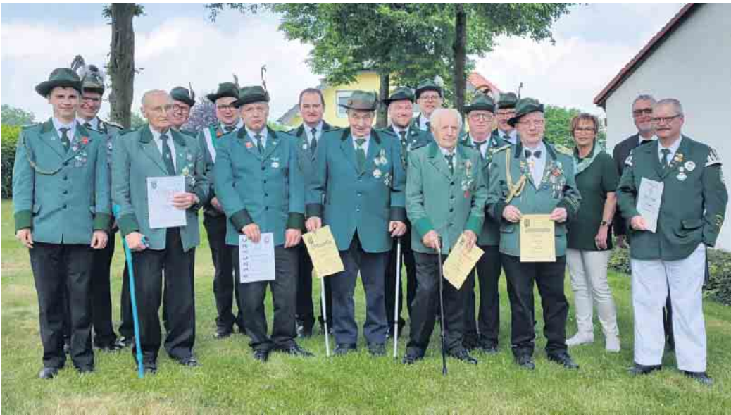
Die geehrten Schützen der Bruderschaft Pömbesen.

Pömbesen. In vollen Zügen konnte die Schützenbruderschaft Pömbesen über Pfingsten das Schützenfest der St. Fabian-Sebastian-Bruderschaft genießen. Drei Tage lang wurde das Fest im Zeichen der Fahnen der Bruderschaft gefeiert. Die Fahnen