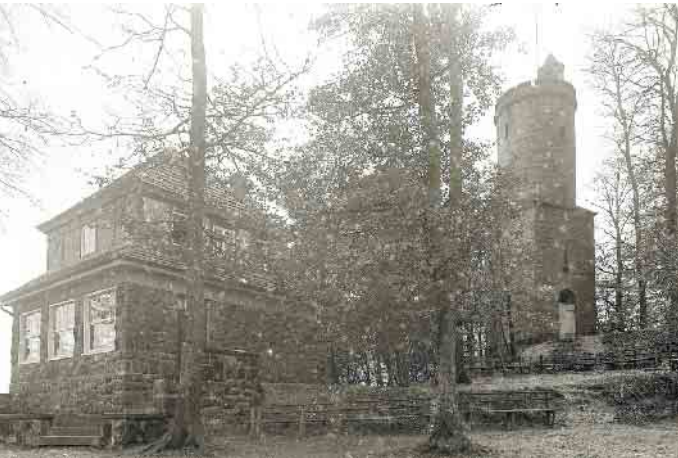
Kaiser-Karls-Turm mit Sachsenklause aufgenommen nach 1925.

Der Kaiser-Karls-Turm ist eine viel besuchte Sehenswürdigkeit im Eggegebirge. Viele Wanderer, Touristen und Einheimische steigen die 82 Stufen der Wendeltreppe hinauf, um von dort oben eine beeindruckende Fernsicht zu genießen. Jahr für Jahr begeistert ein atemberaubender Blick auf Bad Driburg und die weite Umgebung zahlreiche Besucher. Bereits 1872 wurde der Bad Driburger Kaiser-Karls-Verein gegründet. Sein Ziel war es, auf der Iburg ein Denkmal für Karl den Großen zu errichten. 1899 löste sich der Verein wegen fehlender finanzieller Mittel auf. 1898 wurde der Driburger Verschönerungsverein (seit 1932 Heimatverein Bad Driburg) gegründet, der den Bau eines massiven Aussichtsturms auf dem Iburg-Kegel vorantrieb. 1901 begannen die Ausgrabungen auf der Iburg und weckten das Interesse an diesem Gebiet. Auf der Generalversammlung am 2. Januar 1902 beschloss der Verschönerungsverein, den Bau des Kaiser-Karls-Turms in die Wege zu leiten. Die Grundsteinlegung fand am 9. August 1903 statt. Baurat Herzog aus Hildesheim stellte den Bauplan zur Verfügung. Die Stadtverwaltung unterstützte das Projekt mit der unentgeltlichen Bereitstellung von Sandsteinen aus dem nahegelegenen Steinbruch Hausheide. Die Fertigstellung schritt zügig voran, obwohl Mau-