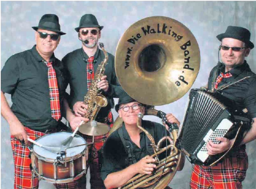
Die Walking Band aus Bad Driburg ist von der Tradition der Marching Bands inspiriert.