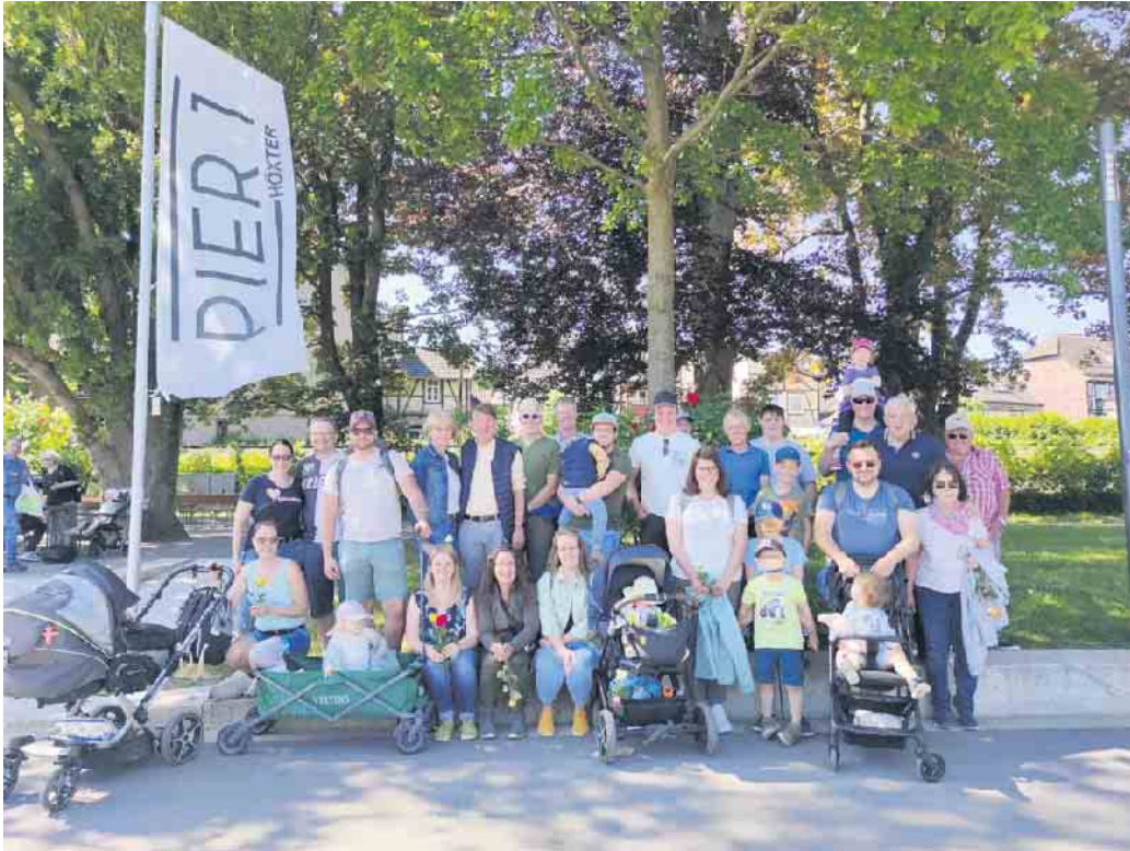
Musikverein Pömbesen versammelt sich am Pier 1, bereit für eine sonnige Flussfahrt auf der Weser