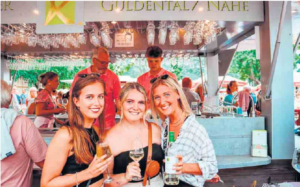
Beim ersten Bad Driburger Winzerfest ist auch das Weingut Klöckner aus Guldental dabei.

Winzerfamilien präsentieren sich vom Leonardo-Brunnen bis zum Raiffeisenbrunnen