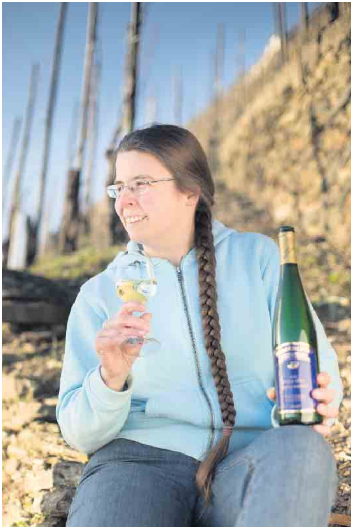
Das Weingut Ernst Steffens hat seinen Sitz in Zell-Merl.

Unterwelt, in denen sich Tradition und Evolution vereinen. Die Anwendung moderner Techniken auf die klassischen Verfahren der Weinbereitung spiegelt