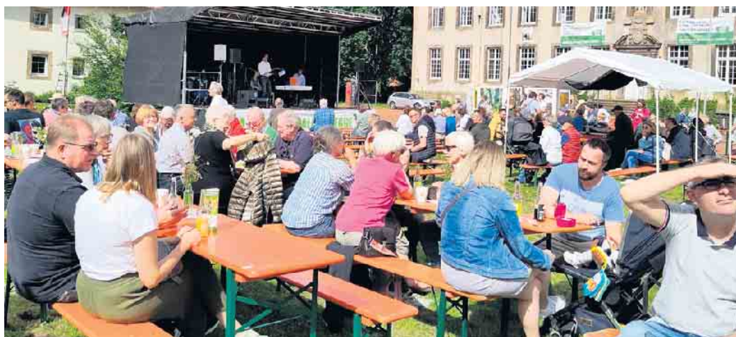
Bei schönstem Wetter feierten die Menschen Ende Mai das Nationalparkfest in Willebadessen.