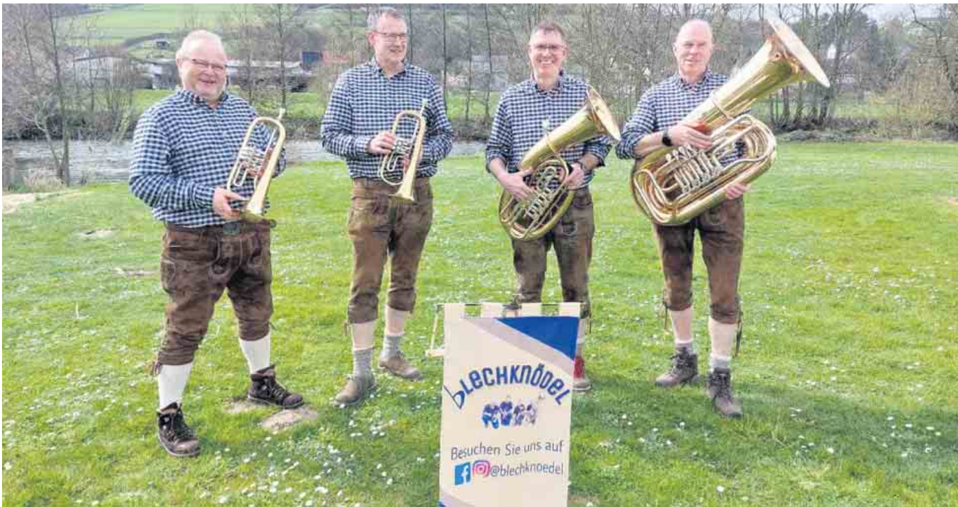
Das Brakeler Blechknödel-Quartett ist im Kreis Höxter gut bekannt.

bieten mit aktuellen Hits, unvergessenen Evergreens und liebenswürdigen Ohrwürmern beste Unterhaltung - mobil, gesellig und vielseitig. „Wir spielen Pop-Klassiker, Chart-Hits, Lounge-Musik, Evergreens, Schlager und alles, was bei Ihnen und Ihren Gästen angesagt ist“, sagt die Band. Die drei Musiker sind inspiriert von den legendären amerikanischen Marching Bands der Dixieland-Musik.