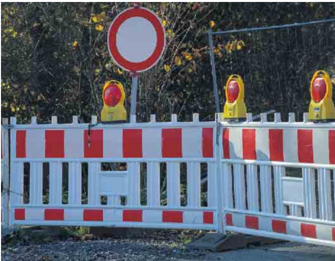
Die Kreisstraße 9 ist voraussichtlich ab Juni gesperrt

zur Anarbeitung an die Brücke ausgeführt. Rund 380.000 Euro sind für die Baumaßnahme eingeplant. Es ist vorgesehen, die Arbeiten im Herbst 2024 fertigzustellen. Während der Arbeiten ist eine Vollsperrung der Kreisstraße 9 erforderlich. Lediglich für vor- und nachbereitende untergeordnete Arbeiten ist die Aufrechterhaltung einer Fahrspur für den öffentlichen Verkehr möglich. Während der Vollsperrung wird der Verkehr zwischen Reelsen und Bad Hermannsborn über die Landesstraßen 954 und 952 umgeleitet. Der Kreis Höxter bittet die betroffenen Anlieger um Verständnis für die Behinderungen während der Baumaßnahme.