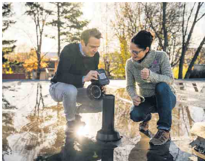
Intelligente Dachlösungen: Von Dachdeckern für Dachdecker entwickelt.

Die Fortschritte im Dachdeckerhandwerk sind ein beeindruckendes Beispiel für ein sich ständig weiterentwickelndes Gewerbe. Durch die Kombination traditioneller Handwerkskunst mit innovativen Technologien - Schieferhammer und iPad - tragen Dachdecker und Dachdeckerinnen dazu bei, unsere Gebäude effizienter, nachhaltiger und widerstandsfähiger zu