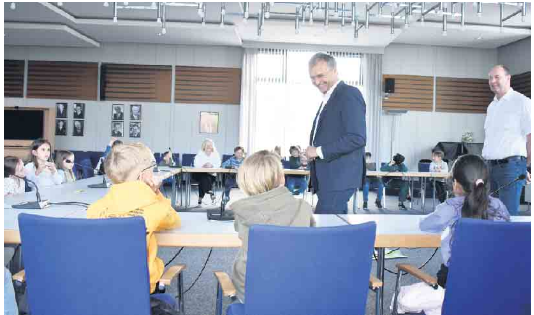
Bürgermeister Burkhard Deppe (Mitte) und Bildungsdezernent Uwe Damer hören sich die Vorschläge des Schülerparlaments im Ratssaal an.

Im Vorfeld des Besuches hatten sie zahlreiche Verbesserungsvorschläge erarbeitet, die alle Areale des Geländes betreffen. Deppe bedankte sich ausdrücklich für alle Ideen und