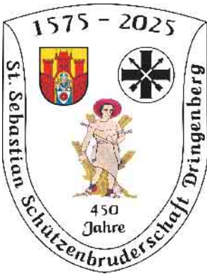
Ein Festabzeichen zur Erinnerung an die Gründung der Schützenbruderschaft und weitere Jubiläumsartikel werden zu diesem besonderen Tag angeboten.

Die St. Sebastian Schützenbruderschaft freut sich auf ein würdiges Jubiläumsfest, das Vergangenheit, Gegenwart und Zukunft in besonderer Weise miteinander verbindet.