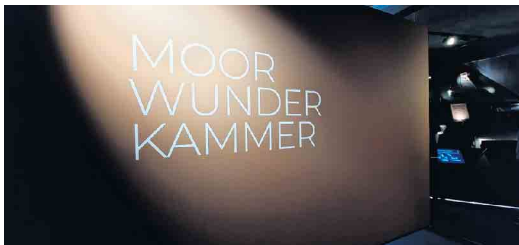
Moorerlebniswelt Bad Driburg

Positiv überrascht, dass auf kleinem Raum, eine recht komplexe Ausstellung gelungen ist, haben die Mitglieder im Anschluss auf eigene Faust die Details erkunden und auch einiges über die einzigartigen Ökosysteme lernen können.