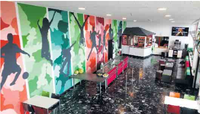
Das Foyer bietet vielen Gästen Platz.

- mit modernen, geschlossenen Unisex-Kabinen für alle Gäste. Seit 2023 ist die Jugendherberge auch Ausbildungsbetrieb. Rosalina absolviert hier ihre Ausbildung zur Hotelfachfrau. „Das Team ist super, und ich lerne jeden Tag etwas Neues. Die Aufgaben sind sehr vielfältig“, erzählte sie. Die Zusammenarbeit mit der Stadt Bad Driburg sowie lokalen Sportvereinen wie dem TuS Bad Driburg 1893 e.V. und dem TV „Jahn“ Bad Driburg e.V. funktioniert hervorragend. Text: Doris Dietrich