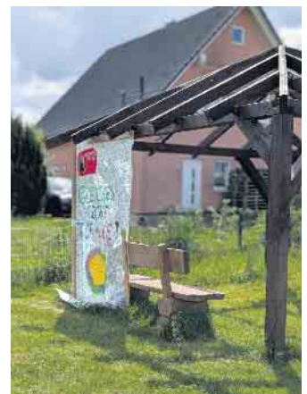
Die Anwohner fordern: Gleiches Recht für alle!