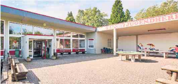
Jugendherberge Bad Driburg am Schirrmannweg.