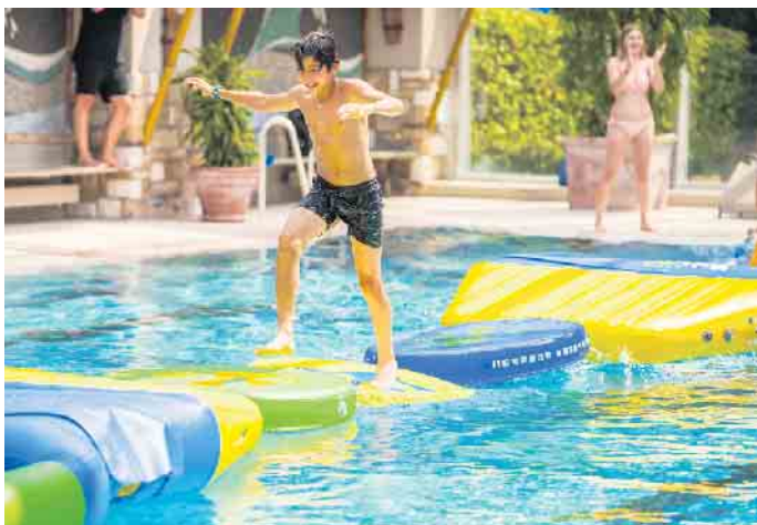
Das Foto zeigt einen Teil des neuen mobilen Wasserparks „AquaDuel“, der im Freibad an der Brunnenstraße aufgebaut wird.

Zu folgenden Öffnungszeiten wartet das Bäderteam auf schwimmerfreudige Gäste: Im Freizeitbad Bad Driburg: Montag bis Freitag: 6 bis 8 Uhr (Frühschwimmen) und 13 bis 19 Uhr; Samstag, Sonntag und an Feiertagen: 13 bis 19 Uhr. Im Eggefreibad Neuenheerse: Montag bis Sonntag: 14 bis 19 Uhr. In den Ferien, 14.07.2025 bis 26.08.2025, von Montag bis Sonntag: 13 bis 19 Uhr. Bei einer Schlechtwetterphase werden die Öffnungszeiten der beiden Freibäder angepasst. Die Sonderöffnungszeiten werden, per Aushang, am jeweiligen Freibad bekannt gegeben. Zur Unterstützung bei der Durchführung des Badebetriebes in den städtischen Freibädern werden noch qualifizierte Aushilfen als Aufsicht am Beckenrand sowie als Kassierer/in gesucht. Voraussetzungen für die Aufsicht am Becken-