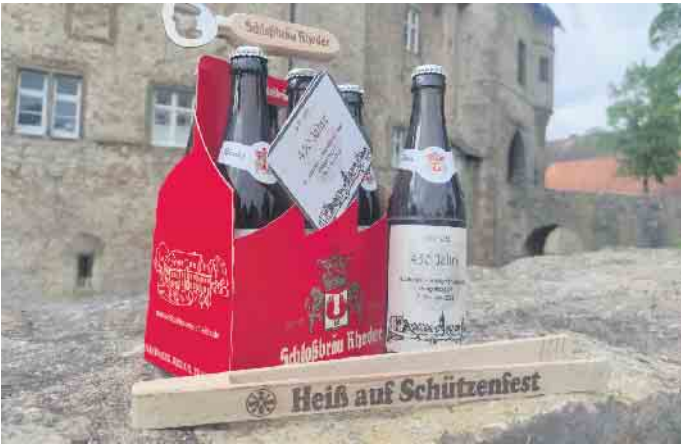
Zu diesem Festtag wurde ein schmackhaftes Jubiläumsbier gebraut, auf das sich Gäste und Schützen freuen können.

Im Anschluss an die Messe findet ab 19.00 Uhr eine Feierstunde am Historischen Rathaus in Dringenberg statt. Hier wird die Bedeutung der Bruderschaft für das gesellschaftliche und kulturelle Leben der Gemeinde gewürdigt. Festansprachen und Musik runden das Programm ab. Ein besonderes Highlight erwartet die Besucher um 19.30 Uhr: die Jubiläumsmodenschau der ehemaligen Königinnenkleider. In einem feierlichen Rahmen werden die Kleider der bisherigen Schützen-