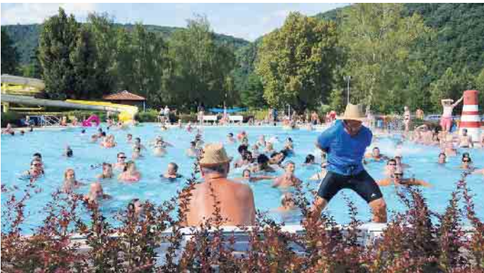
Die Bandbreite der Tätigkeitsfelder in Bäderbetrieben ist groß. Von Schwimmbadtechnik bis zum Betrieb am Becken muss alles im Blick behalten werden. Foto: Ingo Ortel, Wertheim/akz-o

Die Berufsmöglichkeiten für FABs sind vielfältig. Sie können in öffentlichen Schwimmbädern, Spa- und Wellnesszentren, Freizeitparks oder Fitnessstudios arbeiten. Es besteht auch die Möglichkeit, sich auf bestimmte Bereiche wie die Wasserpflege, die Schwimmkursleitung oder die technische Betreuung zu spezialisieren. Durch Weiterbildungen und Fortbildungen zum Meister/in für Bäderbetriebe oder zur Fachwirt/in für Bäderbetriebe/Bäderbetriebsmanagement steigen die Karrierechancen. Auch Führungspositionen in anderen verwandten Branchen sind möglich. Die zertifizierte Bundesfachschule des Bundesverbandes Deutscher Schwimmmeister e.V. bietet dazu Vorbereitungs- und Weiterbildungslehrgänge an. Mehr Informationen zum Berufsprofil unter www.bds-ev.de (akz-o)