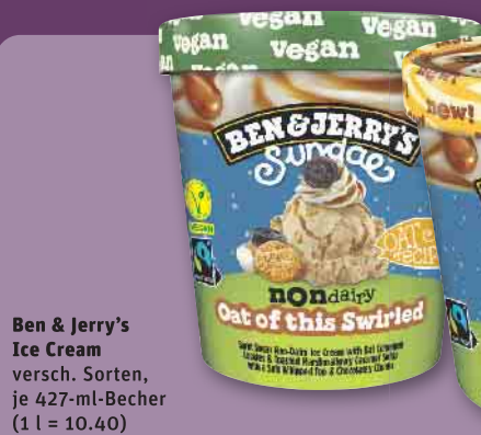
Ben & Jerry's Ice Cream versch. Sorten, je 427-ml-Becher (1 l = 10.40)