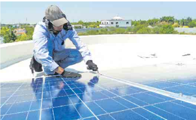
Kupfer ist ein wichtiger Rohstoff für die Energiewende. Rund um das rote Metall bieten sich daher viele berufliche Chancen - von der Produktion und Verarbeitung bis zu Forschung und Entwicklung.

entwickelt werden. Gefragt sind natürlich auch Kaufleute im Vertrieb und der Kundenberatung. Einige Studiengänge wie die Angewandten Materialwissenschaften können als dualer Bildungsweg mit der Kombination aus Berufsausbildung im Unternehmen und Studium an einer Uni oder FH absolviert werden. (DJD)