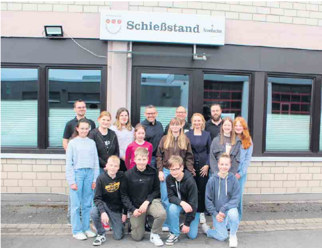
Jugendschießen von der Schützenbruderschaft St. Fabian und Sebastian Neuenheerse