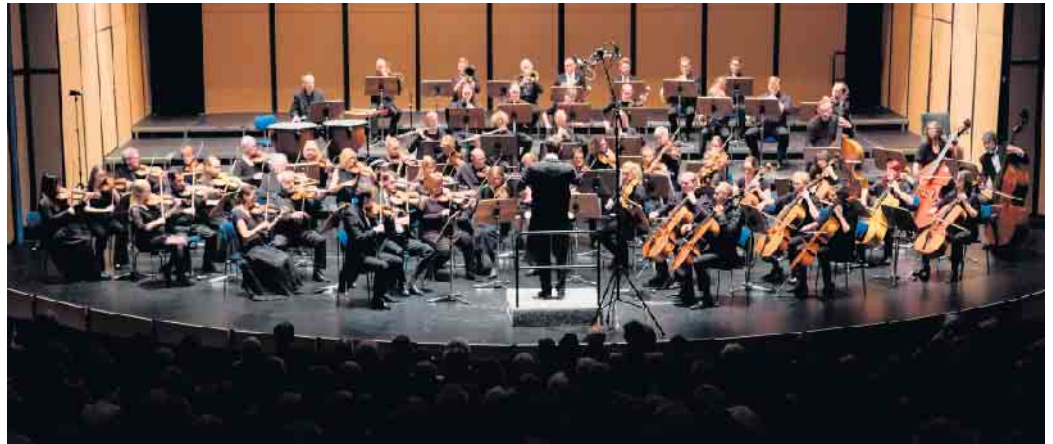
Das Sinfonieorchester Paderborn ist über die Grenzen Ostwestfalens hinaus bekannt.

Auf dem Programm stehen zwei Ouvertüren zu den Weltraumfilmklassikern Star Wars und Star Trek. Modern und virtuos zugleich