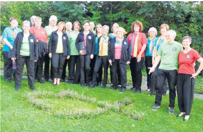
Der Gospelchor Spirit Voices