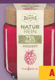
Zentis NaturRein 75% Frucht Himbeere, je 200-g-Glas (1 kg = 8.95)