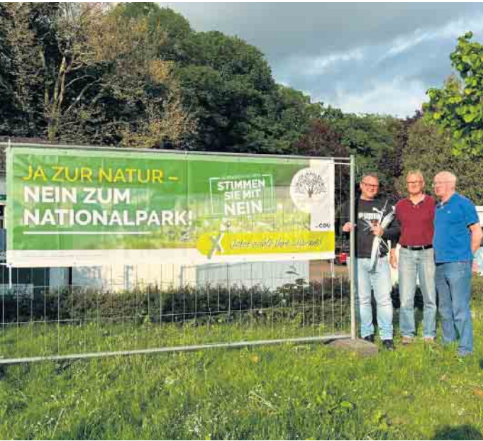
Werbung für den Mehrwert: Unsere fleißigen Helfer beim Aufstellen der Bauzaunbanner.

einstellen. Das wäre ein herber wirtschaftlicher Verlust, auch für die Steuereinnahmen der Städte und Gemeinden. Unserer Egge wird seit Jahrhunderten nachhaltig bewirtschaftet. Naturschutz hat schon heute höchste Priorität. In unserer Egge gibt es auch grundsätzlich keine „Verbotzonen“. Alle Wald- und Wanderwege dürfen zu jeder Zeit ohne Einschränkungen genutzt werden. Viele Menschen schätzen diese Freiheit ungemein. Radfahren, Reiten, Joggen, Wandern, einfach nur Spazieren gehen oder mit den Kindern die Egge erkunden ist der Mehrwert, den unsere Egge ausmacht - für Mensch und Natur. Deshalb: Ja zur Egge - Nein zum Nationalpark. www.cdu-baddriburg.de Andreas Amstutz