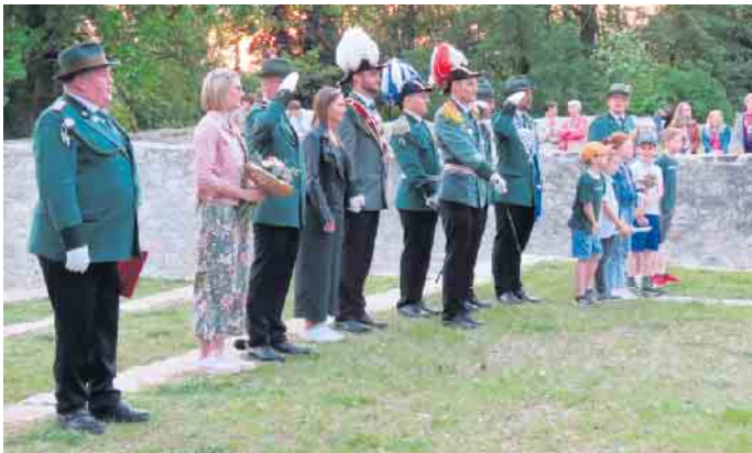
Das neue Regentenpaar wird feierlich vom Schützenoberst proklamiert.