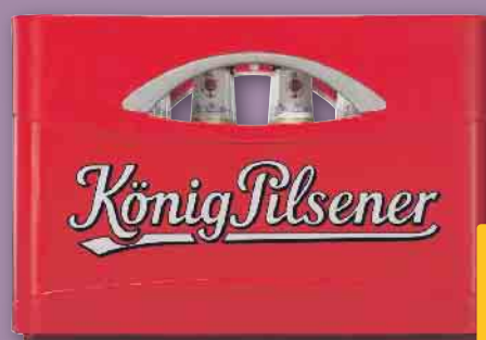
König Pilsener je 24 x 0,33/20 x 0,5-l-Fl.-Kasten (1 l = 1.26/1.00) zzgl. 3.42/3.10 Pfand