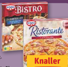
Dr. Oetker Bistro Flammkuchen Elsässer Art tiefgefroren, je 265-g-Pckg. (1 kg = 7.51) oder Ristorante Pizza Salame tiefgefroren, je 320-g-Pckg. (1 kg = 6.22)