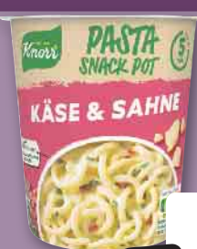
Knorr Pasta Snack Käse-Sahne-Sauce, je 71-g-Becher (1 kg = 13.94)