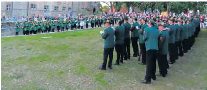
Auf der Freiheit vor der Burg in Dringenberg findet die Proklamationsfeier statt.