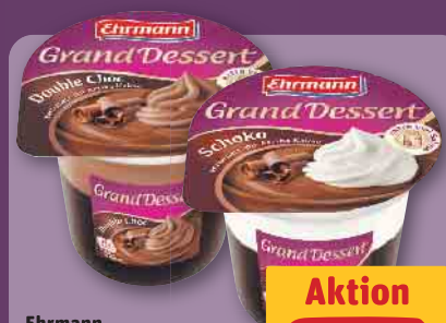
Ehrmann Grand Dessert versch. Sorten, je 190-g-Becher (1 kg = 2.58)