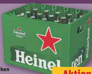
Heineken Premium Beer je 20 x 0,4/28 x 0,25-l-Fl.-Kasten (1 l = 1.87/2.14) zzgl. 3.10/3.74) Pfand