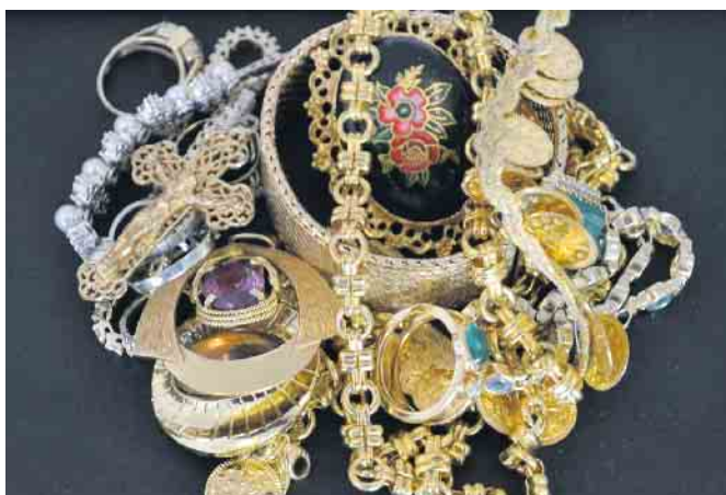
Die Schmuckstücke oder andere Wertgegenstände werden vor den Augen des Kunden geschätzt. Transparenz und Offenheit ist dem Team des Goldankaufs ganz besonders wichtig.

„Bei unseren vielen zufriedenen Stammkunden bedanken wir uns für ihr Vertrauen und ihre Treue. Wir freuen uns, Sie auch weiterhin in unserer Filiale an der Langen Straße in Bad Driburg und in unserem Geschäft am Paderborner Königsplatz 18 begrüßen zu dürfen“, betont Rahil Genc. Gerne auch nach vorheriger telefonischer Terminabsprache unter 0177/75 44 39 8 oder (0 52 53) 86 89 51 8. Das Geschäft im Herzen der Badestadt ist unter der Woche von 10 bis 17 Uhr sowie samstags von 10 bis 13 Uhr geöffnet. Weitere Informationen gibt es auch im Internet unter www.padergold.de . (SR)