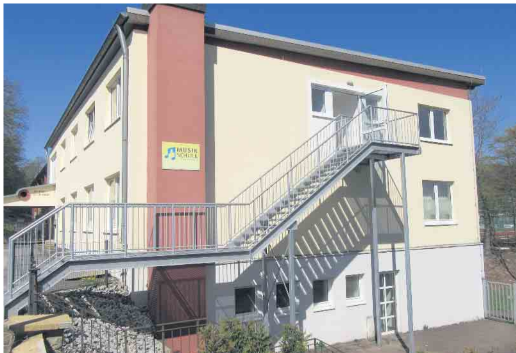
Am Aliserbett 5: Das neue Domizil der Musikschule der Stadt Bad Driburg

Die Musikschule ist nach über 48 Jahren stolz, ihre Arbeit als