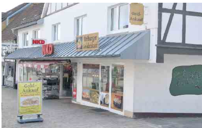
Die Filiale in der Badestadt besteht bereits im elften Jahr.