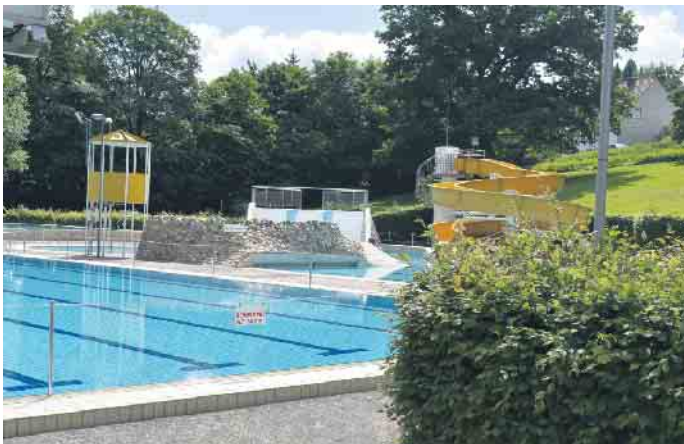
Das Freizeitbad an der Brunnenstraße wird weiter attraktiviert.

Der Förderverein Freizeitbäder Kernstadt Bad Driburg e. V. hat in seiner letzten Sitzung die Anschaffung einer neuen Wasserspielstraße als großer Attraktion für das Bad Driburger Freibad an der Brunnenstraße beschlossen. Dabei handelt es sich sozusagen um einen Hindernisparcours auf dem Wasser. Gekauft werden konnte ein 20 Meter langes Spielgerät mit mehreren Modulen im Wert von insgesamt 12.400 Euro, das die Freibadbesuche der Action-Liebhaber extrem bereichern wird. Die „WiggleBridge“ ermöglicht das Gehen auf dem Wasser und die „Tubes“ bringen den Hürdenlauf ins Wasser, die steile Rutsche ist das perfekte Finish! Fred Müller, 1. Vorsitzender des Fördervereins, berichtet: „Unser Anliegen ist es, das Freizeitbad