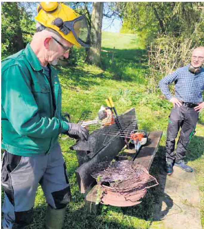
Beim Freischneiden von Wegen wurde auch noch so mancher „Schrott“ gefunden

Wir blicken stolz auf einen Dorfaktionstag zurück, der eindrucksvoll bewiesen hat: In Dringenberg hält man zusammen - und gemeinsam können wir Großes erreichen. Die einzelnen Projekte des Dorfaktionstages werden in den nächsten Wochen auf unserer Internetseite ( www.dringenberg.de ) und in den sozialen Medien noch intensiver vorgestellt.