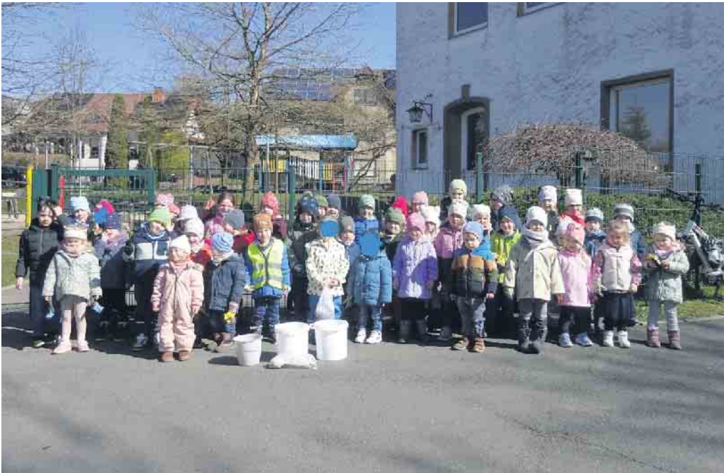
Umwelttag der katholischen Kita St. Josef

Neuenheerse. In der letzten Märzwoche beteiligte sich die Dorfgemeinschaft ganz nach dem Motto „Neuenheerse räumt auf“ an verschiedenen Umwelt- und Aufräumaktionen. Die Kinder der katholischen Kita St. Josef sammelten Müll rund um den Kindergarten sowie am Wegesrand bei einem Spaziergang durch das Dorf und auf dem Spielplatz in der Hunnebieke. Die Schülerinnen und Schüler der Grundschule St. Walburga der Klasse 4 sammelten Müll an der Nethe, während die anderen Klassen im Bereich Stausee, Freibad, Feriendorf, Taildor und rund um die Grundschule aktiv wurden. Alle Kinder waren bei bestem Frühlingswetter mit großer Begeisterung bei der Sache. Insgesamt kamen mehrere Säcke Müll zusammen - erfreulicherweise weniger, als in den vergangenen Jahren. Dies zeigt, dass die letzten Umwelttage bereits Früchte tragen, denn wer einmal selbst Müll gesammelt hat, wirft keinen Müll mehr in die Landschaft. Die Kindergarten- und Grundschulkindestalteten ihre Umwelttage an separaten Tagen, um spielerisch Erfahrungen zu sammeln, die sie für einen verantwortungsvollen und achtsamen Umgang mit der Natur stärken. Nach Abschluss der Sammelaktion erhielten die durstigen Schulkinder erfrischende Getränke, die vom Bezirksausschuss gespendet wurden.