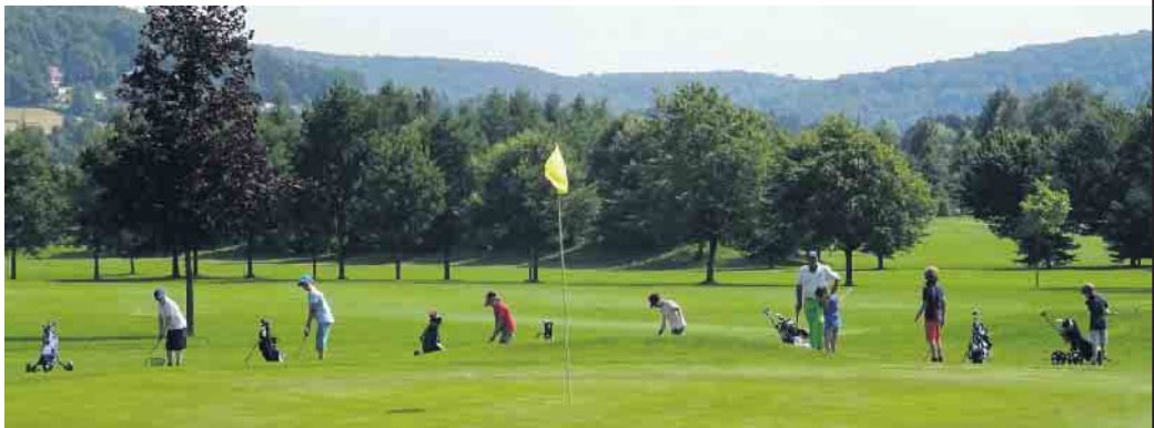
Der Golfplatz in Bad Driburg ist ein Ort der Begegnung, der Inspiration und der Freude an der Bewegung in der Natur.

Ein sanfter Schwung, ein sauberer Treffer, der Ball fliegt - und plötzlich ist es da, dieses unbeschreibliche Gefühl: Pure Begeisterung. Genau das darf eine Gruppe sportbegeisterter Frauen und Männer am letzten Maiwochenende erleben. Drei Tage lang steht alles im Zeichen des Golfspiels - und der Freude daran, etwas Neues auszuprobieren. Schon bei der Ankunft im malerischen Golfclub Bad Driburg wird klar: Hier erwartet uns mehr als nur ein Sportkurs. Die gepflegten Fairways schlängeln sich durch eine sanft hügelige Landschaft, eingerahmt von dichten Wäldern und weitem Blick ins Grüne. Ein Ort, der wie geschaffen scheint, um zur Ruhe zu kommen - und zugleich sportlich aktiv zu sein. Unter der professionellen Anleitung vom erfahrenen Golfprofi Donald Sanders werden die Grundlagen des Golfspiels vermittelt - geduldig, klar und mit viel Humor. Schon