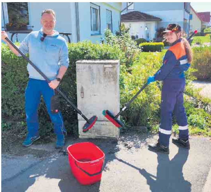
Weg mit dem Dreck - die Stromverteilerkästen im Ort wurden gesäubert

gemeinsamen Grillen am Nachmittag wurde der erfolgreiche Tag gebührend beendet. Die neu aufgestellten Bänke boten die perfekte Gelegenheit zum gemütlichen Verweilen. Ein besonderer Dank geht an alle Helferinnen und Helfer, die mit Zeit, Energie und guter Laune dabei waren. Ohne euch wäre dieser Tag nicht möglich gewesen!