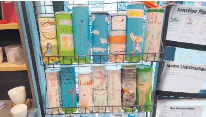
Ausstellung in der Buchhandlung - Schüler der Schule unter der Iburg haben im Rahmen des Unterrichts kreative Leserollen zu ihren Lieblingsbüchern angefertigt.