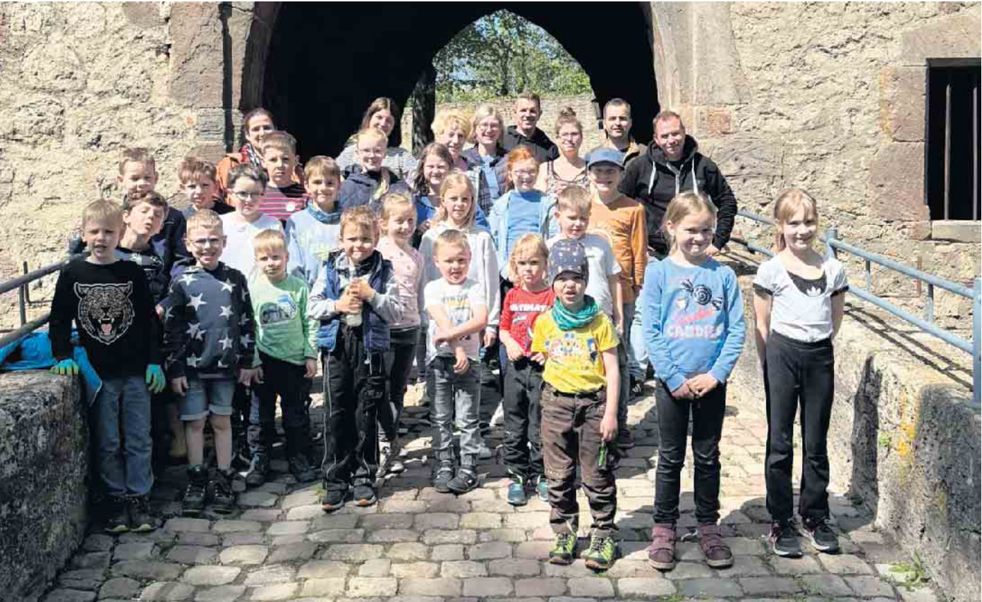
Ob Klein oder Groß: Unser Team der Müllsammel-Aktion