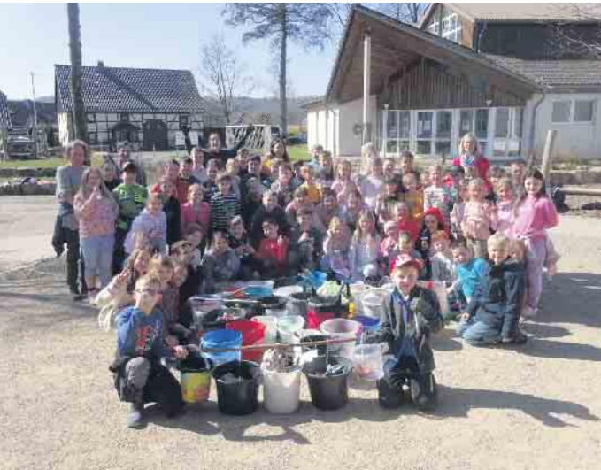
Umwelttag der Grundschule St. Walburga

hänger zusammengetragen und vom Bauhof der Stadt Bad Driburg entsorgt. Den Abschluss des erfolgreichen Tages bildete ein gemütliches Beisammensein bei Grillwürstchen und Getränken, bei dem die Beteiligten ihre Ergebnisse feiern konnten. Der Bezirksausschuss Neuenheerse freut sich über das vielfältige Engagement und bedankt sich ganz herzlich bei allen Beteiligten.