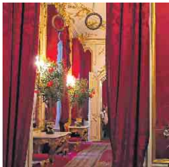
Blick von „Sissi“ Ankleidezimmer mit den Original Halteringen im Türrahmen ins Schlafgemach der Wiener Hofburg.

(ag). Der Mittwoch, 28. August 2024, begann mit dem üblichen Frühstück und einem Einkauf im Hauptbahnhof für den Tagesbedarf. Dann ging es reibungslos mit der U-Bahn, deren Haltepunkt, der Stephansplatz ein Behinderten-WC hat. Zu Fuß machten sich alle Teilnehmer auf zum Karlsplatz, wo die informative Stadtführung mit dem Schwerpunkt Sissi begann. Dabei wurde die Hofreitschule und die Hofburg besucht. Danach wurde durch den Volkspark und das Regierungsviertel gegangen, um anschließend mit der U1 zum