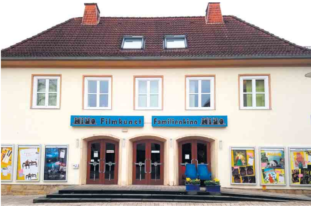
Das Kino Bad Driburg lädt wieder zum Seniorenkino ein.

Am Donnerstag, 15. Mai, um 14 Uhr, ist es wieder soweit: Im Rahmen der beliebten Veranstaltungsreihe lädt das Bad Driburger Kino alle Junggebliebenen zum Seniorenkino ein. Gezeigt wird der herzerwärmende Film „Der Pinguin meines Lebens“ - eine wahre Geschichte über Freundschaft, Mut und die unerwarteten Wendungen des Lebens. Im Mittelpunkt steht der britische Lehrer Tom, der im turbulenten Buenos Aires der 1970er Jahre nicht nur mit widerspenstigen Schülern, sondern auch mit einem ganz besonderen Pinguin klarkommen muss. Im Anschluss sind alle herzlich eingeladen, den Nachmittag beim gemütlichen Kaffeetrinken im Café-Restaurant „Vier Jahreszeiten“ des Seniorenparks Carpe Diem ausklingen zu lassen. Eine Anmeldung ist nicht erforderlich. Doris Dietrich