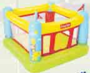
Hüpfburg für die kleinen