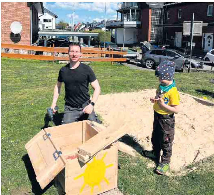
Holzboxen mit Sandspielzeug laden die „Kleinen“ nun jederzeit zum Spielen ein

Grünflächen. Das erfreuliche Ergebnis: In Dringenberg gibt es erstaunlich wenig Müll - ein schönes Zeugnis für das Bewusstsein und die Rücksicht unserer Bewohner. Unsere Spielplätze erhielten ebenfalls eine Aufwertung: Kreativ bemalte Holzboxen, die künftig Sandspielzeug zum „spontanen Spielen“ bereithalten, wurden aufgestellt. Zwei Gruppen machten sich auf den Weg, um Wanderwege freizuschneiden und Wegkreuze wieder sichtbar zu machen. Auch an der Burg wurden Hinweisschilder frisch gestrichen und vom Moos befreit. Rund um die Burg und die Zehntscheune wurden Mauern gründlich gereinigt - das Ergebnis