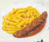
Currywurst mit Pommes