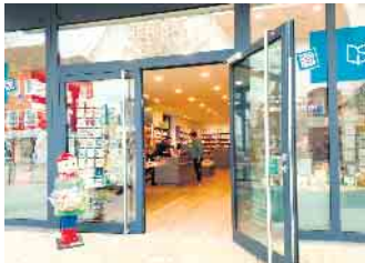
Buchhandlung Saabel in der Langen Straße 101.