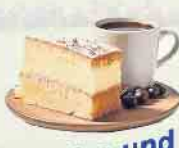
Kaffee und Kuchen

Nur an diesem Tag: Exklusive Rabattaktionen auf Mitgliedschaften, Schnupperkurse und Golf-Erlebnistage