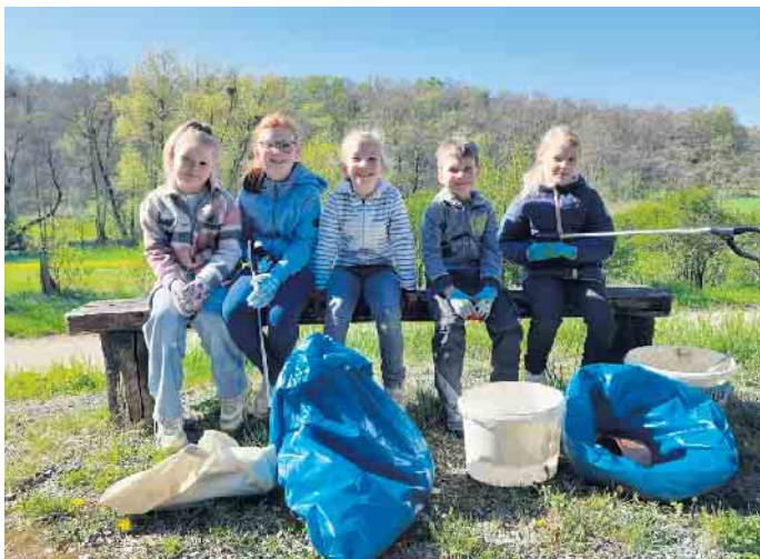
Mit Müllsäcken und Greifern wurden Wege in und um Dringenberg von kleinen Hinterlassenschaften befreit

ist beeindruckend: Alte Strukturen sind nun wieder in ihrer Schönheit sichtbar. In einem Bereich des Bürgersteigs am Friedhof die Pflastersteine aufgenommen und neu verlegt, um Unebenheiten zu beseitigen. Zudem wurden Stromverteilerkästen im Ort gereinigt. Ein besonderes Highlight schon im Vorfeld: Dank der Unterstützung der Walter Auge GmbH wurden unsere Ortseingangstafeln erneuert. Sie begrüßt nun alle Gäste und Heimkehrer in einem frischen, einladenden Erscheinungsbild. Gemeinschaft, Freude und Dankbarkeit Nach all der Arbeit kam der gesellige Teil nicht zu kurz: Beim