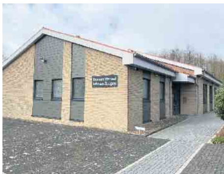
JZ Königreichssaal Jehovahs Zeugen, Im Wenningsen 31, Bad Driburg

weiser Männer? Lesen Sie die Antwort auf www.jw.org kostenfrei.