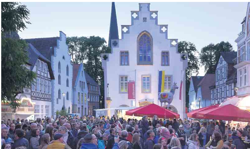
Eine stimmungsvolle Atmosphäre vor dem alten Rathaus beim Stadtfest im letzten Jahr.

Am Sonntag öffnen beteiligte Geschäfte in der Zeit von 13 bis 18 Uhr. Außerdem gibt es weitere Programmpunkte für die ganze Familie auf der Bühne. Dazu zählt das AWO-Spielmobil und als Mitmach-Circus die „Große Saure-