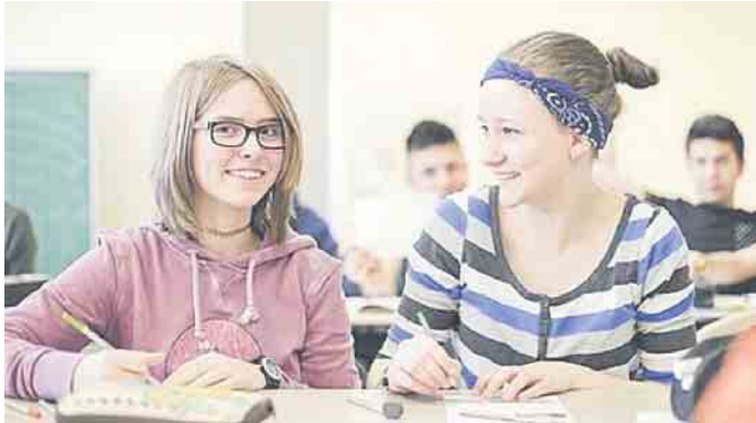
Egal ob schulische oder duale Ausbildung - Unterricht im Klassenzimmer gehört dazu.

Schulische Ausbildungen sind meist länderrechtlich geregelt. Daher können auch Abschlussbezeichnungen von Bundesland zu Bundesland unterschiedlich lauten. Schulische Ausbildungen im Bereich Gesundheit und Pflege sind jedoch bundesweit über die entsprechenden Ausbildungsverordnungen geregelt. Die Prüfungen finden vor einem Prüfungsausschuss bei den einzelnen Schulen statt. (wwp)