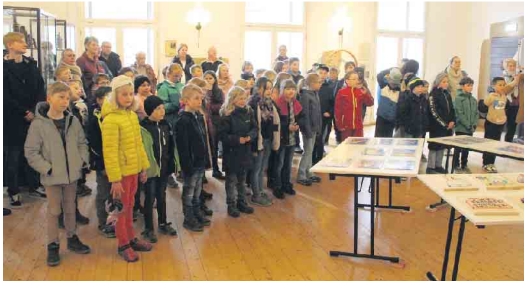
Viele Schülerinnen und Schüler sind bei der Ausstellungseröffnung dabei.

Nach zuletzt 2019 ist in diesem Jahr die Grundschule Dringenberg als ausstellende Schule dabei. Rund 100 Arbeiten aus dem Kunstunterricht sind bis zum 18. Juni zu sehen. Geöffnet ist die Burg Dringenberg freitags, samstags und sonntags und an Feiertagen. Weitere Partnerschulen der Burg Dringenberg sind die Gymnasien St. Xaver in Bad Driburg und St. Kasper in Neuenheerse sowie die Gesamtschule Bad Driburg. Dieses Jahr ist ein ganz besonderes Jahr für Dringenberg, denn die Ortschaft feiert in diesem Jahr das