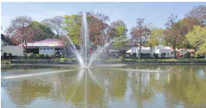
Die Frühlingskirmes startet bereits einen Tag früher - an Christi Himmelfahrt - auf dem Feuerteichplatz.

gramm-Neuerungen ergänzt: Direkt neben der Hauptbühne wird es auch musikalische Acts geben.