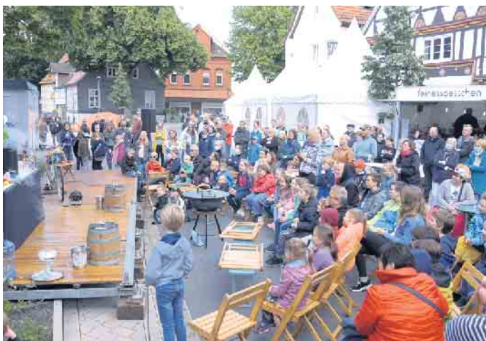
Ein buntes Familienprogramm erwartet die ‚Kleinen‘ und die ‚Großen‘ Besucher am Samstag und am Sonntag