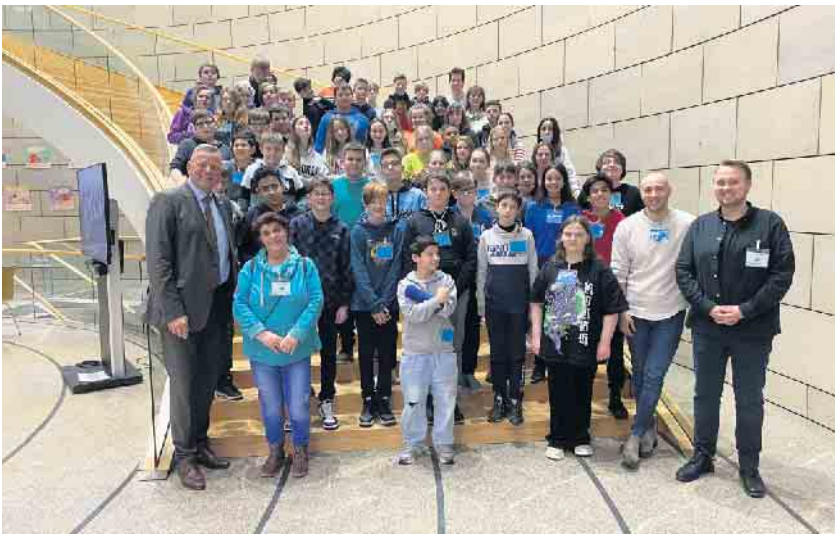
Politik live erleben: Matthias Goeken zusammen mit den SchülerInnen der Jahrgangstufe 6 der Gesamtschule Bad Driburg

war es, Politik für Schüler:innen erlebbar zu machen und damit das politische Bewusstsein zu stärken. „Ich würde mich freuen, wenn ich die Schule vor Ort unterstützen und besuchen kann“, verabschiedete sich Goeken von der jungen Besuchergruppe, die sich ganz herzlich für den tollen und außergewöhnlichen Ausflug in die Landeshauptstadt bedankt.