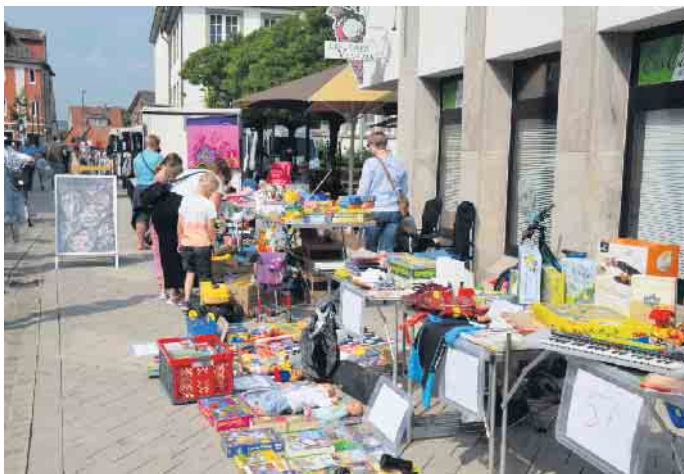
Der Samstag startet vormittags mit einem Kinderflohmarkt von 9 bis 11 Uhr im Hanekamp.