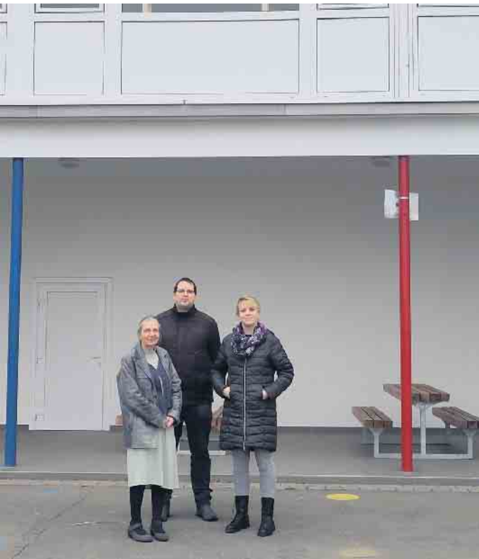
Grundschule Pömben: Die Wärmedämmung oben ist nicht ausreichend und unten könnte mit einer Verglasung Energie gespart und eine Pausenraum für Regentage geschaffen werden.

Die Grundschule in Pömben platzt zum neuen Schuljahr aus allen Nähten: 50 neue Anmeldungen sind ein gutes Zeichen. Aber natürlich bedeutet das, es werden mehr Kinder die Ganztagsbetreuung nutzen. Ab 2026 haben die Kinder sogar einen Anspruch darauf. Wir GRÜNE haben uns die Schule angeschaut und Möglichkeiten gefunden, das Problem zu lösen: Der Flurbereich im Obergeschoß weist derzeit keinerlei Heizmöglichkeit auf und verfügt über keine ausreichende Dämmung. Unter anderem daraus ergibt sich ein Feuchtigkeitsproblem. Dieser Flurbereich könnte relativ einfach ohne teure Neu- oder Anbauten ertüchtigt werden, indem eine Dämmung unterhalb des Flur res eingebaut wird. Auch eine durchgängige Fensterfront, die auch den offenen Aufenthaltsbereich am Pausenhof umfasst, wäre hilfreich. Eine Erneuerung der Fensterfront im Flur ist seitens der Stadt ohnehin geplant, der Mehraufwand wäre also überschaubar. Natürlich muss der Bereich im Obergeschoß beheizt werden, um für Schülerinnen und Schüler nutzbar zu sein. Selbstredend sind Geldmittel notwendig, um den Flurbereich im Obergeschoß über dem Pausenhofbereich der Grundschule Pömben ganzjährig nutzbar zu machen. Als Deckungsvorschlag schlagen wir die verminderte Kreisumlage 2024 vor. Martina Denkner