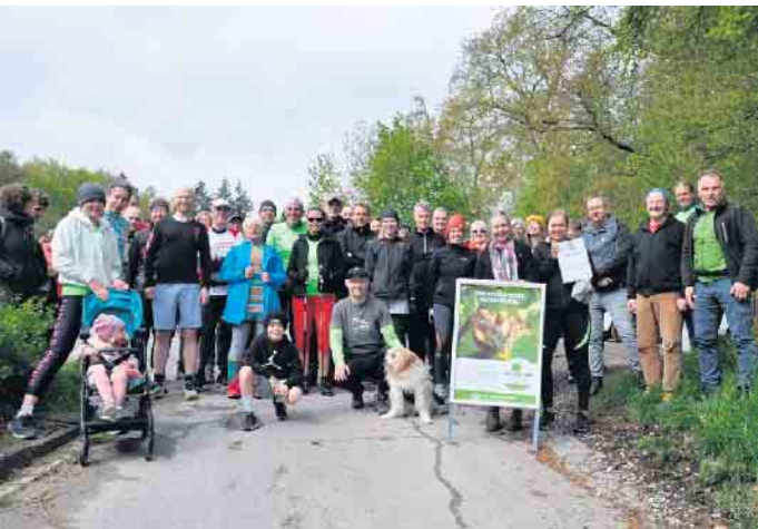
Rund 40 Lauf- und Nationalparkbegeisterte starteten am Fuß der Egge zum ersten Nationalparklauf von Willebadessen nach Neuenheerse. Ganz deutlich wurde der Wunsch geäußert, spätestens im kommenden Jahr wieder eine derartige Veranstaltung anzubieten.

Schauen wir uns die Fakten an: es gibt zwei Studien der IHK Lippe und OWL: eine zur Holzwirtschaft und eine zur Tourismuswirtschaft. Die Studie der IHK zur Holzwirtschaft prognostiziert einen Verlust von rund 277 Arbeitsplätzen, unter der Voraussetzung, dass schon in 30 Jahren der Ertrag aus den Flächen des Landes wieder genauso hoch ist, wie vor dem Borkenkäferbefall. Wir halten das für, na, sagen wir mal ambitioniert. Aber wir nehmen mal an, dass das klappen wird. Die Studie der IHK zur Tourismuswirtschaft sieht - wenn es einen Nationalpark in der Egge gibt - ein Primäreinkommen für über 4.800 Personen (Pro-Kopf 26.804€). Das kann sich natürlich auch auf mehr Personen, die z.B. in Teilzeit arbeiten, aufteilen. Wir haben das mal nachgerechnet: 4.800 Arbeitsplätze sind klar mehr als 277 Arbeitsplätze. Beide Studien sind seriös wissenschaftlich erarbeitet: Die Studie Holzwirtschaft von der Fa. Knau-Consulting und die Studie Tourismuswirtschaft vom Dt. Wirtschaftswissenschaftlichen Institut für Fremdenverkehr an der Uni München. Und beide Studien sind auf unserer homepage gruene-bad-driburg.de verlinkt. Terminhinweis: Am Sonntag, 5. Mai im Kino Bad Driburg Informationsveranstaltung zum Thema Nationalpark! Hingehen! Informieren! Beim großen Bürgerentscheid für den Nationalpark stimmen! Martina Denkner