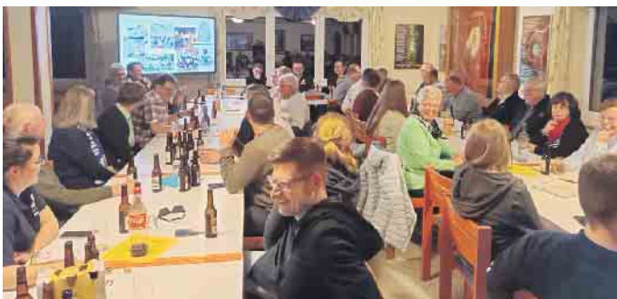
Die Versammlung fand in einer harmonischen, konstruktiven und sehr angenehmen Atmosphäre statt, was den Zusammenhalt und die positive Stimmung im Verein widerspiegelte.

Galaabend am 1. Februar 2025 in der Bergdorfhalle stattfinden wird, ebenso wie der Kinderkarneval am 26. Januar 2025. Der Adventsnachmittag ist für den 22. Dezember geplant. Unter dem Punkt Verschiedenes wurden diverse Themen besprochen.