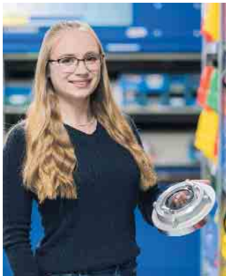
Kaufleute für Groß- und Außenhandelsmanagement sorgen für einen reibungslosen Warenfluss.

bes und sorgen dafür, dass die interne Information und Kommunikation funktionieren. Industriekaufleute Industriekaufleute beschäftigen sich mit Materialwirtschaft, Vertrieb, Marketing und Rechnungswesen - aber auch mit Warenannahme und -lagerung. Sie lernen, mit Lieferanten zu verhandeln und Absatzwege zu finden. Eine abwechslungsreiche Ausbildung für alle, die in die Industrie wollen, ohne zu studieren. Fachkräfte für Lagerlogistik Wer gerne anpackt, hat Spaß bei dieser Ausbildung: Lagerlogistiker(innen) behalten den Überblick über die großen Lagerbestände im Technischen Handel. Vom Wareneingang bis zum Warenausgang beweisen sie Planungs- und Organisationskompetenz.