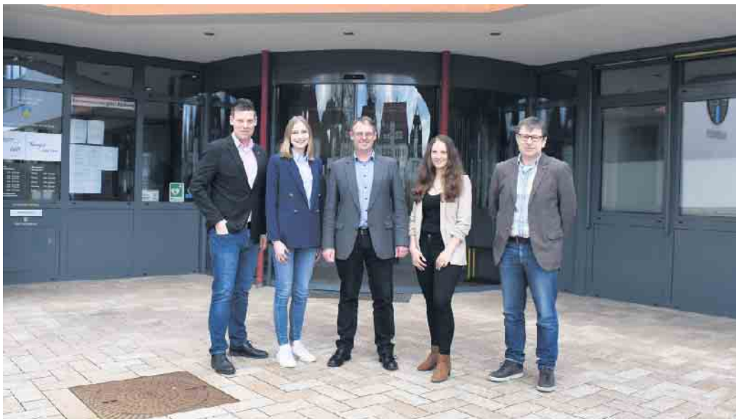
netter der Stadt Bad Driburg. Mitte April lud die Stadt Bad Driburg alle Digital-Lotsen und Vertreter der noch nicht projekt-beteiligten Dörfer ins Rathaus ein, um ihnen darzulegen, wie die Stadtverwaltung digitale Dorfplattformen mit Inhalten unterstützen und somit zusätzlich beleben möchte. Ganz konkret geht es dabei um die städtischen Sehenswürdigkeiten und Wanderwege sowie um aktuelle Nachrichten und Meldungen aus der Stadtverwaltung. Die dazu in Bad Driburg gefundenen Wege der