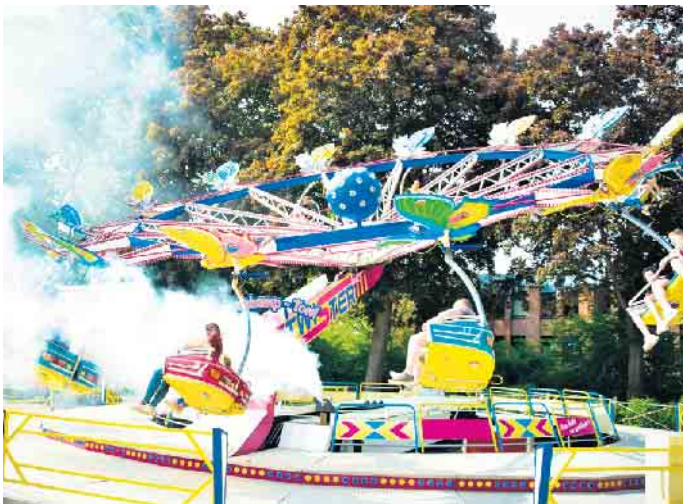
Die Frühlingskirmes beginnt bereits ab Donnerstag, 9. Mai (Christi-Himmelfahrt).

OWL, die seit nunmehr fünfzehn Jahren Hauptsponsor des Brakeler Stadtfestes sei, berichtet der Werberingvorstand.