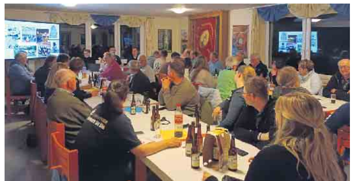
Die Anwesenheit von 43 Teilnehmern zeugte von einem starken Interesse am Vereinsgeschehen.