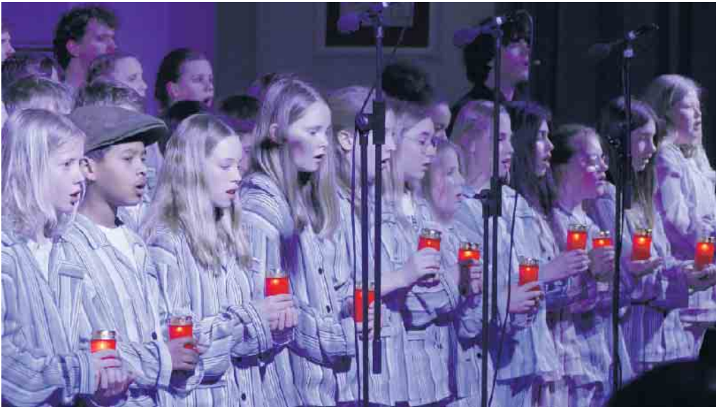
Eindringlich wurde in dem Musikdrama an das Leid der Kinder von Theresienstadt erinnert.