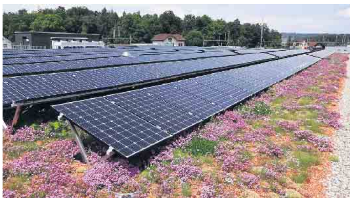
Solare Technik und eine Dachbegrünung: Diese Kombination ist gleichermaßen ökologisch als auch wirtschaftlich sinnvoll.

lichkeiten naturgemäß auf flachen Dächern, sie reichen von der Wildblumenwiese über den Dachgarten und das hauseigene Biotop bis hin zum solaren Kleinkraftwerk. Wer begrünt, schafft nicht nur eine optische Verschönerung, sondern trägt aktiv zum Klimaschutz bei. Vor allem in Ballungsräumen sind die Flächen in hohem Maße versiegelt, für Siedlungs- und Verkehrsflächen liegt die Quote aktuell bei 45 Prozent. Im Vergleich zum angenehmen Klima in Wäldern und naturbelassenen Räumen entsteht so ein aufgeheiztes Stadtklima, dem sich mit einer Begrünung entgegenwirken lässt. Für ein Stück Natur auf dem Dach bieten Hersteller wie Bauder komplette Systemaufbauten von der Abdichtung bis hin