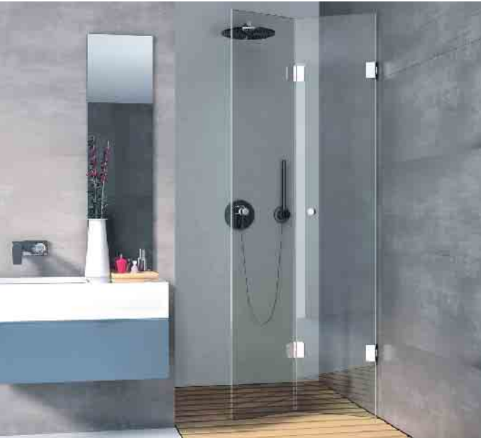
Multitalent in der Dusche: Klappen, ziehen, anlegen, klein machen - das ist das Erfolgsprinzip der Duschtrennung Josephine von Glassdouche für kleine Bäder.

ken. Ob die Wahl dabei auf feststehende Trennwände - einteilig oder zweiteilig, ganz transparent oder teilverspiegelt - oder auf eine Kombination aus Falt- und Drehtüren fällt, hängt ganz von den räumlichen Gegebenheiten und den persönlichen Vorlieben ab. Aber auch eine abgeschlossene Kabine kann ausgesprochen transparent wirken, wenn eine rahmenlose oder teilgerahmte Beschlag-Duschkabine gewählt wird. Wie auch immer: Hauptsache, die Dusche bietet kein Hindernis für grenzenlosen Durchblick. (akz-o)