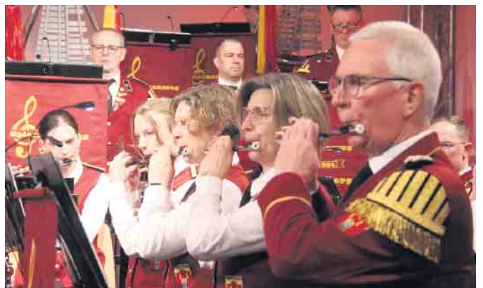
Der Spielmannszug Dringenberg bei seinem Jubiläumskonzert in der ausverkauften Zehntscheune.