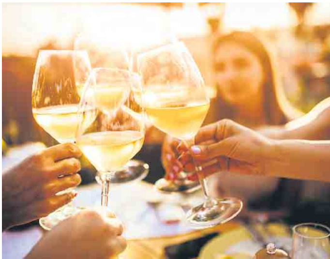
Schlemmen und Genießen in der Innenstadt.

ist dabei: das Konzept wurde weiterentwickelt und heißt jetzt „FeierabendZeit“ mit Fokus auf dem geselligen Beisammensein, Schlemmen und Genießen. „Der neue Name der Veranstaltung „FeierabendZeit“ entstand aus dem neuen Konzept. Aufgrund des Feedbacks zum Feierabendmarkt wurde schnell klar, dass das Interesse der Besucher besonders in Richtung der Kulinarik und des Unterhaltens geht. Das habe ich bei der Planung berücksichtigt. Ich freue mich auf zahlreiche Teilnehmer“, so die Citymanagerin. Es gibt regionale Spezialitäten, ausgewählte Getränke und dazu Live-Musik ab 18.30 Uhr – so lassen sich der Feierabend und das Wochenende gut einleiten.