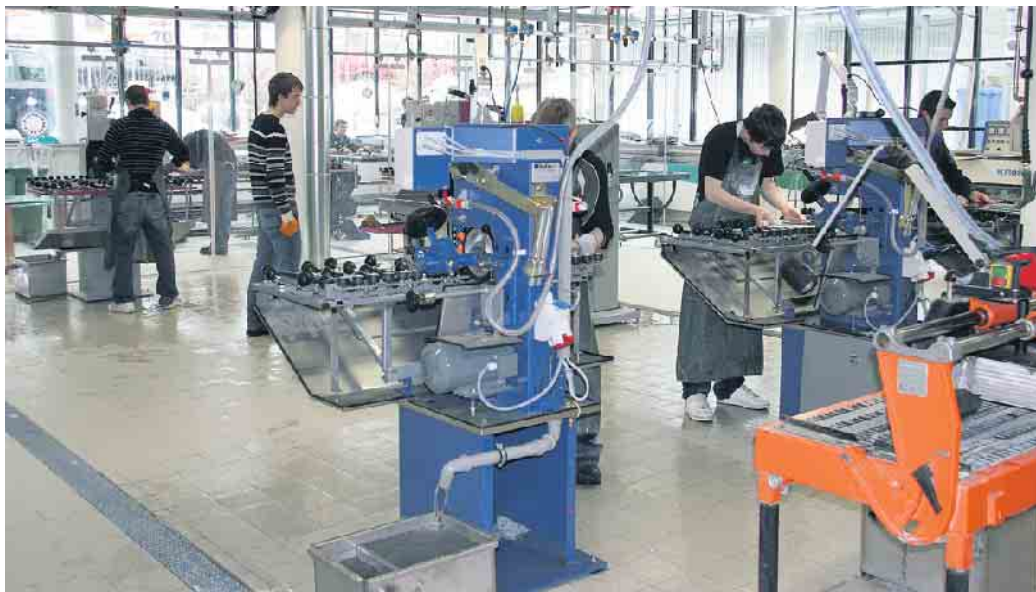
Ausbildung in der Flachglasindustrie.

Der Flachglastechnologe stellt Glasplatten für die unterschiedlichsten Einsatzzwecke her. Diese werden zum Beispiel für Möbel benötigt, aber auch für Türen, für Spiegel oder ganz klassisch für den Fenster- und Türenbau sowie für die Fahrzeugindustrie. „Zu den Aufgaben des Flachglastechnologen zählt der Zuschnitt inklusive des Schleifens und Polierens der Glaskanten sowie die Herstellung des fertigen Produkts mittels der Steuerung moderner Produktionsmaschinen“, erklärt der Hauptgeschäftsführer des Bundesverbandes Flachglas (BF), Jochen Grönegräs. Die Qualitätskontrolle und die Instandhaltung der komplexen Maschinen runden diesen interessanten Beruf ab. „Neben technischem Verständnis, einer umsichtigen Vorgehensweise und großer Sorgfalt sollte Mathematik kein Buch mit sieben Siegeln sein und zwei linke Hände sind hier ebenfalls fehl am Platze“, so Grönegräs. Der anerkannte Ausbildungsberuf wird in der Regel innerhalb von drei Jahren im Rahmen einer dualen Ausbildung in der Industrie erlernt, das heißt im Ausbildungsbetrieb und in der Berufsschule. Eine bestimmte Schulbildung ist nicht vorgeschrieben, mindestens ein Hauptschulab-