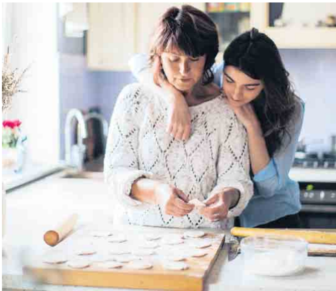
Ein Geschenk, das von Herzen kommt, bereitet jeder Mama eine große Freude.

Den Tortenguss nach Anleitung kochen und auf den Erdbeerkuchen geben.(ak-o)