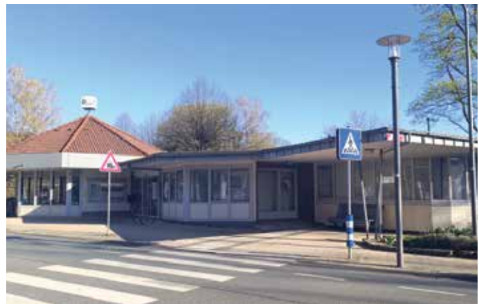
Das markante Gebäude am Bahnübergang soll neu vermietet werden.

trieben und die Parkplätze weiterhin durch Dritte nutzbar sein werden. Die Mietfläche von 170 qm ist unterteilt in Empfangs-, Büro-, Aufenthalts-, Besprechungs- und Büroräume sowie Flur und Windfang. Der Mindestmietzins ist auf 6 €/m 2 kalt/netto festgelegt. Angebote sind an dieser Vorgabe auszurichten. Bewerbungen sind ab sofort bis spätestens Montag, den 11.05.2026 bei der Stadt möglich. Sie sollten eine Nutzungsbeschreibung, die Angabe der Arbeitsplätze, die geplante Gestaltung des Gebäudes sowie das Mietgebot enthalten. Alle eingereichten Angebote werden nach einem einheitlichen Punktesystem bewertet. Schließlich wird dem Ausschuss für Wirtschaftsförderung, Stadtmarketing und -entwicklung