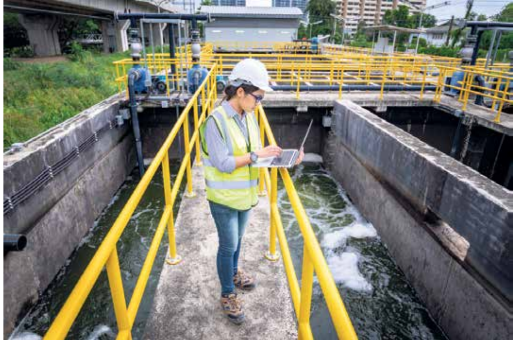
Fachkräfte sichern die Wasser- und Abwasserversorgung als kritische Infrastruktur, schützen die Umwelt und damit unsere Lebensqualität.

Das Berufsspektrum ist breit. Ausbildungsberufe sind etwa Vermessungstechnikerin, Umwelttechnologe für Abwasserbewirtschaftung oder Wasserversorgung sowie Anlagenmechanikerin für Rohrsystemtechnik. Ebenso eröffnen Studiengänge spannende Berufschancen in der Wasserwirtschaft: etwa Elektrotechnik, Energie-, Gebäude- und Umwelttechnik, Hydrologie oder Bauingenieurswesen mit Schwerpunkt Wasser. Die Arbeitsorte reichen von Trinkwasseraufbereitungs- und Kläranlagen über Ingenieurbüros bis zu Einsätzen im Gelände, etwa an Flüssen oder Hochwasserschutzanlagen.