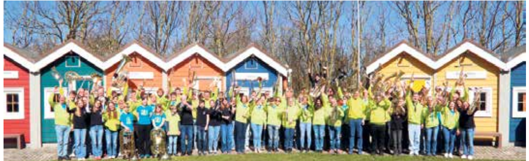
Die Ausbildungsorchester der Stadtkapelle, des Musikvereins Alme und der Gesamtschule