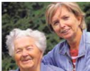
Meine Mutter braucht Pflege