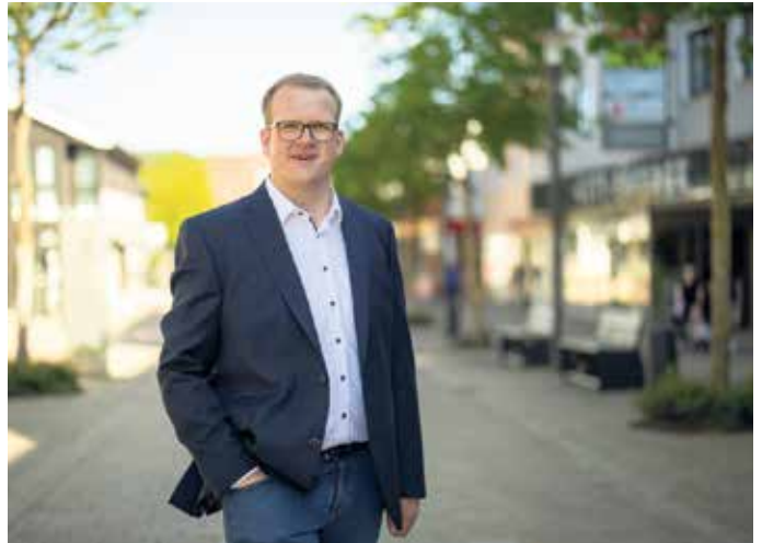
Ihr Tobias Tölle Bürgermeister

Auch in diesem Jahr möchten wir wieder Bürgerinnen und Bürger unserer Stadt für ihr besonderes ehrenamtliches Engagement mit einer Ehrenurkunde der Stadt Bad Driburg auszeichnen. Nicht selten sind es die stillen Helden des Alltags, die ihre Zeit, Kreativität und Energie unentgeltlich zum Wohle unserer Mitmenschen einsetzen. Wir freuen uns auf Vorschläge bis zum 15. Juni 2026. Entsprechende Vordrucke für einen Ehrungsvorschlag sind im Rathaus oder online unter www.bad-driburg.de/aktuelles erhältlich. Sie können sich auch für weitere Informationen an uns wenden unter der Rufnummer 05253 88 1004.