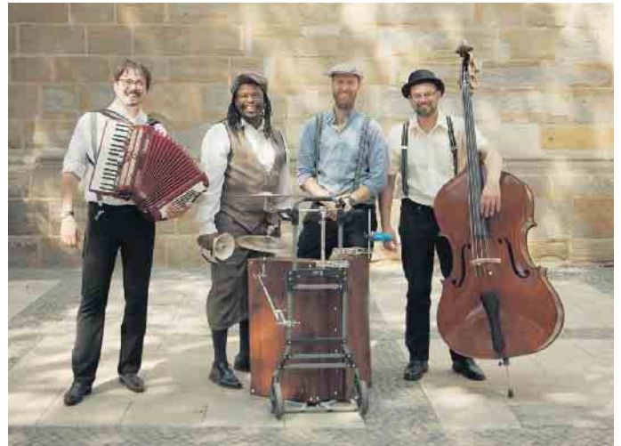
Las Polkas spielen die Hits der letzten 63,5 Jahre auf ihre ganz besondere Art und Weise.

Die ersten lauschigen Sommertage, ein gutes Glas Wein in geselliger Runde, kulinarische Spezialitäten und dazu ein buntes musikalisches Rahmenprogramm sind der perfekte Rahmen für das zweite Winzerfest in Bad Driburgs Fußgängerzone vom 13. bis 15. Juni, zu dem der Werbering und die Bad Driburger Touristik herzlich einladen. 13 renommierte Winzer aus namhaften Anbauregionen wie Mosel, Pfalz, Franken und Rheinhessen bieten in der geschmückten Innenstadt ihre besten Weine an und informieren über die Besonderheiten ihrer Reben und Weingüter. Kulinarisch reicht das Angebot von regionalen Besonderheiten passend zu den erlesenen Weinen bis hin zu