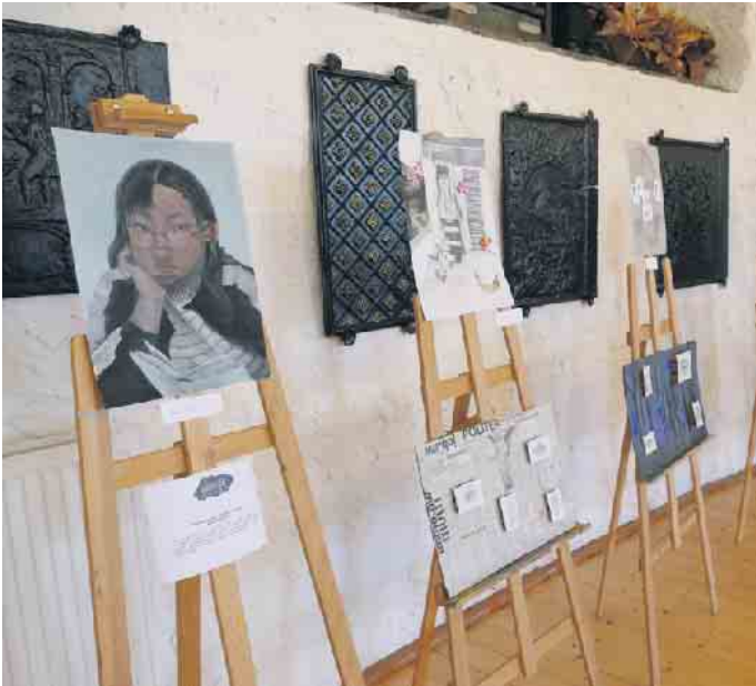
Portraits verdeutlichen unter anderem, dass die Beschäftigung mit der Wirklichkeit auch immer zu einer Auseinandersetzung mit sich selbst führt.