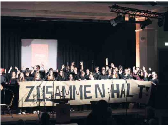
Zum Abschluss wurde ein Banner entrollt, das die Solidarität mit der Kampagne „Wir sagen Zusammen:halt“ des Erzbistums Paderborn zum Ausdruck brachte.