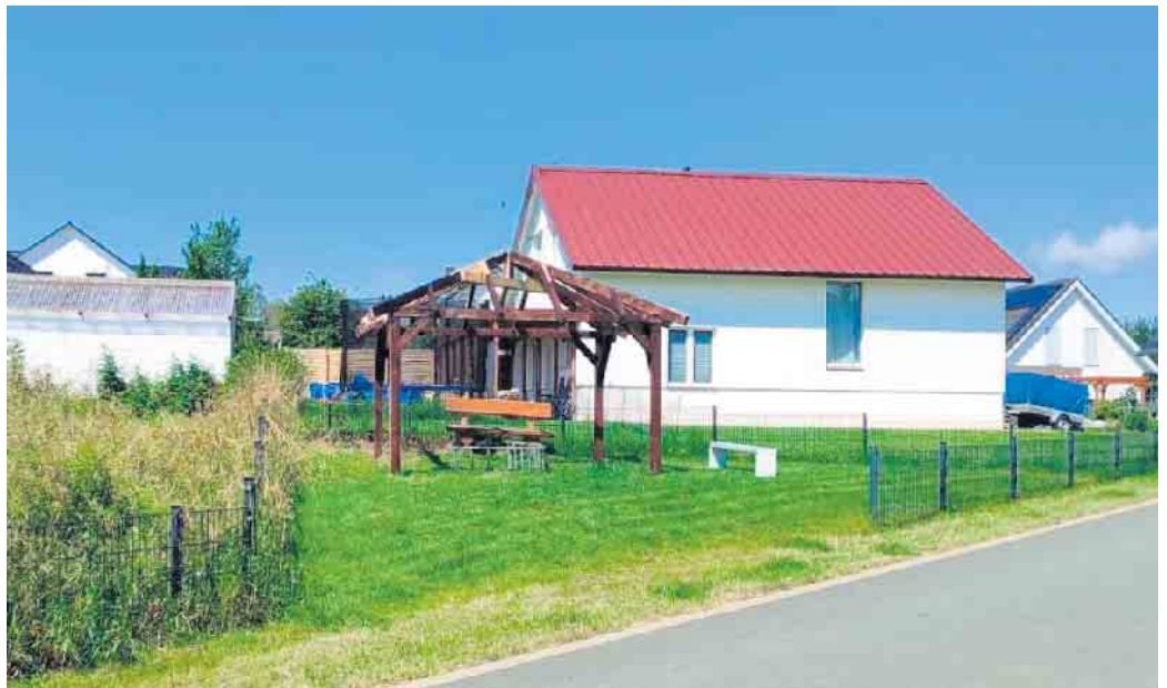
Dieser Pavillon in Reelsen wurde von Ehrenamtlichen für die Dorfgemeinschaft aufgebaut. Das Foto ist im Sommer 2024 entstanden.

Die Stadt hatte das Baugrundstück erst kürzlich nach einem Rechtsstreit zurückerhalten. Entgegen früherer Zusagen der Verwaltung, für eine ordnungsgemäße Ausschreibung im Mitteilungsblatt zu sorgen, scheint man nun einen anderen Weg einschlagen zu wollen. Die GRÜNEN sehen dieses Vorgehen kritisch. „Offenheit und Transparenz und die Einhaltung beschlossener Regeln, sind bei der Vergabe städtischer Grundstücke essenziell“, so Bernd Blome. „Wir erwarten, dass hier nachvollziehbar und im Sinne der