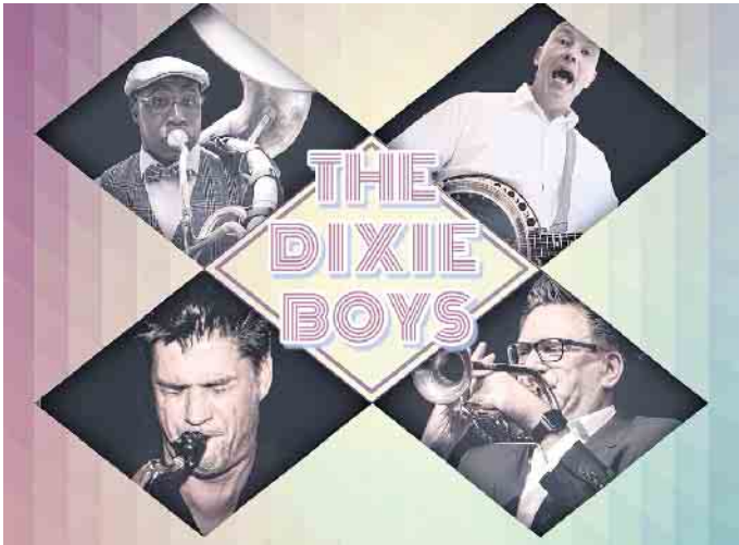
Die vier professionellen Musiker der Dixieboys sorgen auf dem Bad Driburger Winzerfest für gute Laune.

Vorverkauf für das Winzerdinner startet am 17. April