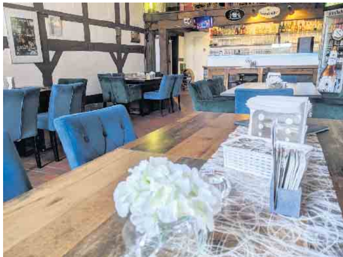
Der gemütliche Gastraum im Fachwerkbambiente.

Andy's Deelee in Altenbeken ist Bistro, Café, Restaurant und Eventlokal unter einem Dach.