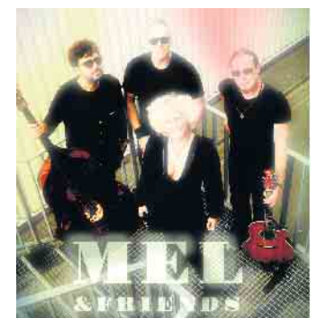
Mel & Friends animiert auf dem Bad Driburger Winzerfest zum Mitsingen, Mitmachen und Genießen.

Weitere Infos: Bad Driburger Touristik GmbH, Lange Str. 87, 33014 Bad Driburg, Telefon 05253 98940 sowie unter www.bad-driburg.com