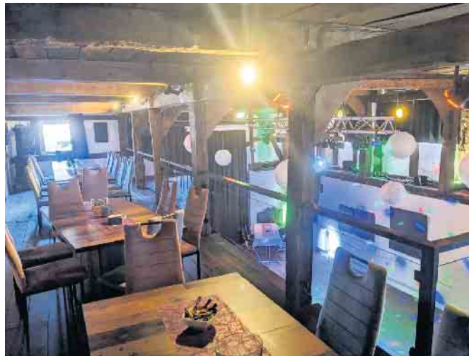
Die urige Galerie ist bei vielen Gästen besonders beliebt.

„Alle Torten und Kuchen mache ich selbst, denn das ist schließlich mein ureigenes Metier“, sagt der Bäcker und Konditor. Ein besonderer gastronomischer Tipp ist Andy's Deelenpizza, die donnerstags und freitags auf der Speisekarte steht. „Die Deelenpizza mache ich mit richtigem Bäcker-