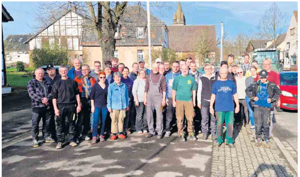
Teilnehmer des Dorfaktionstag Herste 2024

Alle Herster sind aufgerufen mit anzupacken. Also, seid dabei und sorgt so für ein sauberes und noch lebenswerteres Heimatdorf.