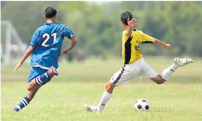
Vereine, die jugendliche Mitglieder betreuen, können einen Antrag auf Förderung stellen.

Für die Jugendarbeit der Vereine aus dem Stadtgebiet von Bad Driburg stehen in diesem Jahr erneut Mittel aus dem Jugendpflegefonds im Haushalt bereit, um so die Vereine zu fördern. Um die Aufteilung der Mittel zu berechnen, werden von den Vereinen, die jugendliche Mitglieder betreuen, verschiedenste Angaben benötigt. Hierfür nutzen Sie bitte das Antragsformular, welches auf der Homepage der Stadt https://www.bad-driburg.de/de/aktuelles/meldungen/Jugendpflegefonds-2025.php zum Download bereitgestellt ist, oder direkt in der Stadtverwaltung abgeholt werden kann. Für Ihre Angaben zu