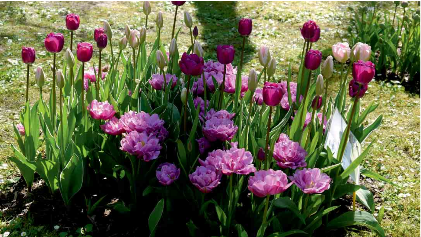
Die Tulpenshow mit ihren 280 verschiedenen Tulpensorten bietet wieder ein farbenfrohes Spektakel. Bericht im Innenteil