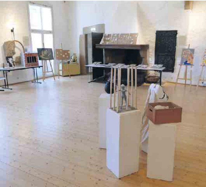
Plastiken, Zeichnungen und Malereien zeugen von der vielfältigen Auseinandersetzung mit dem Thema Wirklichkeit.