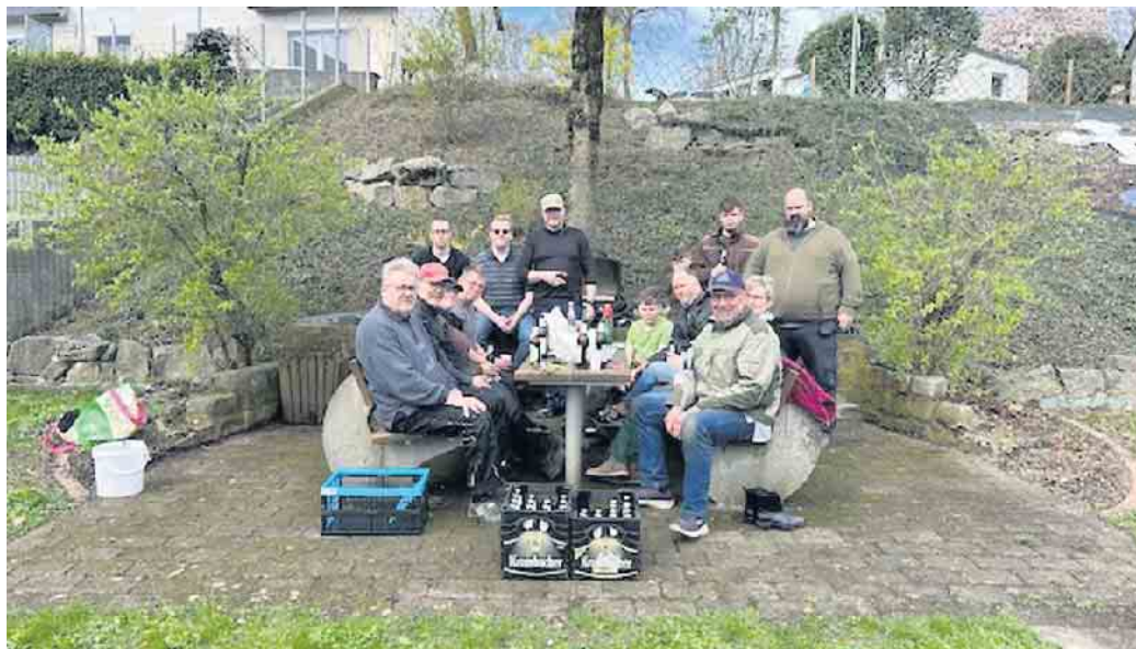
Ein Großteil der Helfer des Dorf-Aktionstages.

der großartigen Lage des Maibaumplatzes, genoss man die Sonne um einiges länger als sonst! Ortsheimatpfleger René Möller