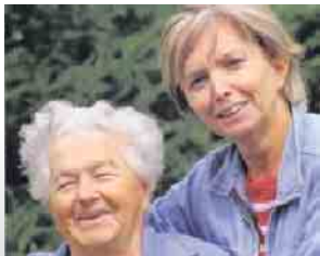
Meine Mutter braucht Pflege