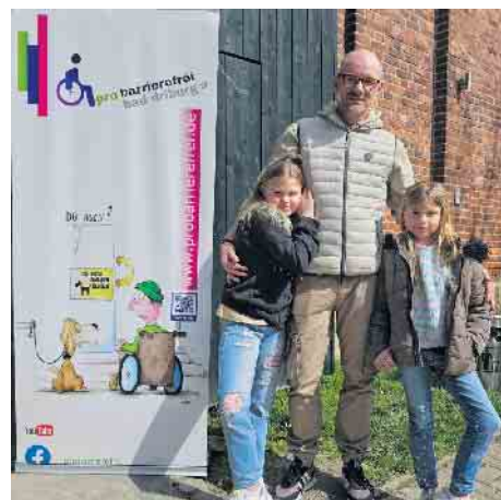
Zu Gast bei der Scheunenbörse

Scheunenbörse zur Verfügung stellte. Auch ein Zugang von hinten erwies sich wegen des Kieses als schwierig und es wurde klar deutlich, dass eine solche Ortsbesichtigung immer genau zu erfolgen hat. Bei der Toilette hingegen wurden nur leicht zu behebende Barrieren gefunden. Dies waren die fehlenden Griffe bei der Behindertentoilette und die Tür, die zu einer Schiebetür umgebaut werden könnte. Dazu wurde angeregt, dass der Heimatverein sich eine eigene, vielleicht geförderte, Rampe anschaffen könnte. Diese Rampe könnte dann bei sämtlichen Veranstaltungen in der Scheune zum Einsatz kommen, um auch Rollstuhlfahrern einen Zugang dazu zu ermöglichen. Weitere Informationen unter www.probarrierefrei.de oder telefonisch unter 01511 24 83 764.