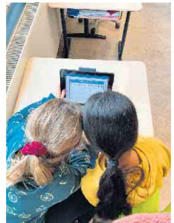
Unterricht am Ipad.

Dabei gehe es insbesondere zunächst um das Textverarbeitungsprogramm „word“, das bereits in den Grundschulen erlernt wird. Das Projekt beschreibt genau, welche Lernziele hierbei erreicht werden sollen und wie