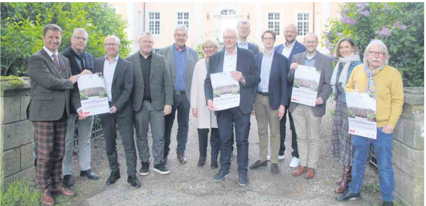
Die Beteiligten und Sponsoren freuen sich auf das vierte Landluftkonzert der NWD auf Schloss Rheder.