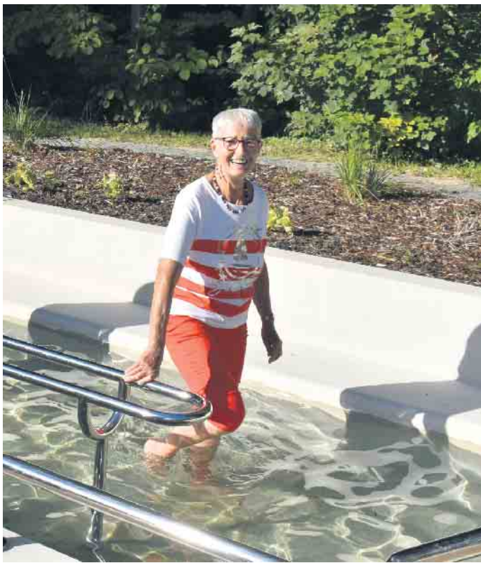
Das Tretbecken am neuen Kneipp-Erlebnispfad auf dem ehemaligen Eggelandareal.

Wasser herausgezogen werden - Storchengang genannt. Diese Bewegung sollte aber nur solange durchgeführt werden, bis man einen starken Kältereiz spürt. Dieser erzeugt meist eine gleichmäßige, zarte Rötung, was ein Zeichen der verbesserten Durchblutung ist. Das Wassertreten ist die wohl bekannteste Kneippsche Therapiemethode. Sie wirkt positiv bei müden Gliedern und regt Kreislauf, Stoffwechsel und Durchblutung an. Richtig durchgeführt kann sie unter anderem Schlaflosigkeit lindern und das Immunsystem stärken. Besonders Wanderer in und um Bad Driburg lieben die erfrischende Wirkung und das Verweilen an den verschiedenen, zum Teil stark frequentierten Tretbecken. Einige werden durch private Initiativen gepflegt. Vier werden direkt durch Quellwasser gespeist. Die Bad Driburger Touristik GmbH plant für dieses Jahr die Entwicklung von Tageswanderungen zu den Tretbecken mit abschließender Einkehr bei den Top-Gastronomen der Kurstadt.