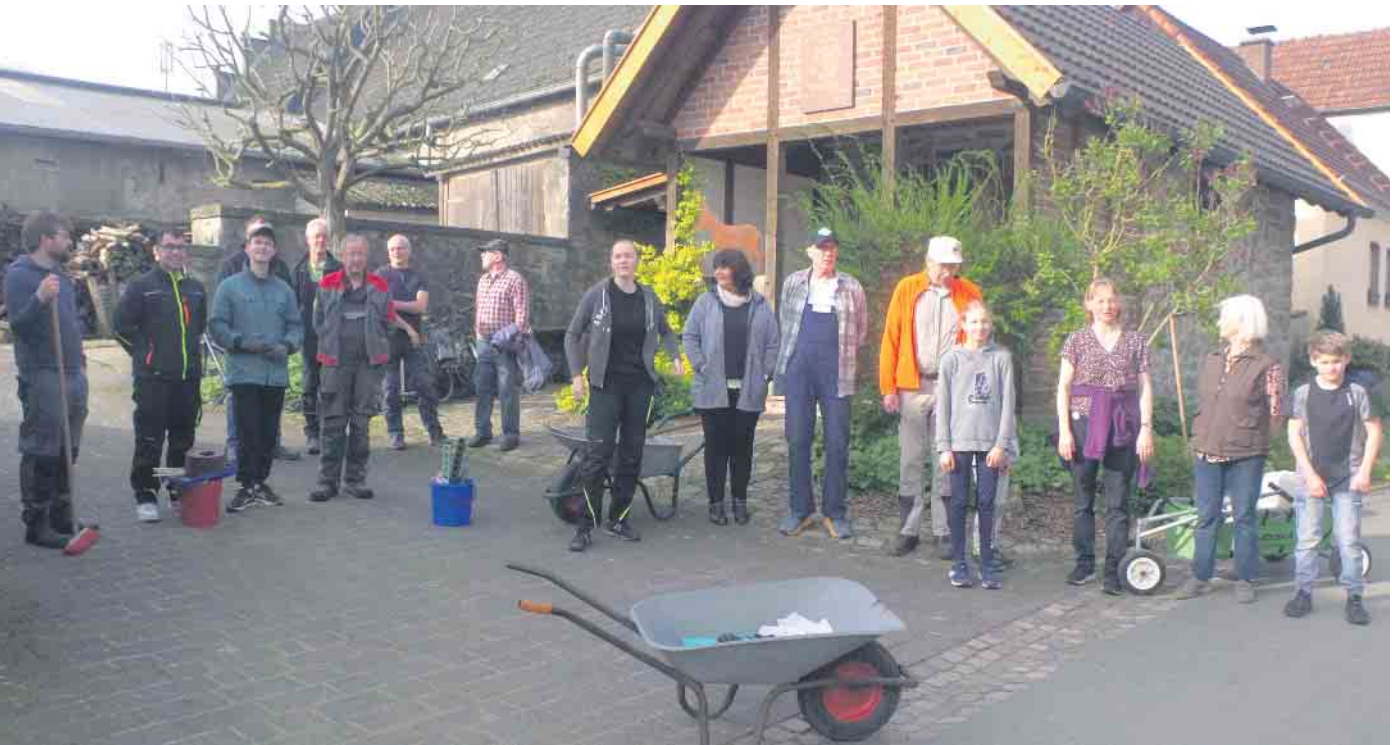
Treffen zum Dorfaktionstag in Reelsen