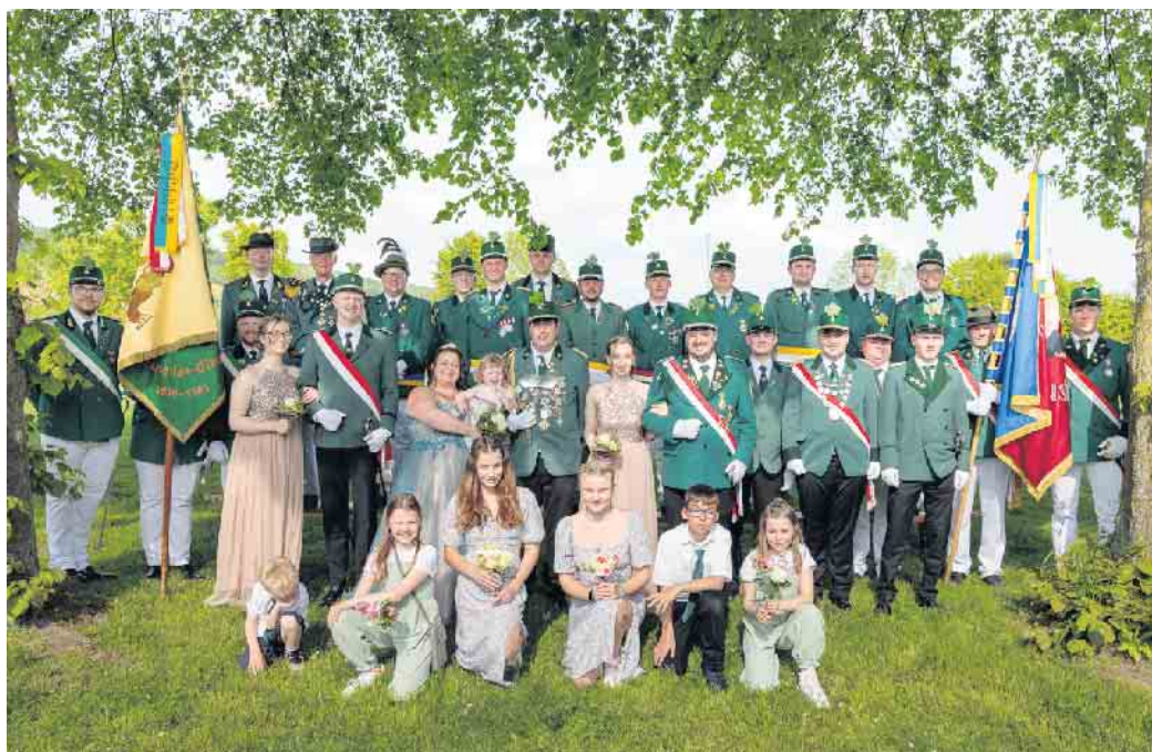
Königsfamilie, Jungkönig und Vorstand der St. Vitus Schützengilde Alhausen

gibt es dieses Jahr auch eine große Hüpfburg für unsere jungen Gäste. Zum Tanz am Abend spielt