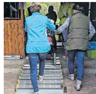
Unsere Rollrampe hat hunderte von Rädern in die Börse verholfen

Diese Probleme zeigten sich nämlich schon am Sonntag zuvor bei einer Ortsbesichtigung. Die Rampe, die der Heimatverein gestellt hatte, war für Kinderwagen gerade noch geeignet, wenn auch die beiden Seiten immer, dessen Breite entsprechend, verschoben werden mussten. Bei Rollstühlen oder E-Mobilen, vor Allem mit unterschiedlichen Reifenabständen, waren diese jedoch ungeeignet, sodass pro barrierefrei eine eigene Rampe für die