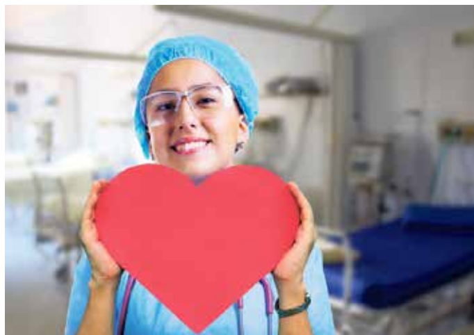
Jugendliche erhalten Einblicke in Berufsfelder.