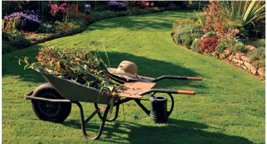
Nun ist der richtige Zeitpunkt für den Rückschnitt.

Viele Ziergräser und spätblühende Stauden haben den Winter über mit ihren Halmen und Samenständen Struktur in den Garten gebracht. Nun ist der richtige Zeit-