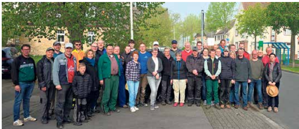
Teilnehmer des Dorfaktionstag Herste 2025

Alle Herster sind aufgerufen mit anzupacken. Also, seid wieder dabei und sorgt so für ein sauberes und noch lebenswerteres Heimatdorf. Bitte überlegt euch an welcher Aufgabe ihr euch gerne beteiligen