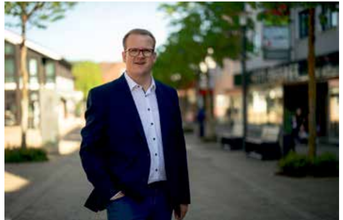
Ihr Tobias Tölle Bürgermeister

Am 21. Juni feiern wir ein großes Familienfest vor dem Rathaus. Alle Familien sind eingeladen, eine Sternfahrt mit dem Fahrrad zum Bad Driburger Rathaus zu machen unter dem Motto „Sternfahrt zum Bad Driburger „RADhaus“ - Die Kinder der Stadt besuchen den neuen Bürgermeister“. Ein buntes Programm mit u.a. „Fahrradgeschicklichkeits-Parcours der Polizei“, Riesenrutsche, Hüpfburg uvm. wartet auf alle kleinen Radler. Für Essen und Getränke vor Ort ist gesorgt, sodass alle gestärkt am frühen Abend individuell den Rückweg mit ihren Fahrrädern antreten können.