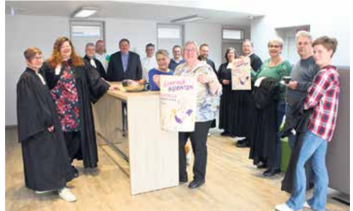
Freuen sich auf das Trau- und Segensfest: Die Mitwirkenden haben sich bei einer Fortbildung vorbereitet, damit es für die Paare ein besonderer Moment wird.

Zentraler Ort der Aktion in Bad Driburg ist die Evangelische Kirche an der Brun-