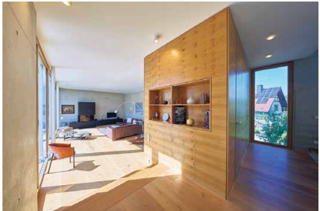
Hier entfaltet das Furnier der Asteiche seine außergewöhnliche Wirkung.

Furnieroberfläche ist nicht gleich Furnieroberfläche. Zu der im Baum gewachsenen Einzigartigkeit jedes einzelnen Furnierblattes kommt das kunstvolle Zusammensetzen der Blätter zu einem harmonischen Gesamtbild. „Die Mitarbeitenden in der Furnierindustrie, die Furnieroberflächen in allen denkbaren Größen planen und fertigen, vereinen handwerkliches Können mit einem ausgeprägten künstlerischen Blick. Der Kundenwunsch ist das eine - doch was am Ende entsteht, stellt Auftraggeber aus der Möbel-, Automobil- und Bodenbelagsindustrie sowie aus dem Innenausbau immer wieder aufs Neue mehr als zufrieden“, erklärt Dirk-Uwe Klaas, Geschäftsführer der Initiative Furnier + Natur (IFN). Wie Furnier durch verschiede-