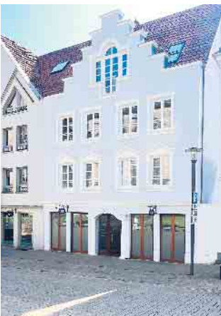
Barrierefrei und Parkplätze direkt vor der Tür, die Praxisräume sind gut zu erreichen.

und Erwachsenenalter und Sprach-, Sprech- und Schlucktherapien (u. a. nach Schlaganfall oder anderen neurologischen Erkrankungen wie bspw. Parkinson oder MS) und bei Lese- und Rechtschreibstörungen, können wir auf einen reichhaltigen Wissens- und Erfahrungsschatz zugreifen. Dieser kommt unseren Patienten zugute. Mit vereinter Schaffenskraft, großer Motivation und Freude werden wir auch in unserer neuen Praxis weiter für Sie da sein. Wir bedanken uns für das Vertrauen durch Ärzte, Pflegepersonal, Eltern und Patienten. Terminvereinbarungen können wie bisher telefonisch unter 05253 - 932557 erfolgen.