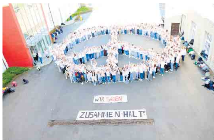
Die Schülerinnen und Schüler stellten sich gemeinsam auf und bildeten ein Friedenssymbol.