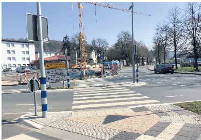
Der Zebrastreifen führt geradewegs auf den Bauzaun. Kein Warnschild weist darauf hin, dass es da nicht weitergeht.

Ende: Aus der Arbeit der Parteien Bündnis90 / Die Grünen