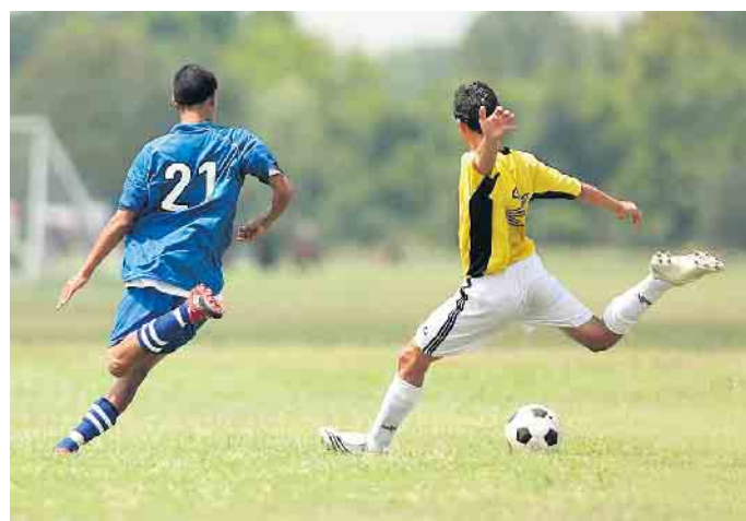
Vereine, die jugendliche Mitglieder betreuen, können einen Antrag auf Förderung stellen.

Ein Rechtsanspruch auf Gewährung von Zuschüssen besteht nicht, die Zuschussgewährung erfolgt gemäß den am 01.01.1986 in Kraft getretenen Richtlinien zur Förderung der Jugendarbeit durch die Stadt Bad Driburg.