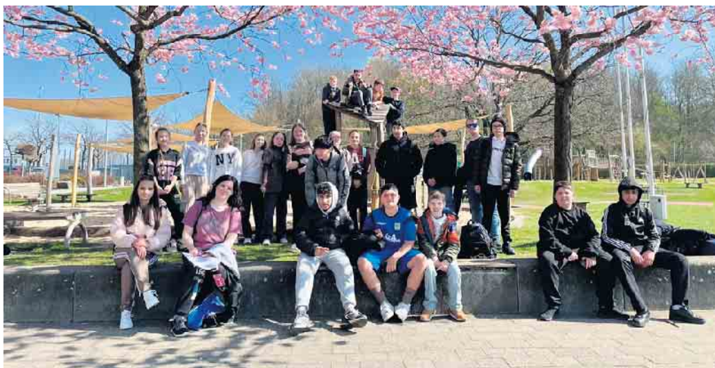
Die Klasse 6a verbrachte einen Tag im HNF und Ahorn-Sportpark.

meinschaftsbildendes Erlebnis, das allen noch lange in Erinnerung bleiben wird.