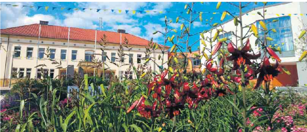
Bad Driburger Rathaus mit erblühtem Vorplatz.

Sie kennen die schönsten Gebäude von Bad Driburg oder vielleicht auch einen Geheimtipp und haben ein wunderschönes Foto davon gemacht? Dann mailen Sie es an pressestelle@bad-driburg.de . Die Stadt Bad Driburg sucht „die schönsten Bad Driburger Bauwerke“. Die besten Fotos werden im Rathaus ausgestellt, und der Gewinnerin oder dem Gewinner winkt ein Gutschein der Driburg Therme über einen Relax-Tag. Bewerbungsschluss ist der 13. Juni; danach entscheidet eine Jury über die Vergabe des Preises. Wir wünschen viel Erfolg!