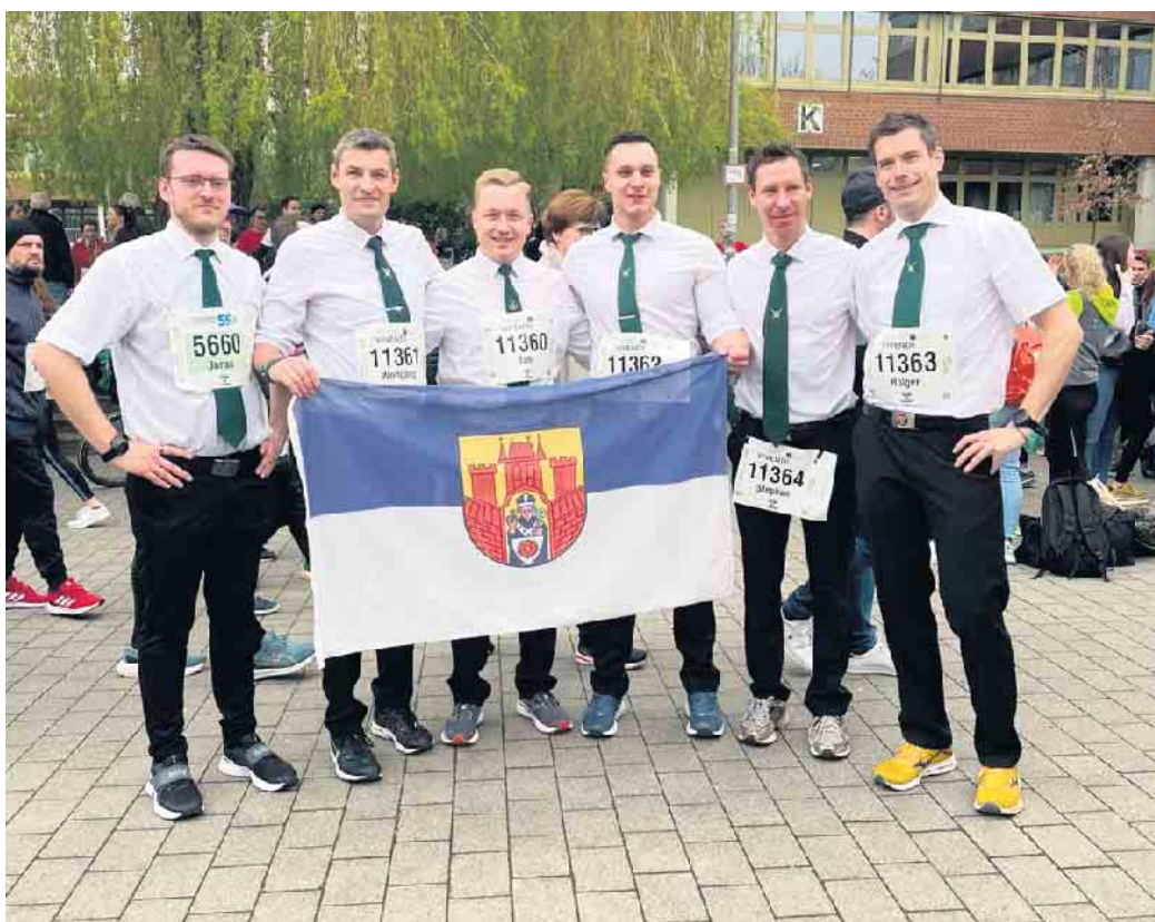
Die Teilnehmer beim letzten Osterlauf in Paderborn.

Verwendungszweck: Inklusive Fußballmannschaft CWW