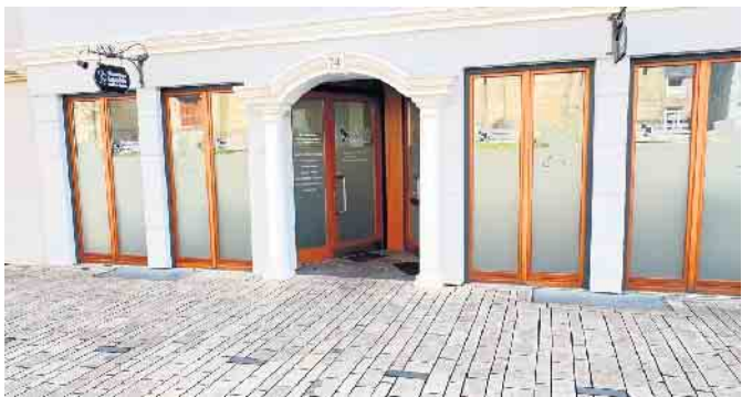
In der oberen Lange Straße befinden sich die neuen Räume der Logopädie-Praxis Gerlach.