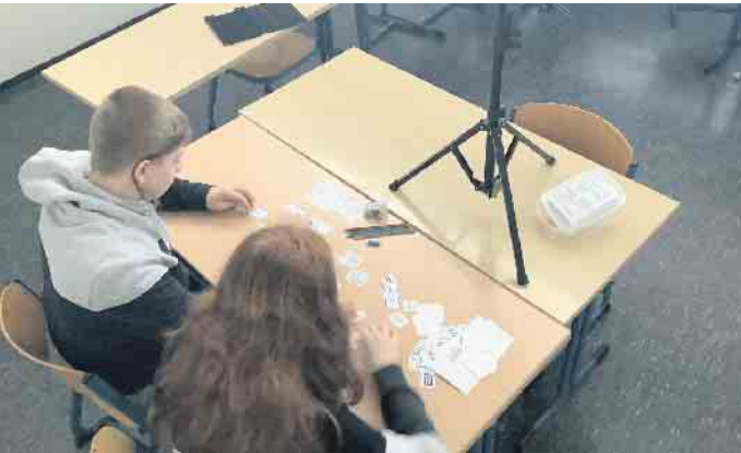
Das Projekt wurde von der Universität wissenschaftlich begleitet.

Erfolgreiche Zusammenarbeit zwischen der Universität Paderborn und der Gesamtschule Bad Driburg