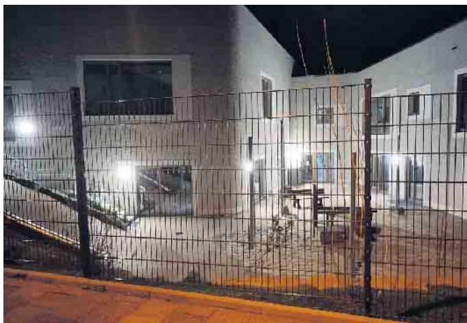
Volles Licht an der Kita an der Georg-Nave-Straße.