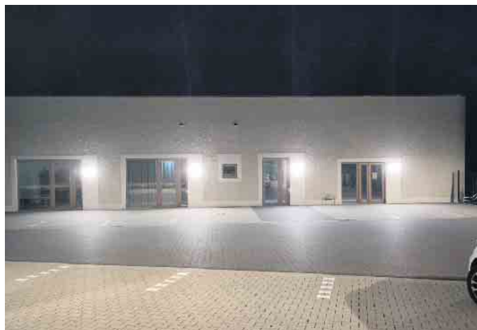
Nicht nur der Parkplatz ist hell erleuchtet, auch die Fassade erstrahlt.

Nachdem auf unsere Intervention im Herbst 2023 die Beleuchtung herunter gestuft wurde, gab es im Frühjahr - vor der Zeitumstellung - erneut Beschwerden. Nach der Zeitumstellung haben wir uns die Lage noch mal angeschaut. Und in der Tat: Sonntags abends kurz nach 21 Uhr erstrahlte der Kindergarten in gleißend hellem Licht. Wir GRÜNE fragen uns: warum? Gibt es ein Anwendungsproblem?