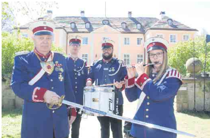
Das Hoffest der Schlossbrauerei feiert die alten Traditionen.

Die Schlossbrauerei Rheder blickt auf ein erfolgreiches Jahr 2023 zurück. Für das laufende Jahr sind bereits viele Events geplant. Los geht es mit dem Hoffest am 28. April.