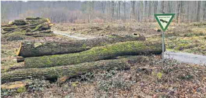
Dieses Foto zeigt keine Fläche in der Egge. Wir wollen keinem Förster, der nach den aktuellen Regeln wirtschaftet, Vorwürfe machen. Das ist alles völlig legal!

der Egge - ist eben Forstwirtschaft erlaubt. Und zwar mit Maschinen. In einem Nationalpark sieht das anders aus: hier haben eher Harvester ein Betretungsverbot als Menschen. In einem Nationalpark sollen weite Gebiete der natürlichen Entwicklung überlassen werden. Und es gilt: die ökologisch so wertvolle Egge wird nicht in 20 verschiedene Naturschutzgebiete zersplittert, sondern auf allen Flächen geschützt, die dem Land NRW gehören. Die Egge ist mit ihrer Einzigartigkeit und ihrem Naturreichtum für einen Nationalpark wie geschaffen. Diese Fülle an Lebensräumen bietet eine nachhaltige Grundlage für eine große Artenvielfalt. Die ausgedehnten Waldflächen, die zahlreichen Höhlenstrukturen und die Quellen und Bachläufe sind eindrucksvoll und verdienen es, als Nationalpark geschützt zu werden. Sie haben Interesse, den Egge-Nati-