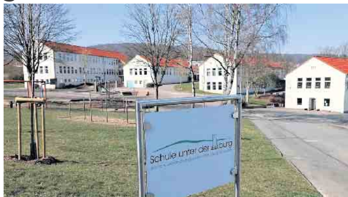
Schule unter der Iburg

Zu guter Schulbildung gehört neben einem engagierten Team von Lehrkräften eben auch ein nicht nur funktionaler, sondern dem pädagogischen Konzept angepasster Schulbau.