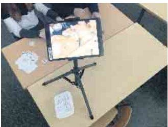
Das Erarbeitete wurde so aufbereitet, dass damit Erklärvideos angefertigt werden konnten.