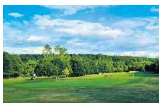
Das Grün der Bahn 18 von der Terrasse aus gesehen

Auch die Gastronomie des Bad Driburger Golfclubs ist nicht nur für Mitglieder, sondern auch für alle anderen Gäste geöffnet. Spaziergänger, Kurgäste, Familien,