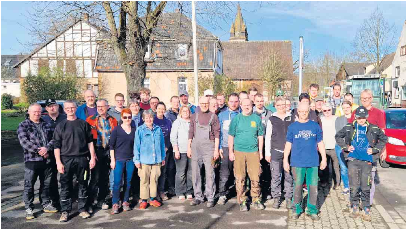
Teilnehmer am Dorfaktionstag