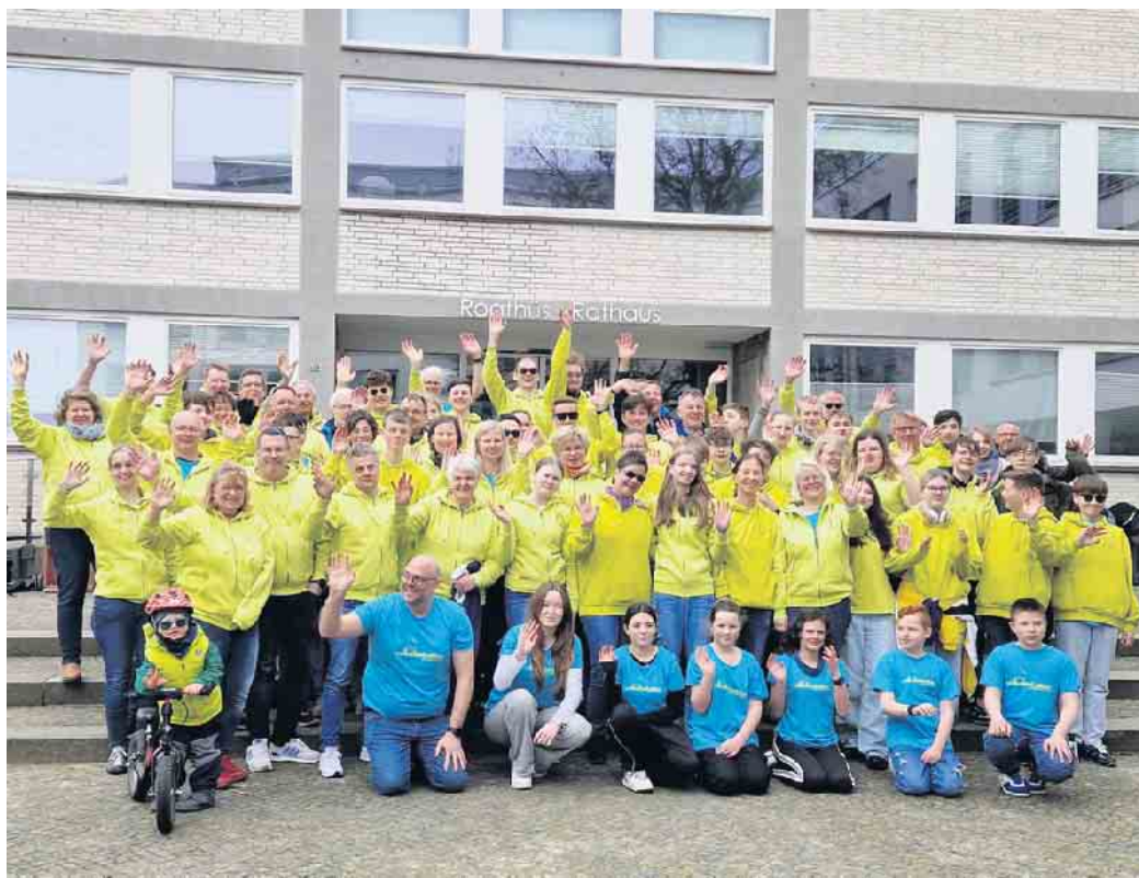
Vorfreude auf das Konzert vor dem Helgoländer Rathaus

In nur vier Tagen erarbeitete das Projektorchester mit kompetenter Unterstützung durch professionelle Dozenten aus dem Musikcorps der Bundeswehr und der Blasmusikszene ein anspruchsvolles Programm. Bei strahlendem Sonnenschein präsentierte das Orchester bei seinem traditionellen Abschlusskonzert auf dem Helgoländer Rathausplatz ein abwechslungsreiches Programm zwischen Musical, Pop und Rock einem begeisterten Publikum. In der Freizeit erkun-