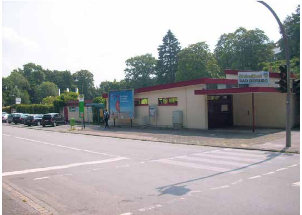
Das Freibad an der Brunnenstraße.