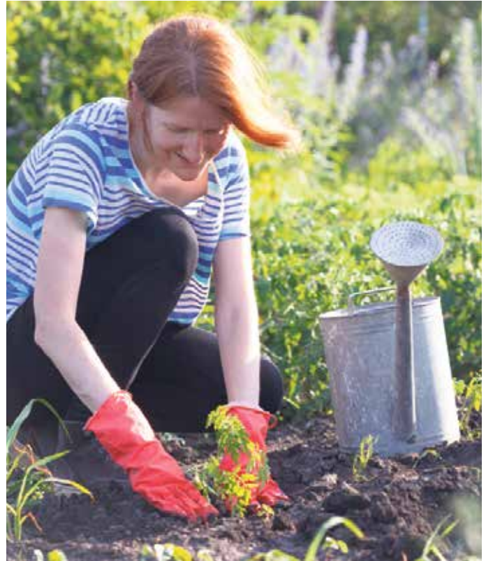
Bevor im Kreis Höxter gegraben und gepflanzt wird, sollte der Tetanus-Impfschutz überprüft werden.

Weitere Informationen über Nutzen und möglichen Nebenwirkungen der Tetanus-Auffrischungsimpfungen für Jugendliche und Erwachsene liefert die AOK-Faktenbox unter www.aok.de/faktenboxen im Internet. Antworten auf viele Fragen rund um den Tetanus-Impfschutz bietet auch das Robert-Koch-Institut online unter RKI - Impfungen A - Z - Schutzimpfung gegen Tetanus: Häufig gestellte Fragen und Antworten.