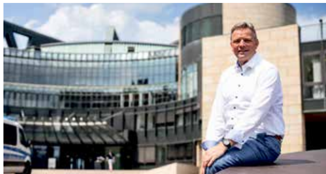
Landtagsabgeordneter Matthias Goeken

„Der Kreis Höxter hat in den vergangenen Jahren von hohen Fördersummen profitiert - zum Beispiel im Bereich der Dorferneuerung, der Stärkung der Infrastruktur, der Sanierung von Feuerwehrgerätehäusern oder dem Ausbau des Breitband- und Mobilfunknetzes. Drei weitere große Themen waren die Landesgartenschau 2023, die Verhinderung eines Atommüll-Zwischenlagers in Würzgassen und die Abwendung einer Bewerbung für einen Nationalpark in der Egge. Alle Anträge und Forderungen habe