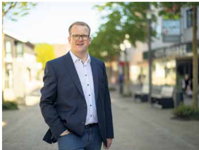
Bürgermeister Tobias Tölle