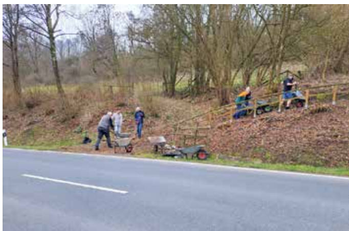
Mulchen des Johannes Gelhaus Weges