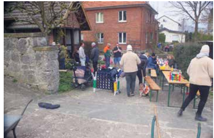
Mahlzeit am Backhaus nach der Arbeit