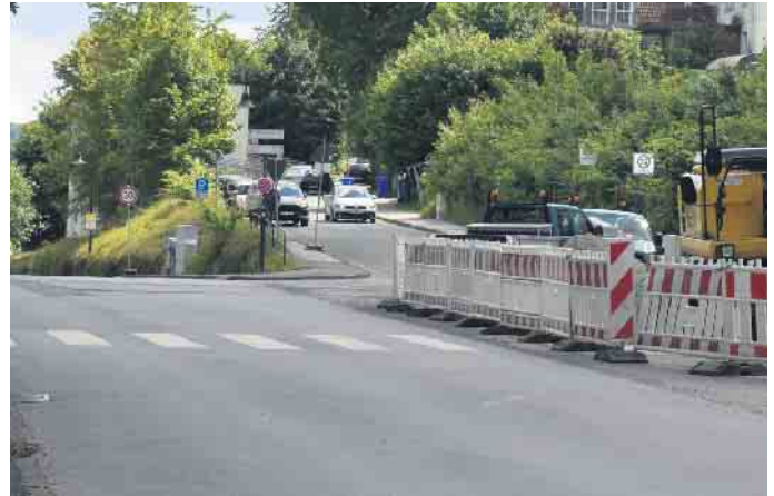
Die Asphaltdecke wird erneuert.

Der Kreis Höxter und die Stadt Bad Driburg bitten wegen der unvermeidbaren Behinderungen während der Bauphase um Verständnis.