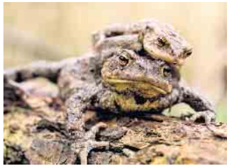
Erdkröten haben goldene Augen.

werweise in jedem Jahr einen mobilen Amphibienzaun aufgebaut. Das ist aber keine Dauerlösung. Kostengünstiger wäre ein fest installierter Zaun, der nicht in jedem Jahr auf- und wieder abgebaut werden müsste. Und noch besser wäre ein Ersatzgewässer, an das sich die Tiere gewöhnen könnten, sodass sie die Straße zum alten Teich nicht mehr in so großer Zahl überqueren müssten. Leider konnte bisher mit den Grundstückseigentümern der Obstwiese und des Friedhofes sowie der Flächen drumherum noch keine einvernehmliche Lösung gefunden werden, diese Schutzmaßnahmen zu ergreifen. Die Kosten dafür trägt der Kreis, so dass keine finanzielle Belastung auf die Eigentümer zukommt.