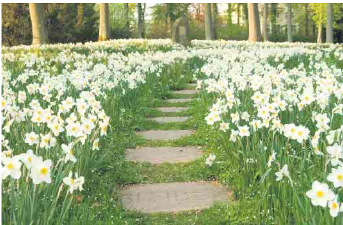
Präsentiert sich jedes Jahr in einem blühende Narzissenmeer: Der Hölderlin Hain in Gedenken an den Dichter Friedrich Hölderlin, der hier 1896 wohl die schönste Zeit seines Lebens verbrachte.