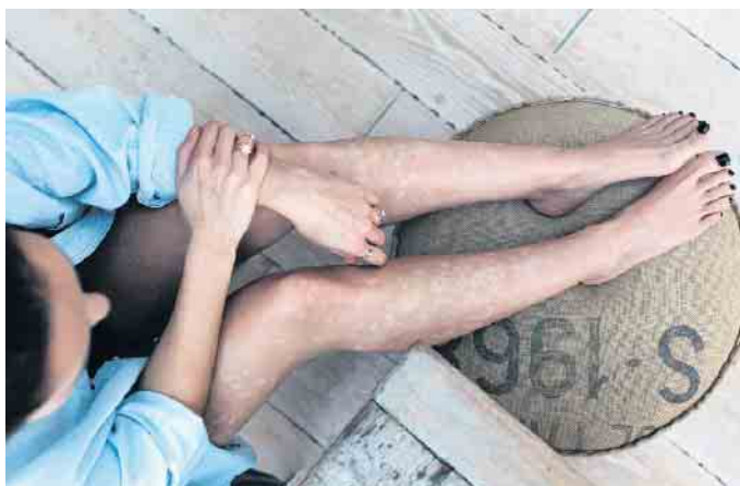
Flecken und Schuppen auf der Haut belasten die Betroffenen meist ganz erheblich.

Zwar ist die Hauterkrankung nicht heilbar, jedoch gut zu behandeln. Mit sogenannten Biologika ist bei einer mittelschweren bis schweren Form der Psoriasis eine erscheinungsfreie Haut möglich. Diese biotechnologisch hergestellten Stoffe unterdrücken die Wirkung bestimmter Botenstoffe, die stark am Entzündungsgeschehen der Schuppenflechte beteiligt sind. Die modernen Biologika kommen bisher aber nur sehr zurückhaltend zum Einsatz. Maßgeblich für eine erfolgreiche Behandlung ist daher der Zugang zu einem Spezialisten, denn nicht alle Dermatologen schöpfen das Therapiespektrum aus.