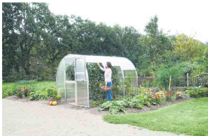
Rückschonend gärtnern und dabei eine reiche Ernte einfahren: Gewächshäuser bieten viele Vorteile.

Wichtig für das gute Gedeihen ist neben einem sonnigen Standort auch eine gute Durchlüftung im Gewächshaus. Praktisch sind daher Modelle mit aufschiebbaren Seitenteilen, durch sie ist zudem ein flexibler Zugang möglich. Neben diesen Vorteilen bietet etwa das Gewächshaus Arcus weitere praktische Eigenschaften für Hobbygärtner, die mehr ernten möchten. Durch den Fundamentrahmen lässt es sich beliebig versetzen, um eine Bodenermüdung zu vermeiden. Das kompakte Rundbogensgewächshaus ist in fünf Standardlängen von 2,10 Metern bis hin zu 6,10 Metern erhältlich, mit