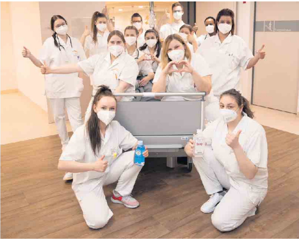
Das Bildungszentrum der KHWE beteiligt sich am „Boys’ and Girls’ Day“ am Donnerstag, 27. April.

Ausbildung bei der KHWE Darüber hinaus können sich die Teilnehmer an diesem Tag über die Ausbildung zum Pflegefachmann oder zur Pflegefachassistentin informieren. Das Bildungszentrum der KHWE arbeitet mit allen Standorten des Klinikum Weser-Egge in Brakel, Höxter, Bad Driburg und Steinheim zusammen, das heißt mit insgesamt 25 Fachkliniken und Instituten, außerdem mit stationären und ambulanten Pflegeeinrichtungen im