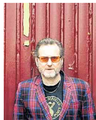
Die Musik von Stefan Stoppok ist wie Poesie in Noten. In Bad Driburg steht er solo auf der Bühne.