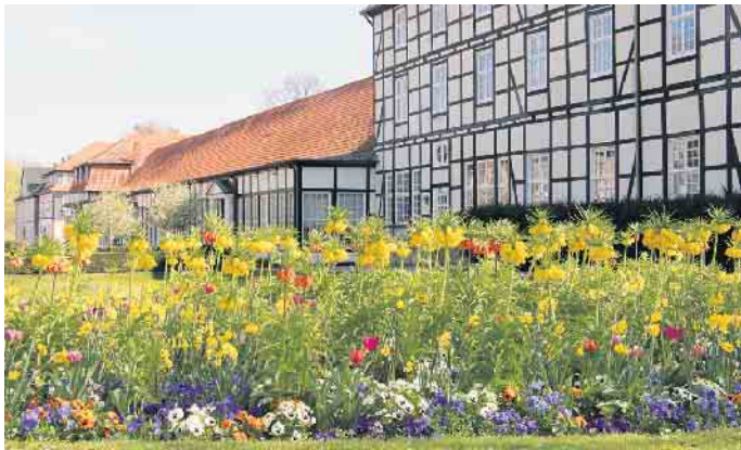
Die Beete im Gräflichen Park werden zweimal jährlich mit neuen Blumenkombinationen bepflanzt.