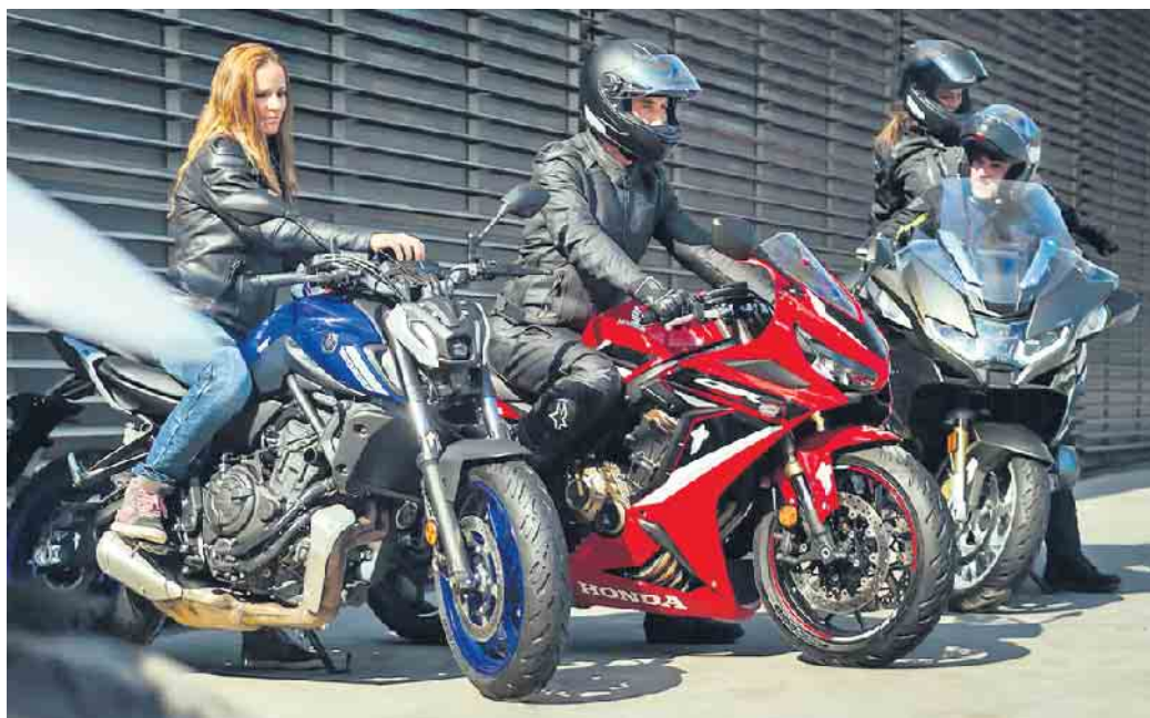
Die Freiheit auf zwei Rädern genießen - hochwertige und gut gepflegte Reifen sorgen dabei für ein sicheres Vergnügen.

Für Biker gibt es kaum Schöneres als eine Tagestour mit Freunden, bei der man besondere Augenblicke teilt. Gute Reifen verbinden dabei Fahrspaß mit Sicherheit und Komfort. Allgemein dürfen Reifen gefahren werden, bis die gesetzliche Verschleißgrenze von 1,6 Millimetern Profiltiefe erreicht ist oder Alterungsspuren sichtbar werden. Auf Nummer sicher gehen alle, die Motorradreifen nach fünf Jahren einmal jährlich von einem Fachmann prüfen lassen und die Reifen nach maximal sieben Jahren austauschen. Durch einen Wechsel profitieren Motorradfahrer gleichzeitig von aktuellen Weiterentwicklungen unter anderem bei der Profilgestaltung, den Rohmaterialien