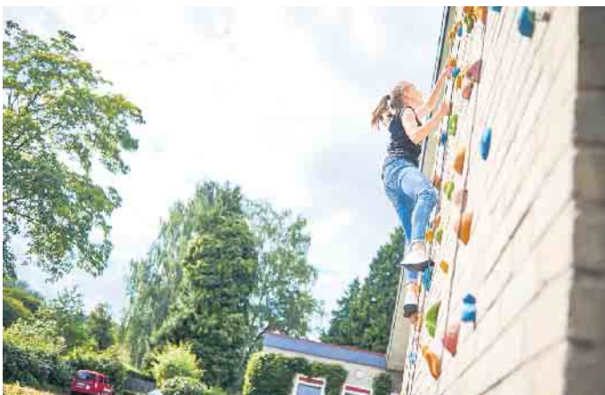
Kletterwand begeistert viele Kinder