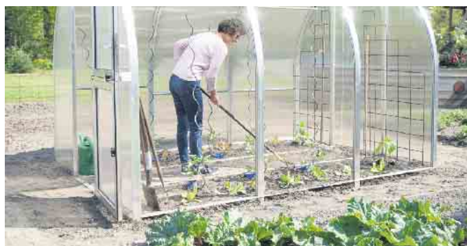
Weit zu öffnende Seitenelemente sorgen im Gewächshaus für die notwendige Frischluftzufuhr.

Praktischerweise kann die Ernte und Pflege der Pflanzen von allen Seiten erfolgen. (djd)