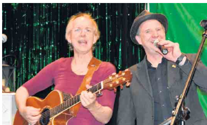
Sorgen für irisches Flair und gute Stimmung: das Irish Folk Duo Alive & Drunken. Das Repertoire reicht von Balladen bis zu eingängigen „Sauf- und Raufliedern“.

ab 14 Uhr unter anderem die Stadtkapelle Bad Driburg mit ihrem breiten Repertoire. Ab 16 Uhr erwarten die Bad Driburger Gäste auf der Livebühne das Beste, was die irische Musik zu bieten hat mit der Irish Folk Band „Alive and Drunken“. Der Werbering und die Bad Driburger Touristik GmbH freuen sich auf zahlreiche Besucher, ein buntes Programm und eine ausgelassene Frühlingsstimmung beim diesjährigen Frühlingserwachen.