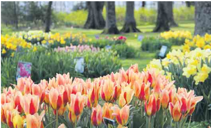
Jedes Jahr wieder eine Attraktion: Die Tulpenshow im Gräflichen Park Bad Driburg.

Aktuelle Informationen auch unter www.graeflicher-park.de