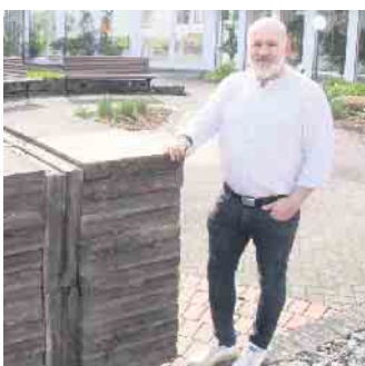
Im Außenbereich des Hotels wurden große Flächen entsiegelt. Im Innenhof startet am Vatertag die Biergartensaison.

Bad Driburger Gesellschafterkonsortium hatte den rund 4.000 Quadratmeter großen Hotelkomplex übernommen und stellt den Betrieb mit Martin Braun als Geschäftsführer neu auf. Es gibt dort über 100 Betten sowie einen großen Tagungs- und Spa-Bereich. Vor allem aber will sich das B-Vier mit seinen gastronomischen Angeboten der örtlichen Bevölkerung stärker öffnen.