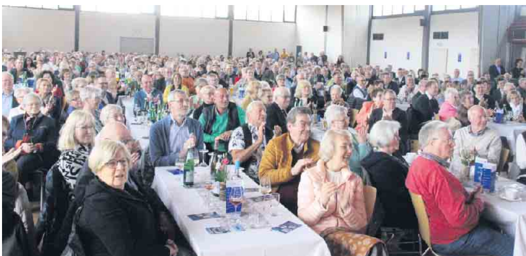
Tolle Stimmung in der ausverkauften Nethehalle.