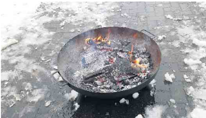
Besondere Atmosphäre am Lagerfeuer- und Grillplatz.