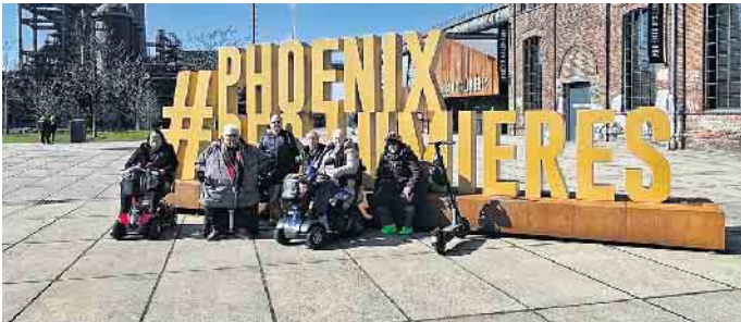
Am Ziel angekommen - Phoenix des Lumières in Dortmund

in den Genuss von Kultur kommen können. Weitere Informationen unter www.probarrierefrei.de oder telefonisch unter 01511 24 83 764.