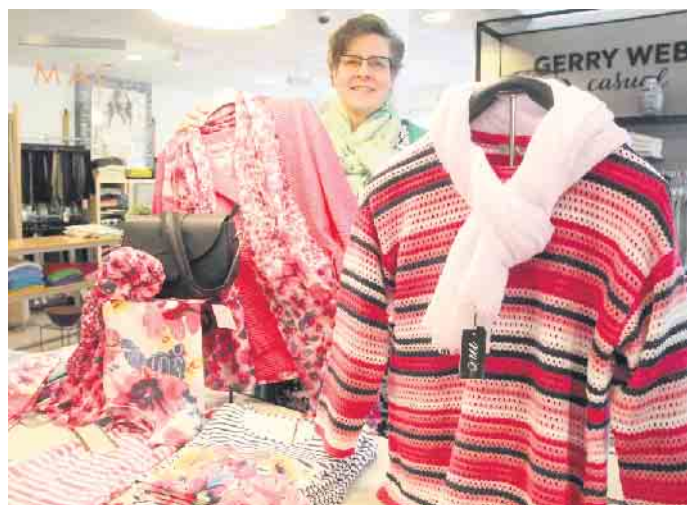
Das Modehaus Schulz in Brakel feiert in diesem Jahr sein 40-jähriges Bestehen.