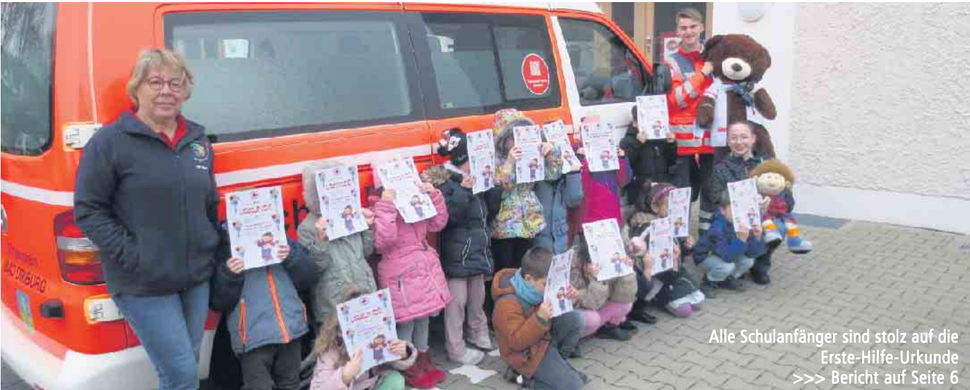
Alle Schulanfänger sind stolz auf die Erste-Hilfe-Urkunde >>> Bericht auf Seite 6