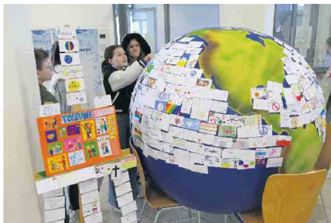
Die von der Projektgruppe „Humanitäre Schule“ gestaltete Weltkugel mit den Friedensbotschaften war ein Blickfang in der Bolivienwoche.

Das Thema „Gefängniskindergarten“ führte aber auch in einzelnen Klassen und Kursen zu einer Auseinandersetzung darüber, wie Gewalt eine Gesellschaft prägen kann. Viele Schülerinnen und Schüler gestalteten „Friedenskarten“ auf Initiative der Projektgruppe