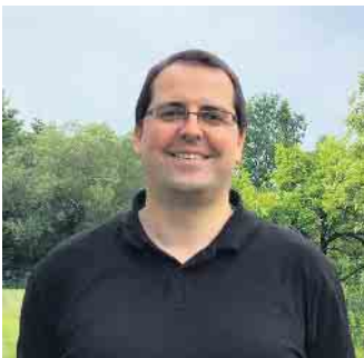
Die Sanierung des Nethe-Stausees ist ein komplexes Problem!

Reaktion soll zusammen mit den Organismen die organischen Bestandteile wie Blätter und Algen im Schlamm abbauen und so die Dicke des Schlammes reduzieren. Diese Methode muss vor der Anwendung aber erst noch von der Unteren Wasserbehörde des Kreises Höxter genehmigt werden, schließlich handelt es sich um einen Eingriff ins das Gewässer, an das sich auch Naturschutzgebiete anschließen. Leider wird auch dieses relativ günstige Verfahren das grundsätzliche Problem nicht lösen. Die Sedimente wie Sand und Steine verbleiben weiterhin im See. Wenn das Verfahren wie vom Hersteller vorgestellt funktioniert, können wir uns damit einige Jahre Zeit erkaufen, um eine nachhaltigere Lösung zu finden. Eine vielversprechende Lösung scheint im Moment das Ansaugen des Schlammes und langsame Ablassen in den Unterlauf der Nethe. Diese Variante muss jedoch erst vom Kreis Höxter näher geprüft werden.