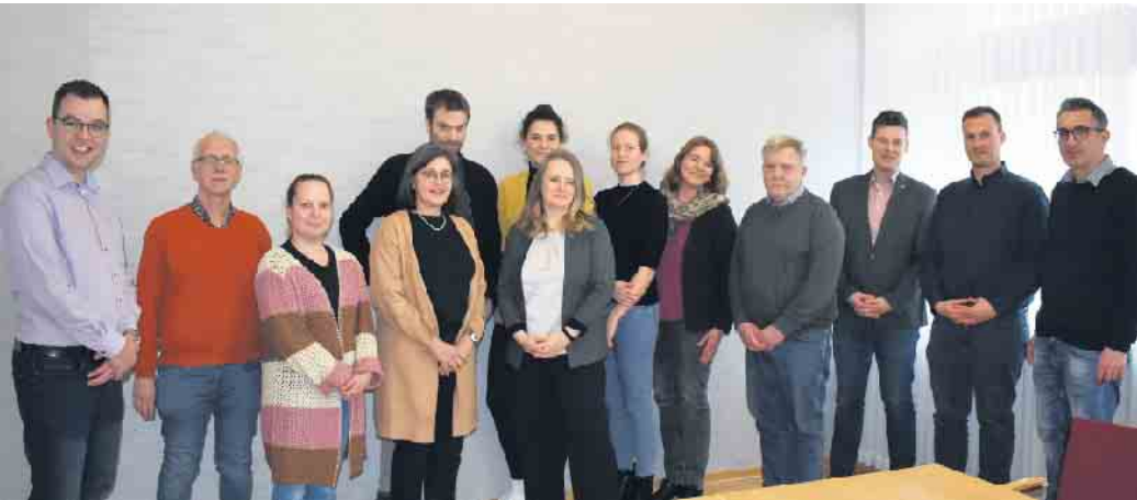
Die Teilnehmer des 7. Netzwerktreffens des Klimaschutz-Netzwerks Holzminden-Höxter-Hameln-Pyrmont 2022-2025