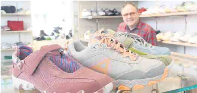
Das Brakeler Schuhhaus Schäfers präsentiert die neue Allrounder-Kollektion