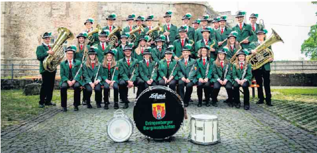
Burgmusikanten veranstalten ihr traditionelles Frühlingskonzert.