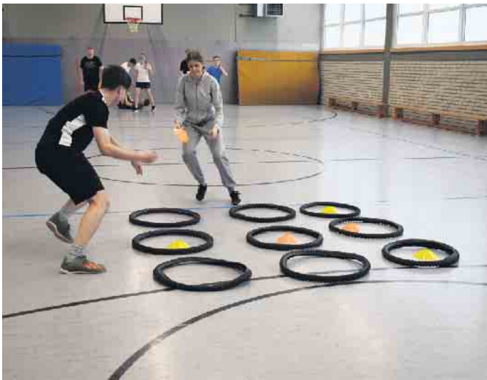
Die 17-18-jährigen testen eigens erfundene Sportspiele, die sie zu einem späteren Zeitpunkt mit Fünftklässlern ausprobieren werden.