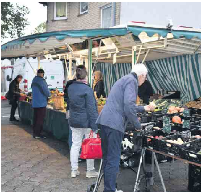
Wochenmarkt Bad Driburg

einmal wöchentlich in der Kurstadt zwischen Schulstraße und Freiheit. Ab April dann wieder frei-