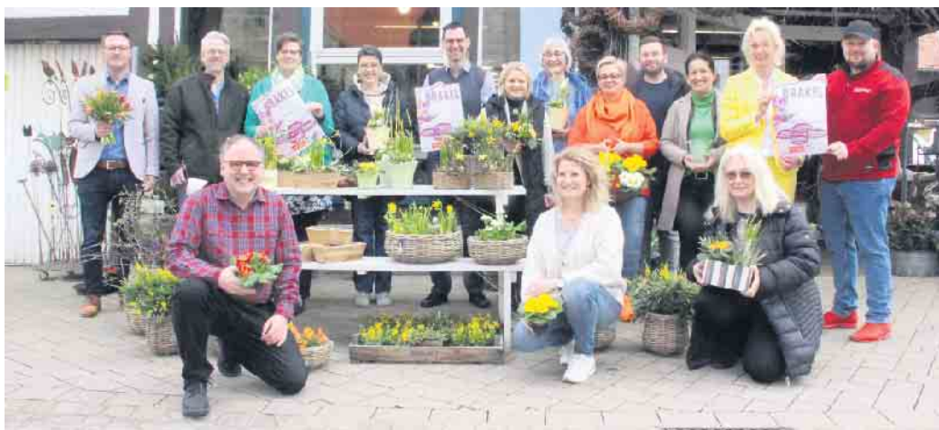
Teilnehmer und Unterstützer der Aktion Brakel blüht auf präsentieren das diesjährige Programm.