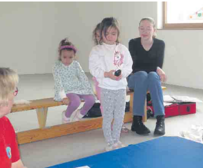
112: Wir lernen einen Notruf abzusetzen