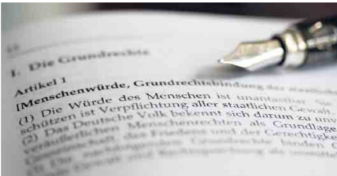
Der Stadtrat setzt deutliches Zeichen für Demokratie - gegen Ausgrenzung, Hass und Hetze

können Meinungen anderer verstehen, wir müssen aber nicht immer Verständnis für sie haben. Der wertschätzende Umgang schließt Angriffe auf Mitmenschen aus. Ausländerfeindlichkeit, Antisemitismus, Hass und Hetze werden konsequent abgelehnt. Die Stadtverordneten appellieren daher auch an alle Mitbürgerinnen und Mitbürger, sich ebenfalls gegen jede Form extremistischer Bestrebungen zur Destabilisierung unserer Gesellschaft einzusetzen. Nur die beiden Stadtverordneten der AfD haben gegen den Beschluss gestimmt. Damit haben sie die Chance verpasst, sich deutlich von den rechtsextremistischen