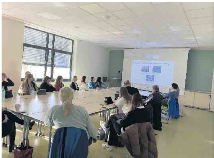
Gestaltet in Form von wählbaren Workshops, konnte jeder Teilnehmer seine eigenen Interessensschwerpunkte wählen.

bereitet und moderiert wurde, war für die Teilnehmenden absolut gewinnbringend. Unter dem Motto „Mit Digitalität das Lernen zeitgemäß gestalten“ startete der Tag in Form eines „Barcamps“. Die Teilnehmenden wählten aus insgesamt 26 Angeboten bzw. Sessions aus unterschiedlichen Fachbereichen je nach Interesse und Bedarf vier Angebote aus. Der Start in den Tag, das Mittagessen und der Tagesabschluss wurden gemeinsam im Plenum wahrgenommen. Das Resümee war ein erfolgreich gestalteter Tag, bei dem sich die KollegInnen rundum wohl gefühlt haben und viel mitnehmen konnten. „LiGa-Lernen im Ganzttag“ ist eine Initiative der Deutschen Kinder- und Jugendstiftung und der Stiftung Mercator; in Nordrhein-Westfalen unter dem Titel „Leben und Lernen im Ganzttag“ entwickelt und umgesetzt mit dem Ministerium für Schule und Bildung des Landes NRW und der Qualitäts- und UnterstützungsAgentur - Landesinstitut für Schule.