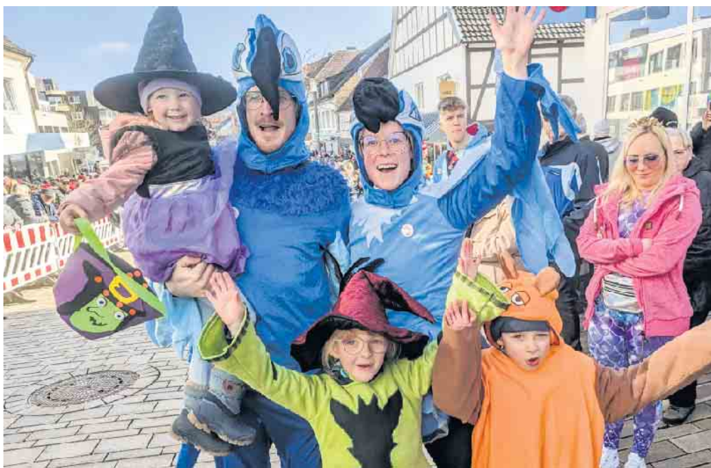
Die Besucher strahlen mit der Sonne um die Wette.