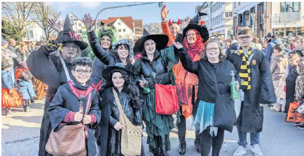
Tolle Stimmung beim großen Bad Driburger Karnevalsumzug am Tulpensonntag.