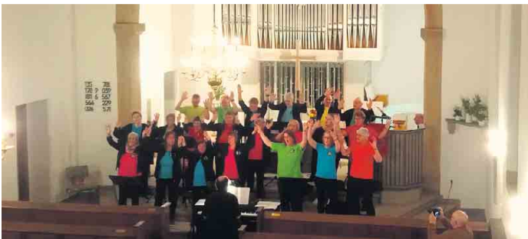
Bad Driburger Gospelchor Spirit Voices 2023