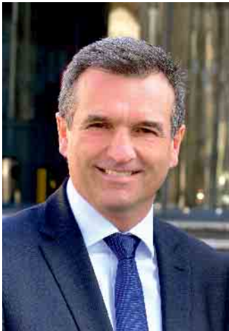
Ihr Burkhard Deppe Bürgermeister

Der Rat der Stadt Bad Driburg hat in seiner Sitzung am 03.02.2025 den Haushalt für das Jahr 2025 beschlossen. Zwischenzeitlich ist das Genehmigungsverfahren bei der Kommunalaufsicht des Kreises Höxter abgeschlossen, so dass der Haushalt 2025 der Stadt Bad Driburg mit der Bekanntmachung am 06.03.2025 rechtskräftig geworden ist. Gerne können Sie den endgültigen Haushaltsplan 2025 auf der Homepage der Stadt Bad Driburg oder im Rathausfoyer einsehen.