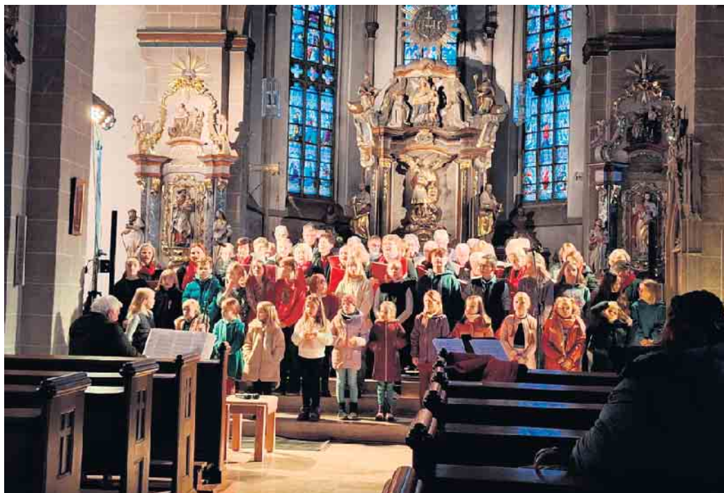
Gemeinsamer Auftritt der Chöre beim Adventskonzert 2024

In dem Stück werden die Entstehung der Erde und das uns anvertraute Gut in klaren und verständlichen sowie gefühlvollen und zeitgemäßen Texten präsentiert. Gottes wundervolle Schöpfung findet sich dabei in fröhlichen und nachdenklichen Liedern und anspruchsvollen Text-Passagen