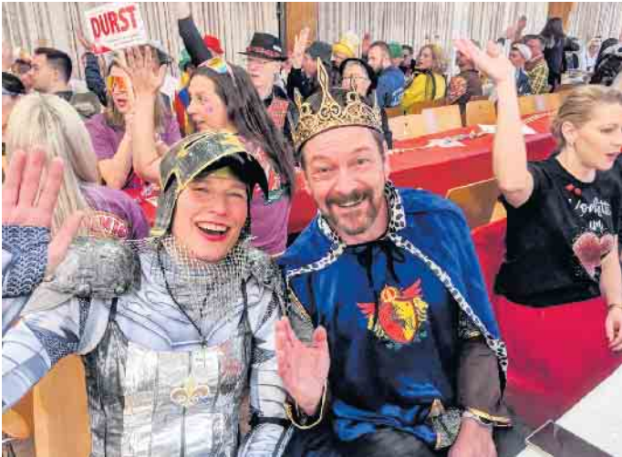
Tolle Stimmung bei der Rot-Weißen Nacht in Bad Driburg.