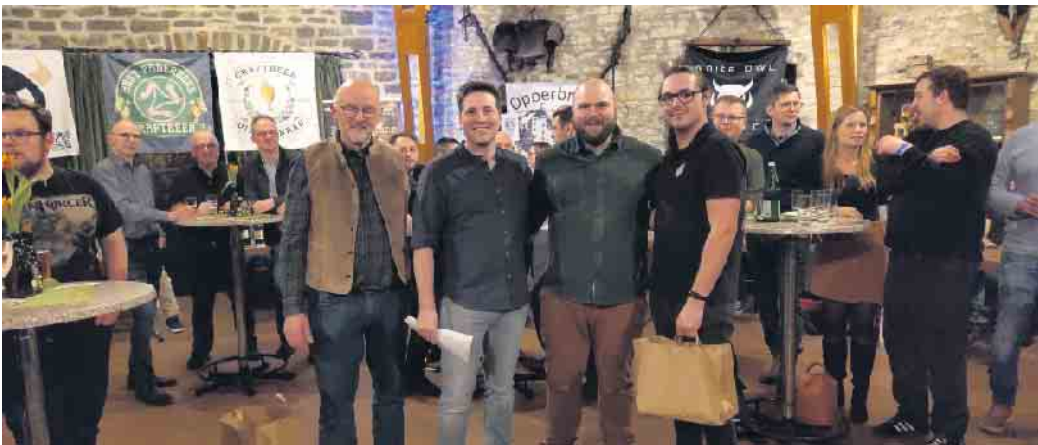
Preisübergabe an den ersten Sieger. Hops Bierbar Paderborn

Die entspannte Atmosphäre, der rege Austausch unter den Brau-ern und Gästen und die Vielfalt der Biere machten das Treffen zu einem unvergesslichen Ereignis. Alle Teilnehmer waren sich einig: 2026 wird es eine Neuauflage geben!