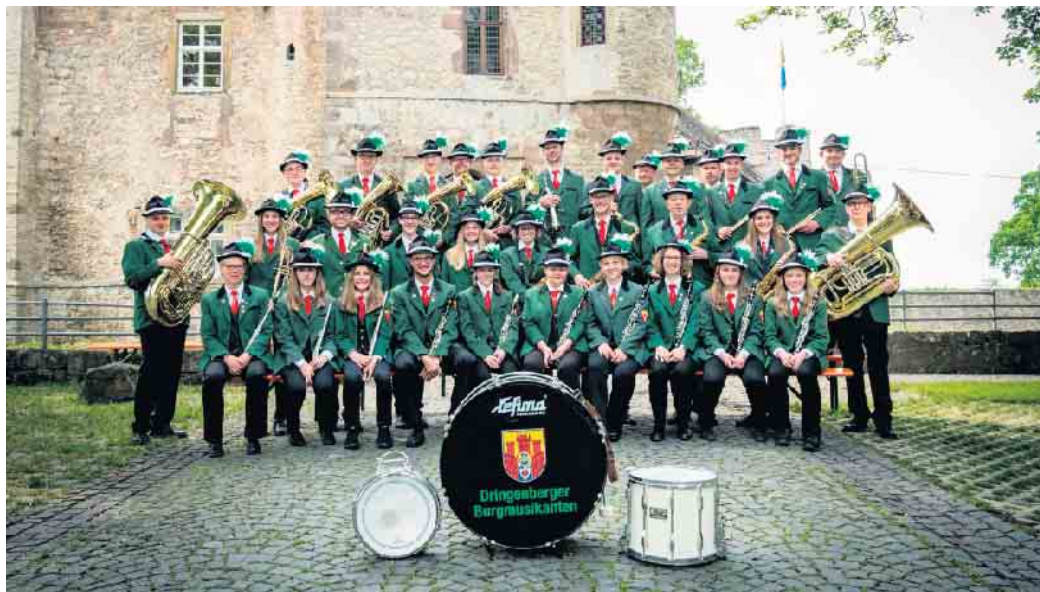
60 Jahre Dringenberger Burgmusikanten

Die Karten sind im Vorverkauf im Dorfladen Dringenberg und in der Gaststätte Ludger Hausmann für 8 Euro erhältlich. An der Abendkasse sind die Karten für 10 Euro ab 19 Uhr erhältlich (bis 16 Jahre ist der Eintritt frei). Außerdem wer-