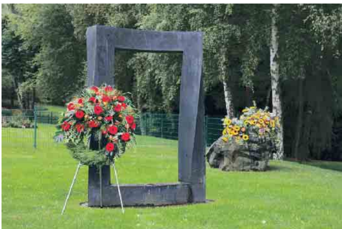
Tor zwischen den Welten.

Mit einer sogenannten Bestattungsverfügung lässt sich zu Lebzeiten verbindlich festlegen wo und wie die eigene Beerdigung stattfinden soll. Dies kann den Hinterbliebenen in der Zeit der Trauer helfen und den Abschied etwas leichter machen. (akz-o)