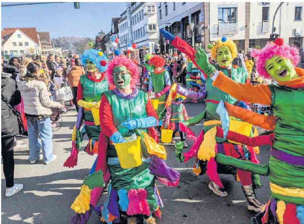
Bunte Gruppen sorgen für Farbe im Karnevalsumzug.

Tausende feiern bei schönstem Wetter den größten Karnevalsumzug seit Jahren