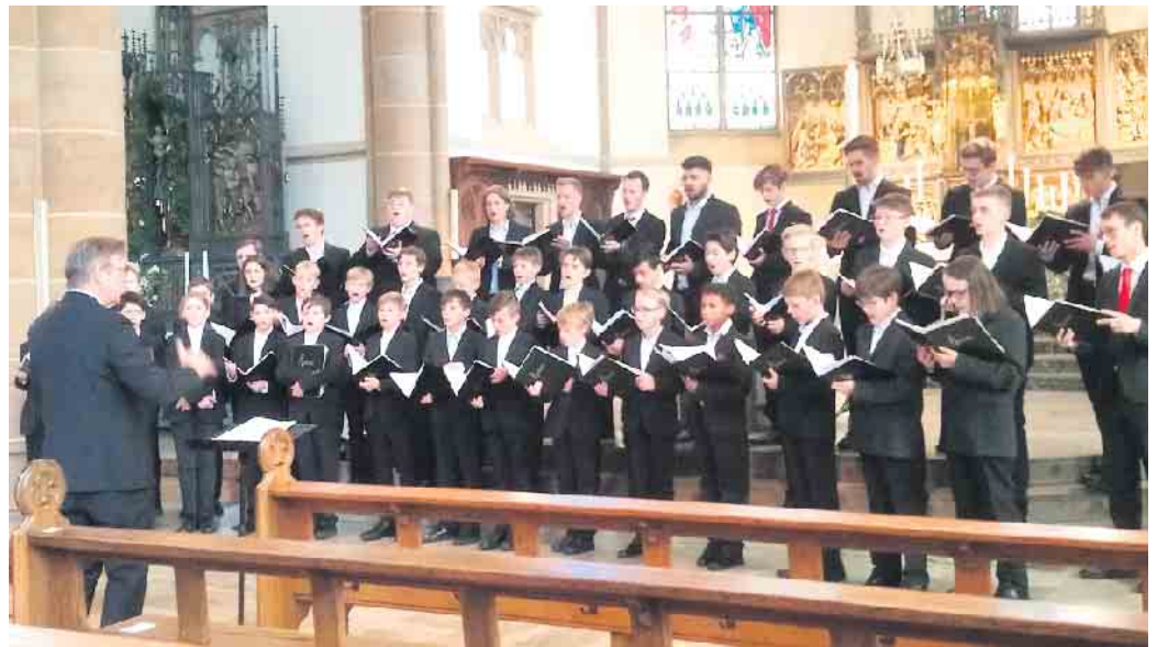
Paderborner Domchor begeisterte 2022 in Bad Driburg.