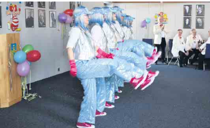
Die Glamour Girls hatten einen tollen Auftritt.