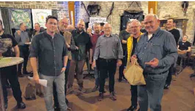
Preisübergabe an den zweiten Sieger. Schwattlocher Braugruppe aus Borchten-Gellinghausen

Am 22. Februar fand das Hobbybrauertreffen 2025 der Back- und Braufreunde Schwaney in der Glashütte Uhden in Neuenbeken statt - und es war ein voller Erfolg. 15 leidenschaftliche Hobbybrauer präsentierten ihre selbstgebrauten Bierspezialitäten vor rund 90 begeisterten Gästen. Die Veranstaltung bot eine beeindruckende Vielfalt an Aromen, von klassischen Pilsnern über fruchtige Pale Ales bis hin zu kräftigen Stouts. Ein besonderes Highlight war die fachkundige Beurteilung der Biere durch zwei erfahrene Braumeister, die jedes Bier ausgiebig verkosteten und bewerteten. Den ersten Preis sicherte sich das „Hops Nr.1“ von Hops Bierbar Paderborn. Ein Wheat Beer - American Pale Wheat. Auf dem zweiten Platz landete das Altbier der Schwattlocher