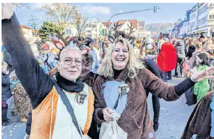
Auch zwei Rehlein aus dem Gräflichen Park lassen sich begeistern.