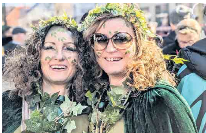
Die beiden Waldfeen haben Spaß beim großen Karnevalsumzug.