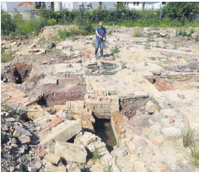
Im Sommer 2020 zeigt der Mitarbeiter des LWL auf den sogenannten Gaswechsler.

An der Brakeler Straße unter dem Parkplatz der Seniorenresidenz Medicare schlummert ein Schatz. Dort sind Überreste der Glashütte erhalten, die ein technisches Bodendenkmal von hoher Bedeutung darstellen. Die Archäologen des Landschaftsverbandes Westfalen-Lippe, die das Areal 2019 vor der Bebauung untersucht haben, fanden dort Kanäle, durch die Frischluft, Kohlengas oder heiße Abgase vom Schmelzofen geleitet werden konnten. Eine einfache, aber wirkungsvolle Methode, die hohen Temperaturen zu erzeugen, die für die Glasherstellung notwendig sind. Zu dieser ausgeklügelten Technik gehört auch eine kreisrunde Mauerung: der so genannte Gaswechsler, mit dem man die