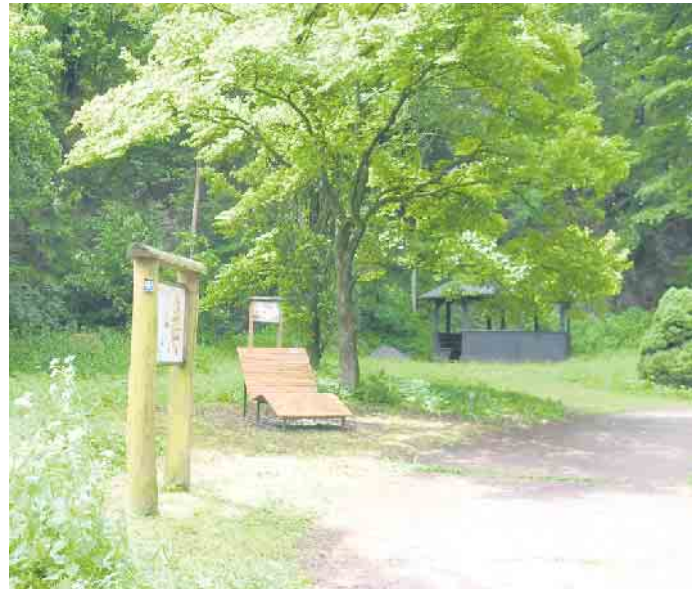
Das Arboretum im Sommer.

Arbeitswerkzeuge werden vor Ort zur Verfügung gestellt. Robustes Schuhwerk und Arbeitshandschuhe sind empfohlen. Zur Stärkung wartet auf alle Helferinnen und Helfer ein Mittagsimbiss mit Getränken. Treffpunkt für die Teilnehmer ist die Schutzhütte am Steinbruch oberhalb des Parkplatzes am oberen Ende der Hufelandstraße. Auch stundenweise Einsätze im Verlaufe des Tages sind willkommen. Eine Anmeldung ist nicht erforderlich.