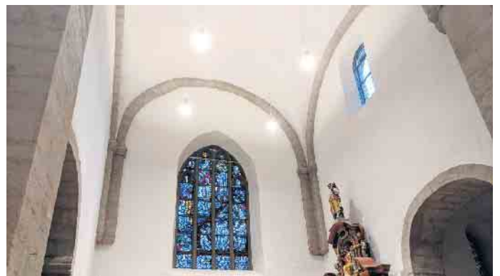
Die neue Beleuchtung ist sehr hoch angebracht, fällt somit kaum auf, aber beleuchtet den Raum angenehm hell und strahlt auch unter das Gewölbe.