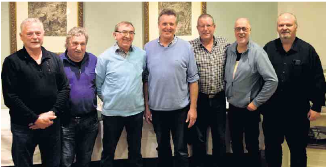
Der Vorstand des Betreibervereins Nethehalle in Neuenheerse lädt seine Mitglieder ein zur diesjährigen Jahreshauptversammlung.

Verschiedene Themen sind weitere Punkte auf der Tagesordnung.