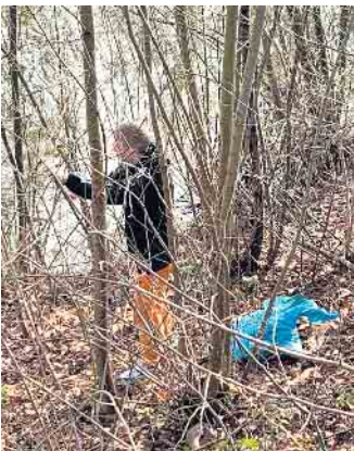
Ein Rückschnitt bei den Gehölzen rund um den Stadtteich hat auch den Uferbereich wieder in Form gebracht.

Rechtzeitig vor Beginn der Wachstumsperiode in der Vegetation trafen sich die Mitglieder des Bad Driburger Sportanglervereins zu einem erneuten Arbeitseinsatz am Stadtteich Bad Driburg. Wie bereits im letzten Jahr mit dem Vorsatz ausgestattet, das Gewässer und die Uferbereiche von Unrat, Sperrmüll und Wildwuchs zu befreien, ging es bei frühlinghaften Temperaturen ans „Eingemachte“ oder besser an „Einge-