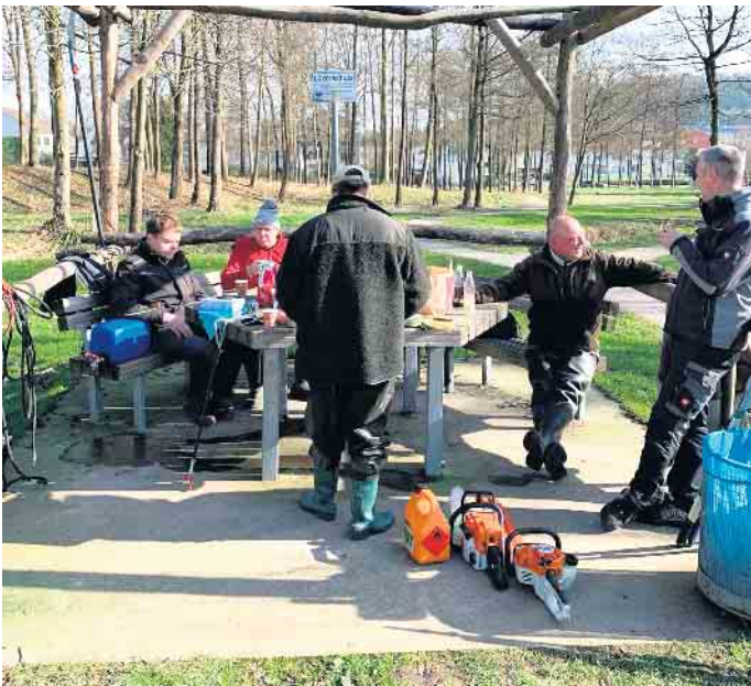
Nach getaner Arbeit wartete ein leckeres Frühstück auf die Helfer.