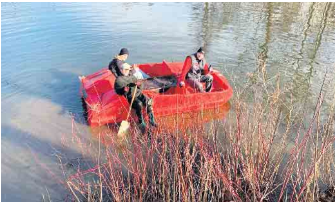
Mit dem Boot wurde der Stadtteich von Sperrgut und Unrat befreit.

tauchte“! Fahrräder, City-Roller, Autoreifen, Gartenstühle und Tische gelangten wieder ans Tageslicht, nachdem sie einige Jahre in den Tiefen des Stadtteichs schlummerten. Für eine weitere Verwendung sichtlich ungeeignet, wurden die Fundstücke dem Bauhof Bad Driburg zur endgültigen Entsorgung übergeben. Was wohl nicht für ein weiteres Schmuckstück gelten dürfte welches ein verärgerter Verkehrsteilnehmer gerne auf immer verschwinden lassen wollte. Ein Halteverbotsschild konnte geborgen werden und wird durch den Bauhof zukünftig sicher wieder einer sinnvolleren Verwendung zugeführt werden können. Weiterhin wurde viel Papiermüll, den der Wind sorgfältig bis in die letzte Nische verteilte, akribisch eingesammelt. Zu guter Letzt noch ein bisschen Formschnitt am Gehölz und der Stadtteich war wieder in Form gebracht. Sehr zur Freude vieler Spaziergänger an diesem Tag. Nach getaner Arbeit endete der diesjährige Arbeitseinsatz am Stadtteich mit einem deftigen Frühstück.