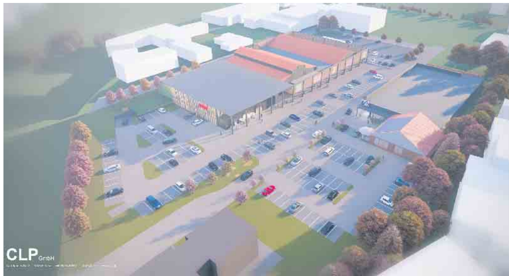
So könnte bald der Einzelhandelsstandort Siedlerplatz aussehen.

Angedacht ist eine erhebliche Erweiterung des Sortiments der Frische- und Bio-Produkte sowie von regionalen Lebensmitteln. Zudem werden die Märkte insgesamt kundenfreundlicher gestaltet, was sich in modernen Lichtkonzepten mit bodentiefen Fenstern, großzügigen Eingangsbereichen sowie breiteren Gängen und niedrigeren Regalen widerspiegeln würde. Das Gesamtkonzept zur Neugestaltung des Einzelhandels-