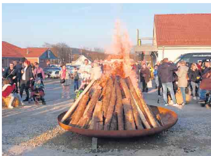
Hoch loderten im letzten Jahr die Flammen.

Bei hoffentlich schönem Wetter können sich Groß und Klein am Feuer erfreuen und wärmen. Für die Kinder gibt es ein kleines Lagerfeuer, über dem sie Stockbrot backen können. Den Teig stellt die Siedlergemeinschaft zur Verfügung. Den Stock können die Vä-