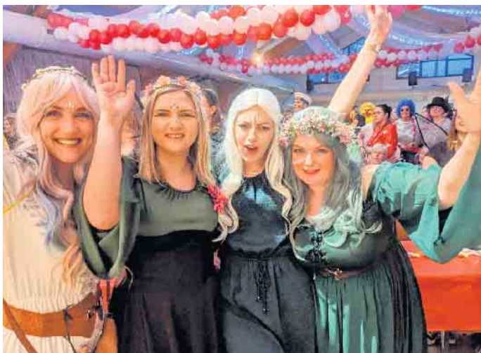
Tolle Stimmung beim Bad Driburger Frauenkarneval.

die Jeckstreet Boys, die Showtanzgruppe Diwo, die Drohndancers, die Stadtgarde, die Glamour Girls, die 12 Tornados, die Tanz- und Prinzenengarde, die Tanz- und Prinzenengarde sowie die Kinderprinzen-Ehrengarde. Die Jeck Street Boys gelten aktuell als eines der heißesten Trios im Kölner Karneval. Sie singen und tanzen in modernem Stil und erobern die Herzen der Damenwelt im Sturm. Mit ihrem unwiderstehlichen Charme und kölschen Spirit sorgten die drei Jeck Street Boys auch in Bad Driburg für ausgelassene Stimmung. Nicht minder frenetisch gefeiert wurde die Oldschool-Performance der Bad Driburger Stadtgarde, die trotz Uniform und geschultertem Gewehr die Beine hoch in Luft zu