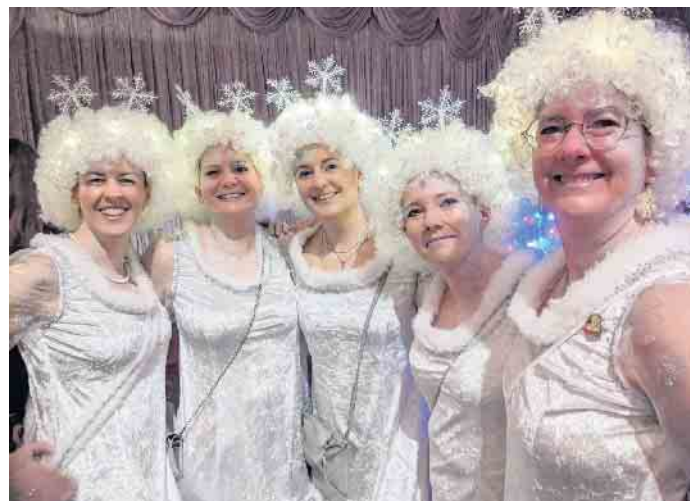
Fünf bezaubernde Schneeflocken.