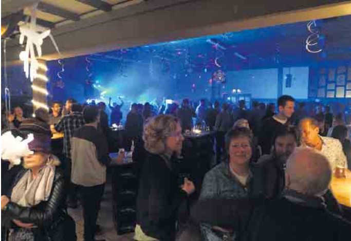
Gute Stimmung herrschte in der bestens gefüllten Martinushalle bei den letzten Après-Ski-Partys.