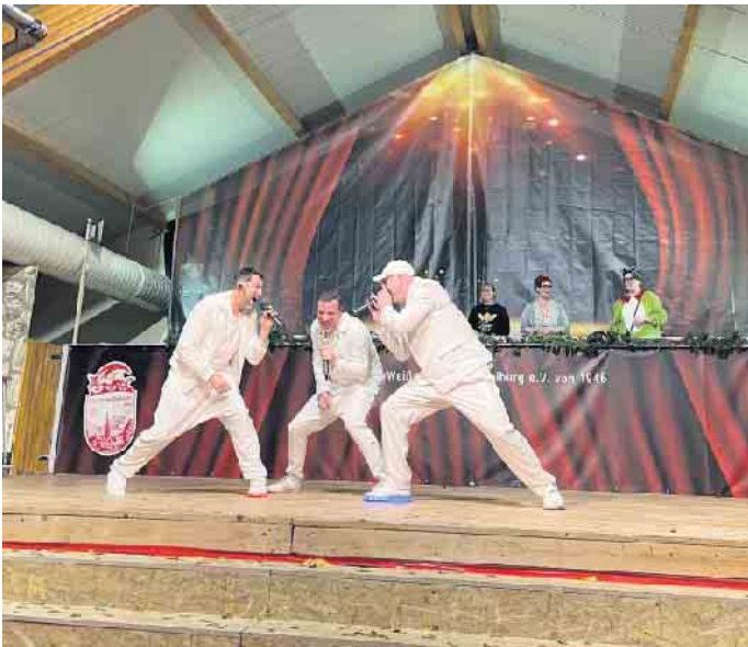
Die Jeck Street Boys aus Köln sind der Topact im Programm.