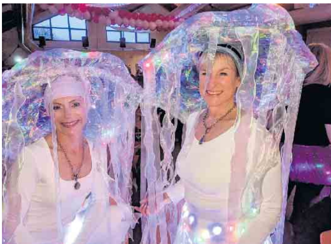
Als Tiefseequallen mit großen, leuchtenden Schirmhüten präsentieren sich diese beiden Karnevalistinnen.