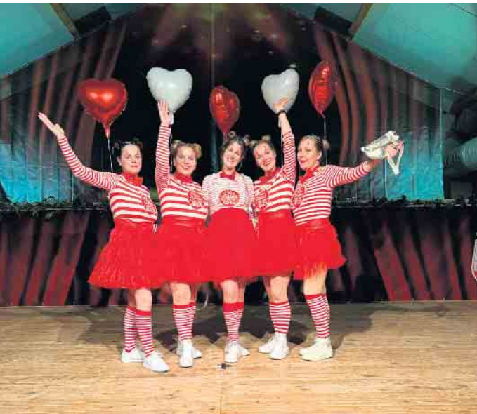
Gut gelaunt feiern die Bad Driburgerinnen ihre Frauensitzung.