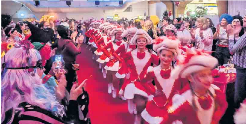
Einzug der 16 Tänzerinnen der Kinderprinzenehrengarde.

Wer will die schönsten Kostüme sehen, muss zum Karneval der Frauen gehen. Es ist kein Geheimnis, wenn Frauen zusammen Karneval feiern, dann geben sie sich besonders viel Mühe, um möglichst fantasievoll kostümiert zu sein. Das beste Beispiel war am Freitag der Karneval der Frauen der Bad Driburger Rot-Weißen Garde. Elfen mit leuchtenden Flügeln, kristallweiße Schneeflocken, Tiefsee-Quallen und bunteste Paradiesvögel. 320 karnevalistische Frauen haben die Bad Driburger Schützenhalle in einen einzigartigen Augenschmaus verwandelt. Erstmals fand der Frauenkarneval in Bad Driburg nicht an Weiberfastnacht statt. Will man Weiberkarneval mit richtig gutem Programm machen, dann braucht es ein Datum, wo möglichst wenige Parallelveranstaltungen stattfinden, also nicht genau an Weiberfastnacht. Das ist der Rot-Weißen Garde in Bad Driburg gelungen. Die Halle ist rappellvoll, die Stim-