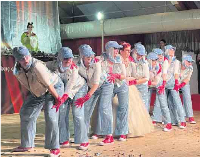
Ein tolles Bühnenprogramm begeistert.

Streitbürger. DJ Sventastic unterstützte mit seinem musikalischen Können. Neben den beiden Tanzgarden der Gesellschaft sowie der Stadtgarde und den Glamour Girls haben auch die Brakler Drohdancer und 12 Tornos aus Alhausen alle in ihren Bann gerissen. Die Diwos vom SC Ostenland hatten nach ihrem Auftritt auf der Herrensitzung bereits ihren zweiten Auftritt in dieser Session und sorgten durch ihre tollen Kostüme und ihr gesamtes Bühnenbild für mitreißendes Auftreten. Etwas ganz Neues bot die kölsche Boygroup Jeck Street Boys, die Ohrwürmer aus den 90er Jahren auf Kölsch mit atemberaubenden Tanzeinlagen performte.