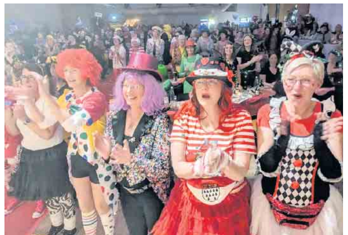
Mehr als 300 Frauen bringen beim Bad Driburger Frauenkarneval die Halle zum Kochen.

Mit einem dreistündigen, hochkarätigen Programm war der Frauenkarneval eine regelrechte Galasitzung. Dabei waren unter anderem