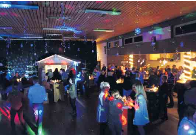
Auch in diesem Jahr veranstaltet die Schützenbruderschaft eine Après-Ski-Party in Reelsen.