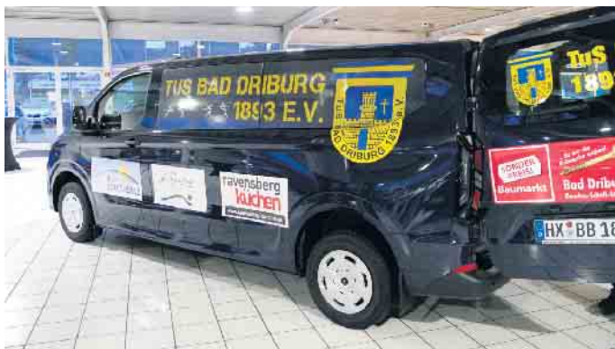
Das neue Fahrzeug wurde im Rahmen einer Feierstunde an den TuS Bad Driburg übergeben.

‚Bulli‘ können wir unseren Jugendlichen einen sicheren und komfortablen Transport zu Wettkämpfen bieten.“