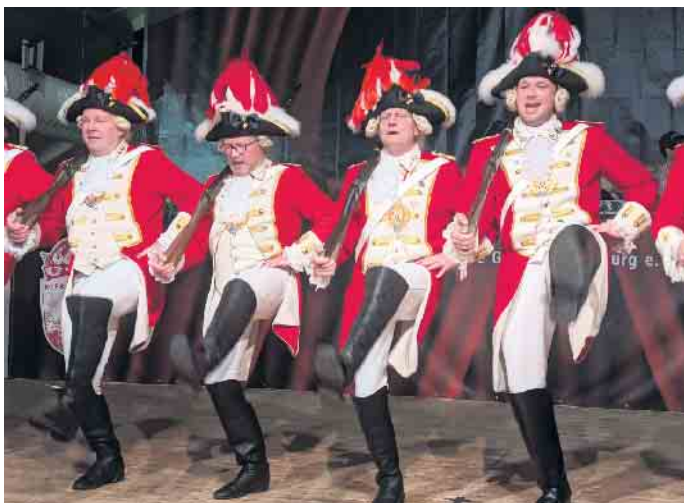
Das Männerballett der Bad Driburger Stadtgarde ist ein Muss im Frauenkarneval.