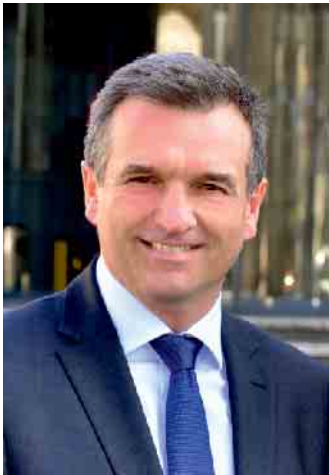
Ihr Burkhard Deppe Bürgermeister

eine Thermen-Modernisierung erheblich erweitert, und es würden neue Zielgruppen angesprochen. Gefragt sind dazu Bundes- und Landes-Fördermittel. Diese überbrachte zuletzt die Regierungspräsidentin Anna Katharina Bölling am 6. Februar im Bad Driburger Rathaus. In diesen Tagen erfolgt nun unter Einbeziehung dieser 5 Millionen Euro Fördergeld eine europaweite Ausschreibung, um einen Investor und Betreiber für das Thermenprojekt inklusive Anbau eines Hotels zu finden.