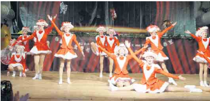
Tanz der Kinderprinzenehrengarde.

reden alle in den Bann, unter dem Motto „Karneval außer Rand und Band, wir feiern mit den Tieren Hand in Hand“ zu feiern. Der Kinderkarneval der Rot-Weißen Garde ist in jedem Jahr ein ganz besonderer Höhepunkt der Session. Das bunte Programm spiegelte die bunt geschmückte Halle, aber