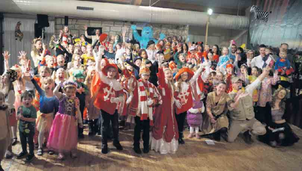
Beim Kinderkarneval haben alle viel Spaß.

Viele verkleidete Kinder beim Kinderkarneval der Rot-Weißen Garde