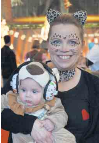
Schon die Allerkleinsten werden vom Karneval geprägt.

vor allem die verkleideten Kinder wider. Neben der Kinderprinzen-ehrengarde und der Tanz- und Prinzen-ehrengarde haben auch Benny's Danceschool sowie die Glamour Girls die tänzerischen Darbietungen geleistet. Dazu gab es ein Kuchenbuffett und eine Mini-Disco, um richtig Party zu machen. Wie immer endete die Veranstaltung dann mit einem Luftballon-