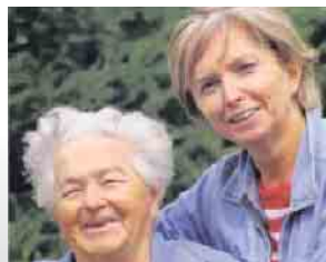
Meine Mutter braucht Pflege

Für Sie 24 Stunden erreichbar 0 52 53 / 93 50 217