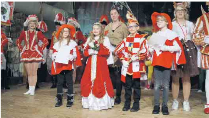
Das Kinderprinzenpaar mit seinen Pagen.