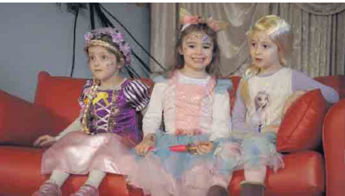
Kleine Prinzessinnen auf dem roten Sofa.