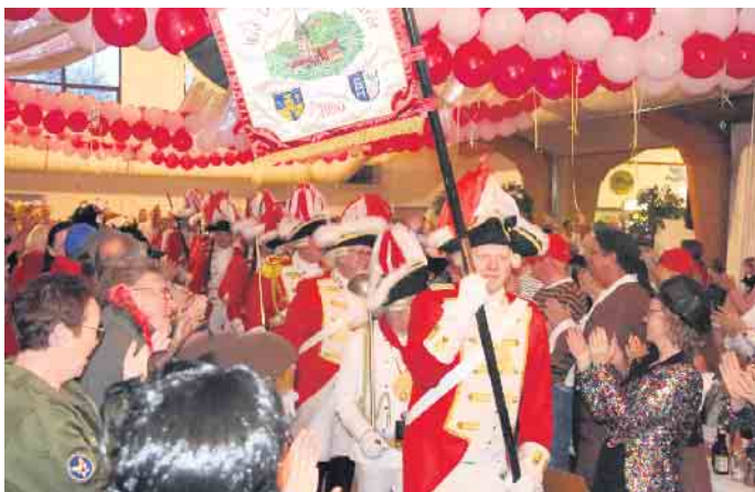
Die Stadtgarde darf auf keiner Bad Driburger Karnevalsfeier fehlen.