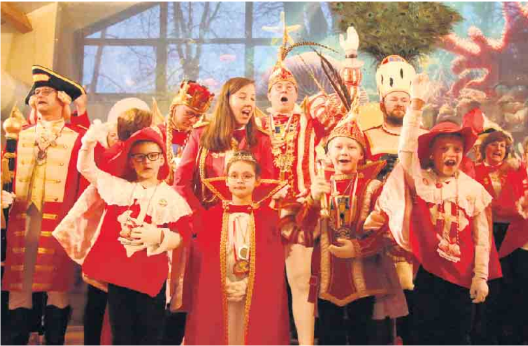
Dreigestirn und Kinderprinzenpaar grüßen die große Narrenschar.

Mit einem über dreistündigen Programm begeisterte die Rot-Weiße Nacht die mehr als 300 Gäste in der gut gefüllten Bad Driburger Schützenhalle. Die Kinderprinzenlehrgarde, die Tanz- und Prinzenlehgarde, die Zumba-Truppe und die Glamour Girls sorgten für tolle Tanzeinlagen. Die KLJB aus Alshausen, die Bad Driburger Stadtgarde, die 12 Tornados und die Pümissen Eleven begeisterten das Publikum mit ihren Beiträgen.