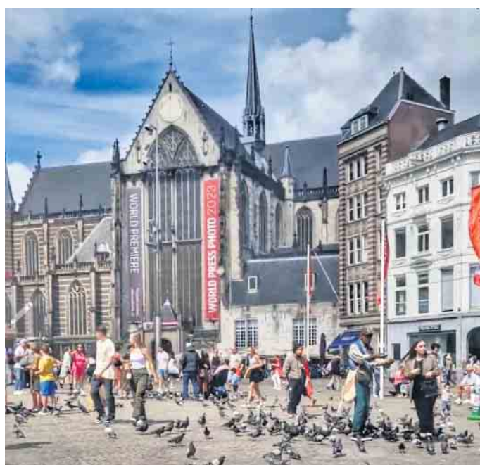
Die 1409 geweihte Nieuwe Kerk neben dem Königspalast am Dam-Platz ist heute eine Adresse berühmter Ausstellungen.

erefreie Plätze vorhanden, jedoch nur auf der Seite einer Mannschaft. Außerdem erfuhren die Besucher, dass Ajax, der Namensgeber des Vereins, ein griechischer Held war, der fast nur gesiegt hat. Danach fuhren die Reisenden per U-Bahn zur Waterlooplein, um über den dortigen Mart zum Nationaldenkmal zu schlendern. Bei dem nun folgenden Besuch des Einkaufszentrums Magna Plaza hatten die Gäste mehr Glück, der Aufzug funktionierte und die Mitarbeiter waren hilfsbereit. Innen enttäuschten jedoch die wenigen Geschäfte, die vielen Leerstände und die Toiletten hinter einem Drehkreuz. Das nun besuchte Neiwe Kafé glänzte durch gute Speisen, ein barrierefreies WC und Aufzüge.