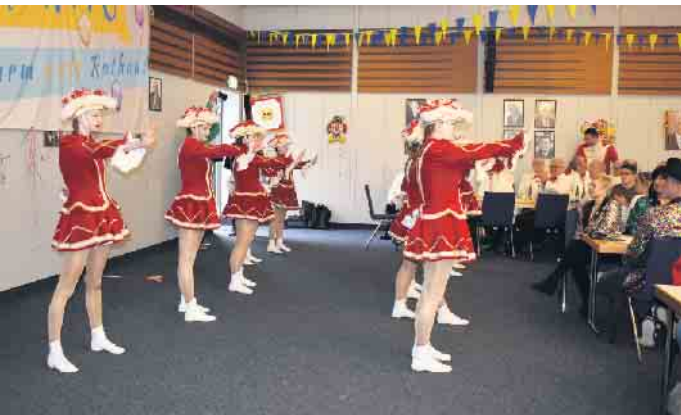
Die Prinzengarde sorgte für gute Stimmung.