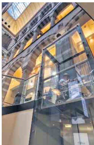
Barrierefrei durch das historische Einkaufszentrum Magna Plaza

Am Hauptbahnhof wurde dann die Möglichkeit genutzt, Andenken zu kaufen. Die Abholung der Koffer klappte problemlos, dafür gab es Probleme beim Betreten des Bahnsteiges. Der Service beim Einstieg in den Zug war zwar recht gut, hatte aber noch Luft nach oben. Dieser Zug fuhr aber nicht über Amstel, sondern über Bad Bentheim, wo deutsches Zugpersonal das niederländische ablöste. Da sorgte dann ein Problem für eine Verzögerung der Weiterfahrt, sodass der Zug leicht verspätet in Hannover ankam. Dort gab es zwar eine Baustelle am Gleis