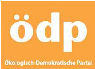
ÖDP - Logo