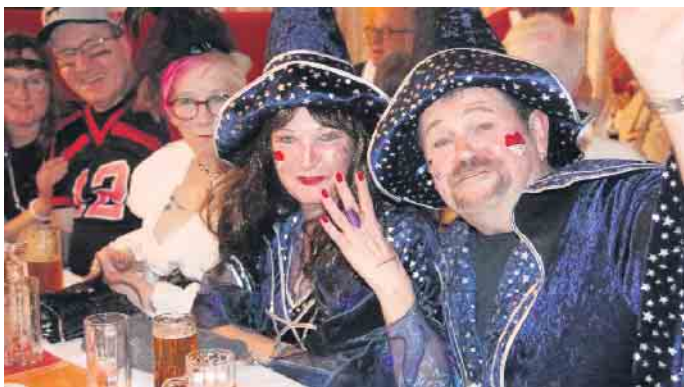
Schick kostümiert macht das Feiern noch mehr Spaß.