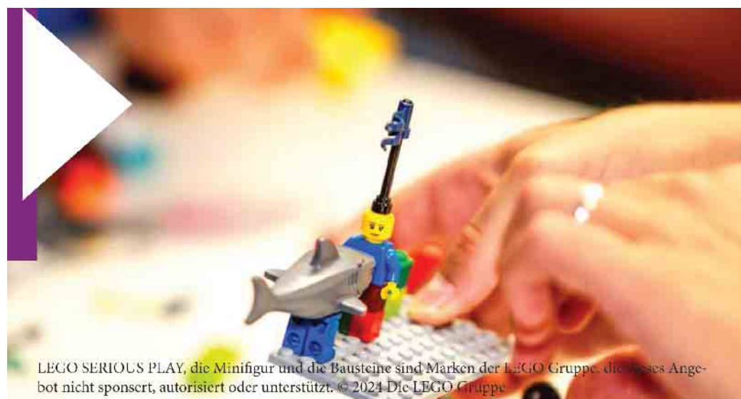
LEGO SERIOUS PLAY, die Minifigur und die Bausteine sind Marken der LEGO Gruppe, dieses Angebot nicht sponsert, autorisiert oder unterstützt. © 2024 Die LEGO Gruppe

Die Online-Seminare dauern je nach Thema zwischen 60 und 90 Minuten. Die Teilnahme ist kostenlos. Weitere Informationen zu den Vortrags-Themen, Startzeiten und die Teilnahmelinks finden Interessierte auf der Homepage der Stadt unter https://www.bad-driburg.de/de/stadt/klimaschutz/energie.php