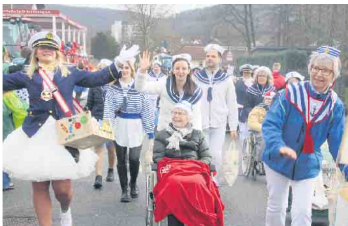
Die Seniorenresidenz war als rollende Fußgruppe dabei.

Beim diesjährigen Bad Driburger Karnevalsumzug war auch ein Trecker der Bauernproteste dabei. „Wir gucken uns hier bei den Karnevalisten ab, wie man Bad Driburg verkehrstechnisch am besten lahmlegen kann“, sagte ein jecker Landwirt. Wenn man so will, ist ein Karnevalsumzug ein Protestzug der guten Laune. Verkehrstechnisch geht nichts, aber alle haben viel Spaß dabei. Tausende Besucher bevölkerten die Bad Driburger Innenstadt zum großen Karnevalsumzug am Tulpensonntag. Laut dröhnende Partywagen, Kamelleregen, Musikgruppen und bunte Fußgruppen machten den Besuchern Freude. Eine kostümierte Seniorenresidenz war mit ihren Bewohnern als rollende Fußgruppe dabei. Pünktlich zum Start um 14 Uhr