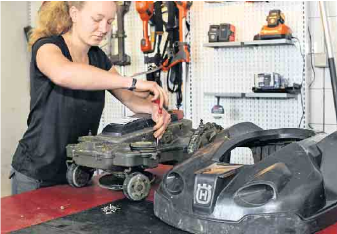
Bei mechatronischen Berufen stehen Wartung und Reparatur von Garten- und Outdoorgeräten im Mittelpunkt.

nächsten fünf bis zehn Jahren einen Nachfolger oder Geschäftsführer suche, seien die Karriereperspektiven sehr gut. Unter www.greenbase.de etwa gibt es mehr Details dazu, zudem lassen sich hier örtliche Motoristenbetriebe finden. Ein Praktikum vor der Entscheidung für eine Berufsausbildung ist immer eine gute Idee. Angehende Fachkräfte in diesem Bereich werden spannende Entwicklungen hautnah miterleben: Der Wandel vom Verbrennungsmotor hin zu ökologisch nachhaltigen Antrieben sowie der Trend zu Robotertechnologie macht auch vor dieser Branche nicht halt und sorgt für neue Herausforderungen, gerade für die junge Generation. (DJD)