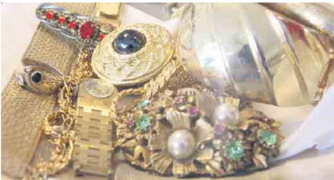
Ansprechpartner für die Wertermittlung von Schmuck, Münzen oder Edelsteinen.

oder (0 52 53) 86 89 51 8. vereinbart werden. Das Ladengeschäft in Bad Driburg ist unter der Woche von 10 bis 17 Uhr sowie samstags von 10 bis 13 Uhr geöffnet. Weitere Informationen gibt es auch im Internet unter www.padergold.de .