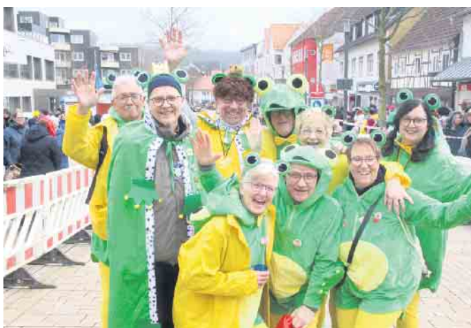
Tausende Besucher und Teilnehmer feierten den Bad Driburger Karnevalsumzug.