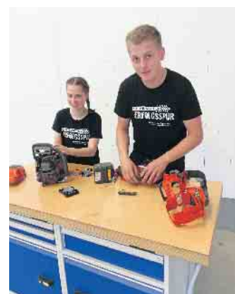
Die praxisnahe Ausbildung eröffnet reizvolle berufliche Perspektiven bis hin zur Selbstständigkeit.