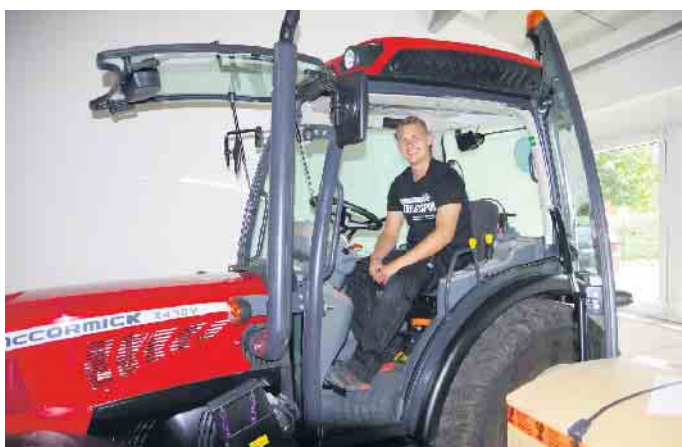
Schweres Gerät sicher beherrschen: Die Leidenschaft für Technik ist eine gute Voraussetzung für eine Ausbildung im Motorgeräte-Fachhandel.