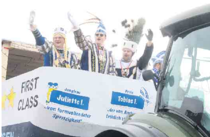
Das Dreigestirn aus Pömbesen grüßt die Närrinnen und Narren der Badestadt.