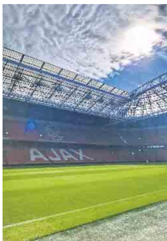
Die benachbarte Johan-Cruyff-Arena, Heimstadion des bekannten Vereins Ajax Amsterdam