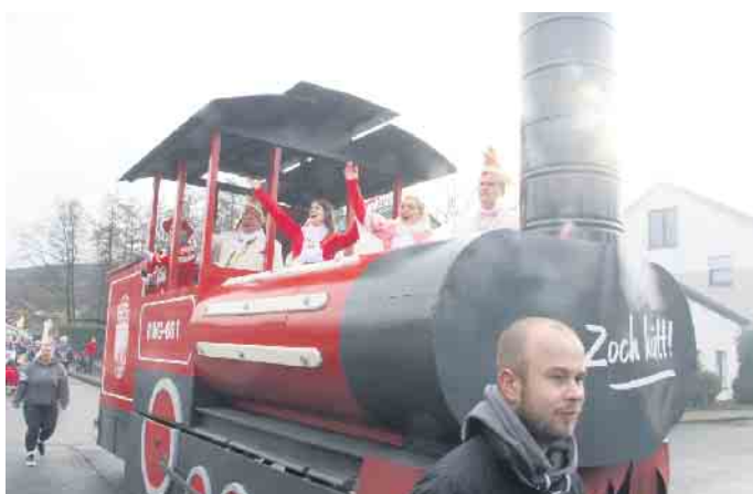
Die großen Motivwagen sind immer wieder ein Hingucker.

ße geht es über die große Kreuzung die Fußgängerzone hoch und dann über die Pyrmonter Straße und den Konrad-Adenauer-Ring wieder runter zur Langen Straße.