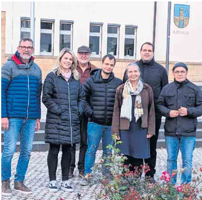
Die GRÜNEN im Rat möchten den Kontakt zwischen Rathaus und Freiwilligen Feuerwehren intensivieren.

In Alhausen und Reelsen steht der Umbau der Feuerwehrgerätehäuser an. In Neuenheerse ist das neue Feuerwehrgerätehaus fast auf der Zielgeraden. Alle diese Investitionen sind bis zu einer Höhe von jeweils 500.000€ förderfähig. Das Land gibt pro Feuerwehrgerätehaus maximal 250.000€ Zuschuss. Alle Baumaßnahmen leiden jedoch unter den Preissteigerungen der letzten Jahre. Vielfach sind diese dem russischen Angriffskrieg gegen die Ukraine geschuldet. Diese Preissteigerungen haben unter anderem dazu geführt, dass die Feuerwehrkameradinnen und -kameraden wo eben möglich Eigenleistungen erbracht haben. So hat zum Beispiel die Löschgruppe Neuenheerse bisher über 600 Arbeitsstunden investiert. Wir GRÜNE im Rat möchten ausdrücklich den Kameradinnen und Kameraden hierfür danken! Es ist