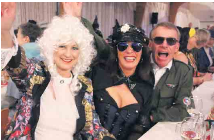
Mit guter Laune wird in Bad Driburg Karneval gefeiert.