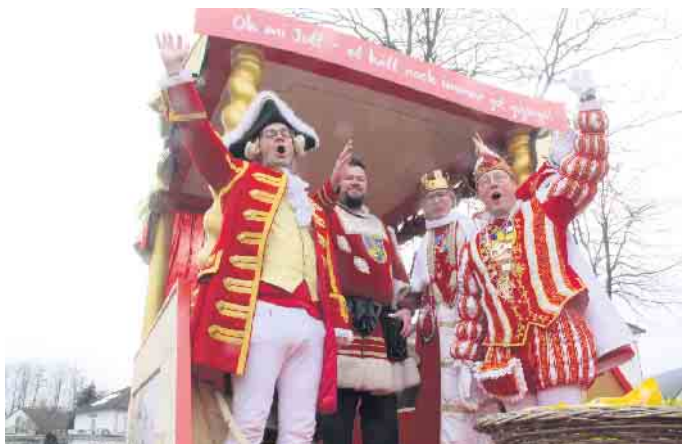
Vom Prinzenwagen grüßt das Bad Driburger Dreigestirn.

Tolle Stimmung in Bad Driburg beim großen Festumzug