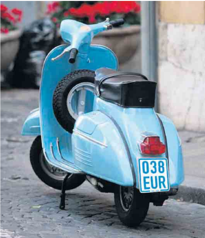
Alle Jahre wieder: Kleinkrafträder, E-Scooter und S-Pedelecs brauchen ab 1. März ein neues Versicherungskennzeichen.

len Pedelecs wird die Motorunterstützung erst bei 45 Stundenkilometern abgeschaltet und die Motorleistung liegt bei 500 Watt. In diesem Segment bietet die HUK-COBURG eine Kfz-Haftpflichtversicherung ab 27 Euro und eine Teilkasko-Versicherung mit 150 Euro Selbstbeteiligung bei Totalentwendung ab 42 Euro an. Übrigens: Ab März 2024 stellt die HUK-COBURG ihren Kunden auch einen digitalen Versicherungsnachweis zur Verfügung, der auf dem Smartphone mitgeführt werden kann.