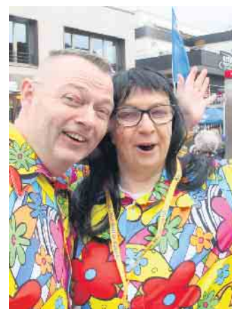
Mit guter Laune beim Bad Driburger Karnevalsumzug dabei sein.

hatten sich die Regenwolken verzogen und sorgten für einen auch wettertechnisch perfekten Karnevalsumzug 2024.