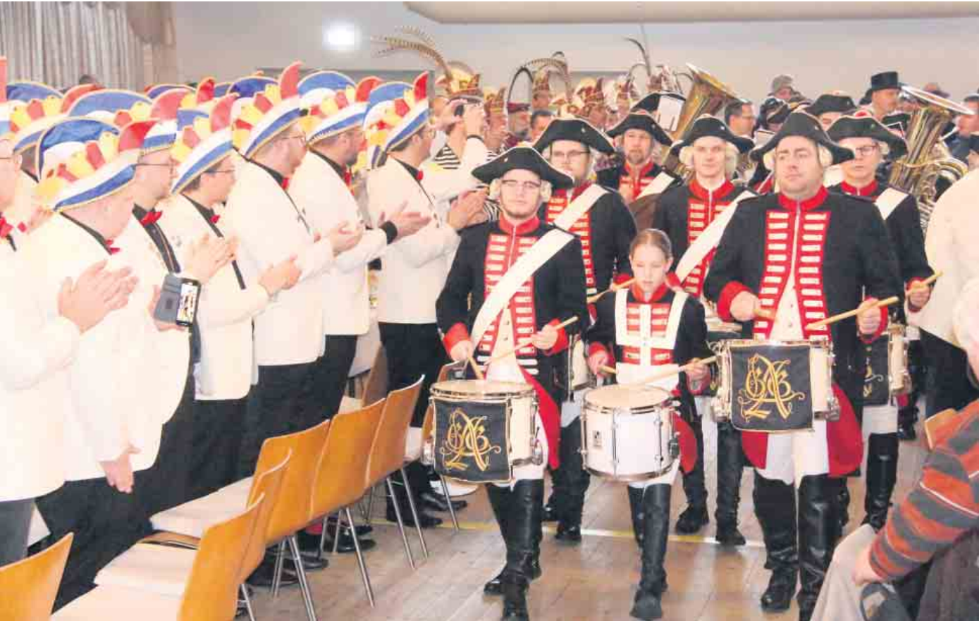
Der Einzug der Gardien eröffnet die Sitzung in der Schützenhalle.