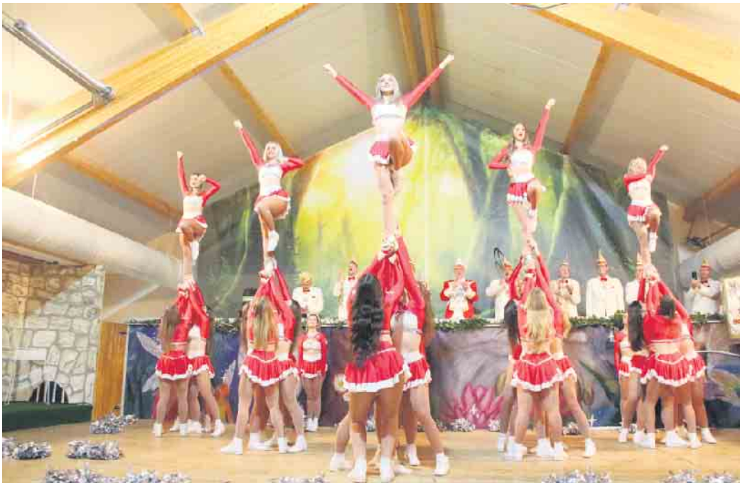
Die Cheerleaderinnen des 1. FC Köln sind ein Höhepunkt in dem mehr als fünfstündigen Programm.