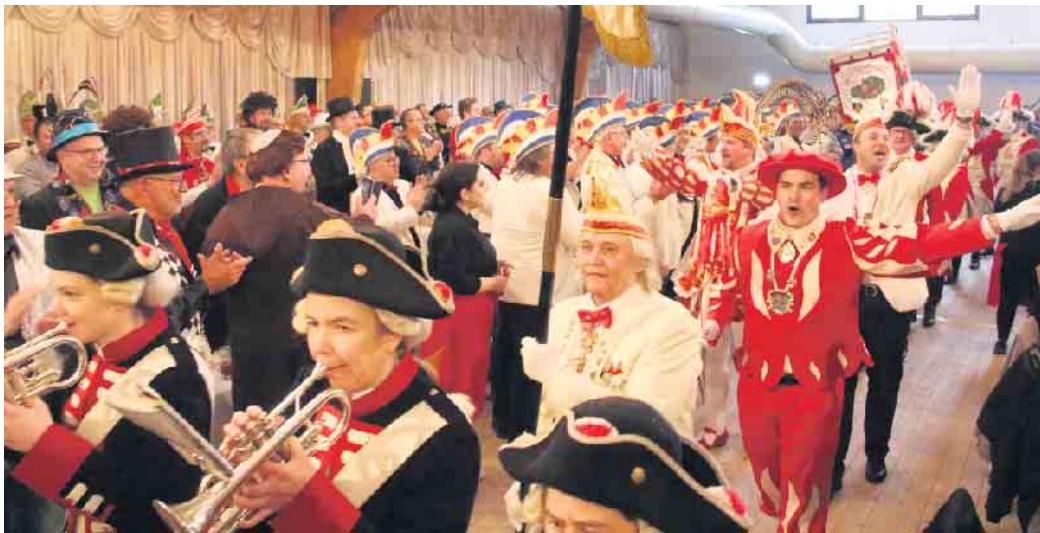
Auf der Herrensitzung der Bad Driburger Karnevalsgesellschaft geht es hoch her.