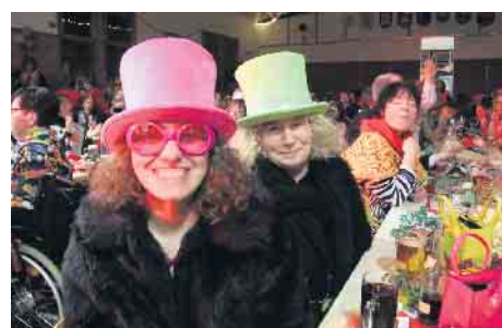
Tolle Stimmung beim Karneval in Pömbesen.

Seit zehn Jahren gibt es in Pömbesen auch einen Prinzen. Vier Jahre dauert die Amtszeit eines Bundeskanzlers. Alle fünf Jahre sind Bürgermeisterwahlen. Alle sechs Jahre wird in Pömbesen ein neuer Karnevalsprinz proklamiert. Anders als