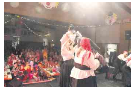
Die Fußballdamen mit ihrer Mischung aus Tanz und Akrobatik sind ein Höhepunkt im Galaprogramm.