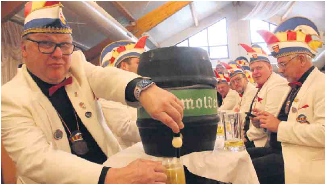
Bei der Herrensitzung steht das Bierfass nicht unter der Theke, sondern auf dem Tisch.

„Es trinkt der Mensch, es säuft das Pferd, heut ist es wieder umgekehrt“, lautet ein typischer Herrensitzungstrinkspruch, der auch in Bad Driburg mehrfach zitiert wurde.