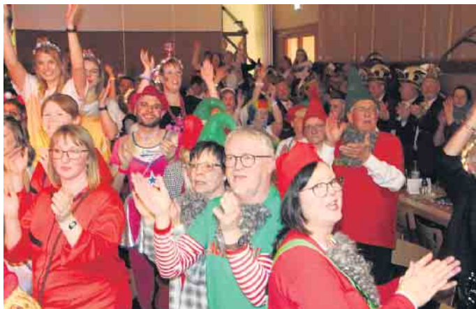
In Pömbesen tobt die Halle beim Karneval.

Hochstimmung beim Gala-Abend in der Bergdorfhalle in Pömbesen