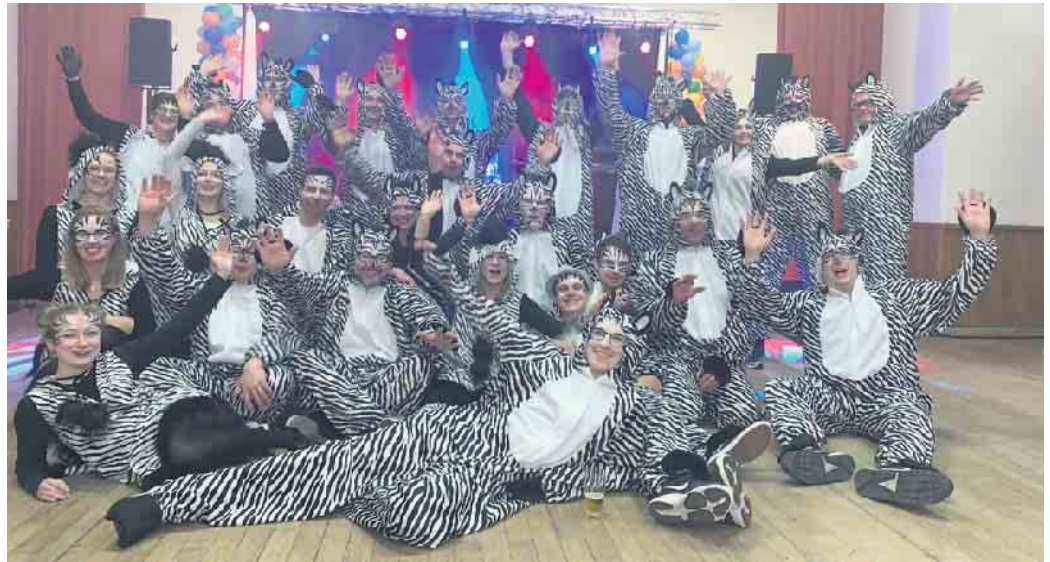
Die „Zebras“ des Spielmannszuges freuen sich auf zahlreiche Gäste

In diesem Jahr wird erstmalig die neu formierte Partyband Up2You die Zehntscheune zum Brodeln bringen. Die vier Musiker heizen den Gästen mit Karnevalssongs, Partyhits und aktuellen Hits ein.