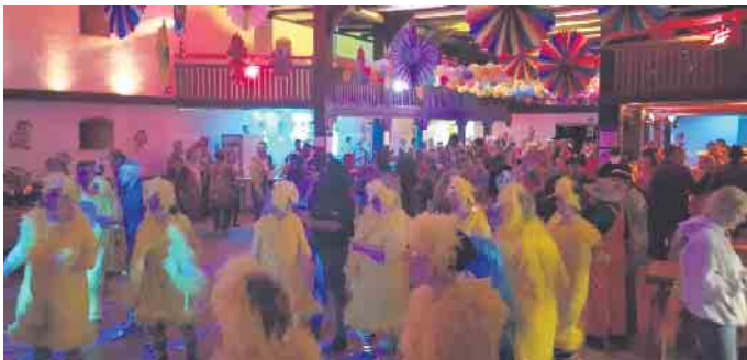
Die besten Kostüme werden prämiert!

Der Spielmannszug 1924 Dringenberg e.V. freut sich riesig, die Karnevalsverrückten aus nah und fern wieder zur traditionellen Karnevalsparty begrüßen zu dürfen.