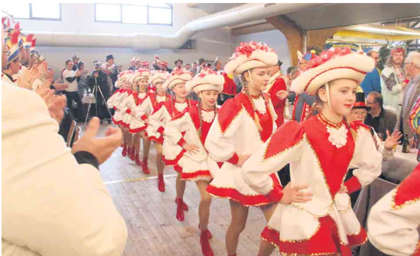
Das Publikum beklatscht den Einzug der Kinderprinzenlehrengarde.