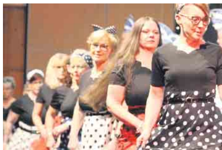
Die Bergdorfellen dürfen auf einem Gala-Abend in Pömbesen nicht fehlen.