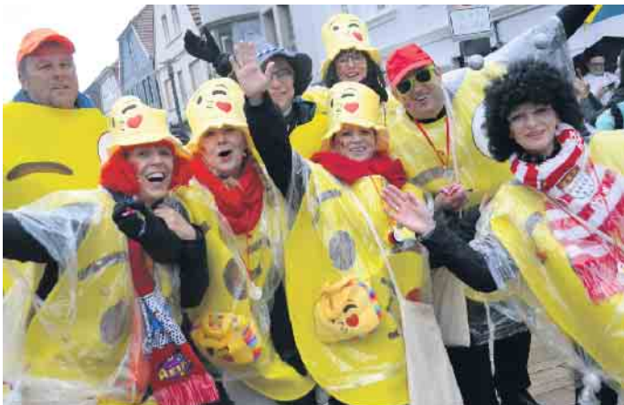
Tierisch gut drauf waren diese Jecken beim Höhepunkt der Session 2019.

Karnevalsumzug am Sonntag, 19. Februar, dem Sonntag vor Rosenmontag. Um 14.11 Uhr setzt sich der närrische Lindwurm durch die Bad Driburger Innenstadt in Bewegung.