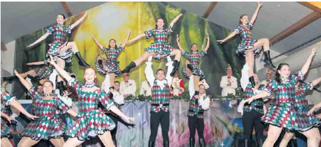
Die Kölschen Harlequins der Karnevalsgesellschaft Alt-Köllen von 1883 e.V. beeindruckten mit ihrem akrobatischen Talent.