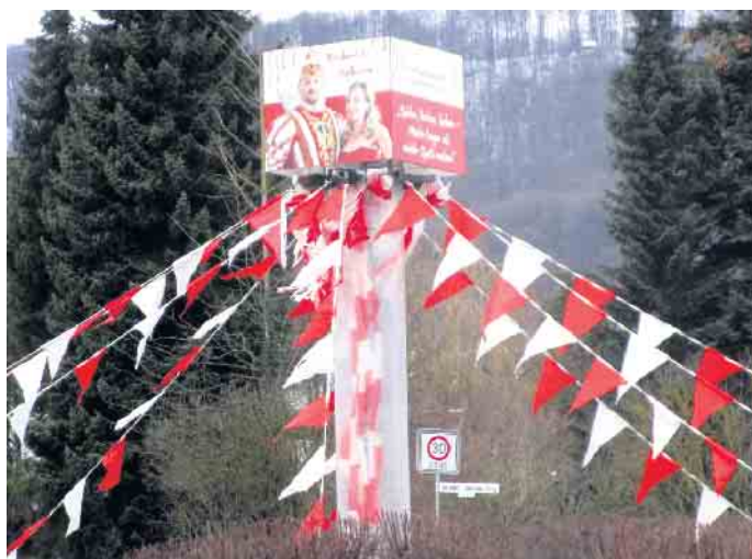
An der Spitze der Narrenschar steht das fröhliche Prinzenpaar

Am Ostersonntag wird zusammen mit der 4. Kompanie der Bürgerschützengilde auf dem Siedlerplatz wieder ein Osterfeuer abgebrannt. Weitere Aktionen wie Maiwanderung oder Sommerfest wurden angesprochen aber noch nicht fest terminiert. Nach den coronabedingten Einschränkungen der letzten Jahre können sich die Siedler nun wieder auf fröhliche Zusammenkünfte freuen.