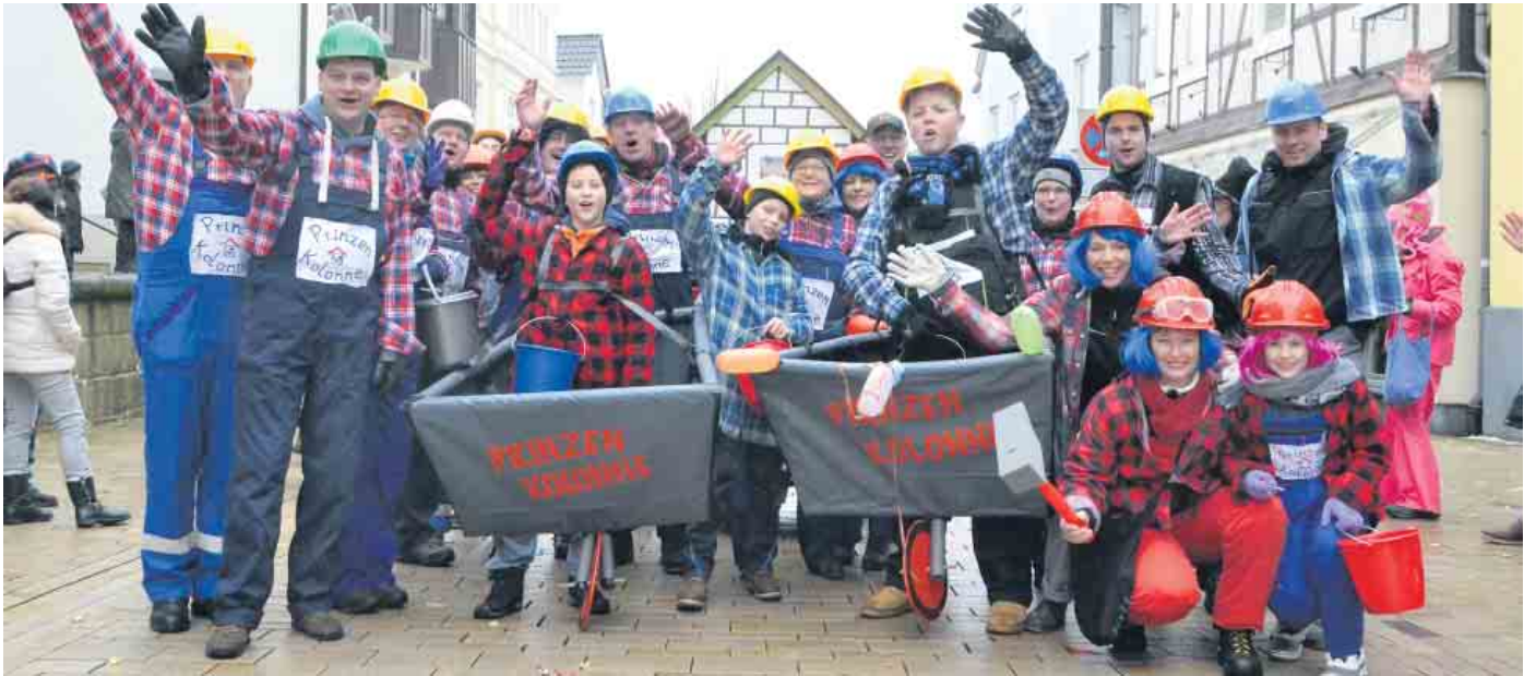
Die „Prinzenkolonne“ beim Umzug im Jahr 2018

Das ist der weitere Fahrplan durch die närrische Session in Bad Driburg