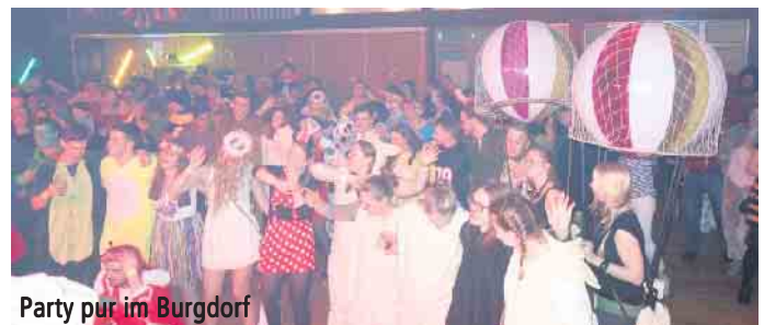
Party pur im Burgdorf

33014 Bad Driburg-Dringenberg • Burgstraße 24 Telefon 0 52 59 - 778