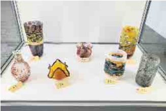
Einige Ausstellungsstücke in der Vitrine