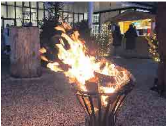
Beliebter Treffpunkt: Die Glühweinhütte im Gräflichen Park läutet das Saisonende ein.

Öffnungszeiten Glühweinhütte: Donnerstag bis Samstag, 16.30 bis 20.30 Uhr Sonntag, 14.30 bis 19 Uhr Weitere Informationen: Glühweinhütte im Gräflichen Park, www.graeflicherpark.de