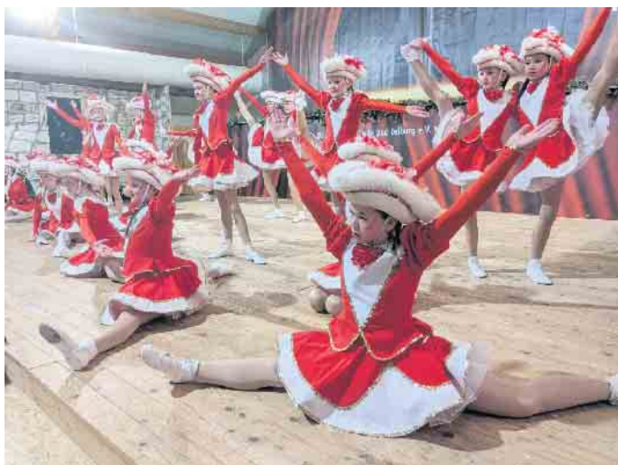
Die 21 Tänzerinnen der Kinderprinzenehrengarde haben für diese Session funkelneue Kostüme bekommen.

Zum Abschluss des Saalkarnevals am Abend vor dem großen Karnevalsumzug, am Samstag, 1. März, 18 Uhr dürfen sich die Nürinnen und Narren auf die traditionelle Rot-Weiße-Nacht freuen. Beginn der großen Karnevalsgala ist um 18 Uhr. Der Höhepunkt im Straßenkarneval ist am Tulpensonntag, 2. März, ab 14 Uhr der Festumzug durch die Innenstadt. Viele Institutionen aus Stadt und Region beteiligen sich daran. Auch werden Motivwagen vieler Karnevalsorganisationen aus dem Kreis zu sehen sein.