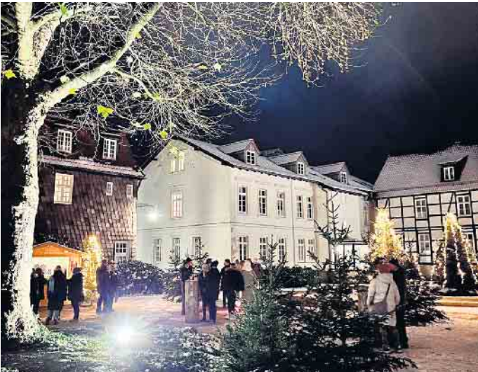
Nach einer guten Saison mit 9.000 Gästen schließt die Glühweinhütte im Platanenhof des Gräflichen Parks Anfang Februar.

Für die letzten drei Monate war die Glühweinhütte im Gräflichen Park ein beliebter Treffpunkt für alle Winterfreunde. Rund 9.000 Gäste kamen in der diesjährigen Glühweinsaison, um den Glühweinzauber mit offenen Feuerstellen im Platanenhof des Gräflicher Park Health & Balance Resort zu genießen.