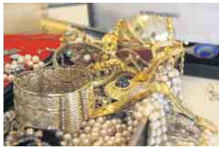
Ansprechpartner für die Wertermittlung von Schmuck, Münzen oder Edelsteinen.

die Wertermittlung von Schmuck, Münzen oder Edelsteinen. „Gerne kommen wir nach vorheriger Terminvereinbarung auch zu Ihnen nach Hause, um Ihre Schmuckstücke zu bewerten“, so Benjamin Genc. Das Ladengeschäft in Bad Driburg ist unter der Woche von 10 bis 17 Uhr sowie samstags von 10 bis 13 Uhr geöffnet. Weitere Informationen gibt es auch im Internet unter www.padergold.de .