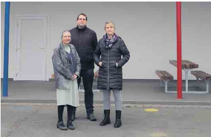
Mit wenigen Investitionen könnte die Schule in Pömbesen mehr Raum für die Betreuung bekommen.

Ende: Aus der Arbeit der Parteien Bündnis90 / Die Grünen