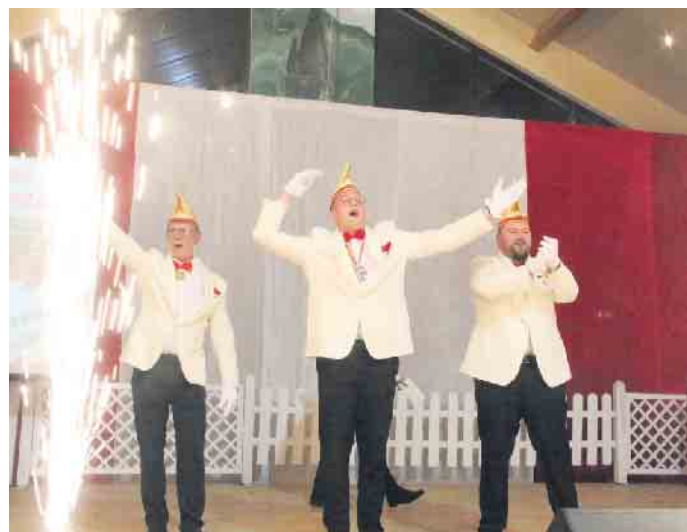
Pyrofontänen und Jubel für das Bad Driburger Dreigestirn.