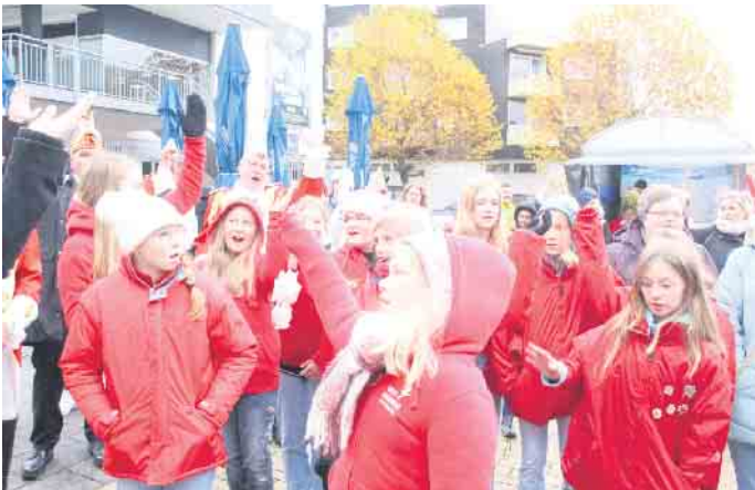
Tolle Stimmung beim Auftakt des Kinderkarnevals