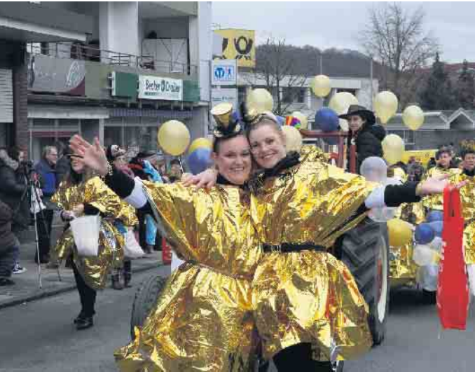
Tolle Stimmung beim großen Karnevalsumzug.