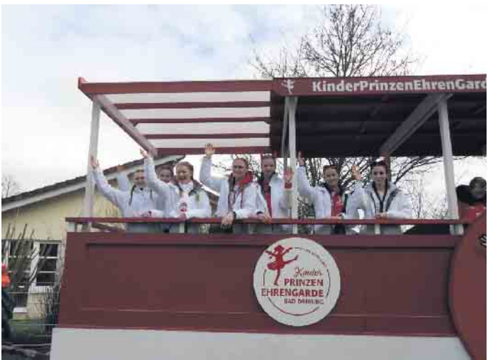
Die Kinderprinzenehrengarde und die Tanz- und Prinzengarde fährt im Wagen vorbei.