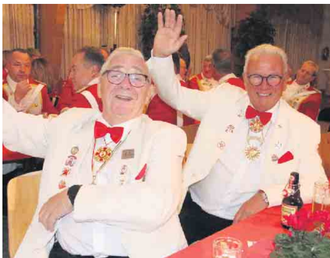
Haben viel Spaß in Bad Driburgs fünfter Jahreszeit.