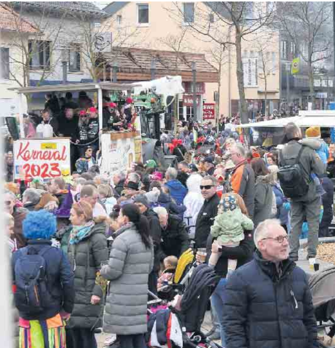
Tausende Besucher feiern Straßenkarneval in Bad Driburg.

lungsreichen Karnevalsumzug auf die Beine. Sicherheitskonzept, Musikkapellen, Wurfmaterial und Wagenbau erzeugen dabei einen hohen Kostenaufwand, den der Verein ohne die Mithilfe der Besucher nicht bewältigen kann. Die Aufstellung des Umzugs erfolgt ab 13 Uhr vom Tegelweg über die Geschwister-Scholl-Straße und die Straße Zum Hillenwasser bis zur Mühlenstraße. Start ist dann um 14 Uhr an der Mühlenstraße. Der Streckenverlauf geht dann über die obere Lange Straße zur Pyrmonter Straße und dann über den Konrad-Adenauer-Ring zur unteren Lange Straße.