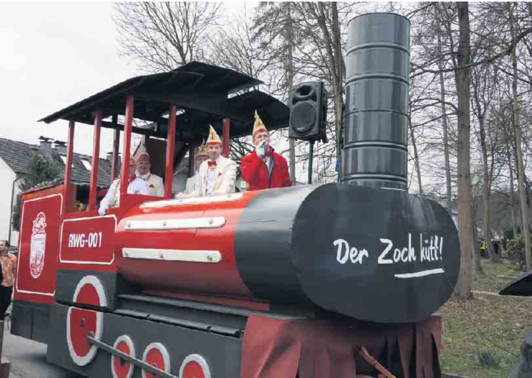
Der Zoch kütt. Der Vorstand führt den Umzug an.

Der Karnevalsumzug am 11. Februar ist der Höhepunkt im Bad Driburger Straßenkarneval