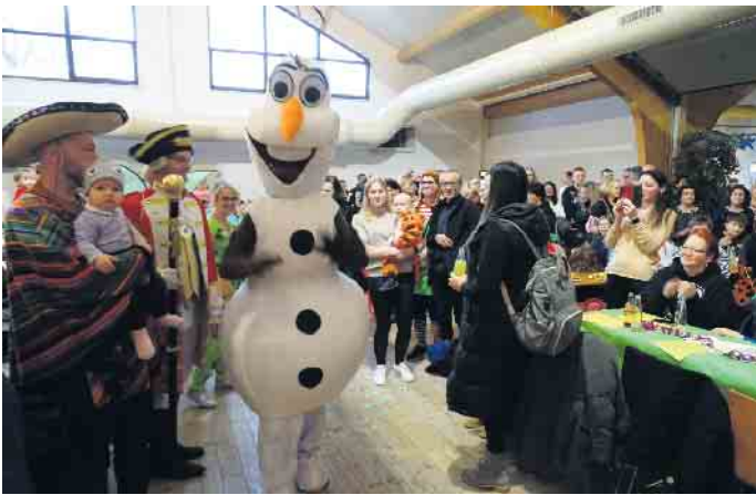
Kinderkarneval in Bad Driburg ist ein Fest der guten Laune.