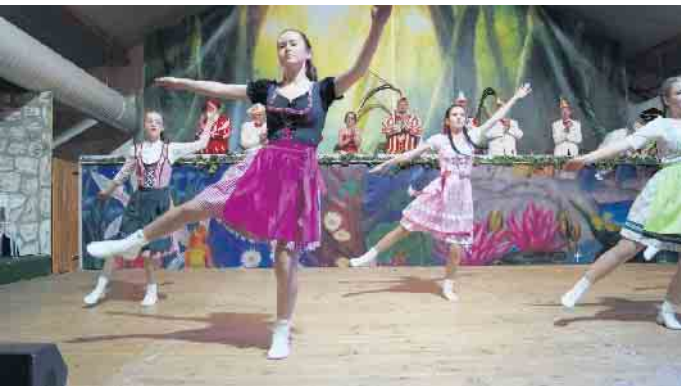
Tanzvorführung mit Wiesn-Look im Dirndl.