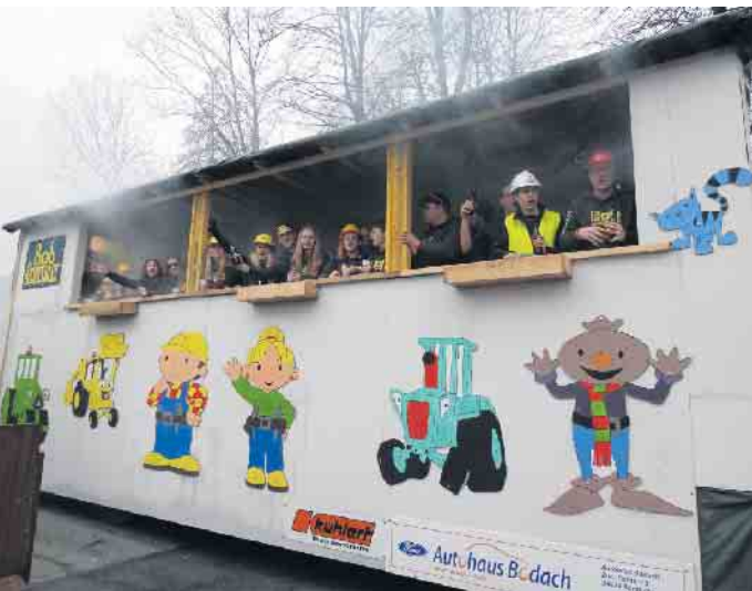
Im Party-Bauwagen wird Rabatz gemacht

Der große Karnevalsumzug durch die Bad Driburger Innenstadt findet in diesem Jahr am Sonntag, 11. Februar, statt. Beginn ist um 14 Uhr. Die Karnevalsgesellschaft Rot-Weiße Garde bittet die Besucher um eine Spende von drei Euro, die an allen Einlässen zum Innenstadtbereich entrichtet werden kann. Dafür stellt die KG Rot-Weiße Garde jedes Jahr auf's Neue einen farbenfrohen und abwechs-