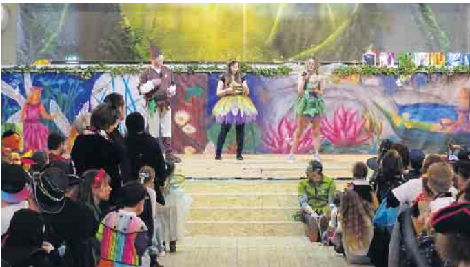
Es gibt lustige Spiele zur Unterhaltung.