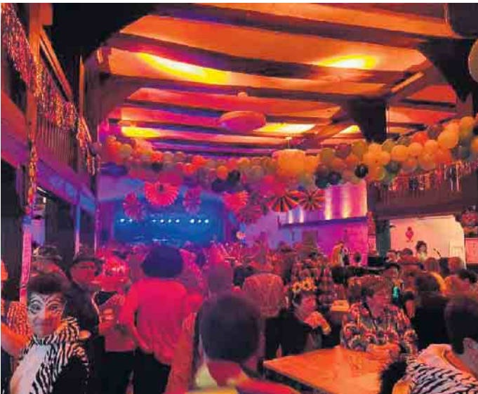
Volles Haus im Burgdorf

tere Events bereit, so zum Beispiel das große Festwochenende am 20. und 21. April. Bleibt gespannt - auf die nächsten 100 Jahre!