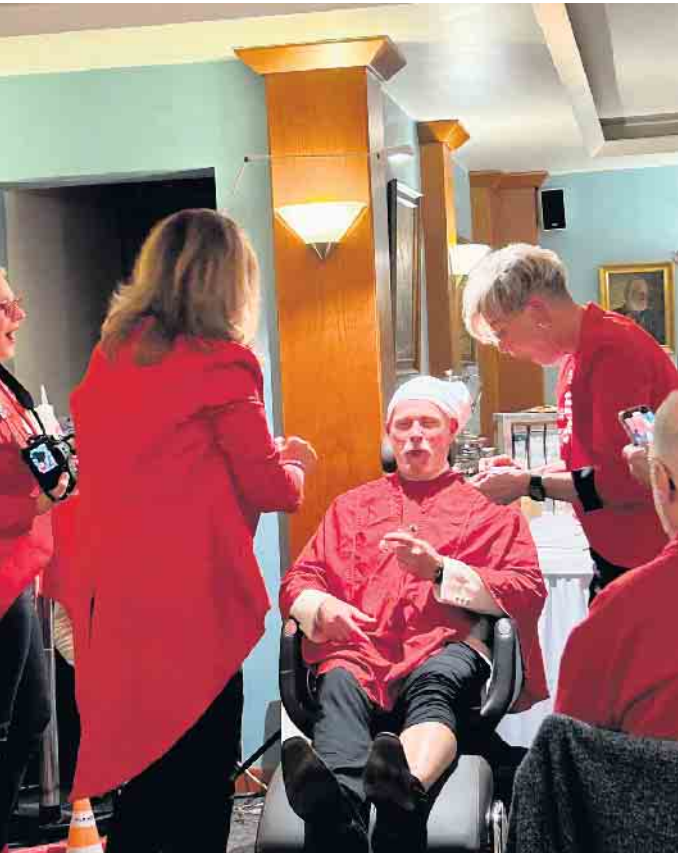
Der Bart schon fast vollständig abrasiert.

dass das Trio nunmehr nahezu startklar ist, um unmittelbar nach Weihnachten in die Vollen gehen zu können. Wir dürfen gespannt sein, welche Überraschungen die drei sich für diesen besonderen Abend für uns ausgedacht haben. Die „Rasur der Jungfrau“ war in jedem Fall ein gelungener Start in das Umstyling.