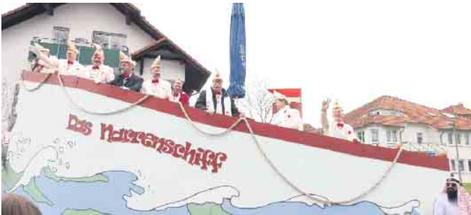
Das Narrenschiff gleitet durch die Wogen der Session.