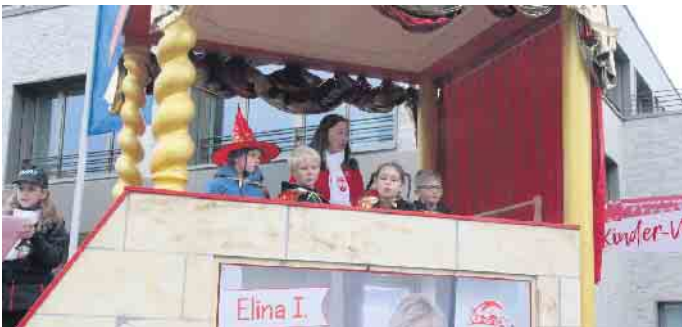
Der Kinderprinzenwagen ist für den großen Umzug bereit.