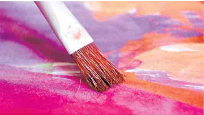
Der Preis berücksichtigt alle Kunstsparten.

turelle Programme) aus den vergangenen zwei Jahren sowie auch andauerndes Engagement. Der Preis berücksichtigt alle Kunstsparten (z. B. bildende und darstellende Kunst, Musik), aber auch Kunst- und Kulturvermittlung, Kulturpublizistik und Kulturmanagement, kulturelle Öffentlichkeitsarbeit, die Organisation von Kulturveranstaltungen, historische Forschung sowie Heimatpflege oder andere kulturelle Bereiche. Die Preise, bestehend aus mehreren Hauptpreisen von bis zu 10.000 Euro je Einzelpreis, werden am Ende von einer hochkarätig besetzten Jury vergeben, welche erstmals auch einen thematischen Sonderpreis vergeben kann. Weitere Informationen zum Wettbewerb erhalten Sie unter www.westfalenweser.com unter Regionales Engagement.