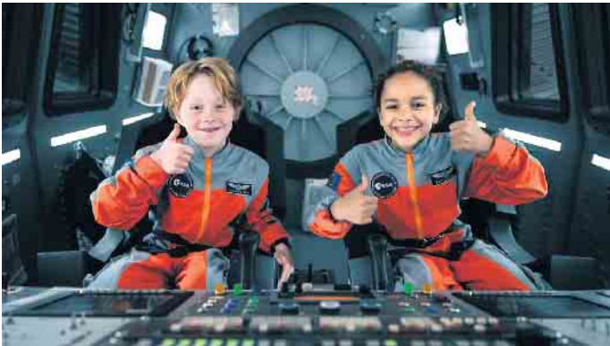
„Wow - Nachrichten aus dem All“.

und die Reise zu den fliegenden Flüssen“, oder der spritzige „Wow - Nachrichten aus dem All“ über eine außergewöhnliche Reise. Neu zu sehen sind die Filme „Lou - Abenteuer auf Samtpfoten“ und „Thabo - Das Nashorn-Abenteuer“. In der neuen Staffel gibt es diesmal außergewöhnlich viele Filmklassiker der letzten Jahrzehnte zu sehen. Aus den 1970er Jahren zeigt das Kino Bad Driburg „Michel bringt die Welt in Ordnung“, „Der kleine Maulwurf“ und „Wickie und die starken Männer“. „Meister Eder und sein Pumuckl“ ist aus den 1980er Jahren, „Pettersen und Findus“ kam 1999 zunächst als Animationsfilm in die Kinos. Die Bilderbuchverfilmung „Der kleine Eisbär 2“ ist von 2005. Bei vielen der Filme handelt es sich wieder um Verfilmungen bekannter Kinderbuchklassiker. Eine schöne Idee ist es, das Buch vorher gemeinsam zu lesen und dann später die Verfilmung im Kino anzuschauen. Die Programmhefte sind bereits