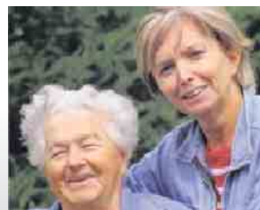
Meine Mutter braucht Pflege

Für Sie 24 Stunden erreichbar 0 52 53 / 93 50 217