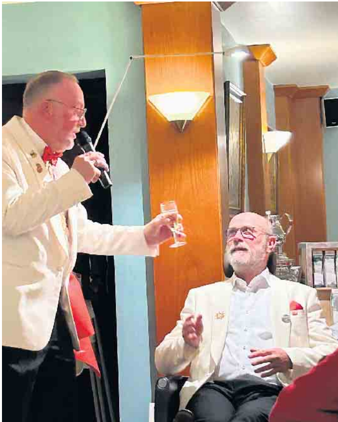
Ein letzter Schluck, bevor die Prozedur beginnt.