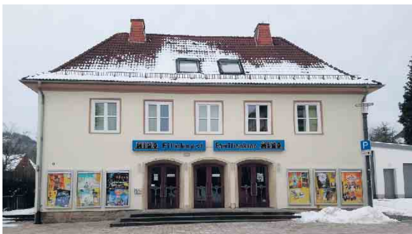
Das Kino Bad Driburg