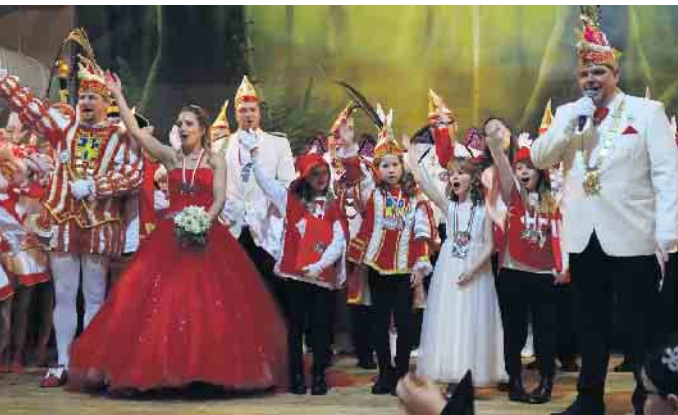
Die gesamte Karnevalsfamilie mit allen Würdenträgern auf der Bühne.

die Bühne ein. Und weil es im vergangenen Jahr so schön war, hatte sich ganz klammheimlich auch Olaf der Schneemann in den Feenwald aufgemacht, um den kleinen Tänzern auf der Bühne ordentlich einzuheizen und die Kinderaugen zum Staunen zu bringen.