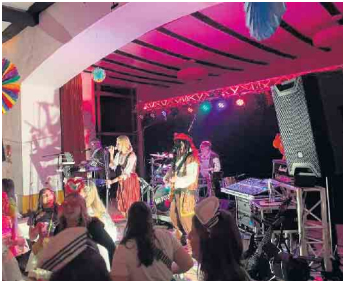
UP2YOU im Element