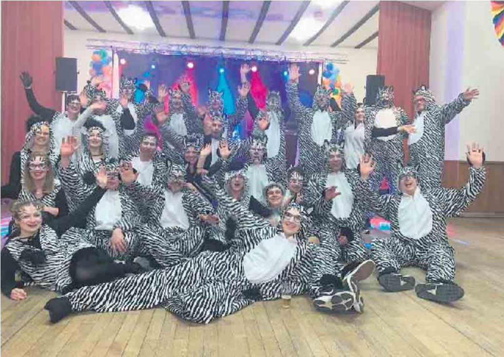
Die „Zebras“ des Spielmannszuges freuen sich auf zahlreiche Gäste

Inmitten von Konfetti und guter Laune steht Dringenberg in diesem Jahr vor einem großen Jubiläum: Der Spielmannszug wird stolze 100 Jahre alt und die traditionelle Karnevalsparty, von eben Diesem organisiert, erfreut die Jecken seit Jahrzehnten. Ein Grund mehr, es auf der Karnevalsparty in diesem Jahr so richtig krachen zu lassen! Am 10. Februar startet die diesjährige Karnevalsparty um 19.51 Uhr in der Zehntscheune. Die Vorbereitungen sind im vollen Gange - Pappnasen sind gebastelt, Kostüme gebügelt, denn die 5. Jahreszeit geht in die heiße Phase. Die Besucher dürfen sich auf einen tollen Abend freuen: Leckeres Rheder Pils und eine voll ausgestattete Longdrink-Bar sorgen für die nötige Erfrischung. Kostümierung ist nicht nur erwünscht, sondern geradezu ein ungeschriebenes Gesetz einer jeden Karnevalsparty. Ab 21.21 Uhr werden die kreativsten Gruppen- oder Einzelkostüme mit attraktiven Preisen belohnt.