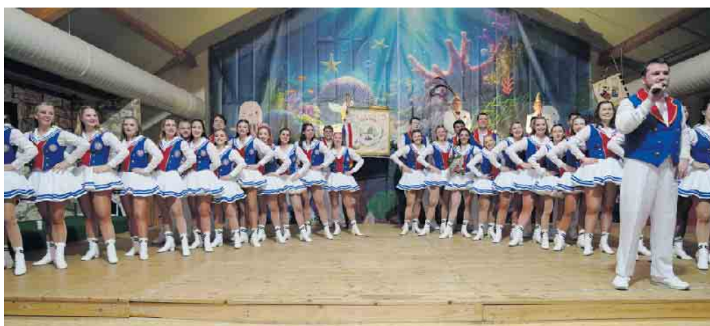
Das Dreigestirn mit ihrem Prinzenführer freut sich auf die anstehende Session