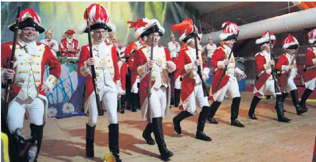
Hier tanzt die Stadtgarde.