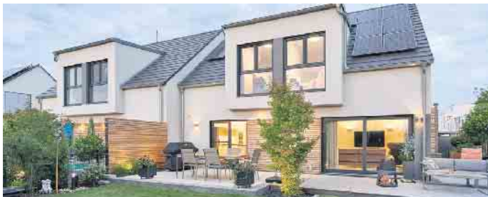
Doppelhaus in Fertigbauweise - das geht achsensymmetrisch oder auch grundverschieden.