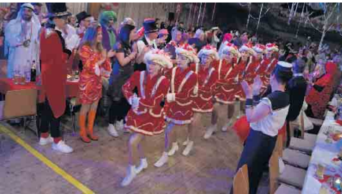
Der Einmarsch der Tanz- und Prinzengarde zur Rot-Weißen Nacht.

gekonnte Schrittfolgen aber auch fantasievolle Outfits. Und so erstrahlte die Bühne in einem bunten Tanzprogramm und außergewöhnlichen Kostümen, die sich wie selbstverständlich in das neue Bühnenbild zum Thema „Feenwald“ einfügten.