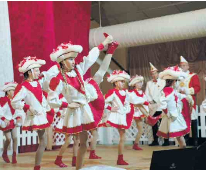
Die Gardetänzerinnen zeigen, was sie können.