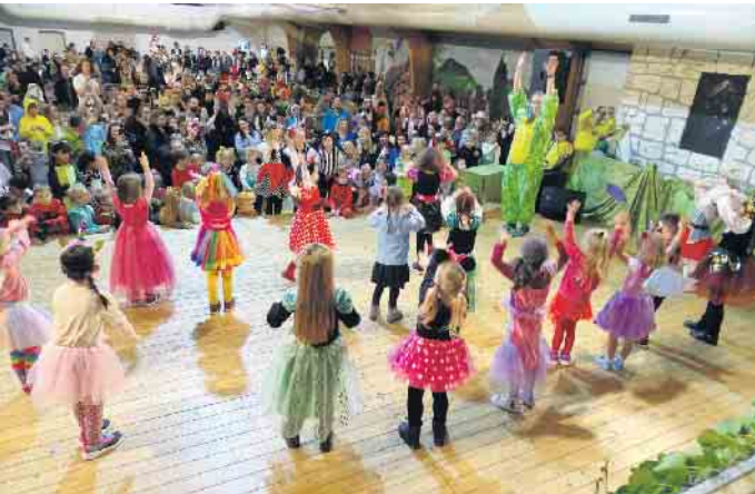
Die Schützenhalle ist zum Kinderkarneval gut gefüllt. Es wird ein tolles Programm geboten.

Kinderkarneval wird in diesem Jahr am Sonntag, 4. Februar, gefeiert. Zunächst findet morgens, 9.30 Uhr der karnevalistische Gottesdienst statt. In diesem Jahr ist der ökumenische Gottesdienst in der evangelischen Kirche am Kurpark. Am Nachmittag steigt dann ab 14 Uhr der große Kinderkarneval in der Schützenhalle.