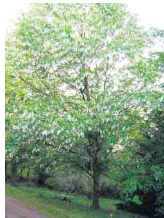
Blühender Taschentuchbaum im Arboretum.