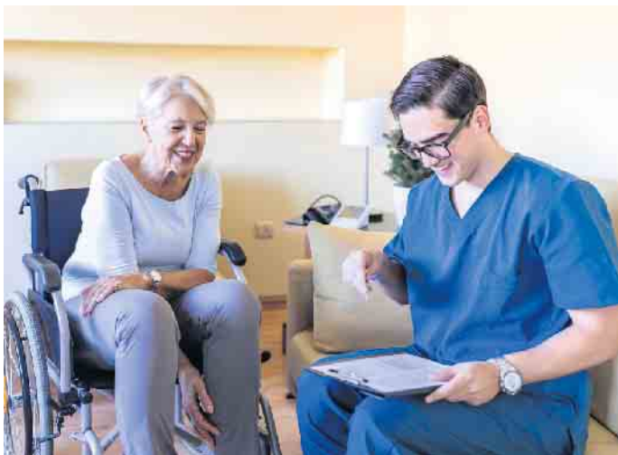
Ein Pflegeberuf bringt viel Kontakt mit anderen Menschen mit sich.