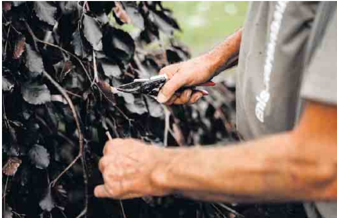
Der Garten verändert sich mit den natürlichen Zyklen der Jahreszeiten.

sucher“, erläutert der Firmeninhaber. Der Garten verändert sich mit den natürlichen Zyklen der Jahreszeiten und bietet neben Lebensräumen auch Nahrungsquellen und Nistplätze. Wichtig dabei sind der Verzicht auf jegliche Verwendung