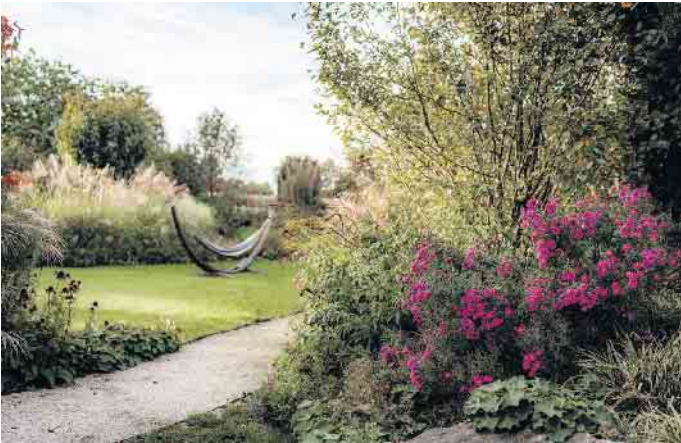
Ein von Ehls Gartenbau gestalteter Garten ist eine Wohlfühlloase für Mensch und Natur.