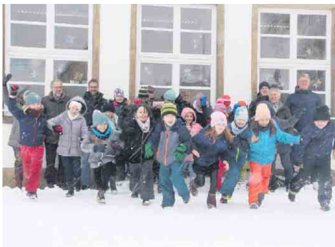
35 Kinder der beiden dritten Klassen der Gemeinschaftsgrundschule Dringenberg haben sich für den Basar engagiert.

die südafrikanische Provinz im Hinterland der Großstadt Durban. Zuletzt ist Paresen im November dort gewesen. Die Region ist ungefähr dreimal so groß wie Nordrhein-Westfalen aber nur ein Fünftel so dicht besiedelt. „Es ist das historische Stammesgebiet des stolzen Zulu-Volkes, aber es ist auch eine sehr arme Region, in der es an vielen sozialen Entwicklungsmöglichkeiten fehlt“,