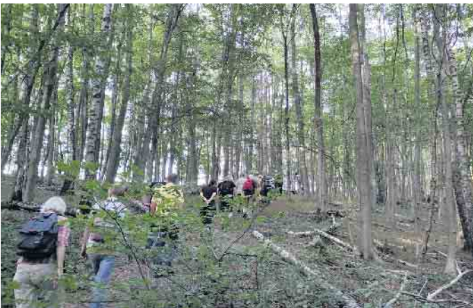
Möglichst naturnahe Wälder wie diese Naturwaldzelle in der Egge ziehen Menschen magisch an. Und das ist gut so!

Nein zu Falschinformationen! Ja zur Chance!