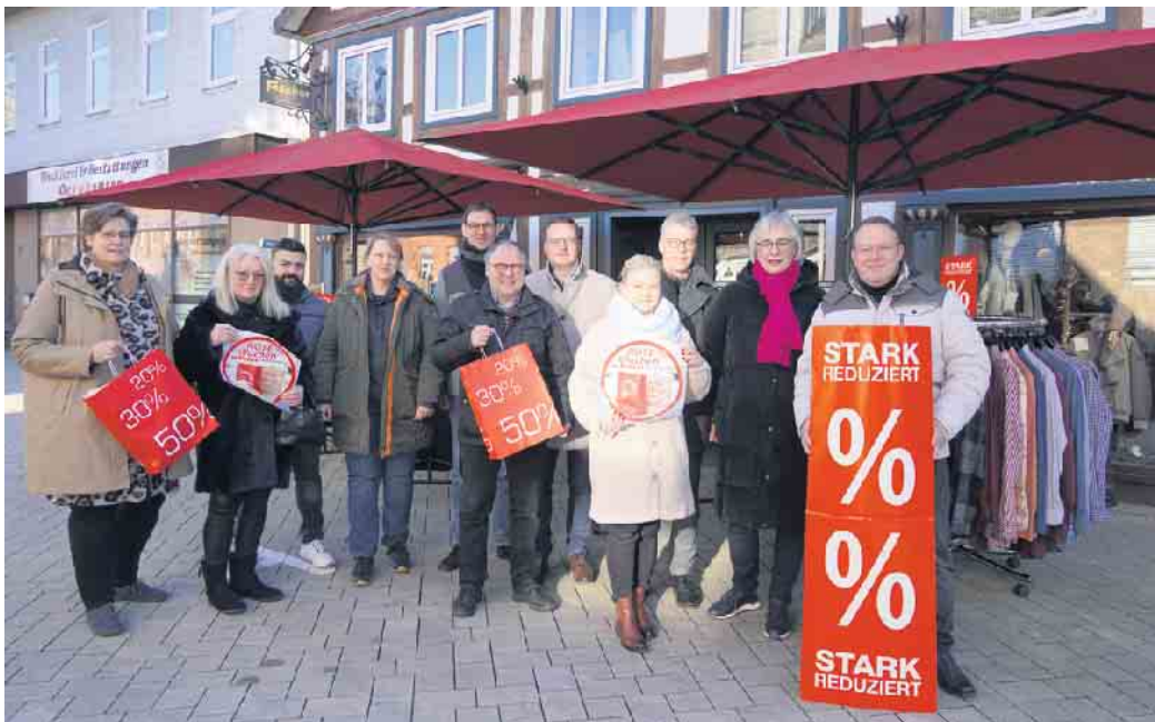
Die teilnehmenden Betriebe des Brakeler Werberings laden wieder zur Winterausgabe der Roten-Prozent-Wochen ein.

ke Gemeinschaft der Brakeler Gewerbebetriebe, die die lokale Wettbewerbsfähigkeit im globalen Wettbewerb steigern hilft. Durch zahlreiche, vielfältige Veranstaltungen und Aktivitäten erzeugen wir Synergieeffekte für die teilnehmenden Mitglieder. Gemeinsam identifizieren wir uns mit dem Wirtschaftsstandort Brakel und tragen zur zukunftsfähigen Entwicklung des Standortes bei. Das Synonym „Brakel hat Qualität“ steht nicht nur für eine Kampagne im Rahmen des Stadtmarketingprozesses, sondern steht für die Attraktivität des Einkaufs- und Gewerbestandortes in der schö-