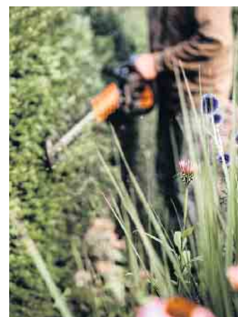
Das Gartenpflege-Abo ist ein besonderes Serviceangebot.

fähige Team von Ehls-Gartenbau weiter wachsen, um noch mehr dieser Projekte realisieren zu können. Mit der Zeit hat sich die Firma auf ihr eigenes Natur-Design spezialisiert. Das Leistungsspektrum umfasst neben Planung und der baulichen Gestaltung auch die Anlage moderner und ästhetischer Pflanzenkonzepte. Wichtig hierbei ist das Verständnis von Kontrasten, die Spannung erzeugen, sowie Rhythmik und Harmonie. „Ästhetik hat keinen praktischen Sinn, sondern trägt ihren eigenen Sinn in sich. So kann ein gelungenes Zusammenspiel von Stein, Pflanze und Wasser eine multiple sinnliche Wahrnehmung beim Kunden erzeugen. An den gestalteten Konzepten erfreuen sich nicht nur die Betrachter, sondern auch die Insektenfauna, Vogelpopulationen und weitere Be-