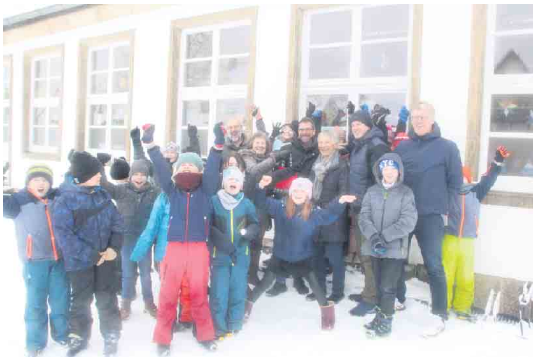
Große Freude bei allen Beteiligten über den erfolgreichen Zululand-Basar an der Gemeinschaftsgrundschule Dringenberg.