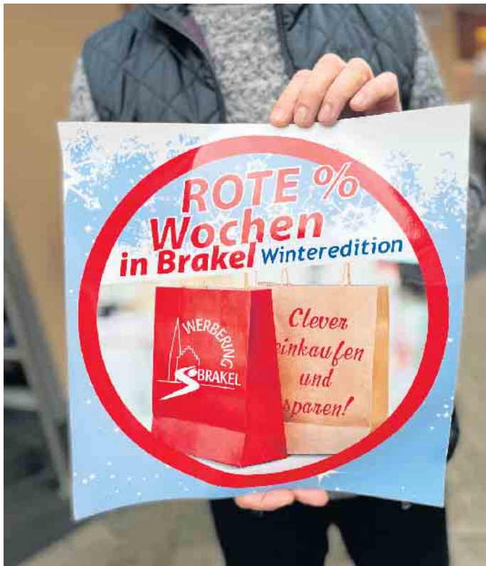
Das Logo der Rote-Prozent-Wochen in den Schaufenstern weist den Kundinnen und Kunden den Weg.