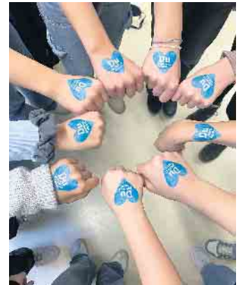
Die Handtattoos waren nach der Aktion im ganzen Schulgebäude sichtbar.

her man kommt, welche Sprache man spricht oder welche Fähigkeiten man hat - jedes Kind ist wichtig und hat die gleichen Rechte (Artikel 2 der UN-Kinderrechtskonvention). Ein ebenso wichtiges Anliegen war es aber auch, neben den Rechten auf die Pflichten hinzuweisen, die mit dem Leben in einer freiheitlichen Demokratie verbunden sind, nämlich dass sich auch die Jüngsten schon aktiv für ein friedliches und respektvolles Miteinander einsetzen.