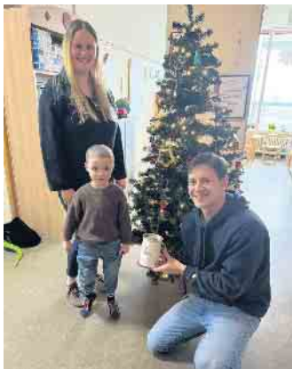
Spendenübergabe an Luftsprung.

Durch eure Hilfe konnten wir Anfang des Jahres dem Team von „Luftsprung“ unsere Spenden, in Höhe von 500 Euro, persönlich in der UMG auf der Kinderkrebsstation überreichen.