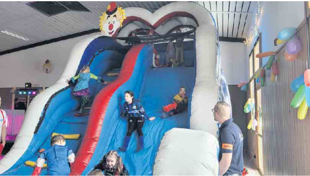
Mit der Riesen-Kahuna-Rutsche ist der Spaß garantiert

Für beste Stimmung sorgt DJMac-Partytime, während der quirlige Clown und Jongleur Tasso die kleinen Gäste mit seinen Shows begeistert. Mit Spielen wie Dosenwerfen, einem Fußballkicker, dem XXL-Vier-Gewinnt und der spektakulären Riesen Kahuna Rutsche kommt garantiert keine Langeweile auf. Ein weiterer Höhepunkt ist das Kinderschminken, bei dem die Kinder in fantastische Figuren verwandelt werden können sowie kunstvolles Ballonmodellieren, das die kleinen Gäste staunen lässt. Für eine süße Stärkung sorgen frisch gebackene Waffeln mit Puderzucker. Ein beheizter Wickelraum und ein Krabbelbereich la-