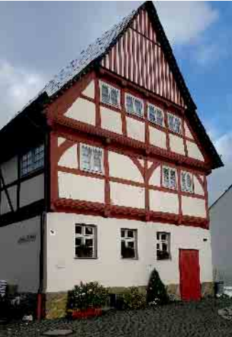
Das Historische Rathaus Dringenberg mit Ausstellungsräumen des ArtD Driburg im Obergeschoss