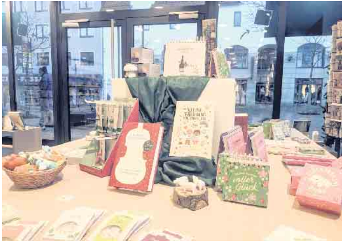
Der neue Standort der Buchhandlung Saabel ist die Lange Straße 101 am unteren Raiffeisenplatz.