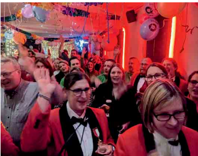
Tolle Stimmung bei der Prinzenproklamation von Brakel Radau.