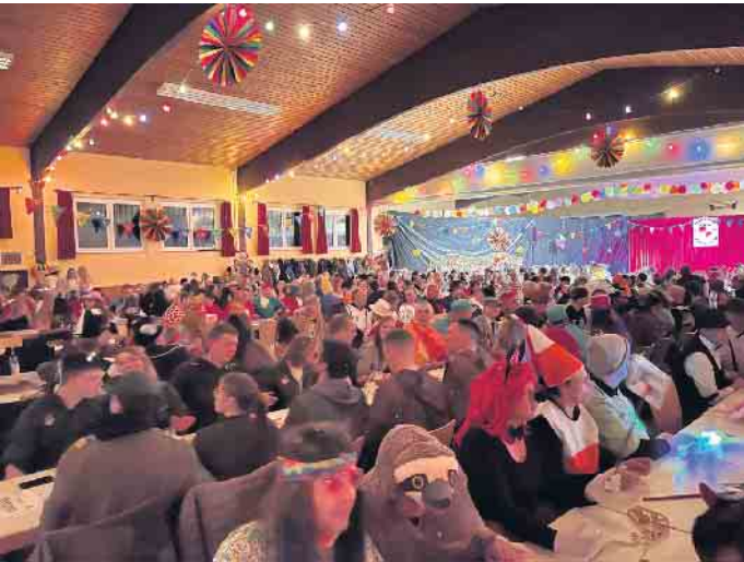
Die Dreizehnlindenhalle ist an Karneval immer ein Publikumsmagnet

garde, Tanz- und Prinzengarde und Stadtgarde, die 12 Tornados, Netheperlen, No Names, der Reiterverein Eggeland und das Weber Street Ensemble. Die Tore der Dreizehnlindenhalle öffnen sich um 18.11 Uhr. Das Bühnenprogramm startet um 19.11 Uhr. Nach dem Programm sorgt DJ TN für beste Partystimmung. Kartenbestellungen und Tischreservierung werden bis zum 15. Februar per E-Mail unter rwa@alhausen.de entgegengenommen (VVK 12 Euro). Restkarten können, insoweit noch verfügbar, an der Abendkasse erworben werden (AK 14 Euro).