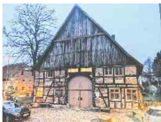
Das denkmalgeschützte Weberhaus in Alhausen ist das Geburtshaus des Dichters Friedrich-Wilhelm Weber.