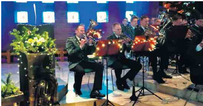
Musiker der Stadtkapelle