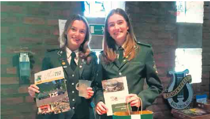
Die Jubiläums-Festschrift wurde angeboten.

das den Kirchenraum mit einer spürbaren Gemeinschaft erfüllte. Klassiker wie „In der Weihnachtsbäckerei“, „Alle Jahre wieder“ und „O Tannenbaum“ wurden begeistert mitgesungen. Den emotionalen Abschluss bildete das Lied „Stille Nacht“.