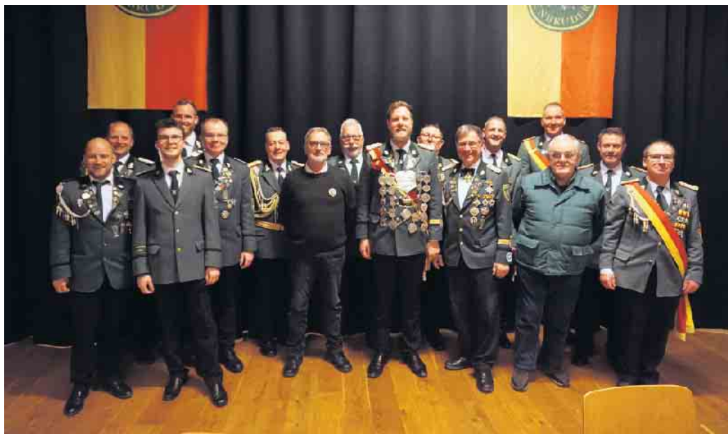
Der Vorstand der Schützenbruderschaft lädt zur Generalversammlung ein und hofft auf eine gute Beteiligung.