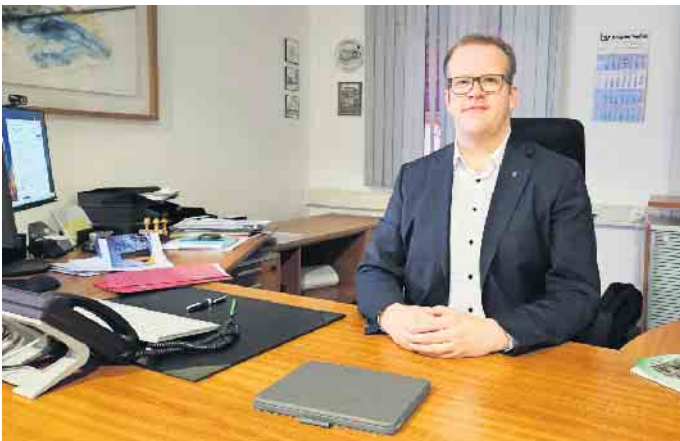
Bürgermeister Tobias Tölle

Alle Interessenten erhalten einen festen Termin, um Wartezeiten zu vermeiden. Das Sekretariat des Bürgermeisters vereinbart die Termine unter Telefon 05253-881001 oder per E-Mail