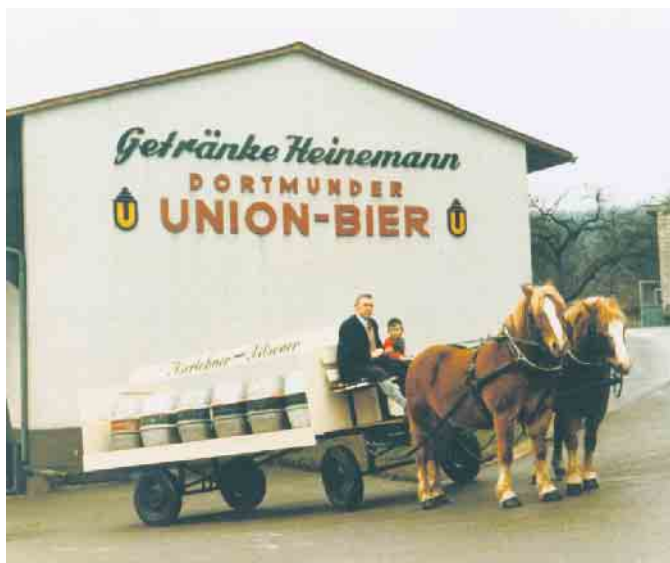
In den 1950er Jahren wurde in Bad Driburg noch mit Pferd und Wagen ausgeliefert.