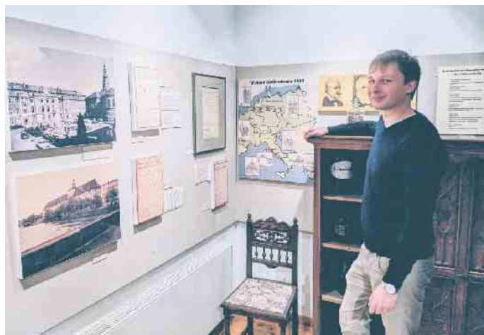
Das Weber-Geburtshaus beherbergt ein Museum zum Schaffen Friedrich-Wilhelm Webers.