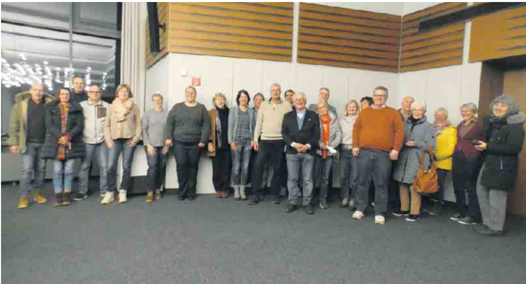
Neuer und alter Vorstand mit Mitgliedern des Fördervereins.