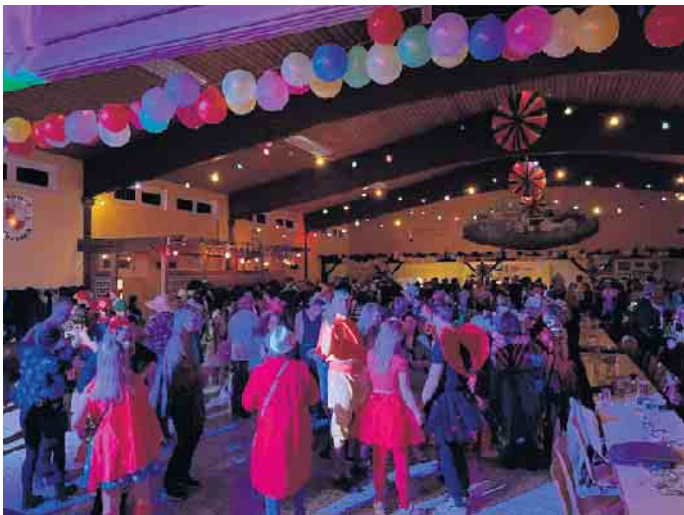
Immer beste Stimmung beim Karneval in Alhausen

haltung und ausgelassene Stimmung sorgen werden. Im Anschluss an das Bühnenprogramm wird weitergefeiert: Bei der After-Show-Party mit DJ TN kann bis in die Nacht getanzt und gefeiert werden. Anmeldungen und Tischreservierungen werden bis zum 31. Januar unter rwa@alhausen.de oder WhatsApp 0170/ 6174164 entgegen genommen (VVK 12 Euro). Der RWA freut sich auf zahlreiche kostümierte Gäste und einen unvergesslichen karnevalistischen Abend.