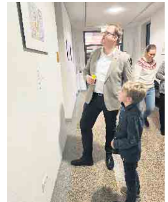
Nach der Ausstellungs-Eröffnung blieb genug Zeit für Gespräche mit dem Stadtoberhaupt über die Inhalte der Bilder.

der eingereichten Ideen spiegelte die einzigartigen Perspektiven der Kinder wider. Eine Vision voll ansteckender Lebensfreude und Optimismus und doch hätten die Kinder dabei die caritativen, Naturschutz- und Sicherheitsaspekte nicht aus den Augen verloren. Die Bilder der Grundschüler werden noch bis März im Bad Driburger Rathaus zu sehen sein. Neben den zehn Werken, die im Erdgeschoss aushängen, will man im Neuen Jahr auch noch weitere vor dem Ratssaal ausstellen.