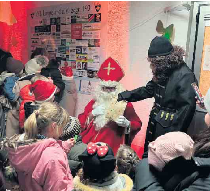
Für jedes Kind gab es eine Nikolaustüte

da und einige Kinder trugen etwas vor und begeisterten alle Anwesende. Beim gemeinsamen Tanzen und Singen hatten alle eine Menge Spaß, bevor die Kinder voller Erwartung ihre Nikolaustüten von dem selbigen entgegennahmen. Dann verließ der heilige Mann und der Knecht Ruprecht wieder den Sportplatz und der Abend klang in gemütlicher Runde aus.