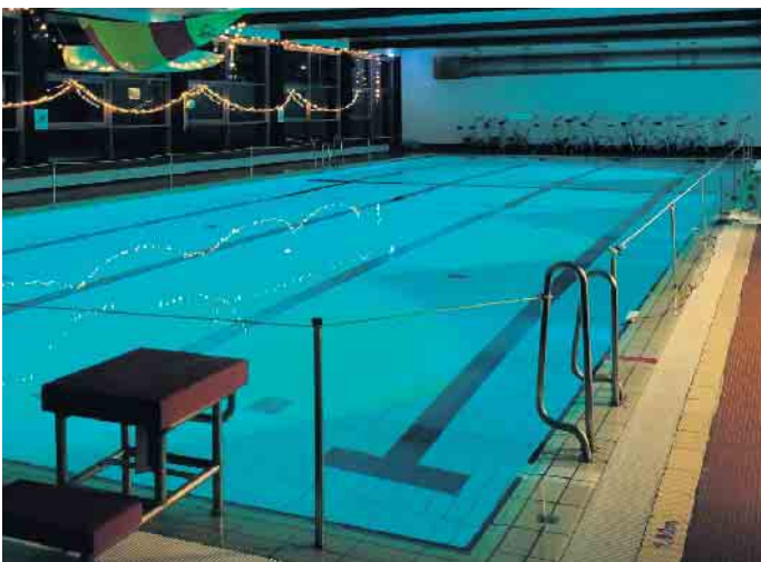
Eine angenehme Atmosphäre sorgt für einen guten Start in den Tag