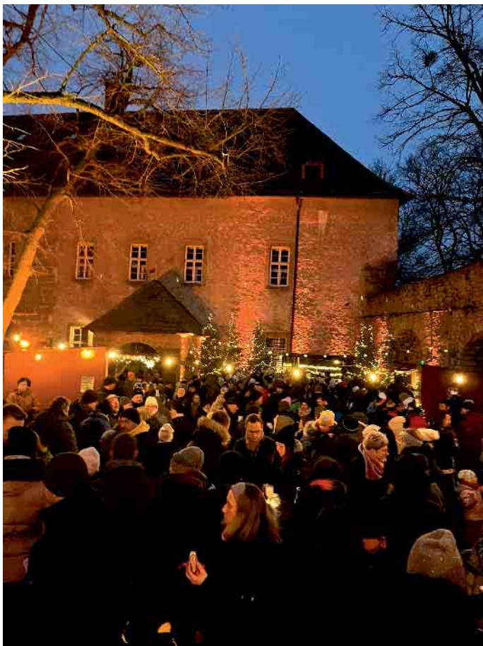
Das festliche Ambiente im Burginnenhof lud zum Verweilen ein.