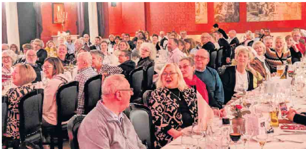
Entspannte Atmosphäre beim Theaterdinner.