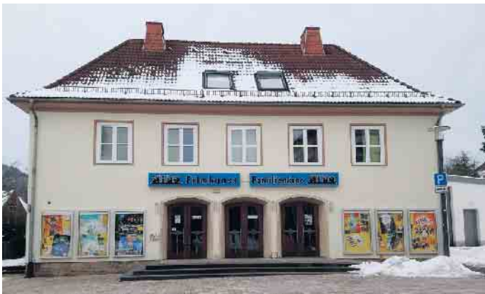
Das Kino Bad Driburg lädt wieder alle Filminteressierten ein.

Nach dem erfolgreichen Start im vergangenen Jahr findet das Seniorenkino seine Fortsetzung im neuen Jahr. Viele Filminteressier-