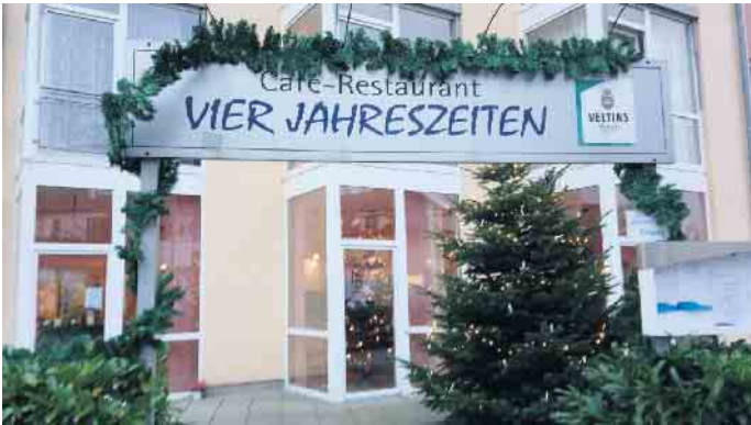
Im Café-Restaurant „Vier Jahreszeiten“ kann man den Kinobesuch bei Kaffee und Kuchen ausklingen lassen.

te freuen sich auf diesen Nachmittag. Am Donnerstag, 16. Januar, um 14 Uhr, wird im Bad Driburger Kino der Film „Toni