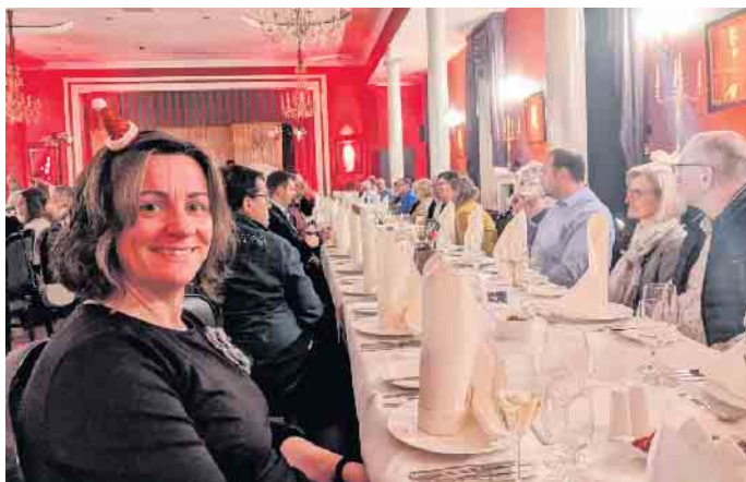
Die festlich gedeckte Tafel im Theatersaal

Das Schicksal will es, dass sich die beiden ausgerechnet auf diesem Campingplatz begegnen - ohne zu wissen, wer der andere ist. Schnell wird klar, dass diese explosive Mischung nicht lange gut gehen kann. Chaos und urkomische Verwicklungen sind vorprogrammiert.