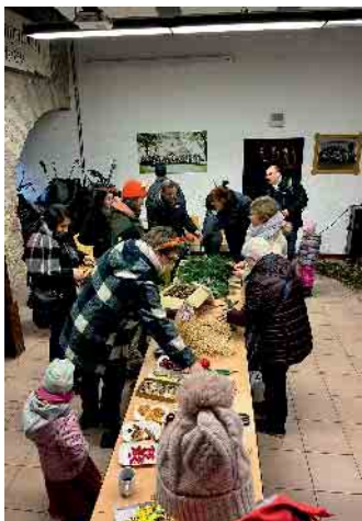
Beim Basteln mit den Kindern wurden Weidenkränze mit Deko liebevoll kreiert.