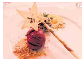
Dessert mit Lebkuchencreme mit Mandarinenkompott und Cassissorbet.

Dann wird das Zimmertheater seine brandneue Komödie „Campingfreuden“ präsentieren. Der Campingplatzbesitzer Hagen (Stefan Marx) lebt seinen Traum: Sommer, Sonne und ein idyllischer Campingplatz direkt am See - für ihn das Paradies auf Erden. Doch seine entspannte Welt wird mächtig durcheinander gebracht, als der skrupellose Baulöwe Sebastian von Falkenstein (Simon Hillebrand) auftaucht. Er hat mit dem malerischen Fleckchen Erde ganz andere, weniger idyllische Pläne.