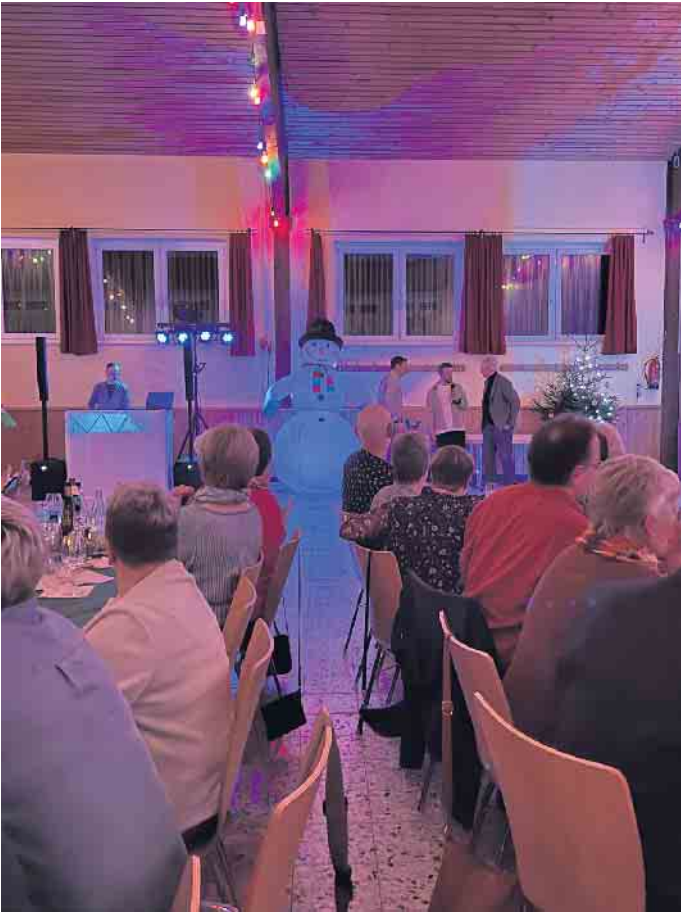
150 Gäste besuchten die diesjährige Weihnachtsfeier

es eine herzhafte Kartoffelsuppe, Bratwurst und natürlich wärmenden Glühwein. Der Baumverkauf war einmalmehr ein beliebter Treffpunkt in der Vorweihnachtszeit. An beiden Veranstaltungen wurde zu Gunsten der Aktion Lichtblicke ein Spendenschwein aufgestellt. Insgesamt konnten 580,38 Euro für in Not geratene Familien in NRW gesammelt werden.