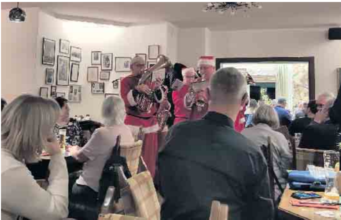
Musikalische Weihnachtsmänner des Musikvereins Sommersell