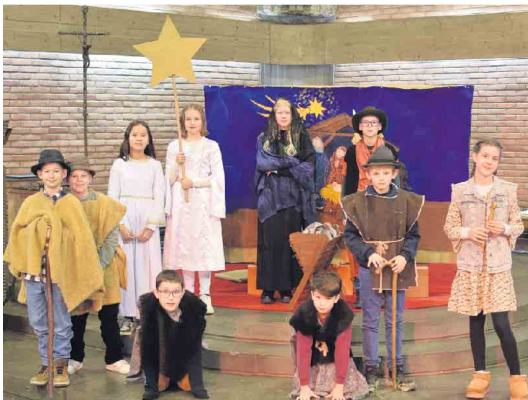
Die Hirten und ihre Schafe freuen sich mit dem Flötenmädchen, Maria und Josef sowie den Engeln über die Geburt Jesu.