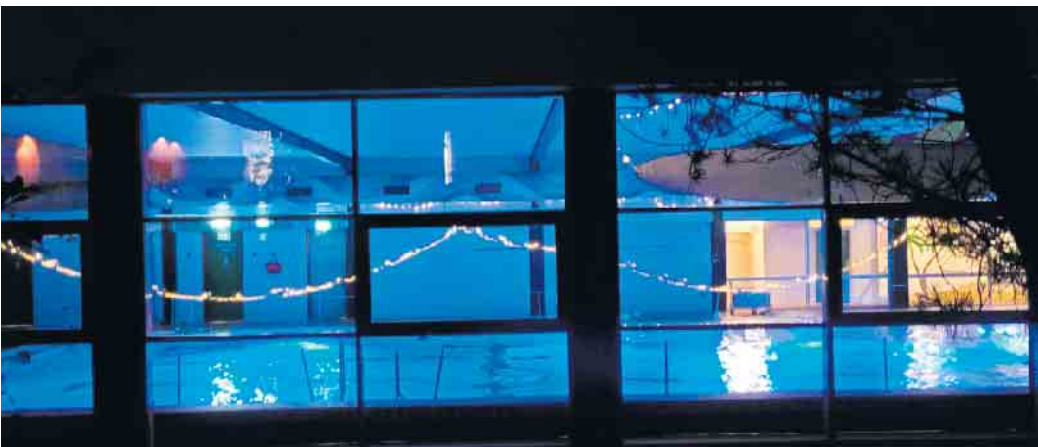
Stimmungsvolle Beleuchtung des Bad Driburger Hallenbads in der Weihnachtszeit