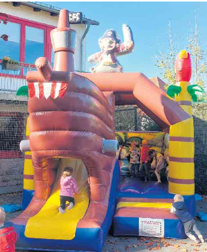
Die Hüpfburg war das Highlight am Kindertag

Zum 80-Jährigen stehen die Kinder im Mittelpunkt