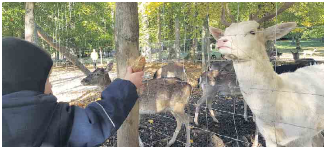
Die Erlebnis-Angebote starten wieder.

Auch dieses Mal sind wieder ganz neue Angebote dabei, wie zum Beispiel eine digitale Schnitzeljagd oder das Angebot ein „kleiner Moor-Forscher“ zu sein. Im Januar geht es zunächst los mit einer Alpaka-Schnupperstunde, einem Bewegungsangebot namens „Open Sunday“ und der be-