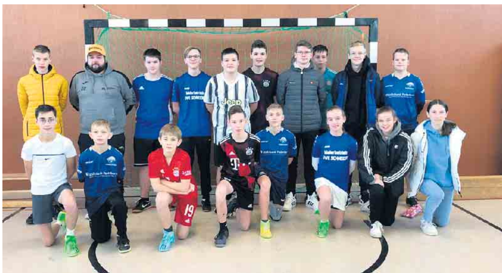
Die C-Jugend der JSG ist bereit für das neue Jahr.

Ein ereignisreiches Jahr neigt sich für die Spielerinnen und Spieler der C-Jugend der JSG Dringenberg dem Ende. Wir erinnern uns an die vielen sportlichen Ereignisse auf den Fußballplätzen des Kreises, das SC Paderborn Trainingslager und das tolle Beach-Soccer Turnier in Damp. An das gemeinsame Public Viewing zur WM in Qatar und die Teilnahme am FRAX-Treffen in Barsinghausen. Sportlich war das Jahr für die C-Jugend ein voller Erfolg. Die Mannschaft zeigte Stärke, Willenskraft und soziales Engagement. So auch bei der letzten Aktion des Jahres. Die Spielerinnen und Spieler bastelten winterliche Fensterdekorationen für die Seniorenwohnanlage „Haus am Steingarten“ in Willebadesen. Diese wurden dann den Bewohnern mit vielen Grüßen überreicht. Über die kleine Aufmerksamkeit freuten sie sich sehr.