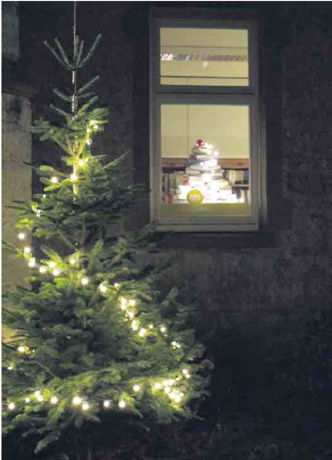
Im Fenster leuchtet der Bücherbaum.