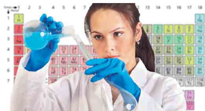
Ingenieure der chemischen Prozesstechnik und Umwelttechnik finden in der Kupferindustrie interessante Aufgabenfelder.