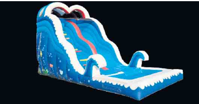
Riesen-Kahuna-Rutsche wird beim Kinderkarneval für Spaß sorgen.