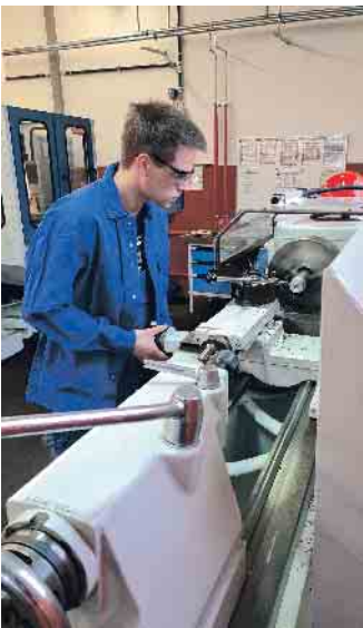
Mädchen und Jungen, die sich für den Werkstoff Kupfer interessieren, können zum Beispiel eine Ausbildung zum Zerspanungsmechaniker Drehtechnik (m/w/d) in Betracht ziehen.

Kupferbranche, die Ausbildungsplätze und offene Stellen auf ihren Unternehmenswebseiten anbieten.