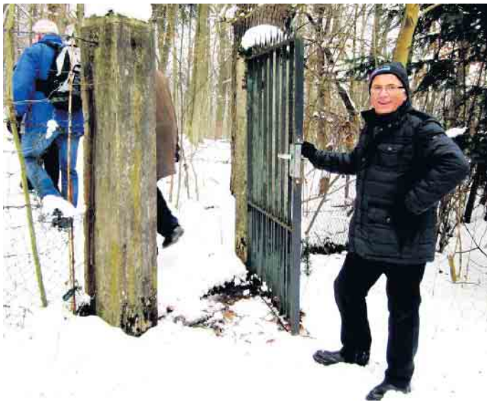
Ob es hier lang geht?

lerhaus geht es auf den spannenden Weg. Gäste sind wie immer herzlich willkommen, auch zur Abschlussfeier am Siedlerhaus gegen 17 Uhr. Es sickerte durch, dass vom Siedlerzauber noch Glühwein übrig sein soll. Vielleicht gibt es auch noch anderes Herzhaftes. Wer mit wandert, wird sicherlich überrascht sein, wo sich überall noch Zwieten und andere Durchgänge in Bad Driburg finden. Wer kennt schon die Burgsicht, und damit ist nicht die Iburg gemeint. Oder die Schufazwiete? Na, neugierig geworden? Dann sehen wir uns am 13. Januar um 14.30 Uhr am Siedlerhaus. Hermann Klahold