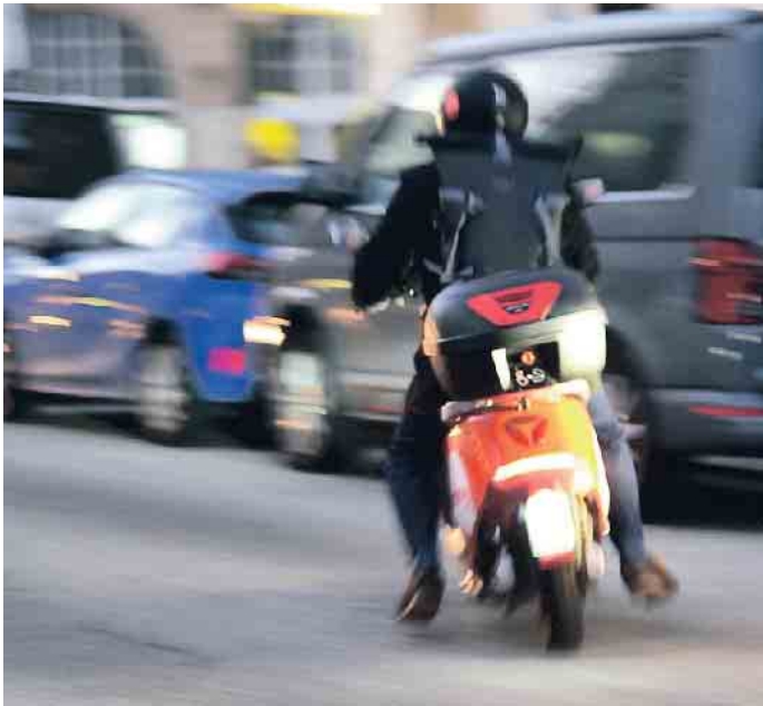
Kurvenfahren sollte man auf den Roller schon können.

zum Sturz“, sagt der TÜV Süd-Motorradexperte. Besonders glattegefährdete Bereiche in der Stadt sind Kreuzungen und Ampeln, weil dort besonders viele Straßenmarkierungen sind. Bei Kanaldeckeln sollte der Rollerfahrer besondere Vorsicht walten lassen. Geht's raus aus dem Zentrum, besonders darauf achten, die Straße vorab auf Verunreinigungen zu „untersuchen“. Vorsicht bei Kurvenfahrten: Auch für den kleinen Roller gilt es, sich niemals bei Kurvenfahrten auf die gegenseitige Fahrbahn zu „lehnen“. Anziehen: Selbst bei der Kleidung ist Vorbereitung angesagt. Sie sollte Protektoren haben und Abriebschutz bieten. Helm und Handschuhe sind bei der Rollermiete meist mit dabei. Für Roller besteht Helmpflicht. Wird ein Helm mit angeboten, auf jeden Fall die Größe checken und sichergehen, dass das Modell nach ECE R 22/05 oder ab 2024 mit Zusatz 06 geprüft ist. Der Helm muss mit dem entsprechenden Label gekennzeichnet sein. Eine mitgebrachte Kopfschale sorgt für hygienische Verhältnisse. Noch besser ist es allerdings, einen eigenen Helm zu verwenden. (mid/ak-o)