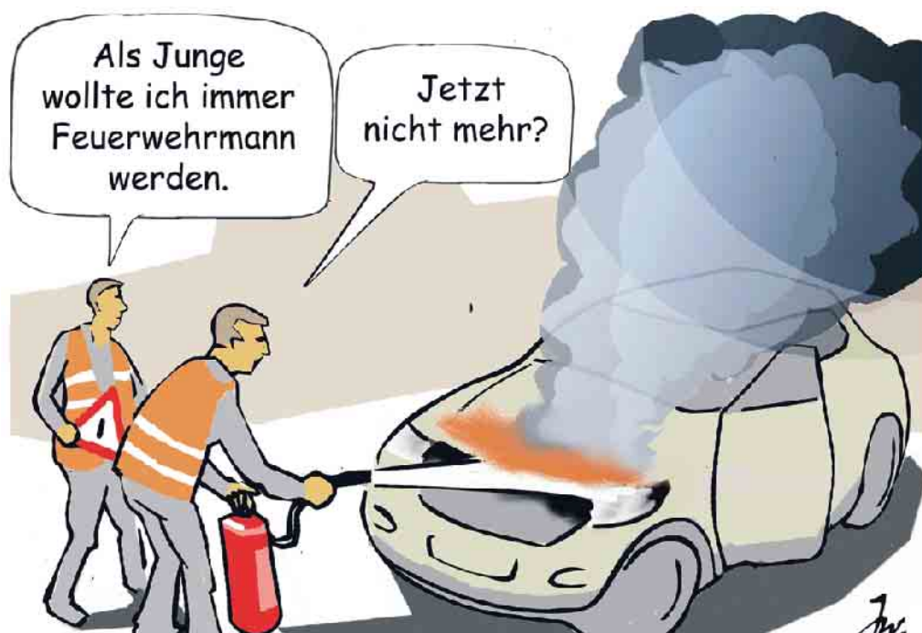
Ein Brandherd in einem Kfz kann sich durch auslaufenden Treibstoff sehr schnell ausbreiten.

Filmfans kennen das: Ein Auto kommt von der Fahrbahn ab, überschlägt sich und explodiert - meist mit einem fulminanten Feuerball. Was so für angenehmen Thrill sorgt, hat aber leider auch eine negative Komponente, wie Feuerwehrleute zu berichten wissen. Denn demnach trauen sich Ersthelfer an einem Unfallort oft nicht, eine Person aus einem brennenden Fahrzeug zu retten, aus Angst, dieses könnte wie im Film explodieren. Dabei kann ein Auto normalerweise gar nicht in die Luft fliegen, wie die Fachleute versichern. Denn der Tank eines Kraftfahrzeugs verfügt über eine Lüftungsvorrichtung, die verhindert, dass Druck im Tank entsteht. Somit könne auch keine Explosion hervorgerufen werden, beschwichtigen Brandschutzexperten. Demnach sind lediglich kleinere Explosionen denkbar, die nur durch einen Er-