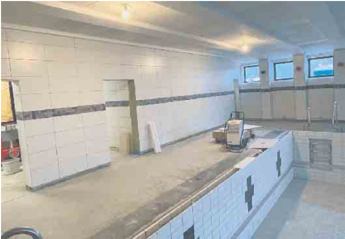
Die ersten Wandflächen im Schwimmbad und den Duschräumen sind bereits gefliest.

musste die gesamte Anlage auch noch einige Wochen „hochgefahren“ werden. Eine Nutzung des Schwimmbades ist damit sicher nicht vor April/Mai zu erwarten. Dann müssten aber jetzt auch endlich die restlichen Arbeiten und die Inbetriebnahme gut laufen. Es ist sehr bedauerlich, dass alle Schwimmer noch weiter auf die Fertigstellung warten müssen. Aber angesichts der weiteren Schließungen von Bädern in der Umgebung können wir froh sein, dass die Gemeinde Dahlem nach der Sanierung auch in den nächsten Jahrzehnten ein tolles Schwimmbad haben wird.