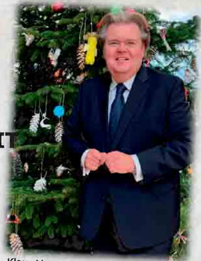
Klaus Vossemer MdL

DIE CDU WÜNSCHT IHNEN EINE GESEGNETE WEIHNACHTSZEIT UND EIN GUTES NEUES JAHR.