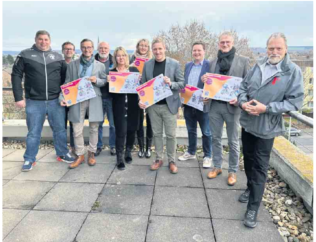
Mit einer „Inklusiven Sportwoche“ wird der Kreis Euskirchen im kommenden Jahr ein deutliches Signal für mehr gesellschaftliche Teilhabe von Menschen mit Behinderung setzen. Im Kreishaus stellten Landrat Markus Ramers, die Kooperationspartner und Vereinsvertreter jetzt die ersten Ideen und Pläne vor.

Auf der Homepage des Kreises Euskirchen werden die zielgruppenspezifischen Angebote regelmäßig aktualisiert und beworben. Auf diese Weise ist es Interessierten schon jetzt möglich, Kontakte herzustellen und eventuell weitere Kooperationen entstehen zu lassen. Markus Strauch, Geschäftsfüh-