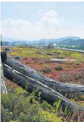
Die Begrünung von Flachdächern trägt zu einem besseren Mikroklima bei.

Unter www.nutzedeindach.de gibt es viele weitere Informationen dazu. Klimaschutz auf dem Dach lässt sich ebenfalls verwirklichen, indem man auf erneuerbare Energie setzt. Solaranlagen sind nicht nur auf Flach-, sondern auch auf Steildächern eine gute Idee, um zur Energiewende beizutragen und gleichzeitig das Klima zu schützen. (djd)