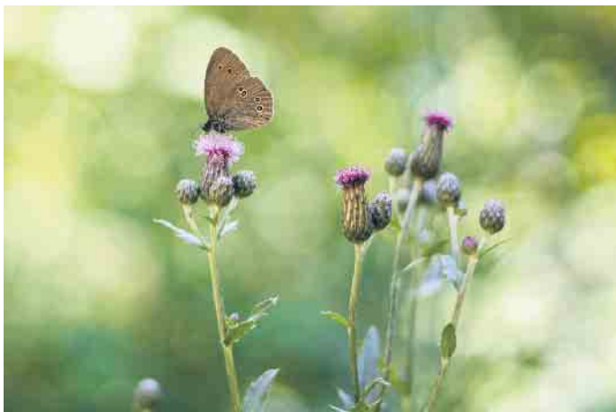
Wildblumen dekorieren die Baumgräber in einem Bestattungswald und locken natürliche Gäste an.

Wie Angehörige und Freunde im Bestattungswald trauern und gedenken