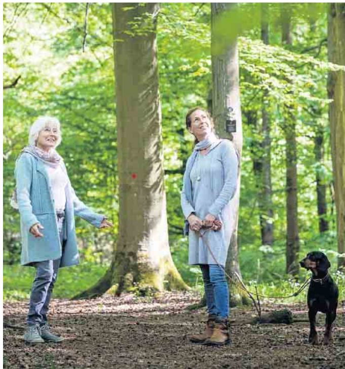
Viele Hinterbliebene lassen ihren Erinnerungen gern bei einem Spaziergang durch den Bestattungswald freien Lauf.

Manche nutzen den Baum im Bestattungswald auch als stummen Gesprächspartner, berühren und umarmen ihn oder lesen ihm einen selbst verfassten Brief an den Verstorbenen vor. Kinder finden die Idee, diesem Menschen eine Umarmung durch den Baum zu schicken, oft sehr nachvollziehbar. (djd)