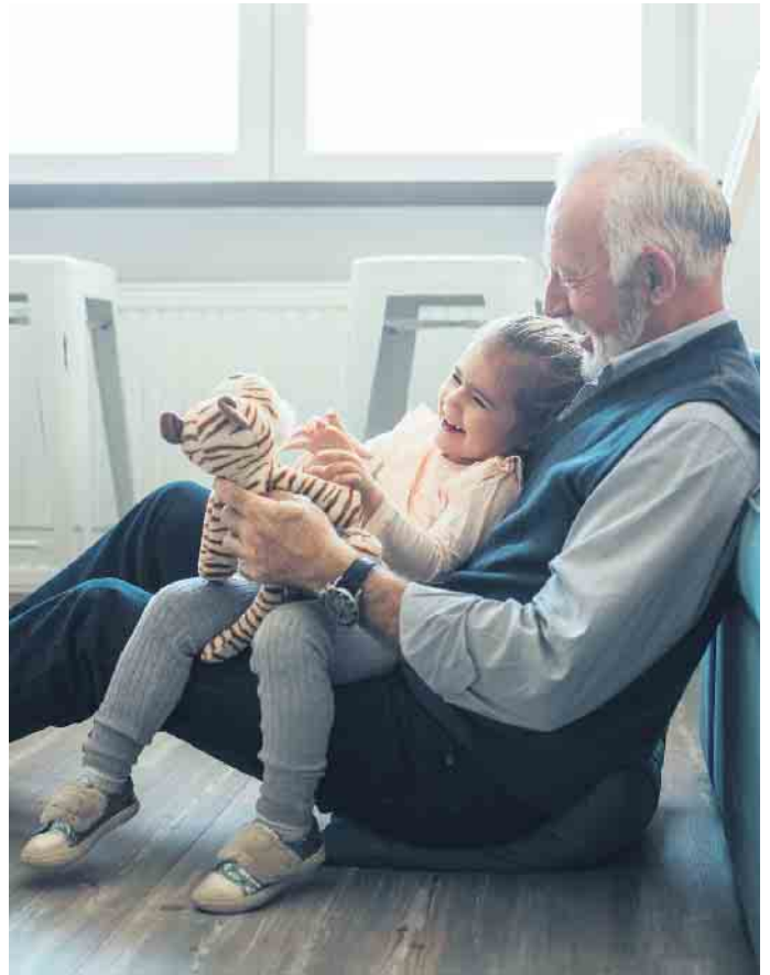
Die Gesellschaft wird immer individueller, das schlägt sich auch in den neuen Formen der Bestattungskultur nieder.

Inzwischen ist die Asche nicht mehr die einzige Kohlenstoffquelle, die für die Herstellung eines Erinnerungsdiamanten genutzt werden kann. Die Alternative sind Erinnerungsdiamanten aus Haaren. Auf sie kann man zurückgreifen, wenn Erinnerungsobjekte aus Kremationsasche aus sozialen, rechtli-