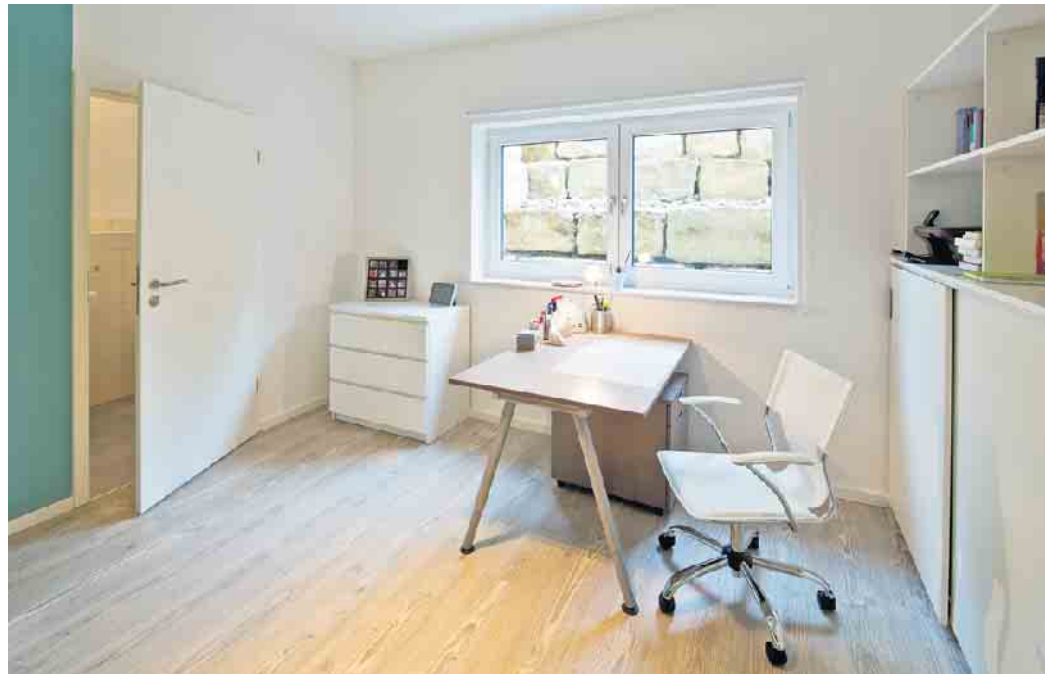
„Wohnkeller stehen oberirdischen Räumen heute in puncto Wohnkomfort in nichts mehr nach“.

Nirgends ist die Haustechnik besser aufgehoben als im Keller - wenn man denn einen Keller hat. Dann werden Nutzfläche und Wohnfläche schon bei der Kellerplanung so kalkuliert, dass die Haustechnik an den dafür besten Platz kommt. Birgit Scheer gibt