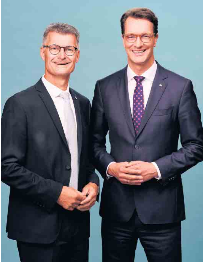
Bürgermeister Jan Lembach traf Ministerpräsident Hendrik Wüst im Sommer in Düsseldorf.