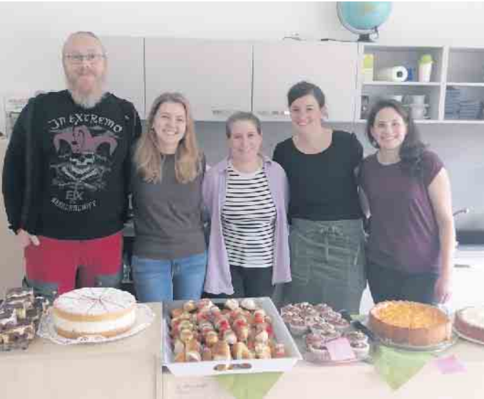
Der Elternbeirat sorgte am Infotag für eine tolle Verpflegung.