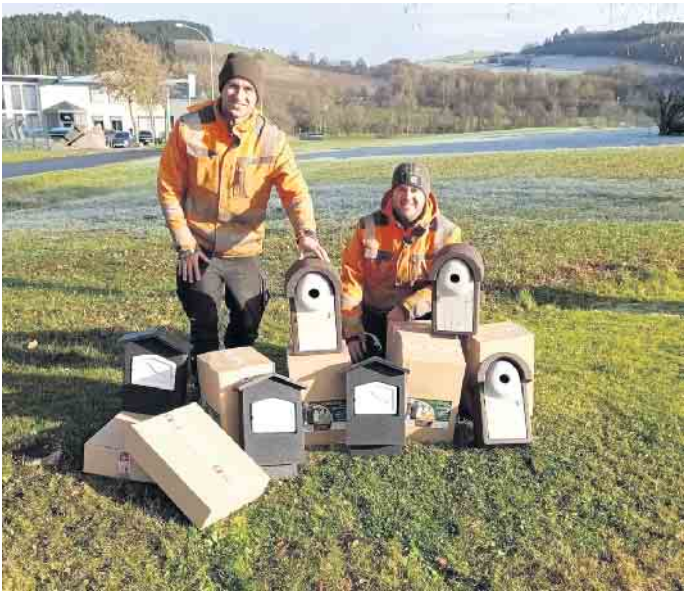
Bis zur nächsten Brutzeit werden vom Bauhof in den kommunalen Grünflächen 30 Fledermaus-Kästen, 15 Vogel-Nistkästen und 5 Florfliegenquartiere aufgestellt.

Die Pflege der öffentlichen Grünflächen wird in Deutschland seit einigen Jahren weniger intensiv betrieben, als in der Vergangenheit. Dies erfolgt vor allem aus ökologischen Gründen und unter veränderten gesetzlichen Vorgaben. Mit einer extensiveren Pflege der vielen öffentlichen Grünflächen kann die Vielfalt und Anzahl bei Tier- und Pflanzenarten deutlich erhöht werden. Linienhafte Strukturen wie Wegränder können auch vernetzende Elemente in der Landschaft werden. Auch der Bauhof der Gemeinde Dahlem pflegt bereits die kommunalen Flächen teilweise weniger intensiv und teilweise auch später im Jahr, um diese positiven ökologischen Effekte zu fördern. Teilweise können dadurch auch Aufwand und Kosten reduziert werden.