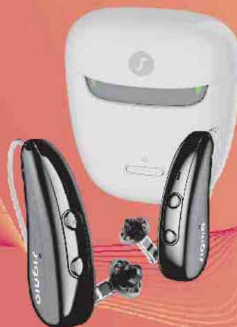
Pure Charge&Go IX