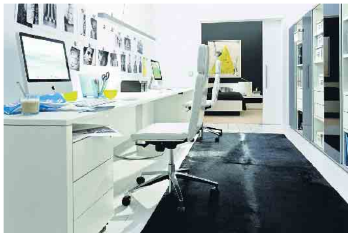
Rückenfreundliches Arbeiten bringt im Homeoffice und im Büro mehrere Anforderungen bei der Möbelauswahl mit sich.

Zur Standardausstattung der meisten Büro-Arbeitsplätze zählt der höhenverstellbare Schreibtischstuhl. Aber auch höhenverstellbare Schreibtische sind verstärkt im Kommen und besonders ergonomisch, denn Arbeiten im Stehen ist noch rückenfreundlicher als im optimierten Sitzen. Die optimale Sitzposition ist erreicht, wenn die Knie 90 Grad oder etwas mehr abgewinkelt sind, während die Füße gerade auf dem Boden stehen. Der Winkel zwischen Oberkörper und Oberschenkel sollte dabei mehr als 90 Grad betragen. Eine bewegliche Rückenlehne und Sitzfläche kommen