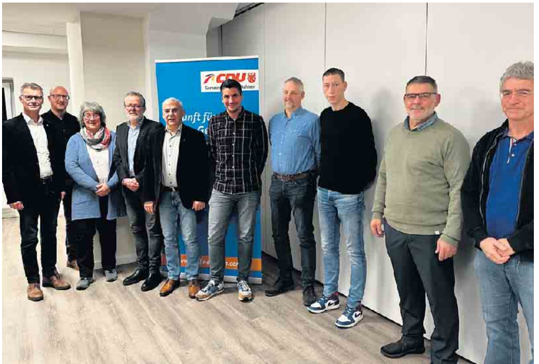
Der neu gewählte Vorstand des CDU-Gemeindeverbandes Dahlem