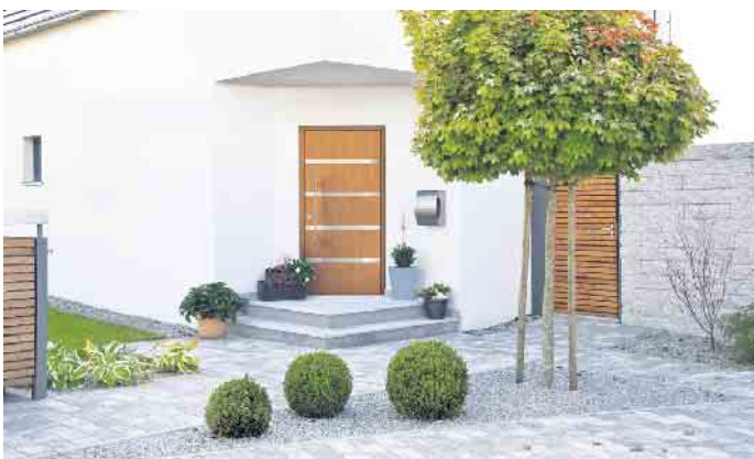
Natürlich anmutende Tür in modernem Design.

gewählte Haustür ihren Dienst lange und zuverlässig verrichten wird, ohne dass die Themen Ästhetik und Komfort zu kurz kommen“, schließt Lange. Weitere Informationen unter fenster-können-mehr.de (VFF)