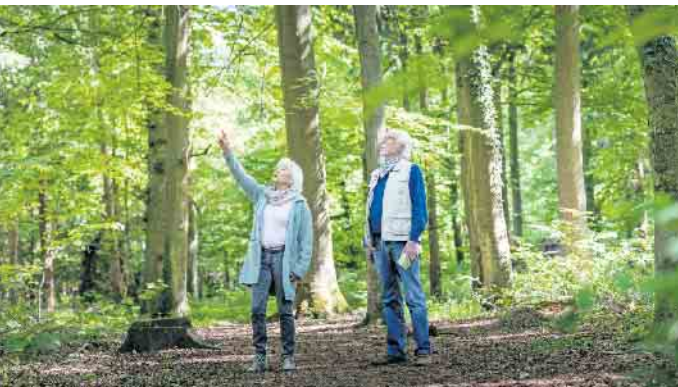
Einen Bestattungsbaum kann man sich bei einem Waldspaziergang selbst aussuchen. Die Alternative ist ein virtueller Rundgang.

Bei realen oder virtuellen Waldrundgängen den passenden Bestattungsbaum finden