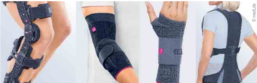
Direktversorgung von Bandagen und Orthesen