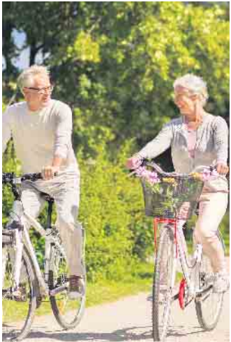
Ein richtig geformter Fahrradsattel passt zur individuellen Sitzhaltung des jeweiligen Fahrers oder der jeweiligen Fahrerin.

es ein bundesweites Verzeichnis der Fachhändler und Sanitätshäuser, die diesen Service anbieten. Diese stellen nicht nur neue Räder ein, auch mit einem gebrauchten Bike kann man das Fachgeschäft aufsuchen. (DJD)