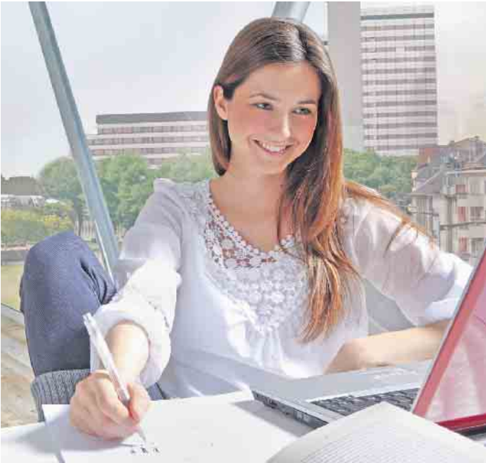
Effektiver Lärmschutz kann zu einer besseren Konzentration im Home-office beitragen.

Störende Geräusche mit Lärmschutzglas abschirmen und die Wohnqualität verbessern