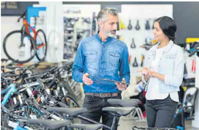
Beim Fahrrad stößt der Onlinekauf an Grenzen: Eine gute Beratung im Fachhandel ist durch nichts zu ersetzen.