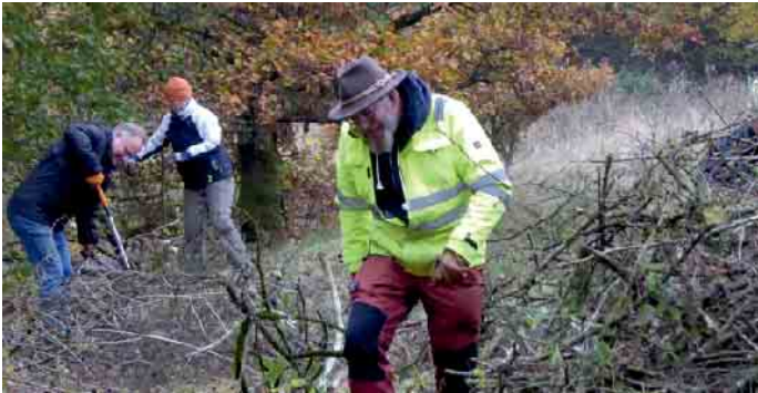
Ein Trupp des Bergwaldprojektes e.V. bei der anstrengenden Entbuschungsarbeit.

Das Bergwaldprojekt e.V. entbuscht für „LIFE helle Eifeltäler“ besonders sensible und unzugängliche Schutzgebiete. In Naturschutzgebieten, die für sogenannte Offenlandarten ausgewiesen wurden, kann die fehlende Bewirtschaftung zu einer Verbuschung führen: Pflanzen und Tiere, die auf volle Lichteinstrahlung angewiesen sind, werden durch die auf-