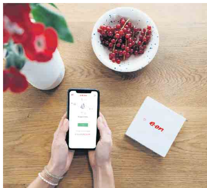
Mehr Transparenz über die eigene Stromerzeugung und den Verbrauch: Moderne Technologie macht es möglich.