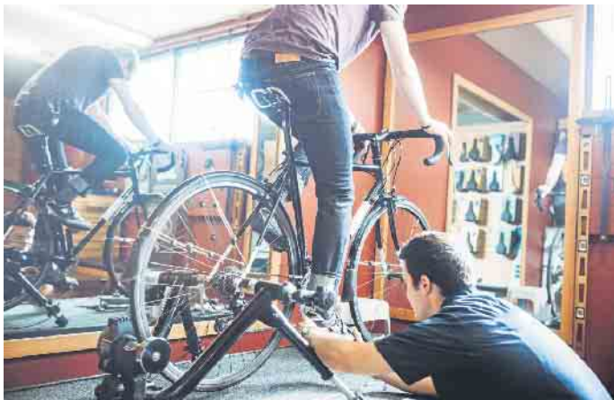
Das Rad besitzt die Kontaktstellen Hintern/Sitz, Hände/Griff und Füße/Pedale. Alle drei sollten beim Bikefitting an den Menschen und seine anatomischen Gegebenheiten angepasst werden.