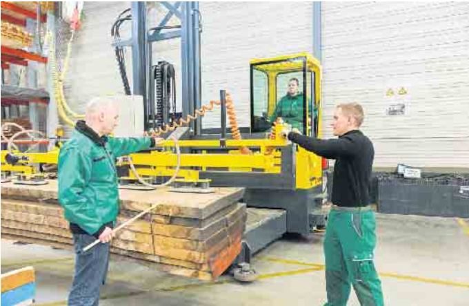
Ob im kaufmännischen Bereich, in der Verarbeitung oder der Logistik: Der Holzfachhandel bietet attraktive Ausbildungs- und Berufsperspektiven.

Vielfältige Ausbildungs- und Karrierechancen im örtlichen Fachhandel