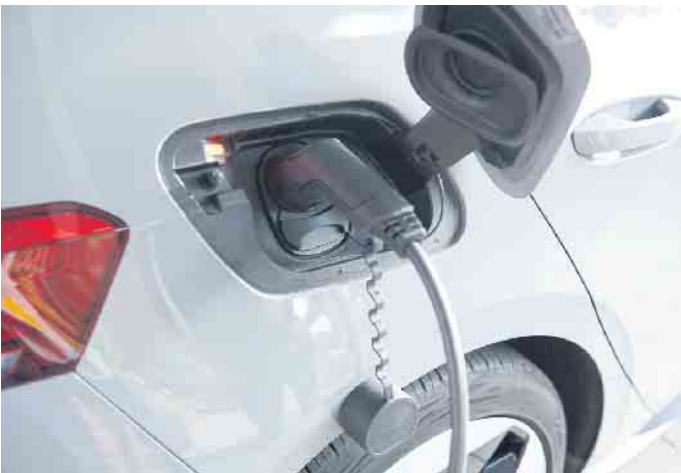
Anschluss in beide Richtungen. Beim bidirektionalen Laden dient die Batterie des E-Autos als zusätzlicher Energiespeicher für den Haushalt.

Die Batterie des E-Autos hat großes Potenzial, künftig nicht nur für den Fahrbetrieb genutzt zu werden, sondern auch das eigene Zuhause mit Strom zu versorgen. Fachleute sprechen vom sogenannten bidirektionalen Laden, also Laden in beide Richtungen: Strom fließt nicht nur in den Fahrzeugakku, sondern bei Bedarf auch wieder zurück ins Hausnetz. Was aktuell noch wie Zukunftsmusik klingt, kann E-Auto-Fahrern schon bald einen attraktiven Zusatznutzen bieten. Solarstrom speichern und effektiv nutzen