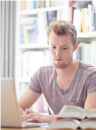
Für eine berufliche Weiterbildung muss man nicht unbedingt Präsenztermine wahrnehmen. Die Ausbildung für Ausbilder beispielsweise erfolgt online.

Inhaltlich lernen die Teilnehmerinnen und Teilnehmer, wie der Ablauf einer betrieblichen Ausbildung geregelt ist. Nach der bestandenen Prüfung können die neuen Ausbilder bei der Einstellung von Azubis organisatorisch alles übernehmen, was nötig ist. Sie sind außerdem in der Lage, die Auszubildenden während ihrer gesamten Zeit sowohl fachlich als auch didaktisch zu betreuen, und wissen, wie sie die Nachwuchskräfte zum erfolgreichen Abschluss führen. Der Fernlehrgang dauert in der Regel 3 Monate inklusive Lernpausen. Für den kostenpflichtigen Lehrgang gibt es verschiedene finanzielle Fördermöglichkeiten, etwa durch die sogenannte Bildungsprämie oder eine Förderung nach „QualiScheck Rheinland-Pfalz“. (djd)