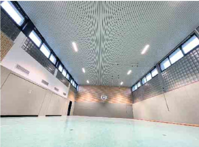
Die energetisch sanierte Turnhalle Schmidtheim: Neues Licht, neue Wärme, neue Fensterlüftung.

Ähnlich wie in der Dahlemer Turnhalle ist auch die Halle in der Heiz- und Lichttechnik erfolgreich saniert worden. In der neuen Hallendecke sind eine Dämmung, LED-Beleuchtung und Heizpaneele verbaut. Die Oberlicht-Fenster sorgen jetzt elektronisch gesteuert für die richtige Belüftung. Neben der Bedienbarkeit ist auch die Energieeffizienz deutlich verbessert. Die wartungs- und störungsanfällige Lüftungsanlage hat ausgedient. Seit vergangener Woche kann die Halle wieder genutzt werden. Damit ist das Schmidtheimer Sportzentrum nun fast vollständig saniert und modernisiert: Durch die LED-Flutlichtanlage können die zahlreichen SG-Fußballmannschaften schon seit 4 Jahren auch in der dunkleren Jahreszeit durchgehend auf dem Kunstrasenplatz trainieren und spielen. Die Umkleidekabinen, Duschen und die WC-Anlagen wurden