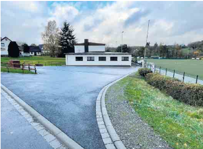
Der Parkplatz am Sportplatz ist fertig asphaltiert.

schon vor einigen Jahren mit umfangreicher ehrenamtlicher örtlicher Unterstützung renoviert. Nach dem Hochwasserschaden sind die Heizung und Teile der elektronischen Versorgung erneuert worden. Anschließend wurden alle Fenster und Türen ausgetauscht, die Außenfassade gedämmt und verputzt und der Übergang von Mauerwerk zum Erdreich gerichtet. Und in diesem Jahr sind zunächst Hochwasserschutz-Maßnahmen im Umfeld der Anlage umgesetzt und der Parkplatz an der Halle asphaltiert worden. Derzeit läuft noch der Ausbau des Kiosk auf der Tribüne, aus dem die Besucher bei den Fußball-Heimspielen immer mit tollen Angeboten zum Essen und Trinken versorgt werden. Der Ausbau und die Vergrößerung des oberen Parkplatz für Sportanlage und Generationenpark wird derzeit geplant und wird mittelfristig angegangen.