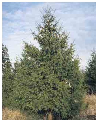
Die Bäume werden erst kurz vor dem Verkauf frisch geschlagen.

Wer sich über die Tätigkeiten und Inhalte des Projekts „Arbeit Teilen mit Menschen mit Behinderung“ informieren möchte, kann gerne dienstags, mittwochs und donnerstags, in der Zeit von 9 bis 12 Uhr in unserem Möbellager, Karl-Kaufmann-Straße 8 in Schleiden vorbeischaun. Wir freuen uns auf Ihren Besuch!