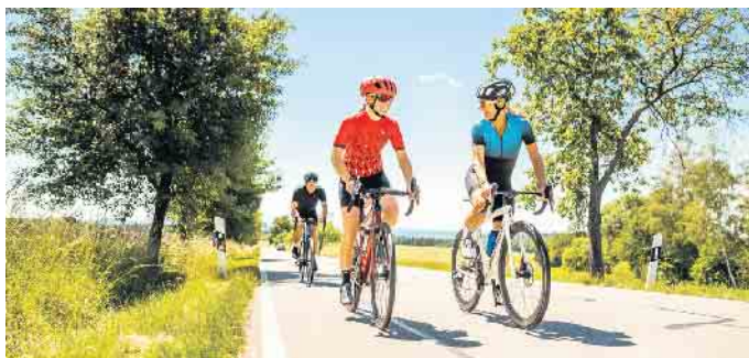
Alles Typsache: Für sportliches Fahren mit hoher Geschwindigkeit ist ein Rennrad das Richtige.

über die Verwendung im Klaren zu sein: Möchte man das Fahrrad im Alltag oder eher sportlich nutzen? Je nach Einsatzzweck gibt es unterschiedliche Fahrradtypen. Sport, Einkauf oder Arbeitsweg Für sportliche Aktivitäten abseits der Straße empfiehlt sich aufgrund der guten Geländegängigkeit und Federung ein Mountainbike. Wer hingegen lange Strecken mit höherer Geschwindigkeit fahren möchte, sollte sich ein Rennrad zulegen. Es ist leicht und auch dank der sportlichen Sitzposition besonders aerodynamisch. Eine