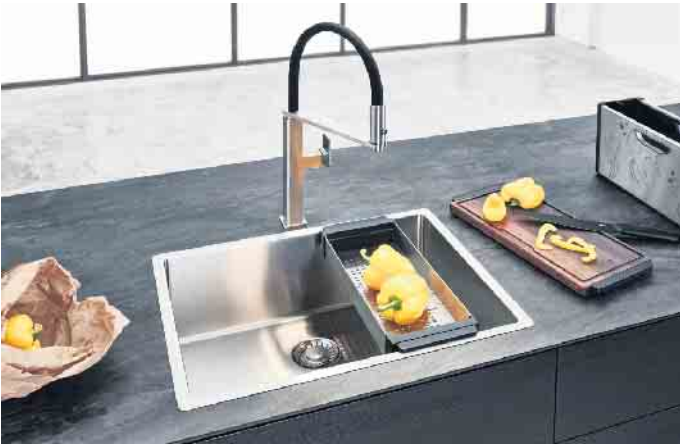
Nach ihrem Einsatz kommen Abtropfbecken, Messerblock, Schneidbretter und Abtropfgitter sicher und nahezu unsichtbar verstaut wieder zurück in die Design-Box. Die mit höchster Präzision gefertigte Edelstahlspüle wirkt mit ihrem filigranen, nur 6 mm schmalen Rand elegant und zeitlos.

Lebensmittel stellt man sie auf der Arbeitsplatte ab. Wird das Zubehör nicht mehr benötigt, kommt alles wieder in die Box und die dann wiederum ins Spülbecken. Komfortabel und praktisch sind auch die neuen Einlegeelemente. Im Nu ist damit eine zweite Ebene im Spülbecken schnell, einfach und flexibel realisiert: z.B. anhand einer Matte mit breiten Metallstegen, die jeweils an ihren Enden in Silikon eingefasst sind. Darauf findet alles sicheren Halt. Wird die Matte nicht mehr benötigt, lässt sie sich mit einem Handgriff aus dem Spülbecken herausnehmen und auf der Arbeitsplatte als zusätzliche mobile Abstellfläche für Gläser, Geschirr, Töpfe & Co. nutzen. Andere Spülenmodelle sind mit einer integrierten kleinen Stufe im Becken ausgestattet. Sie ermöglicht das Einhängen und Auflegen diverser Zubehörelemente wie z.B. Funktionsschalen und Gastronorm-Behälter. Extragroße oder extratiefe Becken - und das gilt selbst bei so manchen raumsparenden Spülenmodellen