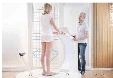
3D-Vermessung für Kompressionsstrümpfe und orthop. Einlagen